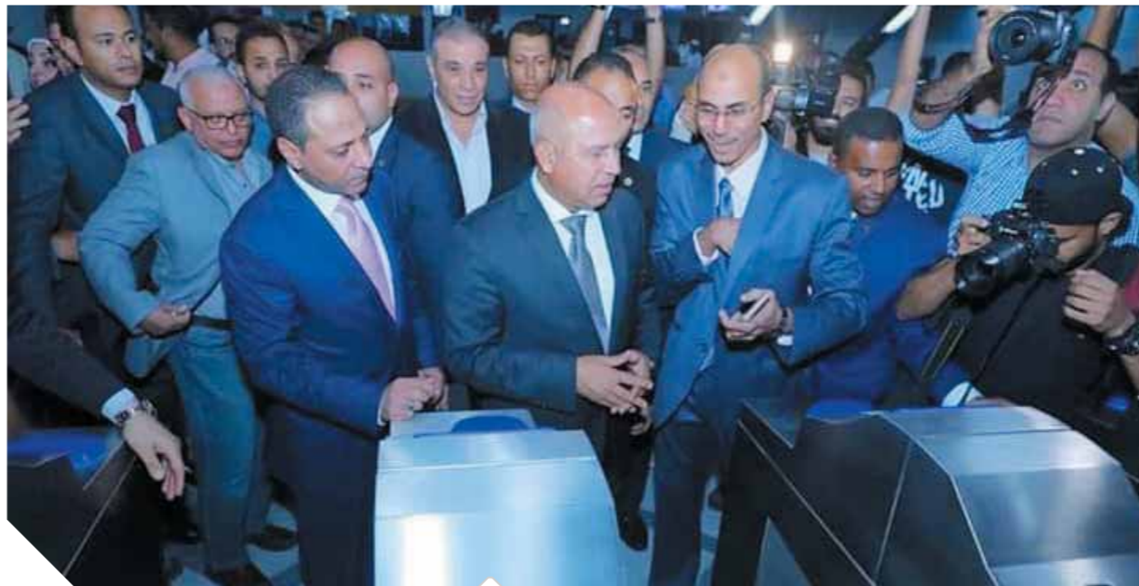
وزير النقل أثناء افتتاحه محطة هليوبوليس

كتب. محمود شاكر: دشّن الفريق مهندس كامل الوزير - وزير النقل تشغيل محطة هليوبوليس بالجزء الأول من المرحلة الرابعة من الخط الثالث لمترو أنفاق القاهرة الكبرى للركاب بحضور رئيس قيادات الهيئة القومية للأنفاق ورئيس قيادات الشركة المصرية لإدارة وتشغيل المترو وروّساء وقيادات الشركات المنفذة.