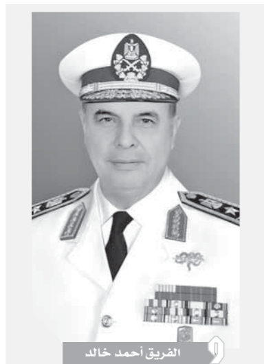
الفريق أحمد خالد

جاء ذلك خلال وقائع المؤتمر الصحفي الذي عقد بمناسبة الاحتفال بالذكرى الثانية والخمسين للقوات البحرية الذي يتوكل مع الدور البطولي لرجال البحرية المصرية في إغراق المدمرة إيلات عام ١٩٦٧ وتنفيذ العديد من الأعمال الطويلة خلال معارك الاستنزاف وحرب أكتوبر، التي غيرت مفاهيم واستراتيجيات الحروب البحرية الحديثة. وأشار إلى جهود القوات البحرية في تأمين السواحل المصرية بالبحرين المتوسط والأحمر على مدار الـ٤٦ ساعة، تحقيق مفهوم الأمن البحري الشامل في مناطق عمل القوات البحرية على كل الاتجاهات الاستراتيجية والفرع الرئيسية والجيش والموائل والخطوط الملاحية والمجرى الملاحي لقناة السويس ومناطق انتظار السفن، ومكافحة أعمال التسلل والتهرب والهجرة غير الشرعية والقيام بأعمال البحث والإنقاذ لحماية أمن وسلامة الوطن والمواطنين. وأكد الفريق أحمد خالد حرص القيادة السياسية والقيادة العامة للقوات المسلحة على إعادة بناء وتطوير القوات البحرية، لتتصّل بمطالب الدولة المصرية لحماية حدودها ومصالحها وترواتها وأجيالها البحرية لسنوات وعقد طويلة، وتكون قادرة على مواجهة كل التحديات التي تواجهها في مناطق عملها الاستراتيجية الشاملة للقوات المسلحة، مع الاستمرار في برامج تصنيع وحدات بحرية من مختلف الحمولات والاستخدامات بأيدٍ وسواعد وعقول مصرية طبقاً لتخطيط دقيق يراعي عوامل التطوير والجودة مع زمن قياسي للتنفيذ، في ظل النهضة الشاملة التي تشهدها مصرنا الغالية في كل المجالات.