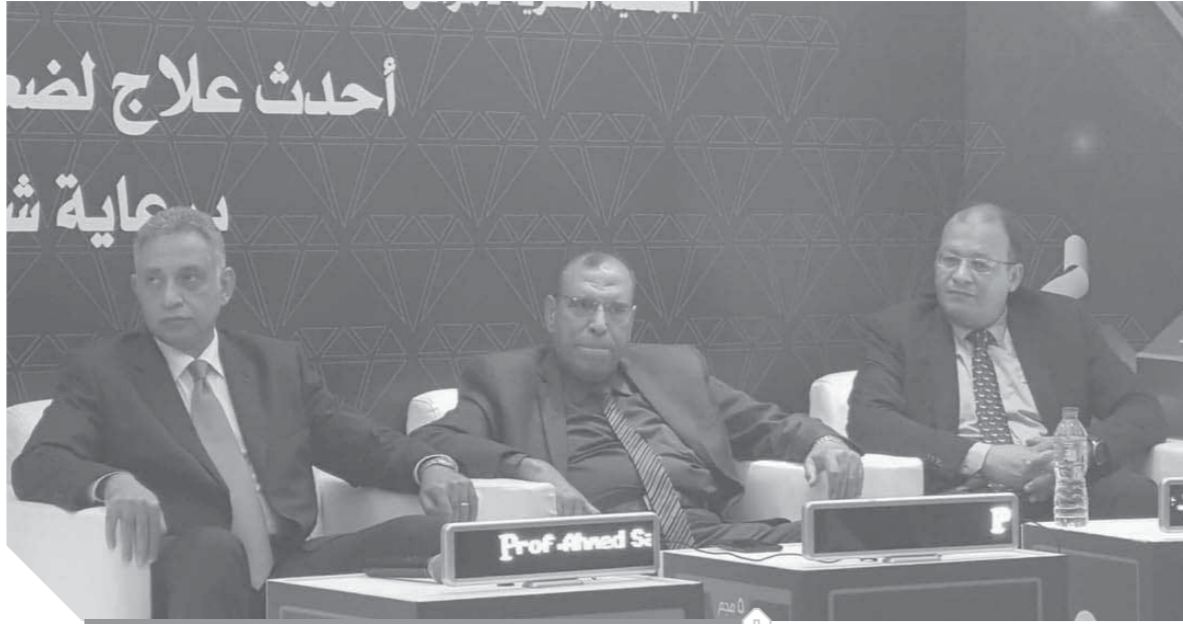
المؤتمر يناقش العلاج الجديد للضعف الجنسي وتضخم البروستاتا