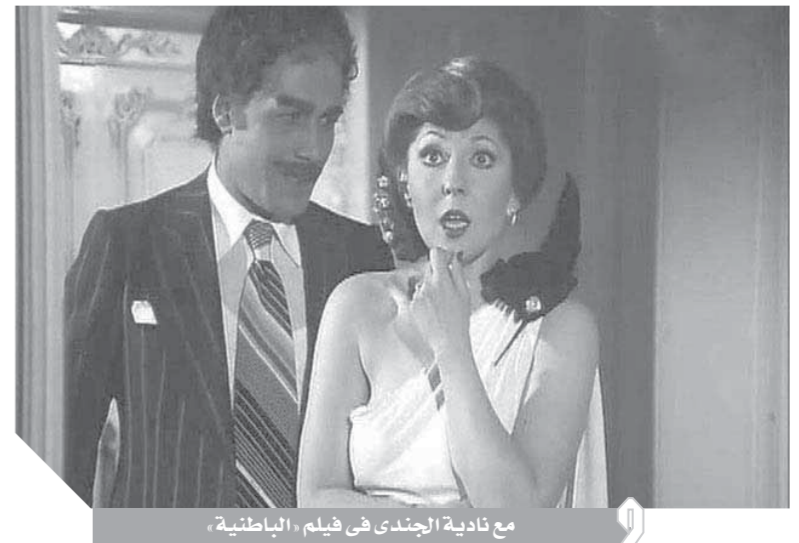
مع نادية الجندى فى فيلم «الباطنية»

شوقى وعماد حمدى، ونجح فى اقتناع كل من شاهد الفيلم بأنه تاجر مخدرات يحق ليثبت أنه فنان من طراز فريد.