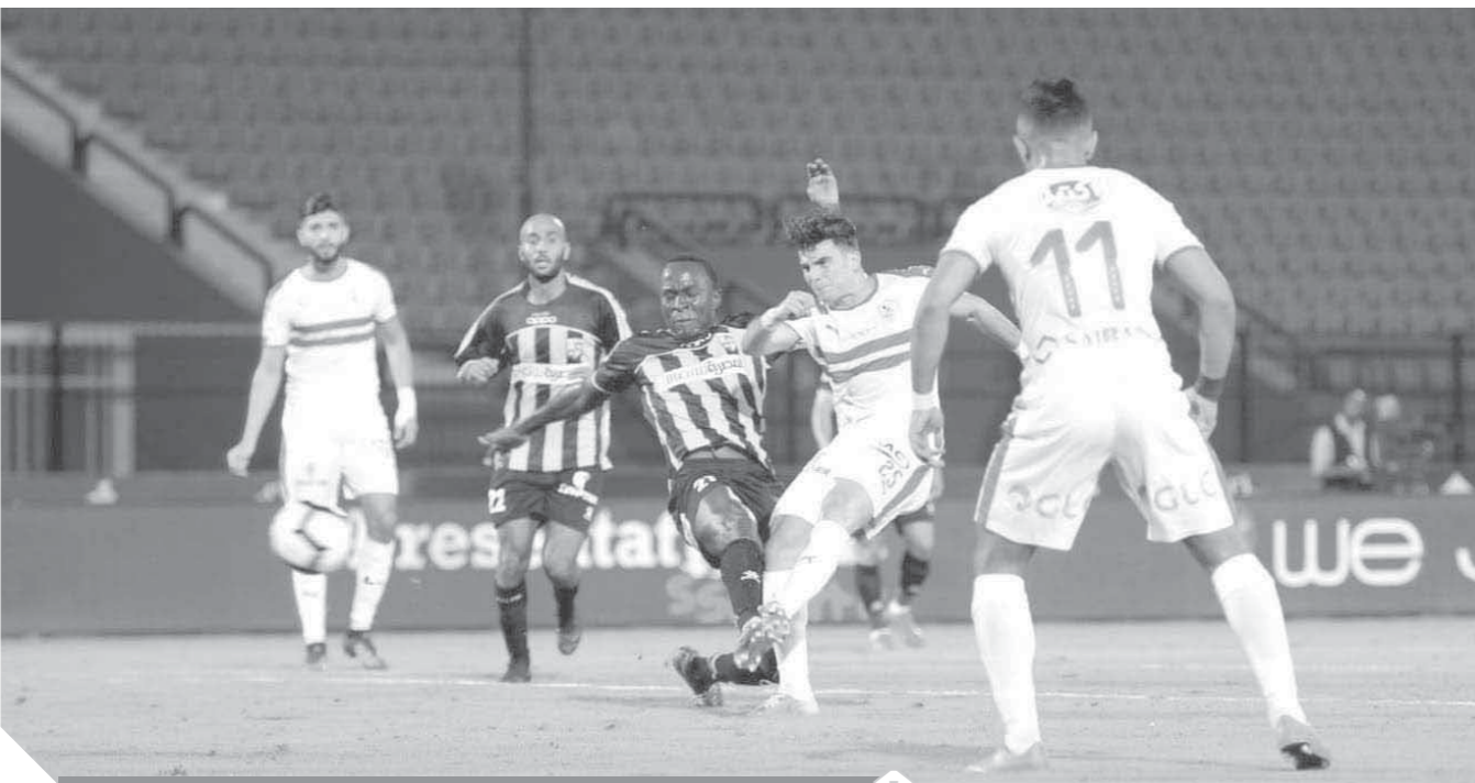
الزمالك يستعد ل جينيراسيون

«ميتشو»: الفوز على المقاولون دفعة قوية.. ولن تتأثر بغياب أي لاعب