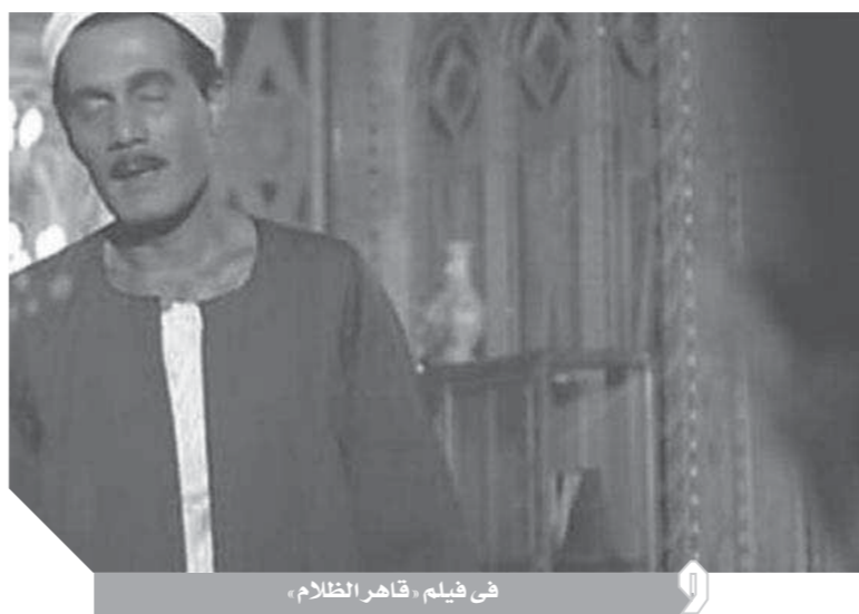
فى فيلم «قاهر الظلام»