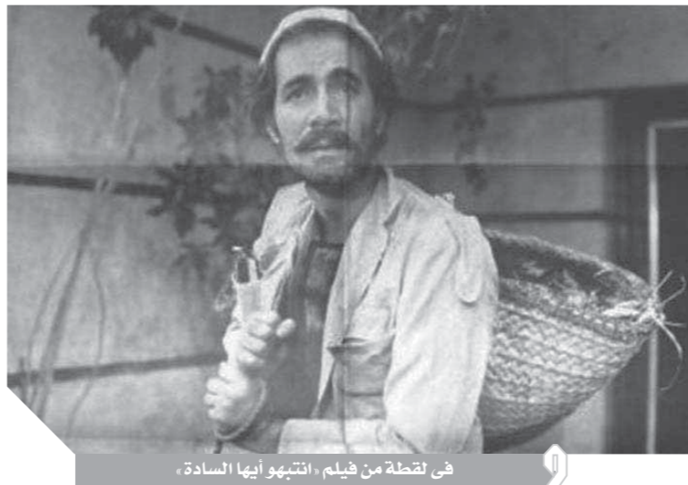
فى لقطة من فيلم «انتبهوا أيها السادة»