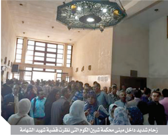
زحام شديد داخل مبنى محكمة شبين الكوم التي نظرت قضية شهيد الشهامة