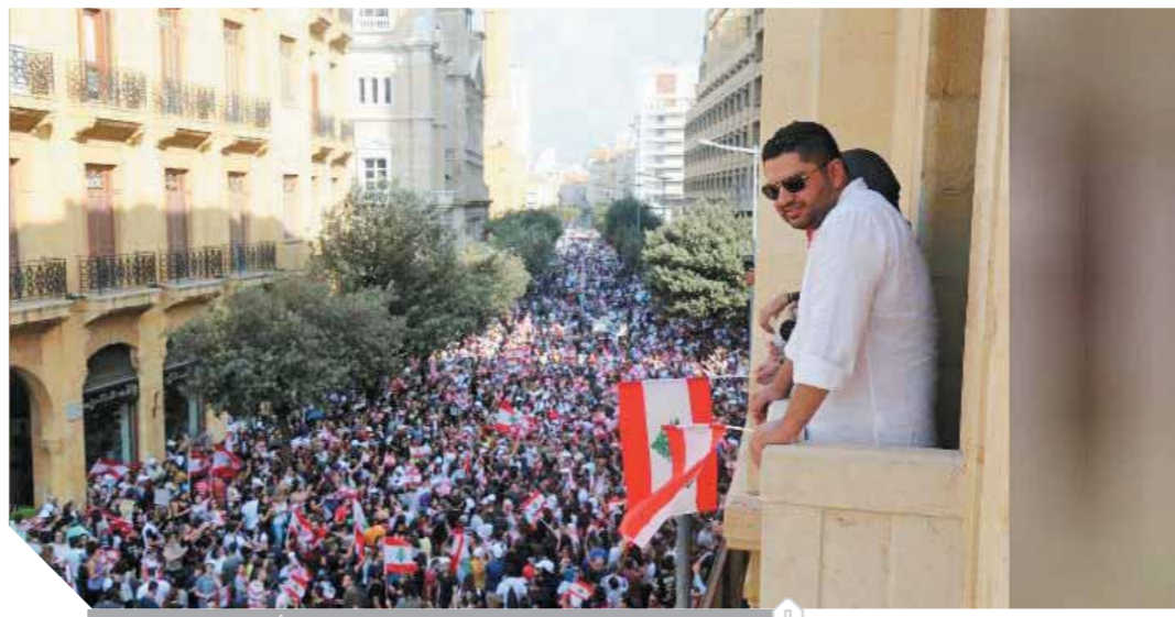
آلاف اللبنانيين يواصلون التظاهر ضد تدرى الأوضاع المعيشية

أجهزة الهاتف الذكية مثل «واتساب»، قبل أن تتراجع الحكومة عن فرض تلك الرسوم. وأمهل رئيس الوزراء اللبناني سعد الحريري الشركاء السياسيين في لبنان مدة ٧٢ ساعة لتقديم حلول للإصلاح الاقتصادي، والاستجابة للمطالب الشعبية مهدداً باللجوء إلى خيارات أخرى. وتنتهي مهلة الحريري، اليوم الاثنين، وحتى الآن لم تظهر أي مؤشرات إيجابية حول امتثال القوى السياسية لطلبات المتظاهرين. وكان وزراء حزب القوات