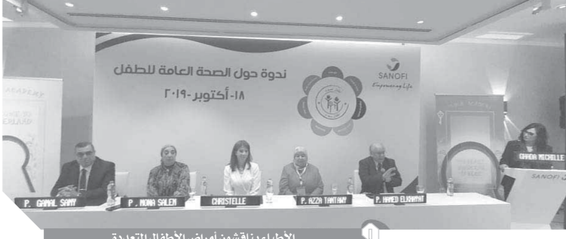
الأطباء يناقشون أمراض الأطفال المتعددة

الأنتف عادة في مراحل الطفولة المبكرة نتيجة لتفاعل غشاء الأنتف المخاطي لبعض مسببات الحساسية، وتظهر الحساسية لمسببات الحساسية الخارجية في الأماكن المفتوحة عادة عند الأطفال الأكبر من ٤ إلى ٦ سنوات أما بالنسبة للأطفال الأصغر من سن أصغر أقل من عامين، ويعتبر عث الغبار والحيوانات الأليفة والعفن من أهم مسببات الحساسية في الأماكن المغلقة. والأطفال الذين يعانون من أمراض الحساسية الأخرى مثل الأكزيما والحساسية الغذائية والربو هم أكثر عرضة للإصابة بحساسية الأنتف. ومسببات الحساسية هي سبب شائع لنوبات الربو والسيطرة على الحساسية، قد تساعد في السيطرة على الربو والأكزيما لدى هؤلاء الأطفال وتشمل