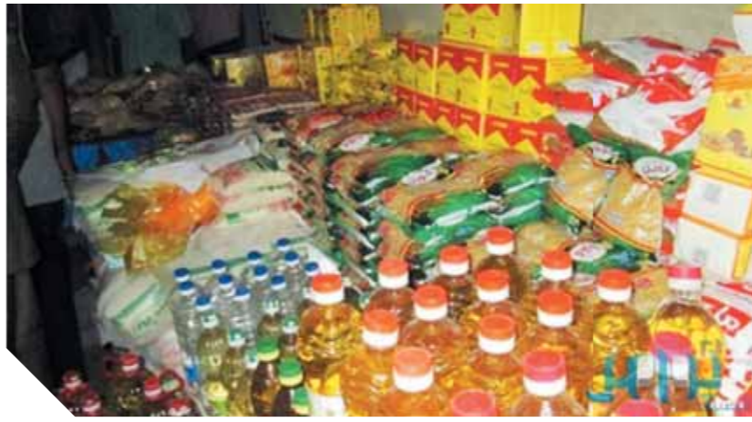
المواطنين. تضمنت الإتاوات ٤ مليارات جنيه للهيئة العامة للسلع التموينية تمثل قيمة الدعم المالي الشهري

كتب. عبدالقادر إسماعيل: أكد الدكتور محمد معيط، وزير المالية، حرص الحكومة على توفير السيولة النقدية اللازمة للهيئات السلعية والخدمية؛ بما يضمن قدرتها على الوفاء بالتزاماتها الخدمية على النحو الذي يساهم في توفير احتياجات المواطنين خاصة الفئات الأولى بالرعاية، مشيراً إلى أن وزارة المالية تتلقى بعين الاهتمام طلبات التعزيز المالي للجهات الإدارية وتحرص على تلبيةها على ضوء الاعتمادات المقررة بمراعاة تحقيق المصلحة العامة، والمستهدفات المالية سنوياً؛ بما يؤدي في النهاية إلى الارتقاء بمستوى معيشة المواطنين. وكشفت الوزارة عن الموافقة على عدد من الإتاوات المالية العاجلة خلال شهر سبتمبر الماضي التي تبلغ قيمتها ٤,٤ مليار جنيه لصالح الهيئة العامة للسلع التموينية، والهيئة القومية لسكك حديد مصر، والشركة القابضة لمياه الشرب والصرف الصحي؛ بما يُكّن هذه الجهات من الوفاء بالتزاماتها السلعية والخدمية تجاه