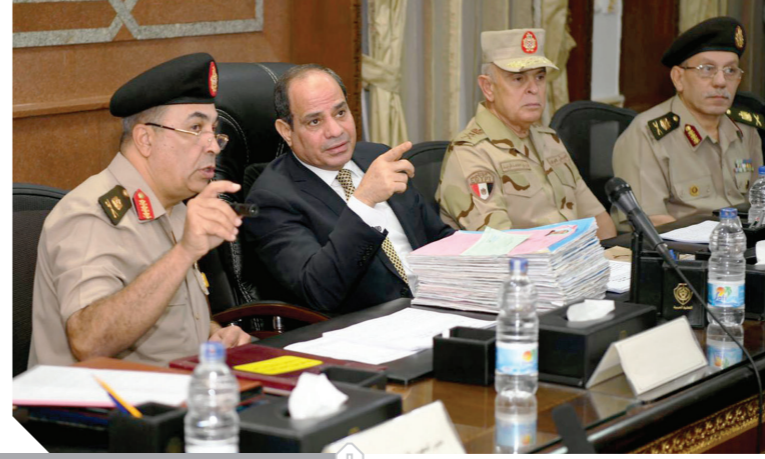
الرئيس السيسي في اختبار الهيئة بالكليات الحربية

كتب - ناصر عبدالمجيد: قام الرئيس عبدالفتاح السيسي بزيارة تفقدية أمس إلى الكلية الحربية، تابع خلالها إجراءات اختبار الهيئة للطلبة المتقدمين للالتحاق بالكليات والمعاهد العسكرية، حيث يتم اختيار أفضل العناصر لنيل شرف الالتحاق بالقوات المسلحة، وذلك بحضور الفريق محمد فريد رئيس أركان حرب القوات المسلحة، ومديرى الكليات والمعاهد العسكرية، وصرح السفير بسام راضى، المتحدث باسم رئاسة الجمهورية، بأن الرئيس ناقش خلال متابعته إجراءات اختبار الهيئة، عدداً من الطلبة المتقدمين في بعض القضايا والموضوعات التي تدور على الساحتين الداخلية والخارجية، بالإضافة لبعض المعلومات العامة عن تاريخ مصر وما شهدته من نهضة تنموية في مختلف المجالات، وقد أعرب الرئيس عن سعادته لما لسه من فهم