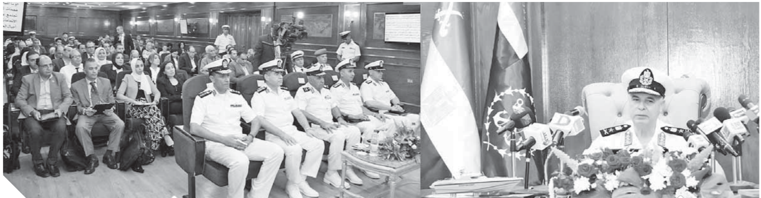
الفريق أحمد خالد قائد القوات البحرية

جاء ذلك خلال وقائع المؤتمر الصحفي الذي عقد بمناسبة الاحتفال بالذكرى الثانية والخمسين للقوات البحرية الذي يتوكل مع الدور البطولي لرجال البحرية المصرية في إغراق المدمرة إيلات عام ١٩٦٧ وتنفيذ العديد من الأعمال الطويلة خلال معارك الاستنزاف وحرب أكتوبر، التي غيرت مفاهيم واستراتيجيات الحروب البحرية الحديثة. وأشار إلى جهود القوات البحرية في تأمين السواحل المصرية بالبحرين المتوسط والأحمر على مدار الـ٤٦ ساعة، تحقيق مفهوم الأمن البحري الشامل في مناطق عمل القوات البحرية على كل الاتجاهات الاستراتيجية والفرع الرئيسية والجيش والموائل والخطوط الملاحية والمجرى الملاحي لقناة السويس ومناطق انتظار السفن، ومكافحة أعمال التسلل والتهرب والهجرة غير الشرعية والقيام بأعمال البحث والإنقاذ لحماية أمن وسلامة الوطن والمواطنين. وأكد الفريق أحمد خالد حرص القيادة السياسية والقيادة العامة للقوات المسلحة على إعادة بناء وتطوير القوات البحرية، لتتصّل بمطالب الدولة المصرية لحماية حدودها ومصالحها وترواتها وأجيالها البحرية لسنوات وعقد طويلة، وتكون قادرة على مواجهة كل التحديات التي تواجهها في مناطق عملها الاستراتيجية الشاملة للقوات المسلحة، مع الاستمرار في برامج تصنيع وحدات بحرية من مختلف الحمولات والاستخدامات بأيدٍ وسواعد وعقول مصرية طبقاً لتخطيط دقيق يراعي عوامل التطوير والجودة مع زمن قياسي للتنفيذ، في ظل النهضة الشاملة التي تشهدها مصرنا الغالية في كل المجالات.