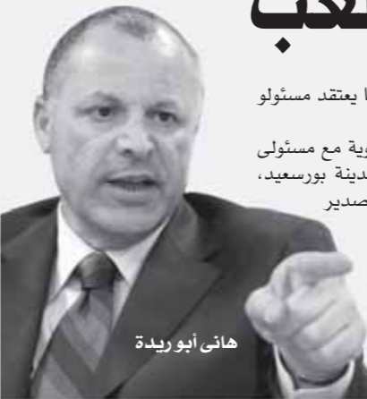
هاني أبو ريدة

ويد مدافع الإسماعيلي ليست ثابتة. واختتم المشرف العام على الكرة بيراميدز: لم نتمتع بالفاعلية على المرمى وهناك بعض الأخطاء الفنية، ومن الطبيعي أن نفوز ونخسر وهذه هي كرة القدم، فلا يوجد فريق في العالم يفوز فقط.