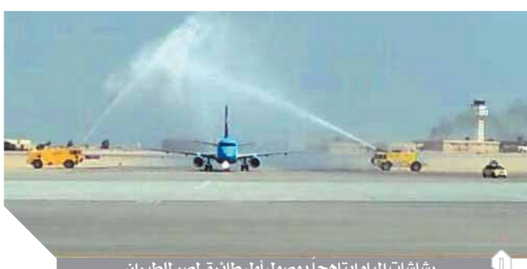
رشاشات المياه ابتهاجا بوصول أول طائرة لمصر للطيران

مصر للطيران فقد اجازات الشركة بنجاح تفتيشات الأيوزا (IATA Operational Safety Audit - IOSA) أعلى الشهادات التي تمنحها منظمة الآياتا في مجال السلامة لشركات الطيران دون ملاحظات أو نقاط عدم مطابقة (Zero Findings). تم تشغيل خط جديد إلى هونغ كونغ بواقع رحلتين أسبوعيا بالإضافة إلى انضمام طائرة جديدة لشركة مصر للطيران للشحن الجوى من طراز إيرباص A330-200p2F بعد تحويلها من طائرة ركاب إلى طائرة شحن تنسح لحمولة 60 طن.