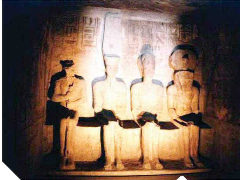
غداً الشمس تتعامد على رمسيس الثانى بأبوسمبل

احتفالاً بتعامد الشمس على معبد الملك رمسيس الثانى بأبوسمبل، وجهت وزارة الآثار الدعوة إلى عدد كبير من سفراء الدول العربية والأجنبية فى مصر والوزراء والشخصيات العامة للمشاركة فى هذا الحدث الذى يشمل زيارة خاصة لمعبدى أبو سمبل وحضور عرض للصوت والضوء وعشاء خاص على ضفاف بحيرة ناصر من أمام معبد أبو سمبل ومشاهدة عرض فنى تقدمه وزارة الثقافة اليوم.. وحضور تعامد الشمس على المعبد فجر الغد الذى يتوكل مع مرور 5٠ عاماً على عملية إنقاذ ونقل معبدى أبوسمبل يوم ٢٢ سبتمبر ١٩٦٨.