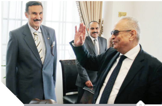
أبو شقة يحيى لجنة تلتقى طلبات المرشحين

أعلن المستشار بهاء الدين أبو شقة رئيس حزب الوفد أنه يقف على مسافة واحدة بين جميع مرشحي انتخابات الهيئة العليا للحزب، وقال إن الانتخابات المبكرة للهيئة العليا، سوف تهيئ المناخ المناسب لكي يكون هناك استقرار في الهيئة العليا للحزب، من أجل إعادة بنائه على أسس قوية ومتمينة، في إطار الثوابت والمبادئ التي قام عليها حزب الوفد منذ مائة عام، جاء ذلك خلال استقبال الوفديين أمس المستشار بهاء الدين أبو شقة رئيس حزب الوفد، حيث صافحهم جميعاً ودار حوار مفتوح معهم، ثم توجه أبو شقة إلى اللجنة المشرفة على انتخابات الهيئة العليا للحزب، برئاسة اللواء أحمد الشاهد حيث صافحه رئيس الحزب، كما صافح باقي