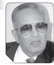
بهاء الدين أبوشقة