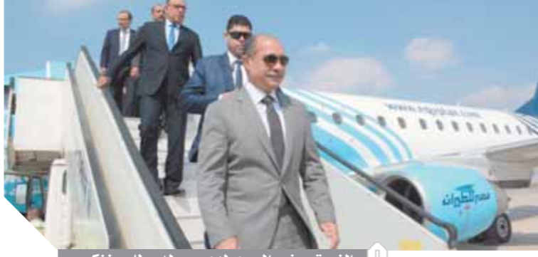
الفريق يونس المصري لدى وصوله مطار سفنكس

الجوى (الآيات) في مجال السلامة والتدريب وتبادل المعلومات بهدف تعزيز التعاون وتبادل الخبرات مع المنظمات الدولية للطيران المدني لارتقاء بكافة مجالات السلامة في مرقف الطيران المدني. تطوير الإجراءات الأمنية بالمطارات المصرية ومنها: