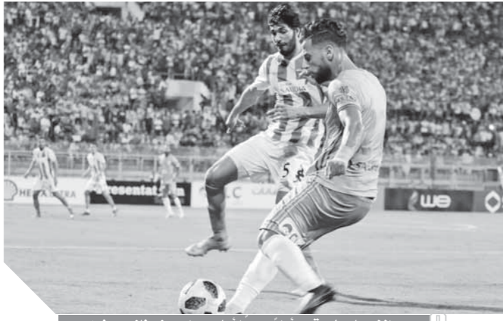
الإسماعيلي قدم أداء جيداً أمام بيراميدز وفاز بهدفين