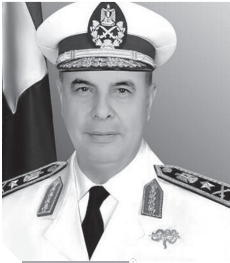
الفريق أحمد خالد

أكد الفريق أحمد خالد قائد القوات البحرية أن نجاح القوات البحرية المصرية في تدمير المدمرة إيلات الإسرائيلية في 12 أكتوبر 1967 أحدث تغييراً شاملاً لمفاهيم الكتيك البحري في العالم بأثره، وقال قائد القوات البحرية خلال كلمته بمناسبة الاحتفال بالذكرى الحادية والخمسين للقوات البحرية: نحتفل في هذا اليوم العظيم من أيام قواتنا البحرية وبكل الفخر والاعتزاز بالذكرى الحادية والخمسين لأحد أعظم الانتصارات البحرية في التاريخ البحري الحديث حيث شهد يوم الحادي والعشرين من أكتوبر عام 1967 النصر الذي حققه رجال قواتنا البحرية في أول معركة صاروخية بحرية في التاريخ وبداية الانتصارات المصرية مَهْدَةَ الطريق إلى حرب الاستنزاف،