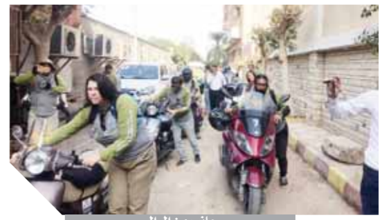
جانب من الرالى

استقبلت محافظة المنيا رالى تحدى عبور مصر متعدد الجنسيات (cross Egypt)، الذى يشارك به 32 أجنبياً من دول أوروبا، ممثلون لـ 12 دولة أوروبية، من بينهم دول ( أمريكا - استراليا - البرتغال - سويسرا - كندا - الأرجنتين )، و28 لوفد المصرى، وسيقيم بأحد فنادق المحافظة لمدة يوم واحد، متوجهاً بعدها إلى القاهرة استكمالاً لرحلته بتحدى عبور مصر، عبر سلسلة من الدراجات النارية عبر البلاد، تهدف للسلسلة إلى تعزيز السياحة المصرية، وتجرى تحت إشراف وزارة السياحة المصرية، وهيئة السياحة المصرية.