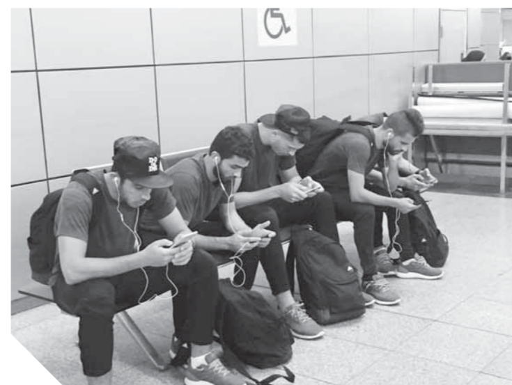
لاعبو المصري في مطار أديس أبابا في طريقهم إلى الكونغو