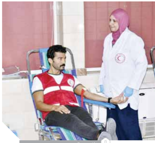
النبوى يتبرع بدمه

شقيقه يحتاج إلى نقل دم لمدة 8 سنوات خلال فترة مرضه، لذلك الحملة تعد عملاً مفيداً وخيراً للجميع، واعتبر أن أى عمل مجيد مبهج، وسيكون للحملة أثر جميل على المجتمع لأنها ستفد أرواح الكثير. وأنهى النبوى حديثه قائلاً: كل متبرعى الدم فى حملة الناس لبعضها، يضمنون حقهم وحق ذويهم فى الحصول على كيس دم وقت الحاجة إليه، حيث سيحصل كل متبرع على شيك يقر بأنه له الحق ولأقاربه من الدرجة الأولى فى كيس دم. الجدير بالذكر أنه تحت شعار «الناس لبعضها» انطلقت حملة التبرع بالدم التى نظمتها الهلال الأحمر المصرى والتي يتبناها الفنان خالد النبوى سفير الهلال الأحمر المصرى للتبرع بالدم، والذي دعا جميع فئات المجتمع فى مصر والوطن العربى للتبرع بالدم، حتى لا يكون بين أفراد المجتمع من يعانى من نقص الدم.