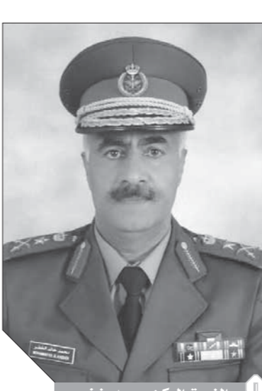
الفريق الركن محمد خضر

تجنباً لحرب الشائعات دعمت الحكومة الكويتية الجميع إلى استقاء المعلومات الحكومية المتعلقة بالأوضاع التي تمر بها المنطقة وامتدادها من الجهات الرسمية في الدولة ممناً نشر أي تداول شائعات أو معلومات مدموسة، وقال رئيس مركز التواصل الحكومي الناطق الرسمي باسم الحكومة طارق المزرم في تصريح صحفي، أن إعلاناً صدر من الجيش في وقت سابق من اليوم حول الإجراءات الأمنية والإحترازية المتخذة بشأن أوضاع المنطقة حفاظاً على أمن البلاد وسلامة أراضيها، وأضاف المزرم أن مثل هذه الأوضاع يصاحبها شائعات ومعلومات مغلوطة تدس وتنتشر في العديد من وسائل التواصل الاجتماعي وغيرها من الوسائل. ودعا الجميع من أبناء الكويت إلى الحصول على المعلومات الصحيحة من الجهات الرسمية لاسيما وكالة الأنباء الكويتية (كونا) وحسابات وزارات الدولة في مختلف وسائل التواصل، وأهاب بالواطنين والمقيمين بعدم الالتفات إلى أي شائعات أو معلومات مدموسة أو المساعدة في نشرها والاعتماد على المصدر الرسمي والمسؤول سواء المتحدثين الرسميين أو الجهات الرسمية في الدولة.