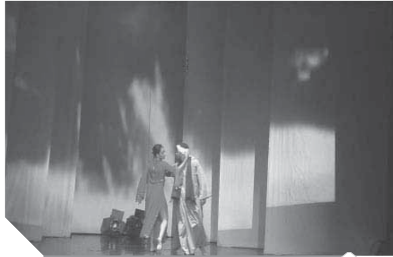
العرض المسرحي «انتحار معلن»