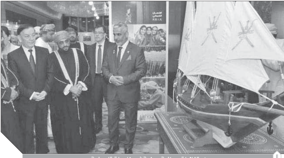
احتفاليات عمانية صينية في مناسبات تاريخية