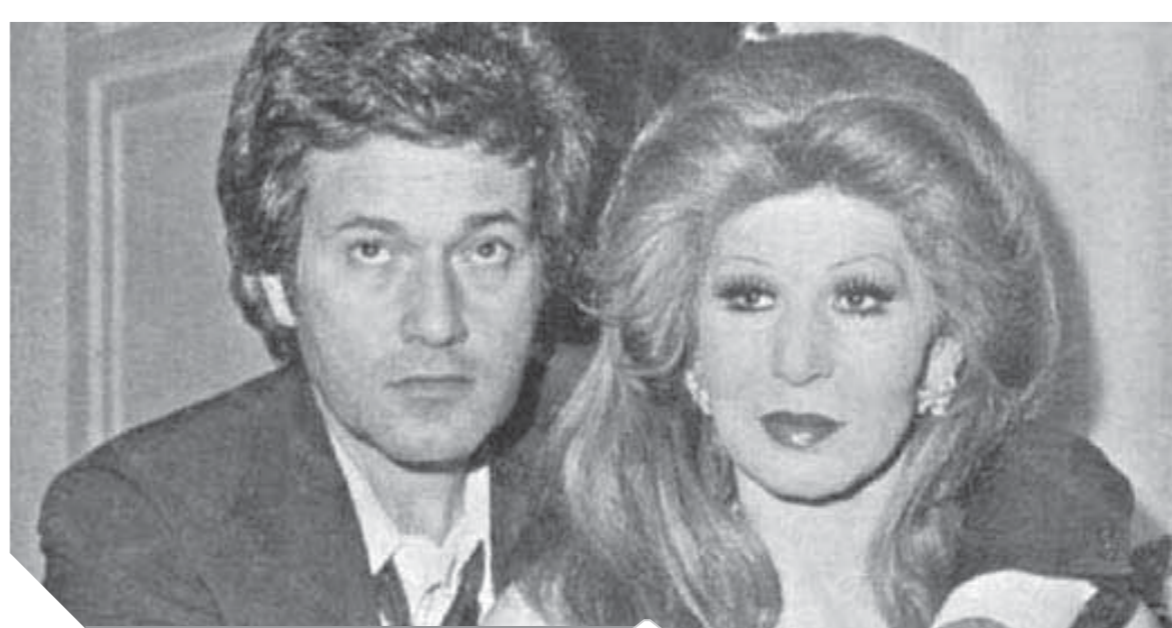
فايزة أحمد ومحمد سلطان... حكاية حب

الحب بينهما حدث الانفصال فى أوائل الثمانينات وشعر كل منهما أثناء الانفصال بعين شديد للأخر، ومن المعروف فى عصر عمالقة الطرب أن المطرب أو المطربة ينقل للشاعر الحالة التي يمر بها حتى يستطيع كتابة أغنية صادقة. فى صيف ١٩٨٢، طلبت الراحلة فايزة أحمد من الشاعر الراحل عبدالرحيم منصور كتابة أغنية تعبر فيها عن حالتها وأبداع الشاعر الراحل رائحة «حببي يا متغرب» ويبدو أن فايزة أحمد كانت تريد أن تبعث برسالة غنائية لسلطان عن الحالة التي تعيشها بعد الانفصال بكلمات معبرة للغاية «حببي يا متغرب، قرب ليا قرب، وتعالى بالسلامة طولت الغيبة ياما، غايب وناسينى وللا فاكركنى وناسينى، غايب يا نور عيني». وفى مقطع آخر تقول: «حببي يا مسلينى يا مهينى تعالى داوينى تعالى يا حببي وأنا أفتح عيني وأشوفك أدوب بكلامك، أدوب ف عينوك واتوه عن كل الدنيا». والأغنية الرائعة لنحنا بإحساس عميق الموسيقار الراحل الفذ بليغ حمدى. استمع محمد سلطان جيدا للأغنية ويبدو أنه أراد الرد على حببيته عمره فايزة أحمد عن طريق صوت هانى شاكر ويبدو أنه