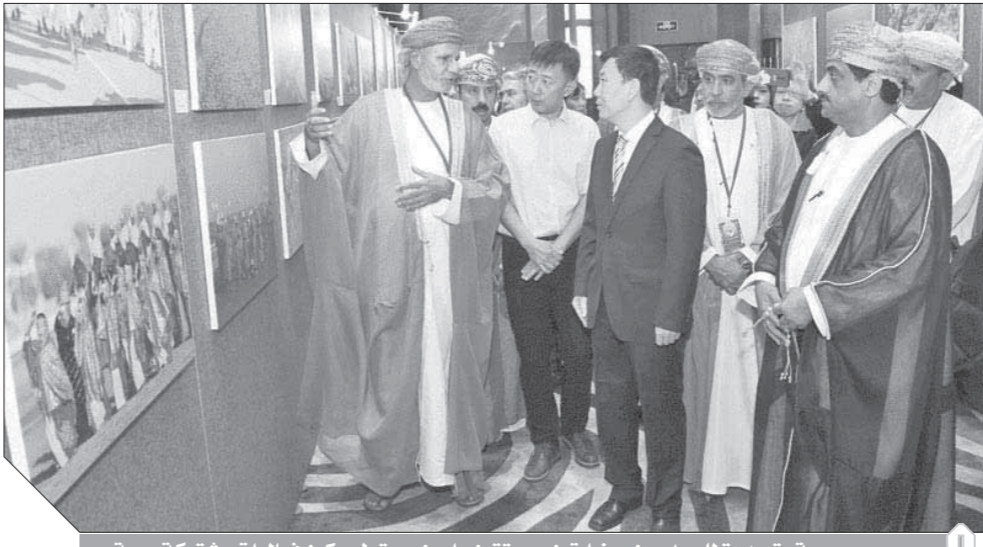
جسور صينية متجددة للحوار بين حضارتين عريقتين ما بين مسقط ويكين فعاليات مشتركة مهمة

في كلا الإمبراطوريتين اللتين برغتا في شرق المعمورة، واللتين لازالتا تسهمان في الحضارة الإنسانية وتعتبران دروب الأمل وترسخان مفهوم التعايش والتعاون. القرن الخامس قبل الميلاد حملت جلسة العمل الأولى عنوان «تاريخ العلاقات العمانية الصينية وتضمنت عدة محاور منها الطرق البحرية التي سلكتها السفن العمانية في إحجارها إلى الموانئ الصينية، والصادرات والأوراد المتبادلة، ويعتبر منتجاً خاصاً بعمان إلى الصين في القرن الخامس قبل الميلاد، وفي سنة ١٠٠٠ ميلادية قامت كل من «مجان» و«فغان» العمانيتين بإيفاد رسل إلى مدينة «لو يانغ» لاستلام هدايا الإمبراطور الصيني، وأشار إلى أن رحلات البحار الصيني، «تفتح حده» التي قادته إلى الأهمية الاستراتيجية لوقع الدقم للمستثمرين الصينيين، ومشارة إلى أهمية التجارة البحرية العمانية.