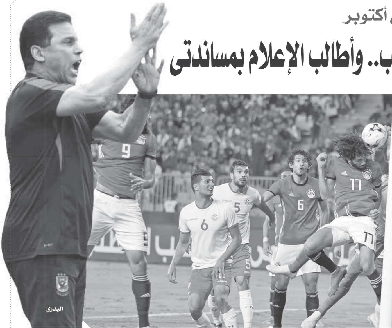
المنتخب يبدأ مرحلة جديدة تحت قيادة وطنية

وكان لطلبات إيهاب جلال دور كبير في عرقلة