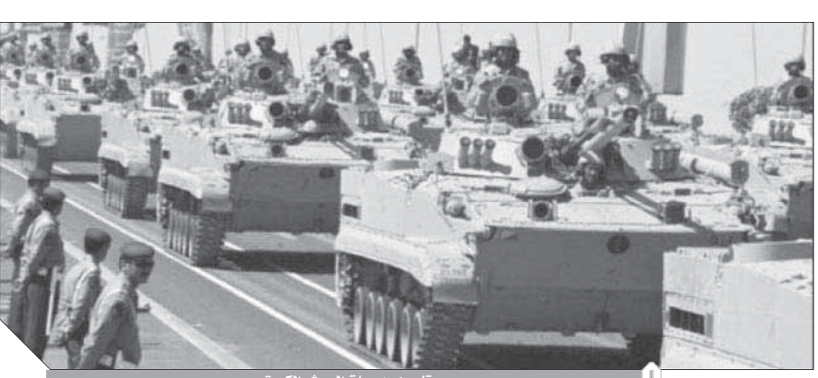
رتل من مدرعات الجيش الكويتي

وعمل مشترك، لمكافحة تلك التهديدات الجادة في ظل التقدم التكنولوجي المستمر. مشاتل تنطية وهي القطاع النطفي رفعت إدارة شركة نفط الكويت الحالية الأمنية في جميع منشاتها إلى الدرجة الأعلى نظراً للأهمية الاستراتيجية الأخيرة والمتنامية، حيث وجهت بياناً لرؤساء وكبرى وأمرى الأمن في قطاعاتها لتشييد مراقبة الأوضاع الأمنية في منشآت الشركة في مدينة الأحمدى. وجاء في التعميم الصادر من الشركة للوظائف إن إدارة شركة نفط الكويت قررت رفع الحالة الأمنية للدرجة الأعلى نظراً للأحداث الإقليمية الأخيرة، وطالبت رؤساء عموري الأمن وكبرى أمرى الأمن وأمرى الأمن أخذ الحيطة وتشييد مراقبة الأوضاع الأمنية في منشآت الشركة في مدينة الأحمدى، ودعمت الشركة إلى ضرورة تكثيف جولات الدوريات الأمنية وتحريكها جميعاً دون توقف، وزيادة جولات الدوريات الأمنية وتشغيل المفشترات في طرق مولات الأحمدى ومنشآت الشركة الهامة. وزيادة التدقيق الأمني والتفتيش في أبواب المنشآت خارج الحقول النفطية، وتحديث الإدارة بشكل مستمر عند ورود أي حوادث أو بلاغات أمنية.