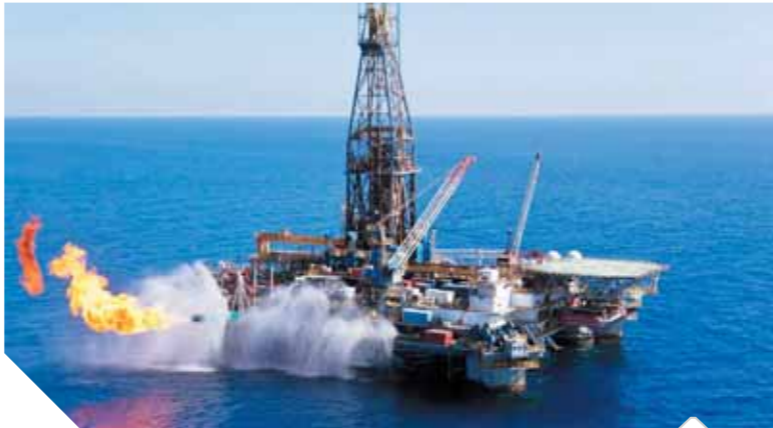
طرقة هائلة في مشروعات الغاز الطبيعي

أكد وزير البترول والثروة المعدنية أن صناعة الغاز الطبيعي تشهد تحولات إيجابية هائلة في مصر خلال العام الأخيرين مع تزايد إنتاج الغاز الطبيعي إلى أعلى معدلاته في شهر سبتمبر الحالي والتوسع في استخدامات الغاز بالسوق المحلية بعد الاكتفاء ذاتياً من إنتاجه وتوفير فائض للتصدير وتنمية صناعات القيمة المضافة، لافتاً إلى أن دعم الرئيس السيسي المستمر لقطاع البترول ومتابعته الكاملة لتنفيذ مشروعات صناعة الغاز الطبيعي ساهم بقوة في الوصول لنتائج متميزة وتحفيز الشركات العالمية لسرعة الانتهاء من المشروعات ومواصلة ضخ استثمارات إضافية لتنمية احتياطات الغاز المصرية خاصة في ظل ما تشهده مصر من استقرار وبيئة مواتية للاستثمارات. جاء ذلك خلال رئاسة الوزير لأعمال الجمعية العامة للشركة المصرية القابضة للغازات الطبيعية (إيغاز) لاعتماد نتائج أعمال العام المالي ٢٠١٨/٢٠١٩. وأضاف الوزير أن الوزارة تركز على تنفيذ توجه الدولة الفترة المقبلة لتعزيز الاستفادة من توافر الغاز الطبيعي واستغلاله اقتصادياً بالشكل الأمثل في تنمية صناعات ذات قيمة مضافة عالية مثل صناعة البتروكيماويات والصناعات التحويلية المختلفة التي تشكل ركيزة أساسية في زيادة الناتج القومي وجذب استثمارات جديدة وتوفير فرص عمل وإحداث تنمية غير مسبوقه للمساهمة في تحقيق تطلعات المواطنين ورفع مستوى المعيشة، مشيراً إلى أن استراتيجية الدولة الحالية هي العمل على زيادة مساهمة الطاقات البديلة