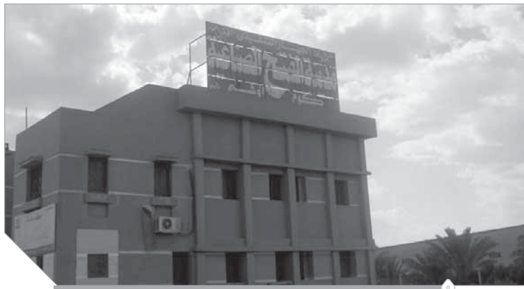
أحد المنشآت القائمة داخل المنطقة الصناعية