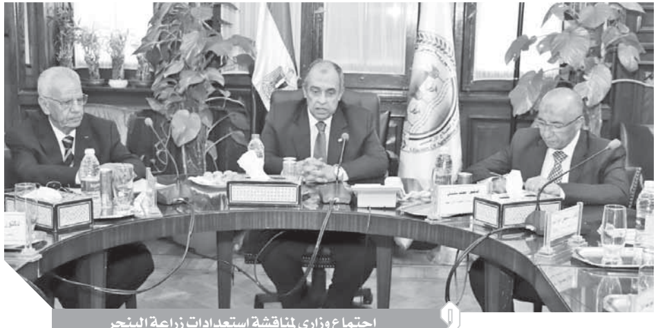
اجتماع وزاري لمناقشة استعدادات زراعة البنجر

أكد الدكتور عزالدين أبوستيت وزير الزراعة واستصلاح الأراضي أنه ستم زيادة مساحة زراعة البنجر خمسة أضعاف العام الماضي، وطالب بضرورة زيادة إنتاجية الفدان من ٢٢.٥ إلى ٣٠ طنًا حتى تحقق عائداً اقتصادياً كبيراً، جاء ذلك خلال اجتماع وزير الزراعة مع رؤساء مجالس إدارة شركات السكر، وبحث الاجتماع الاستعداد للموسم الجديد بعد نجاح تجربة زراعة البنجر في منطقة غرب المنيا الموسم الماضي والتي ساهمت في جذب استثمارات جديدة لمنطقة غرب المنيا، وأشاد وزير الزراعة بالحرص الوطني لشركات السكر في حرصها على دعم زراعة البنجر وإنتاج سلعة استراتيجية يحتاجها كل أفراد الشعب، كما طالب بضرورة الإسراع في تجهيز الأرض وتسليمها للشركات مبكراً، حتى تتمكن من زراعة محصول البنجر في بداية شهر سبتمبر المقبل مما يسهم في زيادة الإنتاج.