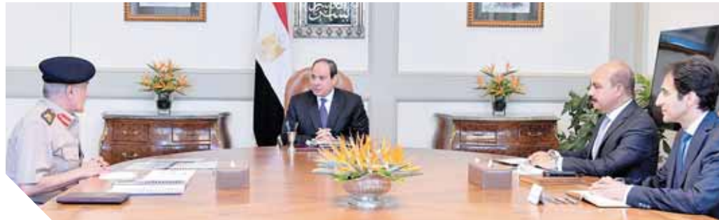
الرئيس خلال اجتماعه مع اللواء السيد الغالى