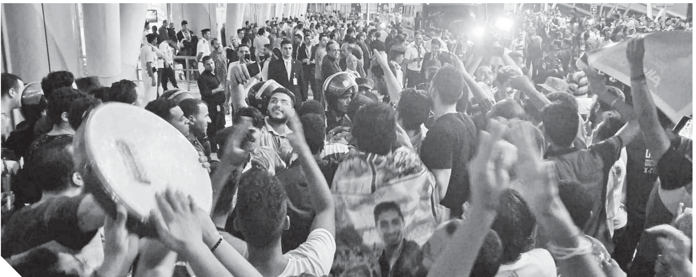
الجماهير احتشدت بالمطار للاحتفاء بأبطال العالم