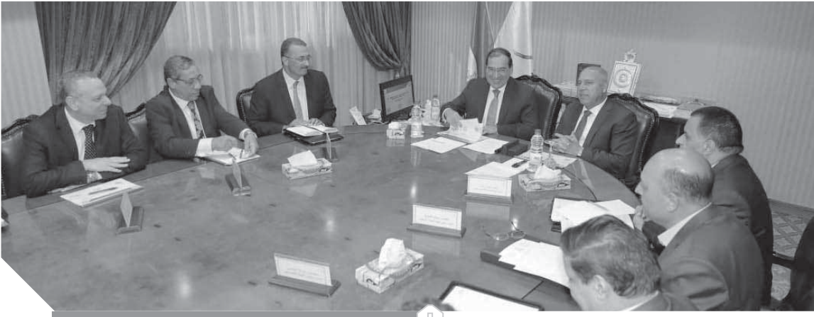
مناقشات موسعة لتطوير سكة حديد قنا - سفاجا

وزير البترول والثروة المعدنية أن الخط مشروع استراتيجى يخدم صناعة التعدين ونقل الركاب ويسهم فى تنمية الوادى الجديد والمحافظات التي يمر بها خط السكك الحديدية، بالإضافة إلى مساهمته الإيجابية لمصنع إنتاج حمض الفوسفوريك فى أبوظرطور والمشروعات التكميلية بالمنطقة، وتم الاتفاق على إعداد لجنة مشتركة لسرعة تنفيذ المشروع وتوفير كل وسائل السلامة على السكة وتبدأ الطاقة التشغيلية لنقل البضائع بنقل ٢.٦ مليون طن ويتم إنشائها إلى ٦ ملايين طن سنوياً، كما سيتم إنشاء محطة تداول بضائع بين محافظة قنا ويزلمه كم ٥١٠ لرفع وانزال الحاويات فى هذه المحطة.