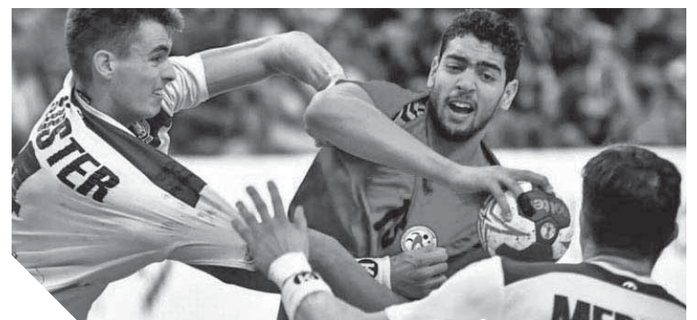
أحمد هشام أفضل لاعب في مونديال الناشئين

وأشار إلى أنه كان يعلم أن الجماهير المصرية ستتواجد بالاطار من أجل استقبال البعثة بعد الإنجاز التاريخي