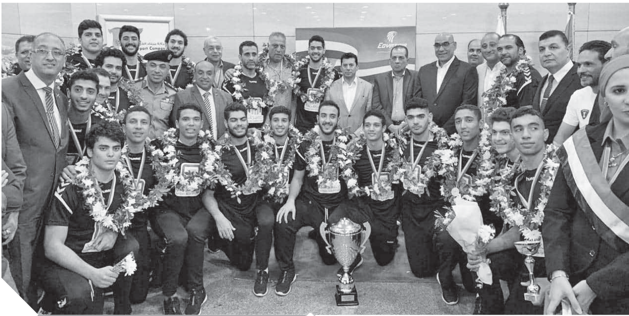
وزير الرياضة مع الفريق خلال استقباله بمطار القاهرة

الموهوبين في عدد من الألعاب الرياضية سواء الفردية أو الجماعية.