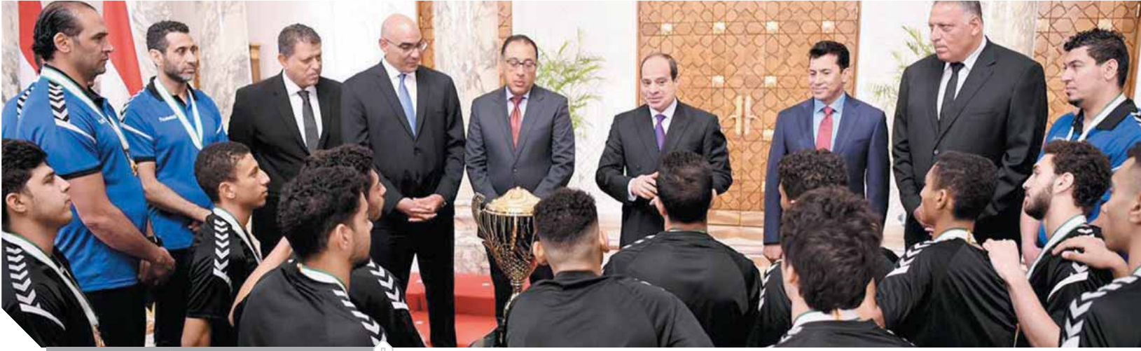
الرئيس خلال تكريمه أبطال كأس العالم في اليد

لهدف. كتب: ناصر عبد المجيد، منح الرئيس عبدالفتاح السيسي، أمس، لأعضاء وأعضاء الجهاز الفني للمنتخب الوطني لكرة اليد للناشئين، المتوج ببطولة كأس العالم، وسام الرياضة من الطبقة الأولى. وأشاد الرئيس بما حققه المنتخب الوطني للناشئين من إنجاز عالمي في كرة اليد، وإسهامهم في تعزيز مكانة مصر على الساحة الرياضية الدولية، والذي يأتي امتداداً لتميز رياضة كرة اليد المصرية على المستوى العالمي، مؤكداً سيادته تقديره لأبطال مصر الرياضيين لما يمثلونه من قدوة للشباب في التفوق وقوة العزيمة وبذل الجهد وصولاً