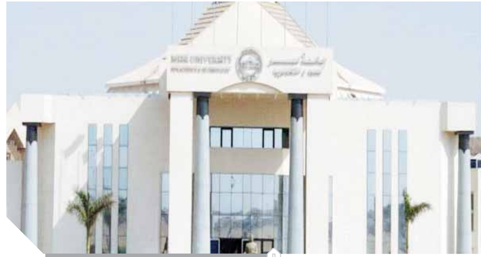
جامعة مصر للعلوم والتكنولوجيا