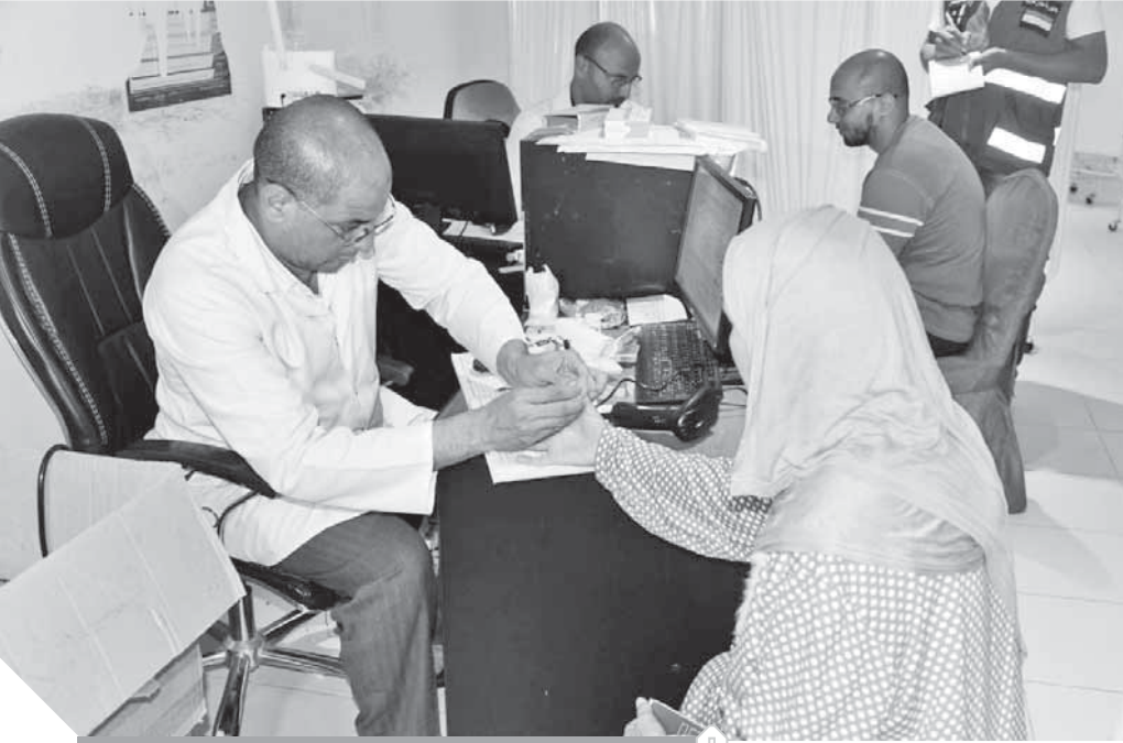
الحجاج يتلقون رعاية صحية جيدة من بعثة الصحة