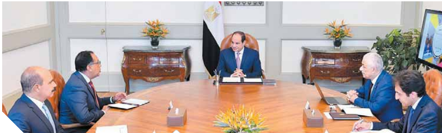
الرئيس خلال اجتماعه ورئيس الوزراء وزير التعليم

يسير بخطى ثابتة ويحظى بإشادة من المؤسسات الدولية المتخصصة في هذا المجال. وعرض أيضاً الدكتور طارق شوقي في ذات السياق الموقف التنفيذي للبيئة التحتية التكنولوجية لمنظومة التعليم الجديدة، فضلاً عن موقف بنك المعرفة المصري وكيفية التوسع في دوره واستخدماته كمنصة قومية للعلم والمعرفة والبحث العلمي.