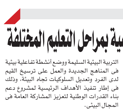
طبع مطابع: الأهرام بالجلاء

وكان الرئيس السابق «أوباما» مشهوراً بحبه لرياضة كرة السلة وشوهد مراراً، وهو يعارسها عندما كان في البيت الأبيض مع الطاقم الرئاسي وعدداً من المشاهير.