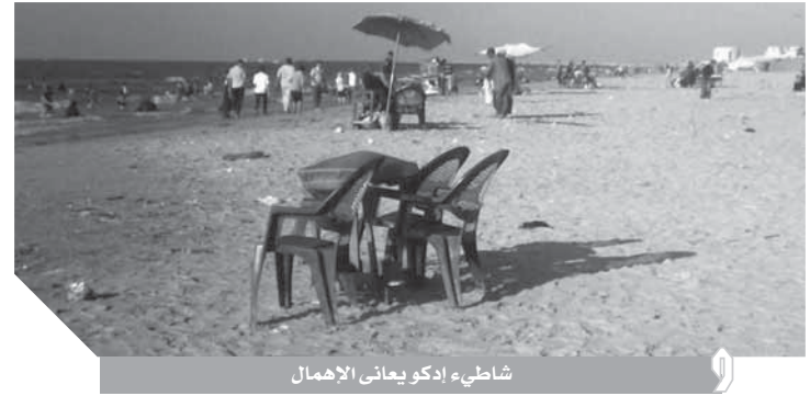
شاطئ إدكو يعاني الإهمال

وفي النهاية طالب حسن رزق - مزارع - بضرورة تدخل اللواء هشام أمانة محافظ البحيرة وبشكل عاجل لتوفير الخدمات الأساسية والأهلا والحمامات بدلا من قضاء الحاجة في المساحد القريبة. ما يسبب لنا أحرارا خاصة للسيدات بالإضافة إلى وحدات خلع الملابس والحفاظ على نظافة الشواطئ.