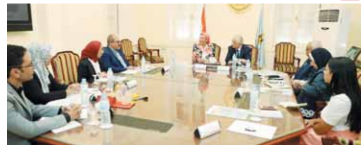
المزيد من الأخبار والتقارير المصورة

اجتمعت وزيرة البيئة ووزير التربية والتعليم لمناقشة التعاون بين الوزارتين لدمج المفاهيم البيئية الحديثة ضمن خطة وزارة التربية والتعليم في تطوير المناهج الدراسية وإثرائها وأوضحت وزيرة البيئة أن الوزارة تسعى إلى