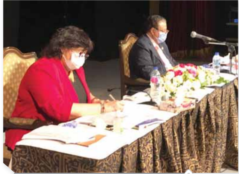
وزيرة الثقافة تعمد نتيجة الجوائز