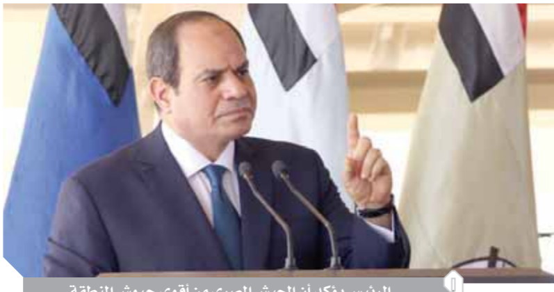
الرئيس السيسي يؤكد أن الجيش المصري من أقوى جيوش المنطقة

وأشار إلى أن رفع ملف سد النهضة مجلس الأمن يؤكد تمسكنا بالطرق الدبلوماسية، وأنتنا متمسكون بمسار المفاوضات، وقال إننا نقف أمام مرحلة فارقة للدفاع عن مقدرات الشعب المصري والليبي، وأشار إلى أن قوى خارجية تدعم الميليشيات المتطرفة والمرتزة في ليبيا، وأن التدخل المصري المباشر في ليبيا أصبح مشروعاً لحماية الأمن القومي المصري، وأنتنا مستعدون لاستقبال أبناء الشعب الليبي وتدريبهم. وقال إن أي تدخل مباشر من مصر لحماية حدودها الغربية تتوفر له الشرعية الدولية وإن سيطرة قوى خارجية على طرف من النزاع منع تطبيق وقف إطلاق النار.