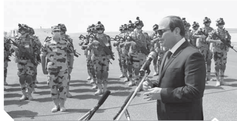
السيسى يؤكد جاهزية الجيش لآى مهام داخلية وخارجية