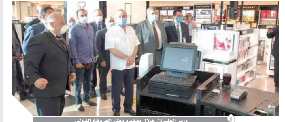
وزير الطيران خلال تفقده مطار الغردقة الدولي

طالب بمزيد من الضمانات لسلامة وصحة العملاء والعاملين؛ (منار) يتفقد شركة مصر للطيران للخدمات الجوية كما قام الطيار محمد منار وزير الطيران المدنى بزيارة تفقدية مفاجئة لفر شركة مصر للطيران للخدمات الجوية للاطمئنان على تطبيق التدابير والإجراءات الوقائية الخاصة بإعداد الوجبات وأدوات الطعام المقدمة للركاب خلال رحلاتهم. وبدأت الجولة بتفقد معمل تحلil وسلامة الأغذية ومخازن التصنيع ومنطقة إعداد وإنتاج وتجميع الوجبات، كما اطلع على إجراءات تأمين وتغليف وتابع خطة تنفيذ التدابير الاحترازية وطرق التعقيم التى اتخذتها الشركة لوقاية العاملين وكذا ضمان سلامة وجودة الأغذية. وشدد وزير الطيران على توفير مزيد من الإجراءات الصارمة وزيادة تعقيم أدوات الطعام وتغليفها بطريقة آمنة، كما وجه «منار»