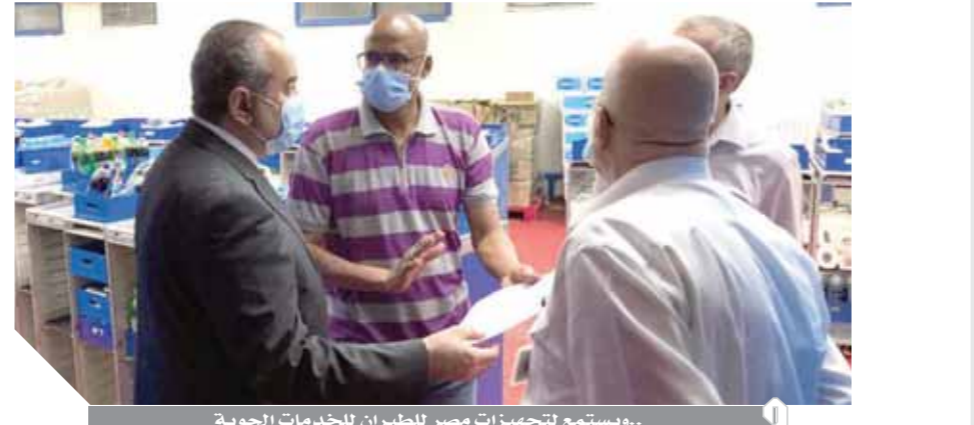
وزير الطيران خلال تفقده مطار الغردقة الدولي