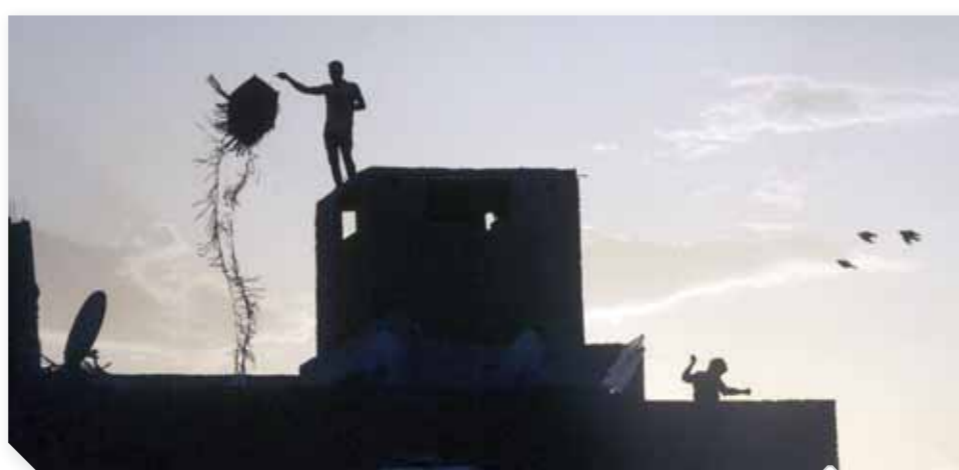
الطائرات الورقية تشكل خطورة كبيرة على الأرواح

خلال الليله بالطائرات الورقية، وهو ما جعل الكثيرين يحذرون من حوادث كثيرة شهدتها مصر مؤخراً بسبب هذه اللعبة الصينية التى تحولت من لعبة لطلب الهبة والسعادة وكسر الملل إلى لعبة لصيد الأرواح وجلب النعاس والشقاء.