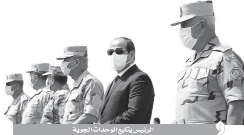
الرئيس يتابع الوحدات الجوية