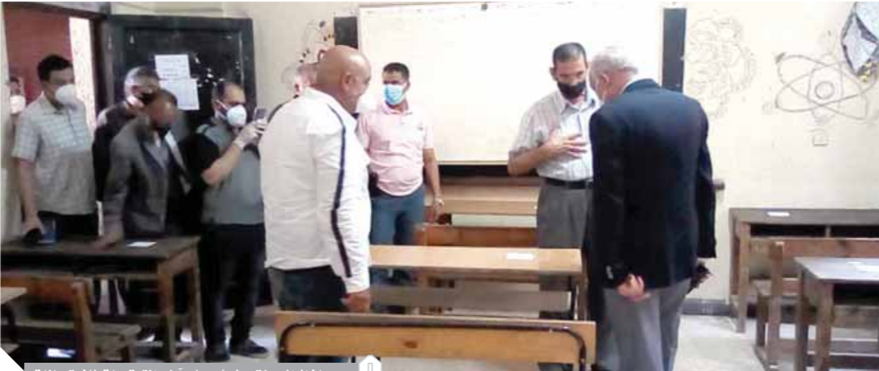
محافظة الجيزة يطمن علي آخر الترتيبات لامتحانات

كتبت - زكى السعدنى وهشام الهوتلى ومختار محروس: