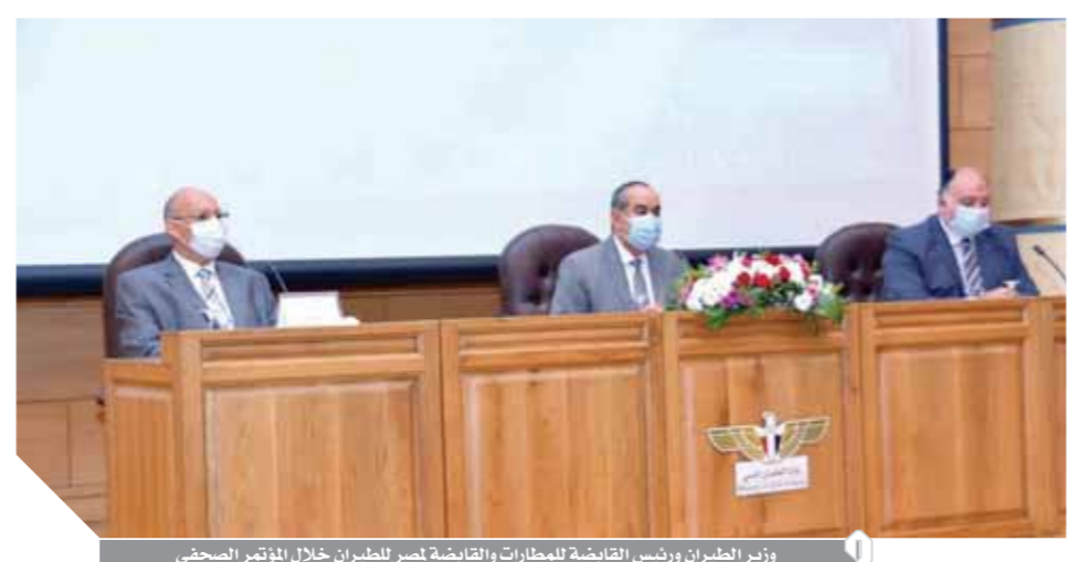
وزير الطيران ورئيس القابضة للمطارات والقابضة لخدمات الركاب خلال المؤتمر الصحفي

وزير الطيران: تكثيف الإجراءات استعداداً لعودة الطيران المنتظم أول يوليو (منار)؛ متفائلون بالمرحلة القادمة.. وخطة عمل مكثفة للتأكد من تطبيق الإجراءات والضوابط