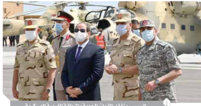
السيسي يتفقد القوات الجوية بالمنطقة الغربية العسكرية