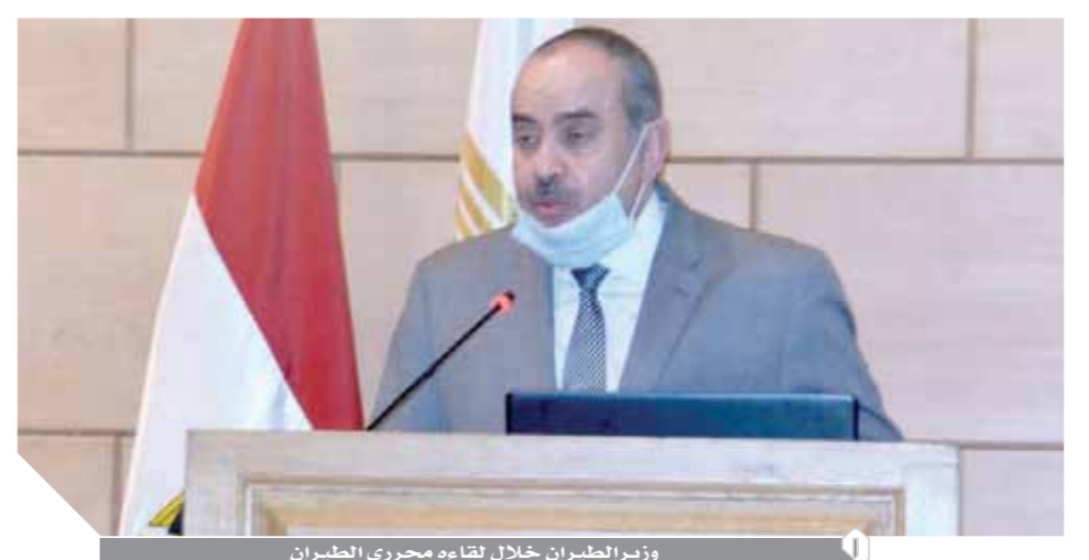
وزير الطيران خلال لقاءه محررى الطيران

عدد كبير من الحقائق الصغيرة للركاب التى على مجموعة حماية موصى بها عالمياً (Universal Protection Kit)، بالإضافة إلى تخصيص أماكن محددة لذوى الأمراض المزمنة وغيرها، الذين يتعذر عليهم ارتداء الكمامات لغزل طويلة وتخصيص آخر صيفين فى الطائرة لركاب الذين قد تظهر عليهم أعراض مرضية، وتخصيص أحد أفراد طاقم الضيافة لخدمتهم والتعامل معهم وفقاً لإرشادات وزارة الصحة ومنظمة الصحة العالمية.