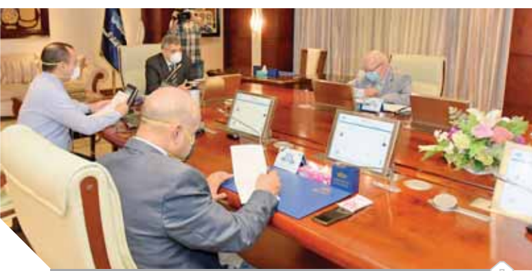
ربيع يبحث إجراءات تأمين الملاحى