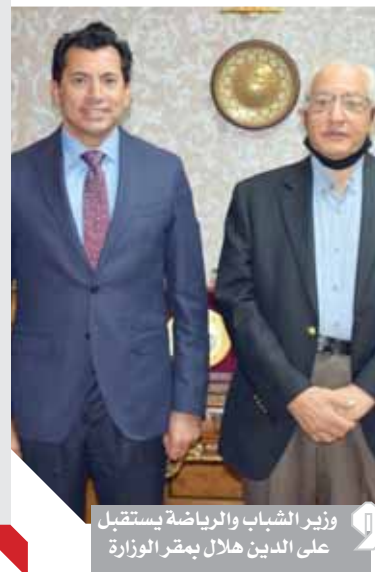
وزير الشباب والرياضة يستقبل على الدين هلال بمقر الوزارة

كتب - عادل يوسف: استقبل الدكتور أشرف صبحى وزير الشباب والرياضة الدكتور على الدين هلال وزير الشباب السابق وأستاذ العلوم السياسية بديوان وزارة الشباب والرياضة. وتناول اللقاء مناقشة العديد من الأنشطة والمشروعات والبرامج التى تنفذها الوزارة حالياً فى شتى المجالات، كما بحث صبحى مع هلال أوجه ومجالات تطوير بعض الأنشطة والفعاليات الشبابية وبرامج التنمية والمشاركة السياسية للنشء والشباب، تعليم روح الولاء والانتماء لدى الشباب ومنها آليات تطوير برنامات الملتاح والشباب وبرامج التعليم المدنى والقيادات الشبابية. وأكد وزير الرياضة أنه حرص منذ توليه المسئولية أن يكمل مسيرة الوزراء السابقين وأن يبنى ويكمل كل ما هو إيجابى من مشروعات وأنشطة، بالإضافة إلى استكمال المشروعات الإنسانية التى تضمنت تطويراً للأندية ومراكز الشباب والمدن والمنتديات الشبابية ومراكز التعليم المدنى والملاعب وحمامات السباحة ومختلف مشروعات تطوير البنية الرياضية فى جميع محافظات مصر.