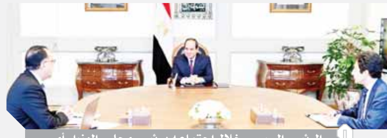
الرئيس السيسي خلال اجتماعه برئيس مجلس الوزراء أمس

وفقاً لأحدث ما تم التوصل إليه على المستوى العالمي، وكذلك تكثيف حملات التوعية لحث المواطنين على الالتزام بالإجراءات الوقائية اللازمة للحد من انتشار فيروس كورونا. وشهد الاجتماع استعراض الموقف التنفيذي لعدد من المشروعات القومية الكبرى على مستوى الجمهورية، بما فيها مختلف المدن الجديدة والمجمعات العمرانية والسكنية الجاري إنشاؤها، فضلاً عن آخر مستجدات