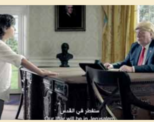
سلفين في القطر

يرى البعض ان استخدام الأطفال في الاعلانات هو نوع من الاستغلال المحرم دولياً من قبل منظمة اليونيسيف، وتلاحظ اختفاء احدى الجمعيات الخيرية من الاعلان عن التبرعات هذا العام في السياق المرصناتى بعد الجدل الذى تم تداوله حول تصريحات رئيسها، وان كانت تقدم خدماتها للفقراء في كافة نواحي الحياة من علاج ومساعدات انسانية ومفاجأة الاعلانات هذا العام اعلان القدس عاصمة لفلسطين عندما تم عرضه كاملاً، لكنهم قاموا بقصه وحذف نصف صفحة مما اقتده قوته. وفي سياق الموضوع، قال المخرج الكبير محمد هاضل، رئيس لجنة الدراما بالمجلس الأعلى للإعلام، أن الاعلانات احتلت الشاشة، وتحولت