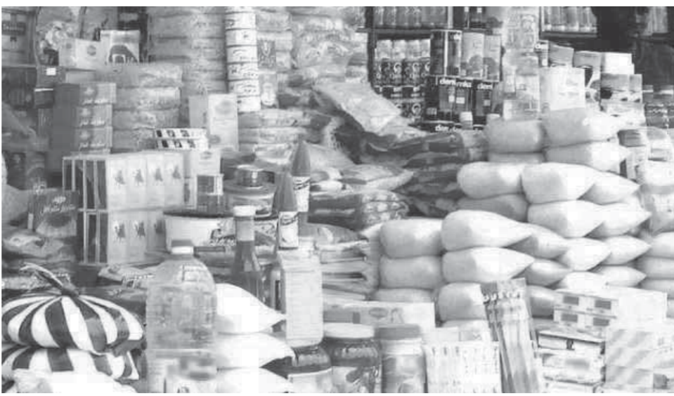
منافذ التموين لمواجهة جشع التجار

البيع التابع للقوات المسلحة تمكنت من تحقيق الغرض الذي أقيمت من أجله، وهو توفير السلع الأساسية بأسعار مناسبة لمحدودي الدخل وانتشارها وسط التجمعات السكنية مما سهل بشكل كبير على المواطنين التصدي لاستغلال التجار وتضيق الخناق على جشعهم ووقف عملية تصاعد الأسعار.