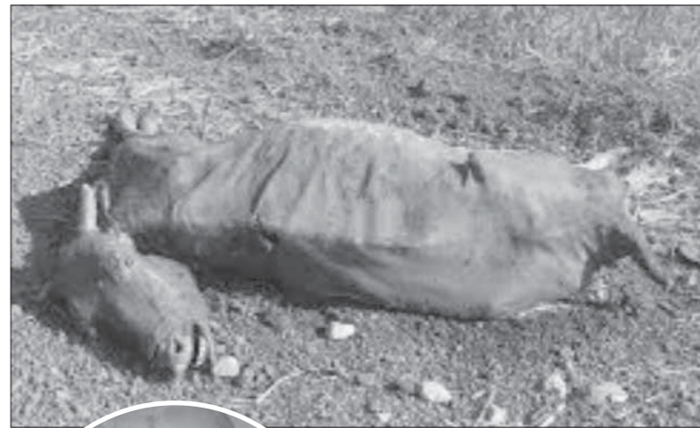
إحدى الايقار الناقفة بسبب المرض

تتابع: «اللقاح لا بد أن يكون محفوظا في درجة حرارة معينة، والمربون يقبلون على تحصين المشية الخاصة بهم ولا يتهربون من ذلك، لأن هذا التهريب قد يؤدي إلى إصابة المشية، ثم بيعها في الأسواق رغم علمهم بأنها مريضة»، مؤكدا أن هذه السلالات الخاطئة من جانب المواطنين تعد أحد الأسباب الرئيسية في انتشار الأمراض. الدكتور عادل عبدالعظيم، الأستاذ بكلية الطب البيطري بجامعة القاهرة، قال: «إن مرض الجلد العقدي ليس بجديد على مصر، فهو مرض موسمي يظهر في الصيف مع اشتداد الحرارة وانتشار الحشرات خاصة في مناطق بعض الزراعات، مثل قصب السكر». وأضاف «عبدالعظيم» أن هذا المرض يؤثر بشكل مباشر على الحيوانات ولا ينتقل للإنسان، حيث تعاني الحيوانات التي تصاب به من التورم في الرقبة والذليل وظهور عقد على الجلد، فضلا عن نقص الإنتاج من الألبان، وقد يموت عدد كبير من الحيوانات المصابة به، واصفا إياه بالمرض الخطير. وأشار الأستاذ بكلية الطب البيطري بجامعة القاهرة، إلى أن مواجهة ومقاومة هذا المرض تكون من خلال التحصين المبكر للماشية وليس قبل فصل الصيف بفترة قليلة كما يحدث الآن، كما يجب مراعاة القواعد والضوابط أثناء التحصين والتطعيم، بحيث يكون في ذيل الحيوان وليس تحت الجلد، كما يحدث حاليا، قائلا: «الحكومة بتستسهل وده السبب فيما وصلنا إليه».