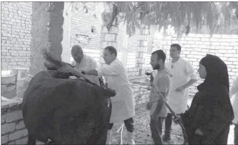
حملات الطب البيطري للتحصين ضد المرض

تتابع: «اللقاح لا بد أن يكون محفوظا في درجة حرارة معينة، والمربون يقبلون على تحصين المشية الخاصة بهم ولا يتهربون من ذلك، لأن هذا التهريب قد يؤدي إلى إصابة المشية، ثم بيعها في الأسواق رغم علمهم بأنها مريضة»، مؤكدا أن هذه السلالات الخاطئة من جانب المواطنين تعد أحد الأسباب الرئيسية في انتشار الأمراض. الدكتور عادل عبدالعظيم، الأستاذ بكلية الطب البيطري بجامعة القاهرة، قال: «إن مرض الجلد العقدي ليس بجديد على مصر، فهو مرض موسمي يظهر في الصيف مع اشتداد الحرارة وانتشار الحشرات خاصة في مناطق بعض الزراعات، مثل قصب السكر». وأضاف «عبدالعظيم» أن هذا المرض يؤثر بشكل مباشر على الحيوانات ولا ينتقل للإنسان، حيث تعاني الحيوانات التي تصاب به من التورم في الرقبة والذليل وظهور عقد على الجلد، فضلا عن نقص الإنتاج من الألبان، وقد يموت عدد كبير من الحيوانات المصابة به، واصفا إياه بالمرض الخطير. وأشار الأستاذ بكلية الطب البيطري بجامعة القاهرة، إلى أن مواجهة ومقاومة هذا المرض تكون من خلال التحصين المبكر للماشية وليس قبل فصل الصيف بفترة قليلة كما يحدث الآن، كما يجب مراعاة القواعد والضوابط أثناء التحصين والتطعيم، بحيث يكون في ذيل الحيوان وليس تحت الجلد، كما يحدث حاليا، قائلا: «الحكومة بتستسهل وده السبب فيما وصلنا إليه».