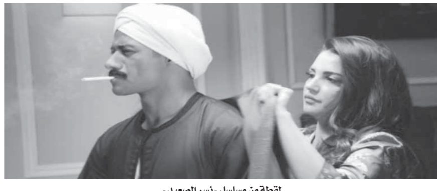
لقطة من مسلسل «نسر الصعيد»

نجحت الفنانة التونسية درة ، فى أن تضع لها بصمة خاصة بين شباب جيلها من الوسط الفنى من خلال أدائها المتميز وموهبتها. بدأت التمثيل فى تونس، وقدمت فيها أدواراً فى أربع مسرحيات، وثلاثة أفلام وثلاثة مسلسلات منها بدأتها بانضمامها لفرقة (التياترو) حيث شاركت لأول مرة فى مسرحية (مجنون) للمخرج توفيق الجبالي، ثم فى المسلسل التونسى (حسابات وعقابات) ثم مسلسل مكتوب. شاركت أيضاً بفيلمين أجنيين هما (كولوسيوم) للمخرج الإنجليزى تيلمان ريم عام 200٣ حيث جسدت فيه دور سيده الإمبراطورية وأيضاً فيلم (رحلة لوزيا) للمخرج الفرنسى بارتريك فولسون وذلك عام 2005. فى عام 2007 نجحت فى الانضمام لفرقة عمل فيلم (هى فوضى) من إخراج الراحل يوسف شاهين الذى أعجبه أداءها ومنحها الدور الذى بدأت به رحلتها الفنية فى مصر، وفى نفس العام قدمت عملين آخرين، هما (الأولة) فى (الغرام) والحب كدك) وكتب لها هذا العام شهادة ميلادها الحقيقية فى الوسط الفنى المصرى حيث لمع اسمها بسرعة فى مصر وفى غضون سنوات قليلة أصبحت وجهاً مشهوراً واشتركت فى عدة أعمال سينمائية وتلفزيونية مصرية. العام التالى مباشرة كان ظهورها الأول فى السينما المصرية شاركت فى فيلم (جنينة الأسماك)، إخراج يسرى نصر الله، ثم توالى عليها الأعمال السينمائية والتلفزيونية عقب ذلك. وتحدثت درة فى حوارها لـ «الروز» عن طبيعة دورها فى مسلسل «نسر الصعيد»، كما تكشف عن ردها أفعال الجمهور حول مسلسل «الشارح الذى ودانا»، وما المعايير التى تختار أعمالها بناء عليها. والى نص الحوار: ■ كيف استقبلت ترشيحك فى مسلسل «نسر