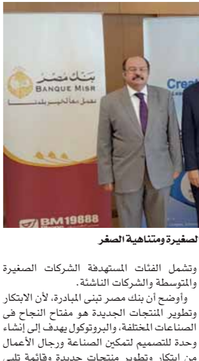
بنك مصر يدعم المشروعات الصغيرة ومتناهية الصغر

وأضاف أن البروتوكول يتضمن تنظيم دورات تدريبية وورش عمل للشركات الناشئة وأصحاب الشركات الصغيرة والمتوسطة في مجالات