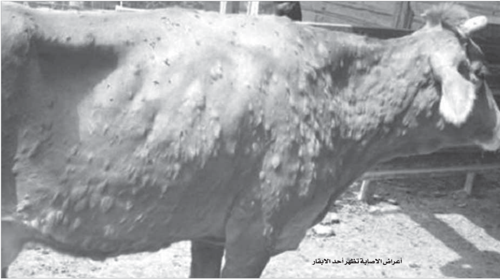
أعراض الإصابة تظهر أحد الايقار

بشكل مفاجئ وسريع ضرب مرض الجلد العقدي -أحد الأمراض المستوطنة في مصر- ماشية محافظة بنى سويف، فقتل خلال ساعات 100 بقرة. الانتشار السريع لهذا المرض رغم معرفة موسم الذي يبدأ مع الصيف، أدى إلى غلق جميع أسواق المشية في المحافظة وعددها 12 سوقا، الأمر الذي قد يؤثر على أسعار اللحوم الحمراء خلال شهر رمضان المعروف بالاستهلاك الكثيف لها من جانب المصريين. الجلد العقدي يعود تاريخ ظهوره في مصر إلى عام 1988، وتسبب في خسائر اقتصادية كبيرة في الثروة الحيوانية المصرية، ومنذ ذلك التاريخ بدأت الحكومة في تحسين المشية منه إجباريا ومجانا بشكل سنوي، إلا أنه في عام 2014 تم تعديل قانون الزراعة وسمح للوزارة بتحصين رسوم نظير التحصين تبلغ 8 جنيهات للمصل الواحد ما أدى إلى تهرب بعض المربين من تحصين المشية الخاصة بهم. خبراء الطب البيطري يحذرون من خطورة انتقال هذا المرض إلى المحافظات الأخرى في حالة تكاسل وإهمال الحكومة عن مقاومته ومكافحته في بنى سويف، مؤكدين أن هذا المرض وغيره من الأمراض التي تصيب الحيوانات مثل الحمى القلاعية قد تؤدي إلى تناقص الثروة الحيوانية في مصر تدريجيا والتي تقدر بنحو 230 مليار جنيه.