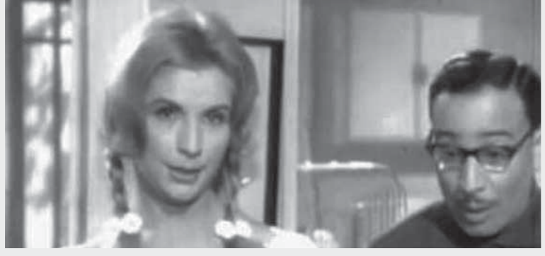
فؤاد المهندس وصباح