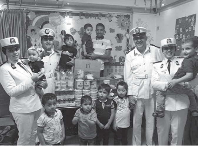
وفد من الضباط اثناء زيارة عدد من دور الايتام ذوى الإعاقة