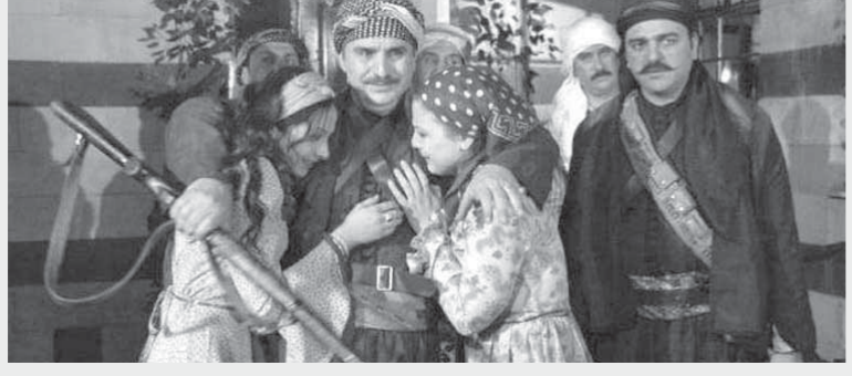
لقطة من مسلسل «باب الحارة»