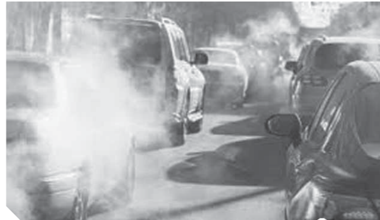
عواصم السيارات اختفت بسبب كورونا

وأكدت الصور التي التقطتها الأقمار الصناعية انخفاض الانبعاثات الضارة في عدد من العواصم الأوروبية مثل باريس ولندن وروما وغيرها، وكانت منظمة الصحة العالمية والتحالف الدولي من أجل المناخ والهواء النقي تقودان حملة عالمية لرفع مستوى الوعي حول مخاطر تلوث الهواء على الصحة، وأكدت المنظمات أن تلوث الهواء يتسبب كل عام في وفاة ٦ ملايين شخص