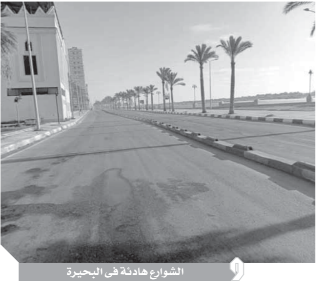
الشوارع هادئة في البحيرة