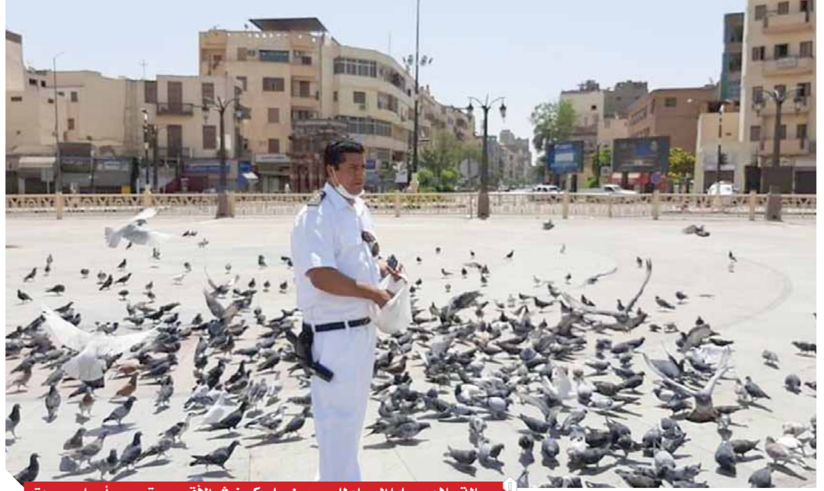
رسالة سلام يحملها الحمام للمصريين على كورنيش الأقصر