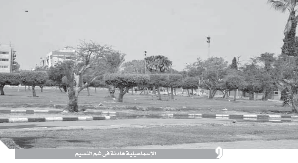
الإسماعيلية هادئة في شم النسيم