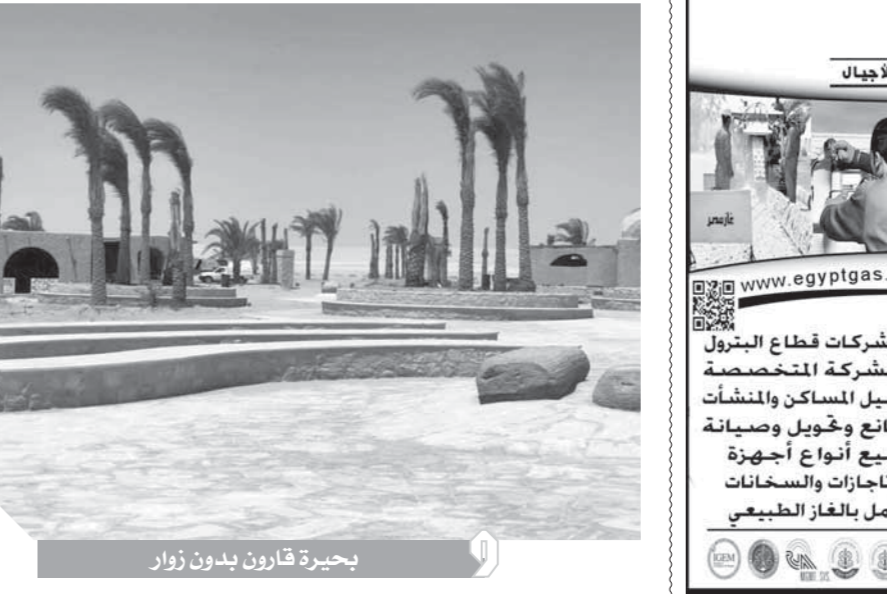
بحيرة قارون بدون زوار