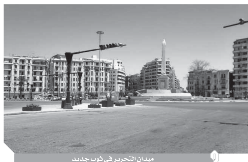
ميدان التحرير في ثوب جديد