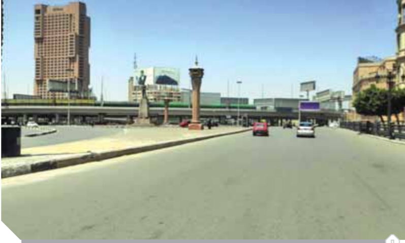
كورنيش القاهرة خال في شم النسيم