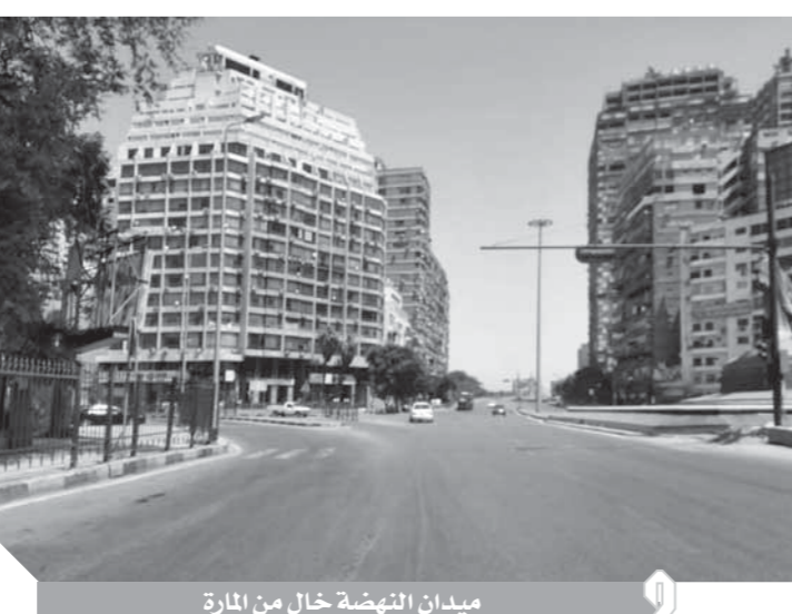
ميدان النهضة خال من المارة