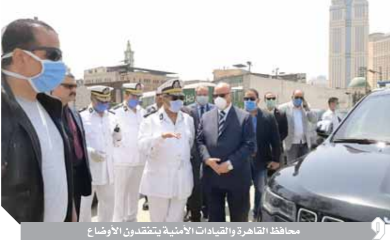
محافظ القاهرة والقيادات الأمنية يتفقدون الأوضاع