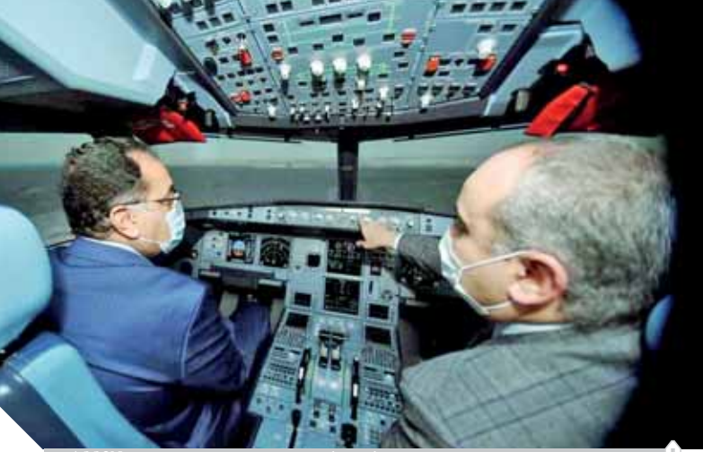
وزير الطيران يشرف رئيس الوزراء على تشغيل أحدث أجهزة الطيران التمثيلي A320Neo