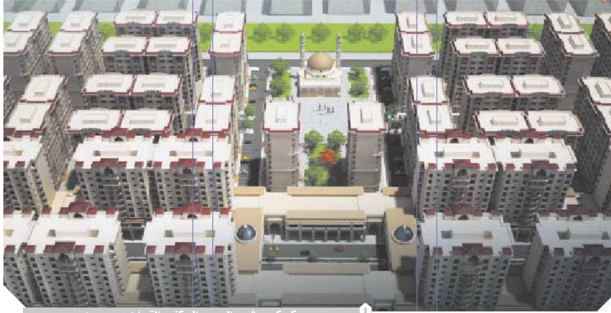
مشروع المجمع السكني والتجاري ببورسعيد

بعد أن تأخر الطرح الأعمال لمدة ٤ سنوات ورحيل المحافظ اللواء أحمد عبدالله وتولى المسؤولية من بعده من اللواء سامح قنديل تم اللواء مجدي نصرالدين وبدأ الشباب يسأل عن مصيره بعد أن بدأت ملامح مشروع الإسكان الاجتماعي تظهر وتأخر المشروع التعاوني ووقف حالة الجمود في الشارع بورسعيد ونظرا لارتفاع أسعار مواد البناء قرر اللواء عادل