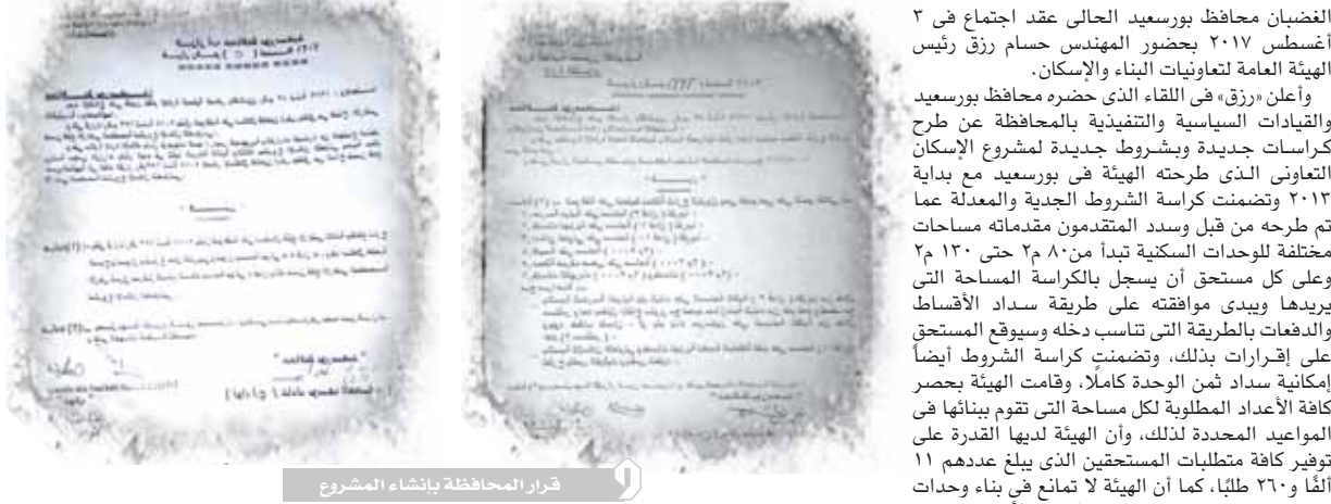
قرار المحافظة بإنشاء المشروع

الغضبان محافظ بورسعيد الحالي عقد اجتماع في ٢ أغسطس ٢٠١٧ بحضور المهندس حسام رزق رئيس الهيئة العامة لتعاونيات البناء والإسكان، وأعلن «رزق» في اللقاء الذي حضره محافظ بورسعيد والقيادات السياسية والتفندية بالمحافظة عن طرح كراسات جديدة وبشروط جديدة لمشروع الإسكان التعاوني الذي طرحته الهيئة في بورسعيد مع بداية ٢٠١٣ وتضمنت كراسة الشروط الجديدة والمعدلة عما تم طرحه من قبل وسدد المتقدمون مقدماته مساحات مختلفة للوحدات السكنية تبدأ من ٨٠ من ٢٠٠ م٢ وعلى كل مستحق أن يسجل بالكراسة المساحة التي يريدتها ويدي موافقتها على طريقة سداد الأقساط والدفعات بالطريقة التي تناسب دخله وسيقوم المستحق على إقرارات بذلك، وتضمنت كراسة الشروط أيضاً إمكانية سداد ثمن الوحدة كاملاً، وقامت الهيئة بحصر كافة الأعداد المطلوبة لكل مساحة التي تقوم ببنائها في المواعيد المحددة لذلك، وأن الهيئة لديها القدرة على توفير كافة متطلبات المستحقين الذي يبلغ عددهم ١١ ألفاً و٦٨٠ طلباً، كما أن الهيئة لا تمنع في بناء وحدات مساحة ٨٠ م٢ بدون تشطيب وبأسعار المساحين طرحها قبل ثلاث سنوات بشرط موافقة المستحقين على ذلك.