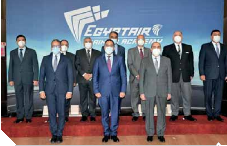
رئيس الوزراء ووزيرا السياحة والسياحة وقيادات الطيران ولقطة تذكارية