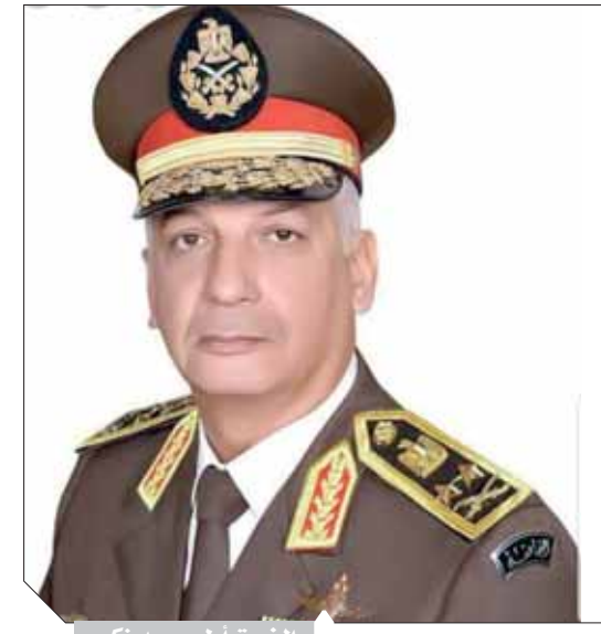
الفريق أول محمد زكى

كتب: محمد صلاح وأبو زيد كمال وسامية فاروق؛ غادر القاهرة صباح أمس الفريق أول محمد زكى القائد العام للقوات المسلحة وزير الدفاع والإنتاج الحربى على رأس وفد عسكري رفيع المستوى متوجهاً إلى دولة الإمارات العربية المتحدة فى زيارة رسمية تستغرق عدة أيام للمشاركة فى فعاليات معرض الدفاع الدولي الخامس عشر (IDEX 2021) والمعرض البحرى المصاحب له (NAVDEX2021) اللذين تستضيفهما العاصمة الإماراتية (أبو ظبى) حتى الخامس والعشرين من فبراير الجارى. ومن المقرر أن يجرى الفريق أول محمد زكى القائد العام للقوات المسلحة عدة مباحثات على هامش المعرض مع عدد من وزراء الدفاع وكبار المسئولين من مختلف الدول المشاركة ليبحث