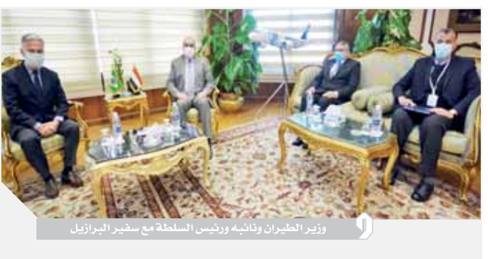
وزير الطيران وقناصله ورئيس السفارة مع سفير البرازيل

خط طيران بين القاهرة ومدينة ساو باولو البرازيلية. ومن جانبه أكد وزير الطيران المدني أن العلاقات السياسية والاقتصادية والتجارية بين مصر والبرازيل تسمم بالإيجابية والتفاهم والتعاون المتميز حيث امتدت لعقود عديدة، وأشار إلى أن وزارة الطيران المدني المصري تسعى نحو فتح آفاق جديدة للتقارب مع البرازيل في مجالات وأنشطة النقل الجوي المختلفة، وذلك بما يتماشى مع الجهود الكبيرة التي تبذلها الحكومة المصرية على جميع الأصعدة وفي مختلف المجالات لتحقيق أعلى معدلات التنمية الاقتصادية. وفي نفس السياق أثنى أنطونيو باتريوتا على دور قطاع الطيران المصري في تعزيز وتعميق العلاقات الثنائية بين البلدين وخاصة أن هناك علاقات تاريخية واستراتيجية قوية تربط بين البلدين، كما أن الحكومة البرازيلية تسعى إلى فتح مجالات جديدة وجذب العديد من المشروعات الاستثمارية في مصر خاصة لما حققته جمهورية مصر العربية من نموًا اقتصاديًا إيجابيًا في منطقة الشرق الأوسط وشمال أفريقيا خلال الفترة الماضية.. كما قدم السفير البرازيلي الشكر لوزير الطيران المدني على حفاوة الاستقبال وحسن استضافة منتخب البرازيل لكرة اليد ببطار القاهرة خلال مشاركته في بطولة كأس العالم لكرة اليد للرجال التي أقيمت في مصر الشهر الماضي.