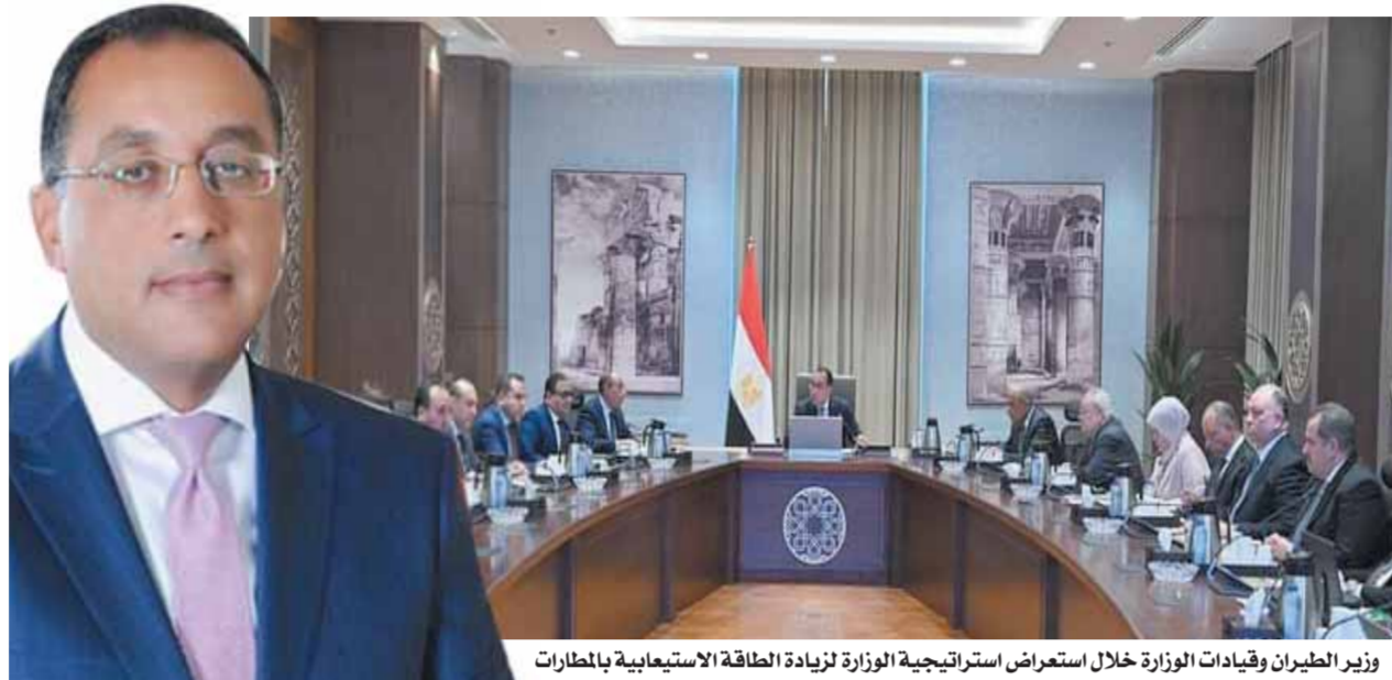
وزير الطيران وقيادات الوزارة خلال استعراض استراتيجية الوزارة لزيادة الطاقة الاستيعابية بالمطارات