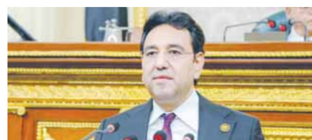
د. أمين محسب

أكد الدكتور أمين محسب، عضو مجلس النواب، ومقرر لجنة أولويات الاستثمار بالحوار الوطنى، أهمية وثيقة «أبرز التوجهات الاستراتيجية للاقتصاد المصرى للفترة الرئاسية الجديدة (٢٠٢٤ - ٢٠٢٢)»، التى طرحها الحكومة للحوار المجتمعى، والتى ستكون على مائدة الحوار الوطنى في مرحلته الثانية، وهو ما يعكس رغبة الدولة المصرية بقيادة الرئيس عبدالفتاح السيسى على توسيع دائرة النقاش حول الوثيقة التى تحدد توجهات الاقتصاد المصرى خلال السنوات الست المقبلة، من خلال الاستماع إلى آراء الخبراء والمتخصصين وأصحاب المصلحة وغيرهم من المشاركين في جلسات الحوار الوطنى.