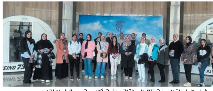
شباب الجامعات المصرية خلال الجولة التعريفية بأكاديمية مصر للطيران للتدريب

لعدد كبير من الشباب بواسطة «شركة ميدكس للتدريب وتكنولوجيا التعليم»، وذلك لتعمية الوعي لديهم بمنظومة سلامة الغذاء على الطائرة وكسابهم المهارات اللازمة وإعدادهم لسوق العمل في هذا المجال. ويتضمن البرنامج التدريبي جولات تعريفية متتالية تشرح جميع أنشطة الأكاديمية