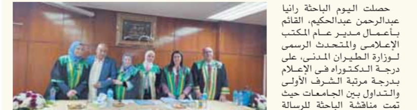
لجنة التحكيم والمناقشة بعد حصول الباحثة على درجة الدكتوراه

الأبعاد المؤثرة في جودة الأنشطة الاتصالية لوزارة الطيران المدني في مصر «دراسة تطبيقية» في رسالة دكتوراه