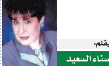
بقلم: ستاء السيد