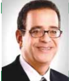
بقلم: طارق عبد العزيز