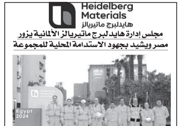
مجلس إدارة هايدلبرج ماتيريزالز الألمانية يزور مصر ويشيد بجهود الاستدامة المحلية للمجموعة