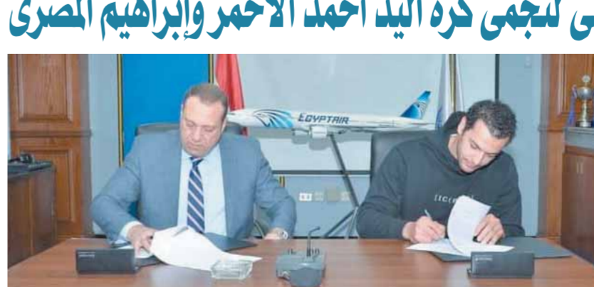
طيار محمد موسى رئيس مصر للطيران للخطوط الجوية خلال توقيع بروتوكول الناقل الرسمي لنجمي كرة اليد

طوكيو 2020، كما حصل مع النادي الأهلي على كأس السوبر الأفريقي 3 مرات ودوري أبطال أفريقيا مرتين من كأس العالم 2021 و2023 وأولمبياد