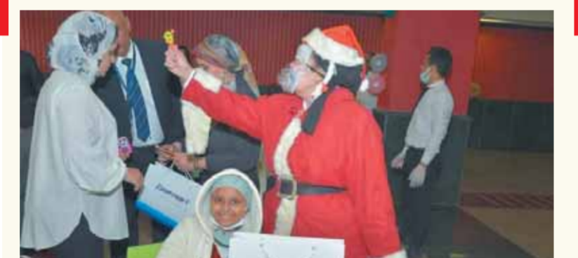
أطفال مستشفى «57357»، خلال جولتهم الترفيهية بأكاديمية مصر للطيران للتدريب

الأطفال: سعادة بالتجربة داخل نماذج المحاكاة والتعرف على مهام قائد الطائرة والضيافة الجوية