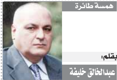
بقلم: عبد الخالق خليفة

رئيس الوزراء: الاستعانة بشركات خاصة في إدارة وتشغيل المطارات لتحسين الخدمات وزيادة الإيرادات