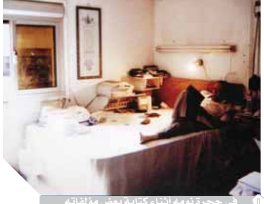
في حجرة نومه أثناء كتابة بعض مؤلفاته