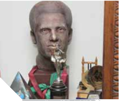
تعالى نعتي الدكتور مصطفى محمود

● وماذا عن علاقته بالرئيس الراحل مبارك؟ - لم تكن هناك أي علاقة بينهما، حتى إن برنامجه توقف في عهده على يد صفوت الشريف وزير الإعلام وقتها. ● ما رأيك في خطوة تقديم عمل علمي عن حياة الراحل الكبير ومن تربيته من الفنانين يصلح لأداء شخصيته؟ - بالطبع أرحب بتقديم مسلسل عن حياة والدي، وكانت هناك بالفعل فكرة بذلك لكن أزمة الفن حاليا وكورونا وقتت عائقا أمام هذا العمل، لكنني لا أستطيع تزجج ممثل بعينه لأداء شخصية هذا العالم الكبير.