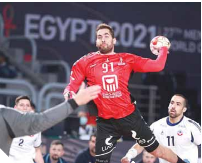
ستد تاتى مع منتخب اليد بالمونديال