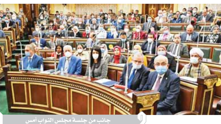
جانب من جلسة مجلس النواب أمس