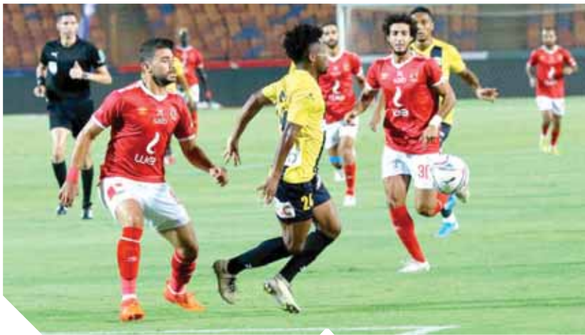
الأهلى يسعى لعبور عقبة المقاولون