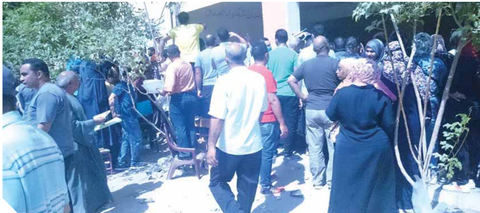
اقبال على تصالح لمخالفات البناء - صورة إرشيفية

المؤشرات الأولية: الحصيلة تقترب من ١٠٠ مليار جنيه.. و ٢,٧ مليون مواطن طلبوا التصالح.. و «البقية تأتي»