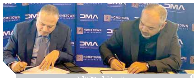
جانب من توقيع الاتفاقية

بالكامل، مشيرًا إلى أنه سيتم طرح المرحلة الثانية قريباً. وذكر أنه من المخطط بدء تسليم وحدات هذا المشروع اعتباراً من ١ يوليو ٢٠٢٣، لافتاً إلى أن الشركة بدأت فى الإنشاءات بالمشروع مطلع العام الجارى.