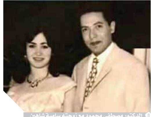
الدكتور مصطفى محمود مع زوجته سامية شاهين

● إذا تحدثنا عن علاقته بالموسيقى وما الذي كان يبيبه وأبرز هواياته فماذا تقولين؟ - كان متددا للهوايات، وصلته بالموسيقى كانت قوية جدا، وكان يحب الفلك وعلوم الفضاء واشترى تليسكوبا ضخما ووضعه فوق المسجد ليرى النجوم والكواكب، بالإضافة إلى الفنون بجميع أنواعها، والنحت والرسم، ولذلك كان أحدفاؤه من فئات عديدة سواء في مجال الإخراج أو فنانين أو رسامين، وهذا ما كان طفلا عشقا للثاني وكانت لديه مجموعة كبيرة منه، وكان يشعر بأن صوت الناي به شجن، وحزن راق ويستمتع بصوته جدا، ثم عشق العود بعد صداقته بالموسيقار محمد عبدالوهاب، أما بكازو فكان يبيكي في لحظات الإحساس بالظلم خاصة إذا وقع هذا الظلم على أحد ولم يستطع أن يساعد، وكنت أشعر أن هذا يضايقه كثيرا، أيضا رأيت لحظات البكاء في عينيه بشدة بعد فراقه والدي وطلاقة لها بفترة، فكان يفكر بها دائما لأنه كان يحبها وتعبه، وكان هذا شيئا مشتركا بينهما، فكل منهما كان يعشق الآخر.