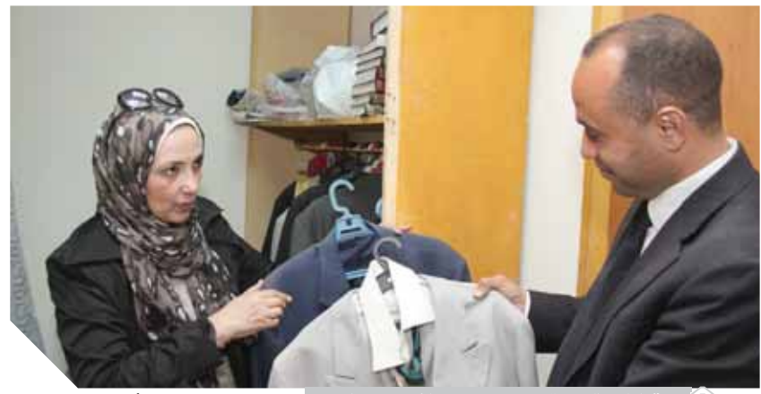
الابنة المفكر الكبير تستعرض بعض ملابسه مع المحرر

صرف، «فهايا كان ناديا فليس لكن زملاء ومنهم كامل الشاوي واحسان عبدالقدوس ولويس جريس ومحمد عبدالوهاب وقفا إلى جواره وبدلوا مساعي كبرى حتى عاد للكتابة مرة أخرى، بالرغم من أنه كان ينتقد فترة عبدالناصر. فملاقاته بعدالتناصر كان يلبس عليها التور، أما الرئيس السادات فكان مقربا منه جدا، حتى إن السادات كان يأمر بنشر كل مقالاته ومسرحياته، وأصبح صديقا شخصيا له منذ أم كان نائباً للرئيس عبدالناصر وكثيرا ما كان يستضيفه «السادات» في بلدته «ميت ابوالكوم» بالمقوية يصلى معه الجمعة ويتناولان الغداء ويتبادلان أطراف الحديث في قضايا عدة، حتى إنه عرض عليه الوزارة لكنه رفض وفضل الاستمرار في حياته العلمية والفكرية.