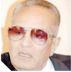
بهاء الدين أبوشققة