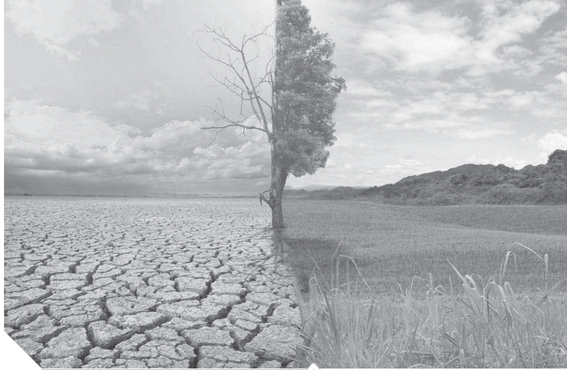
التغير المناخي يؤثر على كل القطاعات الاقتصادية

في تفعيل سياسات الحوكمة وترسيخ ثقافة الصيرفة المسؤولة التي تستدعي تحديد أهداف تتعلق بالمجالات الأكثر تأثيراً لهم والتي من شأنها التوجه العام نحو التنمية المستدامة. والمبدأ السادس والأخير يركز على الشفافية والمسؤولية -Transparency & Accountability والذي يستلزم مراجعة التنفيذ الفردي والجماعي لهذه المبادئ بشكل دوري لضمان الشفافية ومسؤولية المؤسسات المالية في الإفصاح عن الأعمال والتأثيرات الإيجابية والسلبية والمساهمة في أهداف المجتمع.