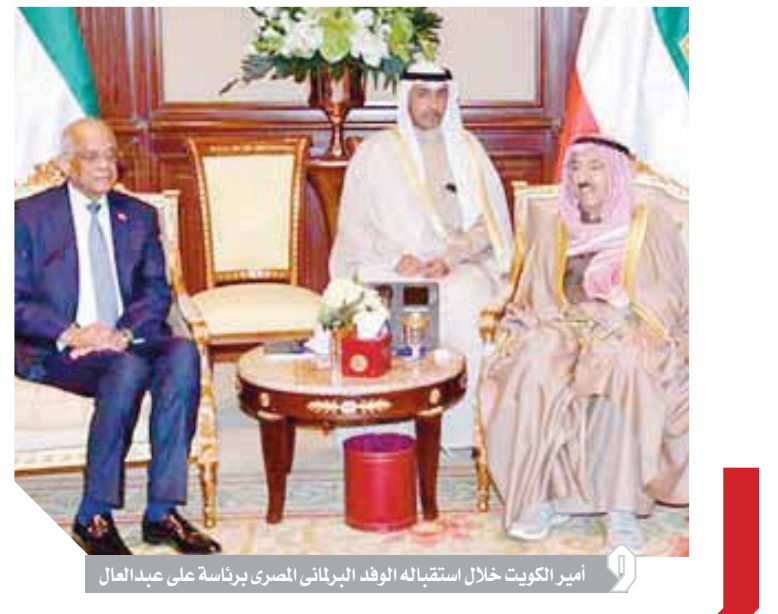
أمير الكويت خلال استقباله الوفد البرلمانى المصرى برئاسة على عبدالعال

الخليج بعد خطأ أحمر لمصر، وأكد أهمية التنسيق مع الكويت بشأن مواجهة التحديات والتهديدات التى تواجهها المنطقة، وأن كلا البلدين يقفان معاً فى خندق واحد. وأعرب عن تقديره لدور القيادة الكويتية، الداعمة للاقتصاد المصرى منذ 30 يونيو 2013، ودعم الدولة الكويتية لمسيرة الإصلاح الاقتصادى بمصر، وأشار إلى التطورات الإيجابية الأخيرة فى العلاقات بين البلدين، التى تعكس التوافق فى الرؤى وجهات النظر تجاه العديد من القضايا ذات الاهتمام المشترك، وفى مقدمتها مكافحة الإرهاب. كما أكد «عبدالعالم» أهمية التنسيق بالموقف الثابت لمصر والكويت فى مساندة الحق الفلسطينى فى إقامة الدولة الفلسطينية على حدود يونيو 67. كان الوفد البرلمانى المصرى برئاسة الدكتور على عبدالعال قد قام بزيارة إلى الكويت، وأجرى مباحثات برلمانية مع قيادات مجلس الأمة الكويتى.