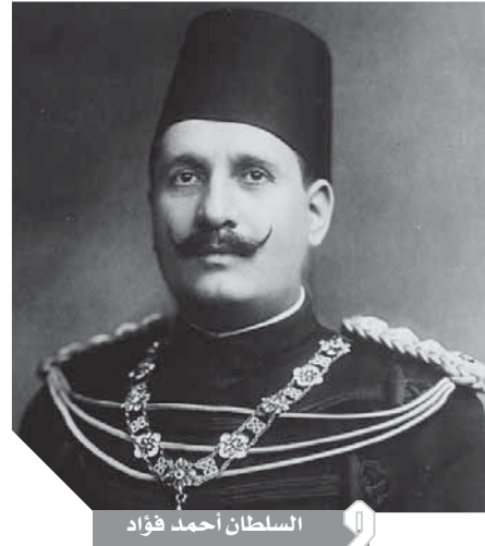
السلطان أحمد فؤاد