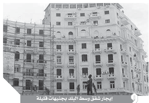
إيجار شقق وسط البلد بجنيتها قليلة