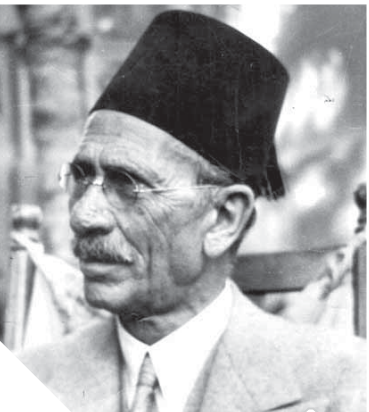
أحمد لطفى السيد