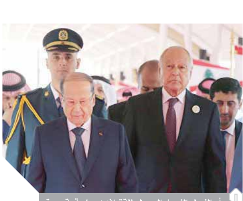
أبوالمفتى والرؤساء العرب لحظة توافدهم على قمة بيروت

أكد أحمد أبوالمفتى، الأمين العام للجامعة العربية فى كلمته، أن الإسراع بانتشال أكبر عدد من السكان من فوة الفقر المدقع هو الطريق الأمثل لتخفيف مناع التطرف والإرهاب، مشيراً إلى أن نحو 20% من سكان العالم العربى يعيشون فى أوضاع تدخل تحت مسمى الفقر متعدد الأبعاد. وأضاف «أبوالمفتى»، أن الأزمات التى تحاصر عدداً من الدول العربية، أفرزت موجات من اللجوء والنزوح، معرباً عن أسفه من أن العالم العربى يؤول نحو نصف لاجئ ومشرد فى العالم، وأن 4 ملايين طفل سورى قد تركوا مدارسهم؛ بسبب الحرب الدائرة منذ سبع سنوات، فضلاً عن الأزمات الإنسانية الخطيرة فى كل من الصومال واليمن، مشيراً إلى الواقع المأساوى الذى يكابده يوماً الشعب الفلسطينى فلسطينى؛ بسبب ما يفرضه الاحتلال الإسرائيلى من إغلاق وحصار وممارسات متجحفة.