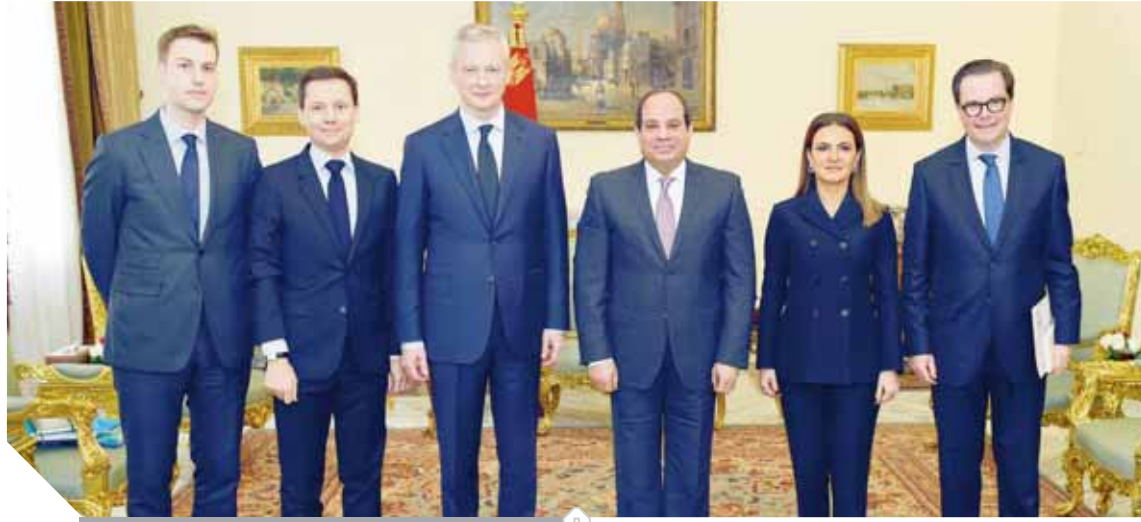
السيسى، خلال لقائه مع وزير المالية الفرنسى

المرحلة المقبلة من أجل تحقيق نقلة نوعية في تلك العلاقات والارتقاء بها إلى آفاق أرحب في المجالات كافة، بما في ذلك تعظيم التنسيق والتشاور بين مصر وفرنسا حول مختلف القضايا الإقليمية والدولية ذات الاهتمام المشترك من أجل مواجهة التحديات القائمة في هذا الخصوص، وعلى رأسها الأزمات الراهنة بالشرق الأوسط والتي تمتد تداعياتها إلى منطقة البحر المتوسط.