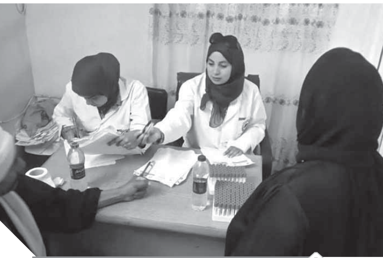
متابعات المرضى أول بيزول