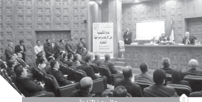
جانب من الندوة

حافظت على حقوق المسلمين وغير المسلمين، وقد جرى تناولها بالدراسة والبحث العلمى على مدار الستين للاستفادة منها وخلصت إلى المساواة بين كل المذاهب أمام الحقوق والواجبات في مكونات الدولة. وشدد على أن الشريعة الإسلامية تؤكد إقامة الدول على دساتير بمفهومه الحديث والفصل بين السلطات من خلال مفاهيم مثل القسط، والعدل، والبر وهي ما يعادلها من مصطلحات جاءت لدى الفلاسفة المعاصرين في كتاباتهم عن أركان الدولة. وأكد أنه على الجانب الآخر، استقرت التيارات الإرهابية على مصطلحات مثل «الحاكمية والتكفير» التي تبناها مؤسسو جماعة الإخوان الإرهابية «حسن البنا، وسيد قطب، وامتدادها إلى انتفاخ الدين عن الوجود حتى بلغت تلك الأفكار إلى نشأة تنظيم «داعش» الإرهابي، وتبنى رأس التنظيم أبو بكر البغدادي تلك المفاهيم، مثل غيره من الجماعات المتطرفة حول العالم ومنها «القاعدة» و«طالبان» و«حزب الأزهري» من مصطلح «الولاء والبراء» الذي تستغله الجماعات الإرهابية والمتطرفة لغرسه في نفوس الشباب من خلال عمليات غسل عقولهم لتسلف فكرة الولاء وسرقة العقول والتطرف بالأمم الإرهابية ضد المجتمع ودور العبادة واستعمال مصطلحات الخلافة والاستعلاء، «بلغ من أجل تحويل الشباب المتطرف إلى قتلة»