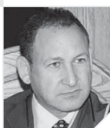
بقلم المستشار الدكتور محمد عبدالوهاب فخاجي