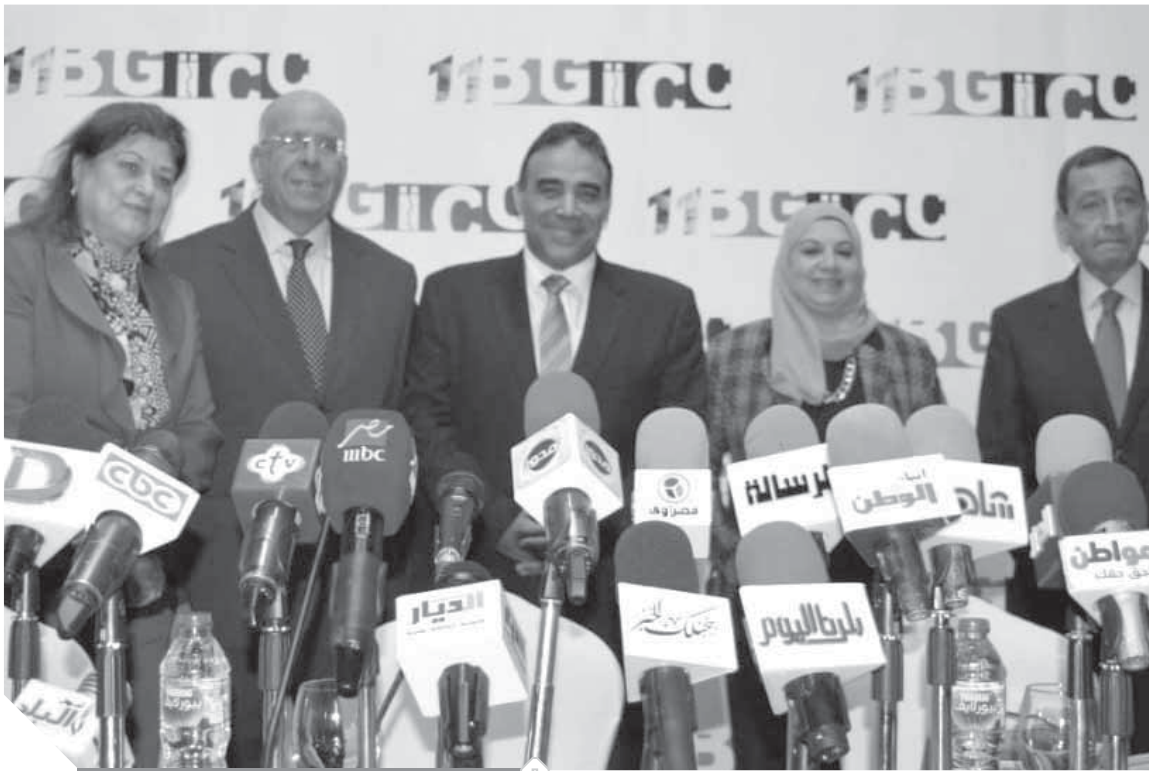
المؤتمر يناقش العلاج المناعي من أورام الثدي