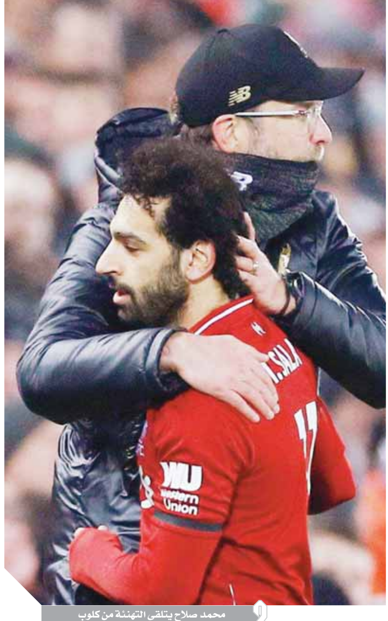
محمد صلاح يتلقى التهنية من كلوب

ويهدفيه فى شباك كريستال بالاس وصل «صلاح» إلى هدفه رقم 50 فى الدورى الإنجليزى الممتاز، خلال 72 مباراة لعبها فى البريميرليج، منها 48 مع ليفربول وهدفان فقط مع تشيلسى ليكون بذلك أول لاعب عربى وإفريقي يحقق هذا الإنجاز ورابع أسرع لاعب فى تاريخ المسابقة يصل إلى هذا العدد من الأهداف. وكان يورجن كلوب، المدير الفنى لنادى ليفربول، المدح لنجمه المصرى بعد وصوله للرقم 50 فى الدورى الإنجليزى، وتحدث خلال المؤتمر الصحفى بعد المباراة، مؤكداً أن إنجاز «صلاح» متوقع لكونه لاعباً عالمياً. وقال المدير الفنى لليفربول: «(صلاح) لاعب من الطراز العالى، أن يصل إلى هدفه رقم 50 فى البريميرليج هو أمر متوقع لأنه لاعب عالمى». وأضاف: «لقد سمعت أن عدداً قليلاً فقط من النجوم سبقوه لهذا الرقم بسرعة أكبر منه، الآن شيرارد رود هان نيسنتروى وأندى كول، لقد كانوا مهاجمين جيدين أيضاً». وأكمل: «ريما كان يمكن لمحمد صلاح الوصول لهذا الرقم بسرعة أكبر لو لم أضع به فى مركز الجناح فى العديد من المباريات» فى إشارة لما تاله هو بنفسه من انتقادات بعد تغييره لمركز النجم المصرى. واختتم تصريحاته: «لكننا فى الوقت الحالى فى موقف مريح للجميع، فهو يستفيد من طريقة لعب الفريق والجميع يستفيد من رغبته الواضحة فى تسجيل الأهداف».