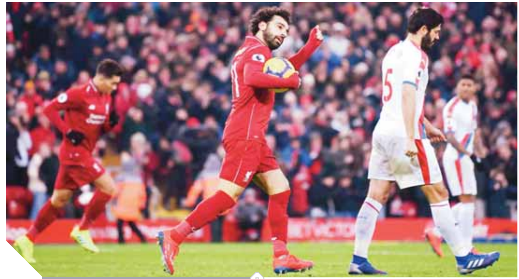
صلاح وفرحة التسجيل