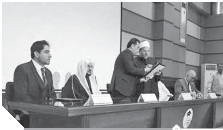
افتتاح أكاديمية الدعاة

افتتح أمس الدكتور محمد مختار جمعة، وزير الأوقاف، الأكاديمية الدولية لتدريب وتأهيل الأئمة والدعاة والواعظين، ضمن فعاليات المؤتمر الدولي لوزارة الأوقاف في دورته التاسعة والعشرين، حيث ينظمه المجلس الأعلى للشؤون الإسلامية ويرعاه الرئيس عبدالفتاح السيسي. رحب الدكتور محمد مختار جمعة، وزير الأوقاف، بالوزراء والمفتين ورجال الدين في العالم الإسلامي، لمشاركتهم افتتاح الأكاديمية الدولية لتدريب وتأهيل الأئمة والدعاة والواعظين. أكد وزير الأوقاف، أن أكاديمية الدعاة سوف تستقبل المتدربين من أبنائها، ومن دول العالم في إقامة كاملة، وأشار إلى أن الأكاديمية هي ترجمة عملية لما طلبه الرئيس عبدالفتاح السيسي رئيس الجمهورية، في تكوين رجل الدين المثقف المستنير.