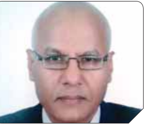
د. مصطفى عبدالرازق

الاتحاد تقريباً- فى الكونجرس، يقع تفسير إرهائى يجهز على كل القيادات الأمريكية بمن فيهم الرئيس ونائبه وكل الوزراء وأعضاء الكونجرس باستثناء الوزير رقم 11 فى ترتيب الوزراء وهو وزير الإسكان- وضعه حوماً غير وضع وزيرنا الدكتور مدبولى فى حكومتنا- فهو لا حول له ولا قوة، وهو يكاد يكون ملفوظاً من الرئيس الذى كان يخطط قبل يوم من التفتيش لإقالته، وفى ضوء عمله بذلك يبدأ الوزير المشار إليه بالإعداد لخطة ما بعد الإقالة. وإلى جانب الوزير، لم ينح من التفتيش سوى عضوة بالكونجرس لعدم حضورها فعاليات الخطاب. لكن تأتى الرياح بما لا تشتهي السفن، فعلى ضوء تصفية الشبكات الأمريكية من الألف إلى الياء لم يبق سوى ذلك الوزير الذى ينظر إليه باعتباره خيال مادة فى ضوء هودته ونظرة للحياة التى تقوم على أساس الاخلاقي قد ترى أنه يشوبه قدر من التزمت، إلى الحد الذى قد تتساول معه كمشاهد عن سبب اختياره كوزير، ولعل ذلك من السبب فى عدم إرتياح الرئيس ضحية الانتفاجر له. وإن اذنا كان الله يغير أحوال البشر بين لحظة وأخرى من حال إلى حال، فقد تحول صاحبنا فى لبح البصر إلى رئيس للولايات المتحدة حيث تم اقتياده للبيت الأبيض، وطالب منه توجيه بيان إلى الأمة يدعوها فيه إلى الرحيل، ونسب إلى أزمات متعددة للرئيس الجديد استنفدت جزءاً كبيراً من وقته فى مواجهتها؟ فهل كان الرجل على خطأ أم أننا يجب أن نساير الحياة، ونقر بأننا بشر، فى النهاية، وأن الكذب والخديعة جزء من طبيعتنا. ويجب أن نعايش معها كما نعيش، ونأكل كما نتزوج النساء.. سؤال اغترف بالعجز عن الإجابة عنه!!