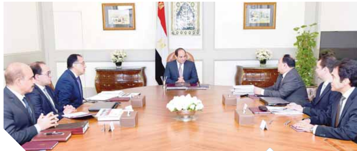
السياسى يستعرض مؤشرات الأداء خلال اجتماعه برئيس الوزراء ووزير المالية