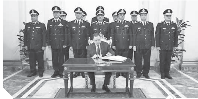
اللواء محمود توفيق يسجل كلمة الشكر

توجه اللواء محمود توفيق، وزير الداخلية، وأعضاء المجلس الأعلى للشرطة أمس، للقصر الجمهورى بعبادين لتسجيل كلمة شكر وتقدير للرئيس عبدالفتاح السيسي في إطار الاحتفال بعيد الشرطة، أعرب وزير الداخلية عن سعاداته وتقديره، وكذلك أعضاء المجلس الأعلى للشرطة بمناسبة الاحتفال بالذكرى السابعة والستين لعيد الشرطة، تابع وزير الداخلية في كلمته: تلك الذكرى الوطنية الخالدة التي سطر لها التاريخ أروع البطولات في التضحية حين وقف رجال الشرطة يساندنهم أبناء الشعب المصرى العظيم دفاعاً عن استقلال الوطن ورفقته، تابع الوزير وأعضاء المجلس الأعلى للشرطة: اليوم يسجل التاريخ انتفاخ الشعب العظيم حول قيادته لتدعيم أركان الدولة المصرية ودفع مسيرة التنمية الوطنية فتحية لكم سيادة الرئيس قائداً لمسيرة الوطن ونحن في جهاز الشرطة على عهدنا نمنى خلف قيادتكم أصدق أداء وعطاء.