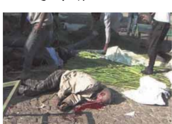
جرائم أبي أحمد ضد التيجراي

الثلاثين عامًا الماضية قد أثارت الانقسامات بين الجماعات العرقية واللغوية وتتهم جبهة التحرير الشعبية لتحرير تيجراي وحلفاؤها أبي أحمد بتشجيع السياسات التمييزية التي تمنع هذه الجماعات من حماية ثقافتها والاسمى لتحقيق مصالح سياسية إقليمية.