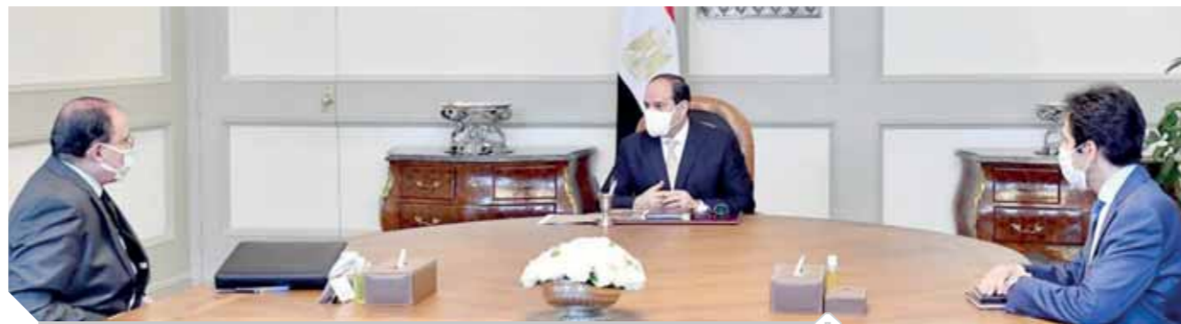
السيسى خلال لقائه مع مستشار الرئيس للتخطيط العمرانى

خلال عدة محاور استهدفت النهوض بمستوى معيشة المواطنين وتحسين مودلت الفقر وتطوير البنية التحتية والخدمات الأساسية المقدمة إليهم، لا سيما في عدد من المجالات كالتعليم والمدارس والإسكان والكهرباء والصرف الصحى ومياه الشرب والغاز