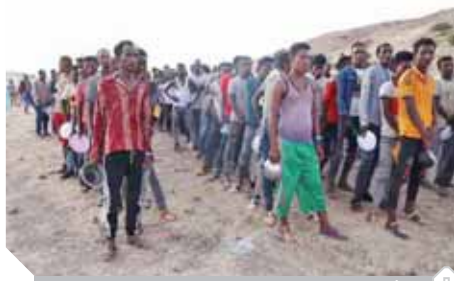
أزمة إنسانية واسعة تهدد إقليم، تيجراى،