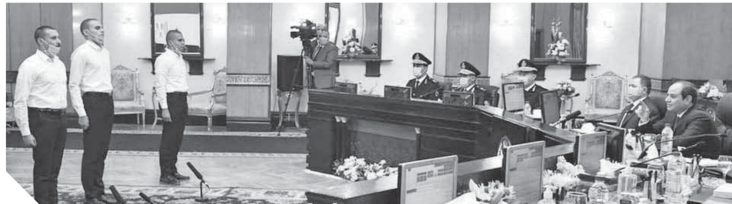
الرئيس يناقش بعض الطلاب المتقدمين لكلية الشرطة