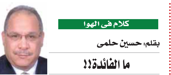
بقله: حسين حلمى