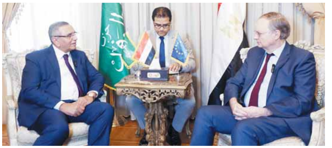
الدكتور عبدالسند يمامة خلال استقباله سفير الاتحاد الأوروبي بالقاهرة

ممارسات الاحتلال تهدد استقرار الشرق الأوسط لا بد من توصيل المساعدات لأهالي غزة