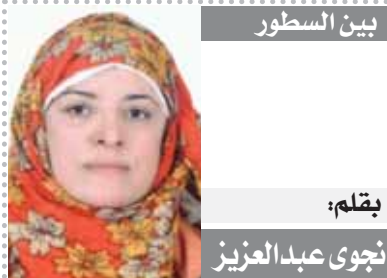
بين السطور بقلم: نجوى عبد العزيز