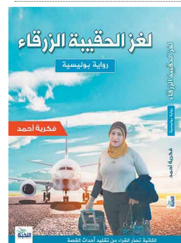
الغالبية تحذر القراء من تقليد أحداث القصة

وتدور رواية لغز الحقيبة الزرقاء، حول قيام عصابة خطيرة باستبدال حقيبة السفر الخاصة بوالدة المغامرين الثلاثة في المطار، وذلك أثناء مجيئها لمصر بصحبتهم لقضاء إجازة الصيف، واعتقدت الأسرة أن استبدال الحقيبة مجرد مصادفة، وقرروا إبلاغ الشرطة، ولكنهم فوجئوا بعودة الحقيبة الضائعة بصورة غريبة من خلال اقتحام مجهول لشقتهم في غيابهم وقد تكرر في صورة والد المغامرين،