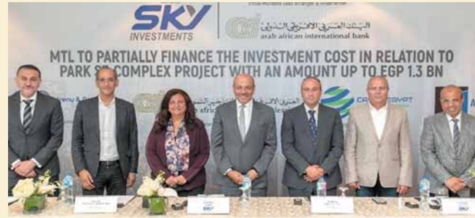
قيادات البنك والشركة خلال توقيع العقد

وقع البنك العربي الإفريقي الدولي عقد تمويل متوسط الأجل مع شركة سكاى للاستثمارات وإدارة الأصول العقارية لتمويل الكلفة الاستثمارية لمشروع بارك ستريت بالشخص زيد بقيمة ١,٣ مليار جنية مصري.