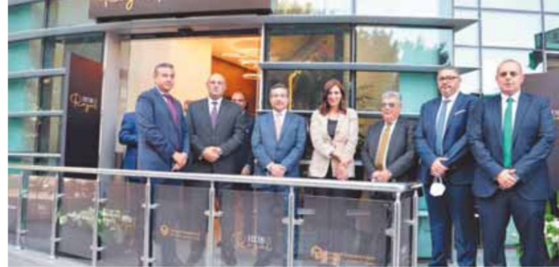
بنك التعمير يطلق خدمة كبار العملاء

واضحة وطموحة، يسعى من خلالها أن يكون في مقدمة البنوك التجارية في السوق المصرى. وأضاف أن خطة البنك الاستراتيجية اعتمدت أيضاً على التوسع في عدد الفروع وتطوير الفروع القائمة في كافة المحافظات، بالإضافة إلى زيادة أعداد شبكات الصراف الآلى وتوسع مواقعها للوصول إلى عملائنا في مختلف أنحاء