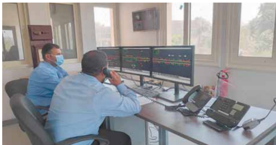
غرفة الإشارات بعد التطوير والدخول في الخدمة

وأوضح الوزير أن المشروع يتكون من (١٥) برجاً رئيسياً و٢٤ برجاً ثانوياً و٨٦ مزلقاناً) وأن نسبة تنفيذ المشروع بلغت ٧٦.٥٪ حيث تقوم الشركة بأعمال التشطيبات والتجهيزات لعدد ٦ أبراج على التوازي بمراحل متوازية وبرج القوصية بأسبوط هو تاسع برج رئيسي تم دخوله في الخدمة بعد أبراج (أبو قرقاص - مماغة - الروضة - بنى مزار - ملوى - عطاي - سمابوط) بمحافظة المنيا ورج ديروط بمحافظة أسبوط، لافتاً إلى أن برج القوصية بأسبوط والمنطقة الأوتوماتيكية بطول ١٣ كم تتحكم في ٥٤ سيمافورا ضوئياً وعدد ٣ مزلقانات تعمل أوتوماتيكياً وعدد ١٢ موتور تحويلة وعدد ٦٩ تراك كهربي - مع تشغيل القاطر والمسبر المكسي ما بين برج القوصية وديروط وتصبح المسافة الحالية بالتشغيل ١٢١ كم من إجمالي ٢٥٠ كم.