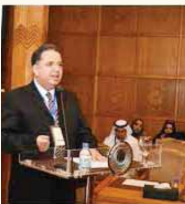
د. يحيى المشد

أعلن الدكتور محمد ربيع رئيس مجلس أمناء جامعة الدلتا صدور القرار الوزاري ببدء الدراسة فى كلية تكنولوجيا العلوم الصحية التطبيقية مصر ٢٠٣٠. تشمل أقسام الكلية: المختبرات الطبية والتحليل والأشعة والتصوير الطبى والطوارئ والعناية المركزة وتكنولوجيا تصنيع الأسنان، وأكد الدكتور يحيى المشد رئيس الجامعة أن كلية تكنولوجيا العلوم الصحية واحدة من كليات الجامعة التي تشمل الطب البشرى وطب الفم والأسنان والعلاج الطبيعى والصيدلة الكليتيكية والهندسة وإدارة الأعمال وتم تخصيص معمل للتسويق الإلكتروني فى الجامعة لاستقبال لطلاب الشهادات المعادلة والمعاهد الصحية والأهرم يتقدمون مباشرة للتسجيل بالجامعة.