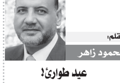
بقلم: محمود زاهر