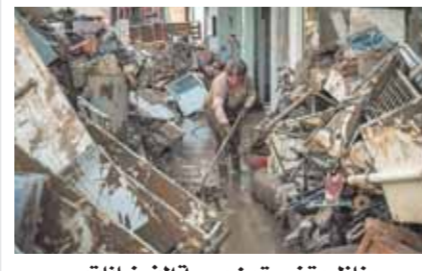
منزل متضررة من موجة الفيضانات

المياه والكهرباء سيستغرق شهراً وربما سنوات، ويأتي ذلك في وقت يتدهور الوضع في الجنوب على الحدود بين ألمانيا والنمسا. وقالت صحيفة «وول ستريت جورنال» الأمريكية إن الفيضانات في ألمانيا تعيد رسم الصورة السياسية قبل الانتخابات التي ستعقد خليفة «ميركل»، ومضت تقول: «تدقق المنافسون البارزون، بالإضافة إلى «ميركل»، التي لن تخوض الانتخابات مرة أخرى. على المناطق المنكوبة، ووعدهوا بتقديم المساعدات، ووجهوا أصابع الاتهام إلى التغيير المناخي، الذي تسبب في واحدة من أسوأ الكوارث التي تعرضت لها ألمانيا منذ الحرب العالمية الثانية».