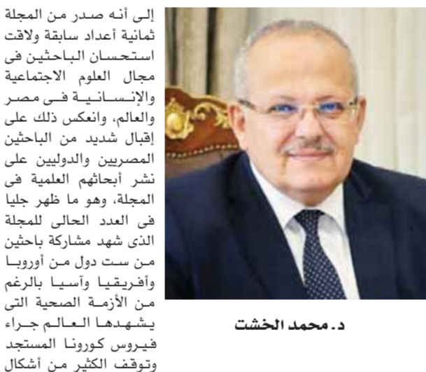
د. محمد الخشت

إلى أنه صدر من المجلة ثمانية أعداد سابقة ولاقت استحسان الباحثين فى مجال العلوم الاجتماعية والإنسانية فى مصر والعالم، وانعكس ذلك على إقبال شديد من الباحثين المصريين والدوليين على نشر أبحاثهم العلمية فى المجلة، وهو ما ظهر جليا فى العدد الحالى للمجلة الذى شهد مشاركة باحثين من ست دول من أوروبا وأفريقيا وآسيا بالرغم من الأزمة الصحية التى يشهدها العالم جراء فيروس كورونا المستجد وتوقف الكثير من أشكال الحياة.