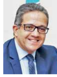
د. خالد العناني