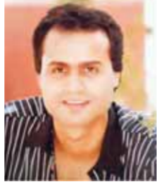
عماد عبد الحليم

يمر اليوم ٢٦ عاماً على رحيل مطرب موهوب بمعنى الكلمة عماد عبد الحليم الذي ظهر على الساحة الغنائية في النصف الثاني من السبعينيات. واستطاع إثبات وجوده في فترة وجيزة وغني العديد من الأغنيات الناجحة منها «ألوان»، «الضباب»، «قالولي كنت فين»، «غدار»، «مهما خدنتي المدن»، «عجيب الحب جداً»، «ليه حظي معاك يا دنيا كده»، «قال بطولة عدة أفلام ناجحة وهي، كرامتي، الأخوة الغرياء، حياتي عذاب، ورحل يوم ٢٠ يوليو ١٩٤٥ من عمر ناهز ٣٦ عاماً. وما زالت أعماله باقية.