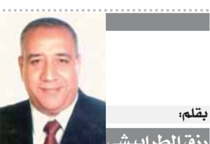
بقلم: رزق الطرايشي