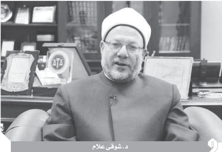
د. شوقي علام