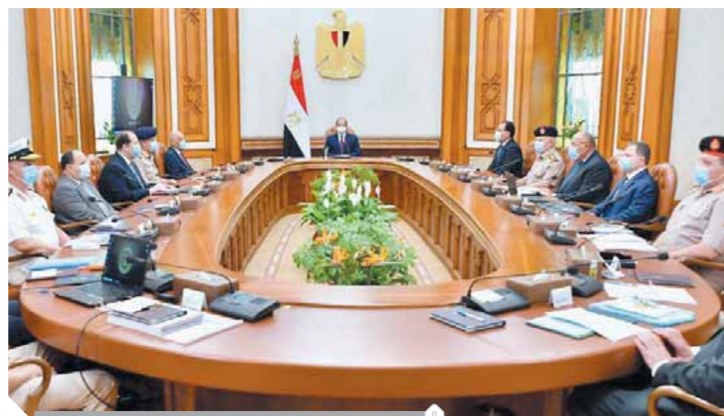
الرئيس السيسى خلال اجتماعه أمس بمجلس الدفاع الوطنى