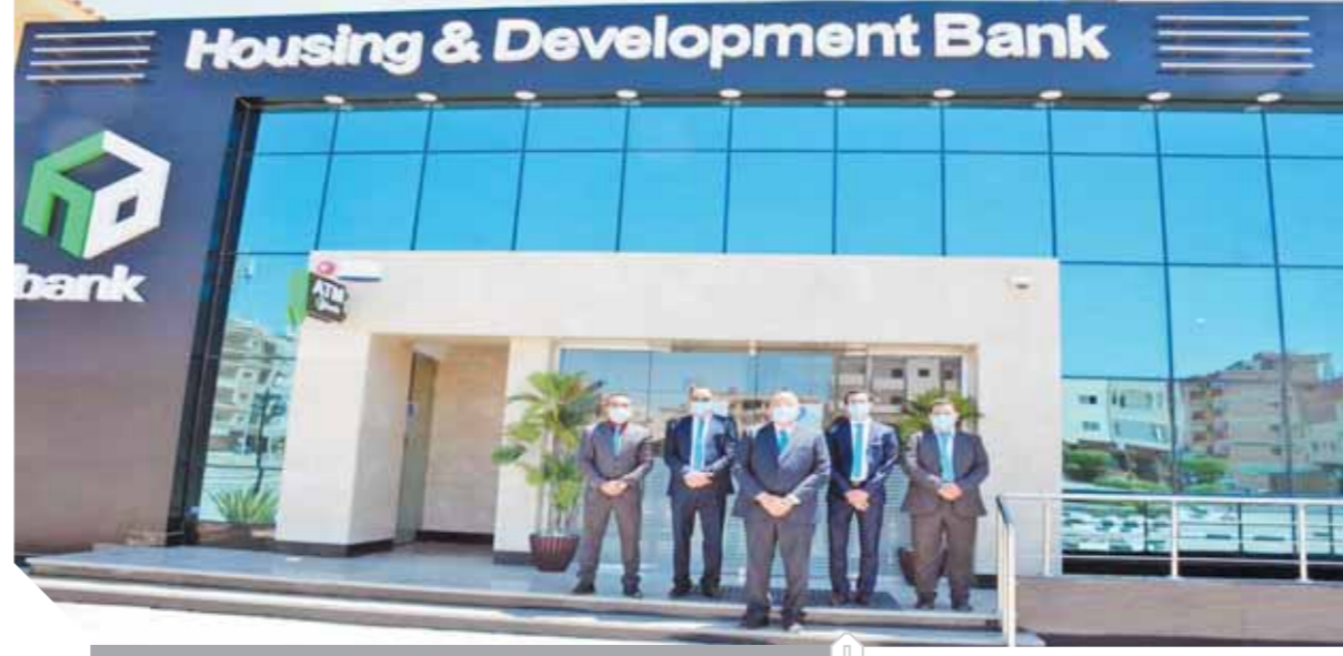
قيادات البنك خلال افتتاح الفرع

وأضاف العضو المنتدب أن البنك يسير قدماً في التوسع في تقديم الخدمات المصرفية والرقمية مواكبة للتطورات المتلاحقة في السوق المصرفي حيث تم إطلاق خدمتي Mobile banking