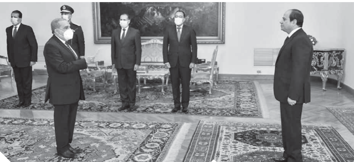
وزير الإنتاج الحربي أثناء أدائه اليمين أمام الرئيس السيسي