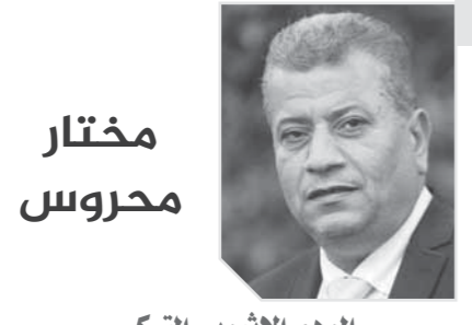
الوهم الإثيوبي التركي

مشروع سد التكية الإثيوبي هو مشروع للهيمنة، مشروع الغنائم التاريخية، مشروع جره حصار مصر وإدخالها بنية التحكم في قرارها ومقرراتها، الزيارة اللافقة التي قام بها ميوت رئيس الوزراء الإثيوبي أبي أحمد تزكيا الجمعة الثالثة واجتماعه مع وزير الخارجية التركي مولود أوزول، في ظل وصول مفوضات سد النهضة إلى طريق مسدود، وفي ظل التوترات التي تشهدها المنطقة وتدخل تركيا في الملف الليبي يكف ويعدا، عن الخطأ التركي الإثيوبي الإسرائيلي.