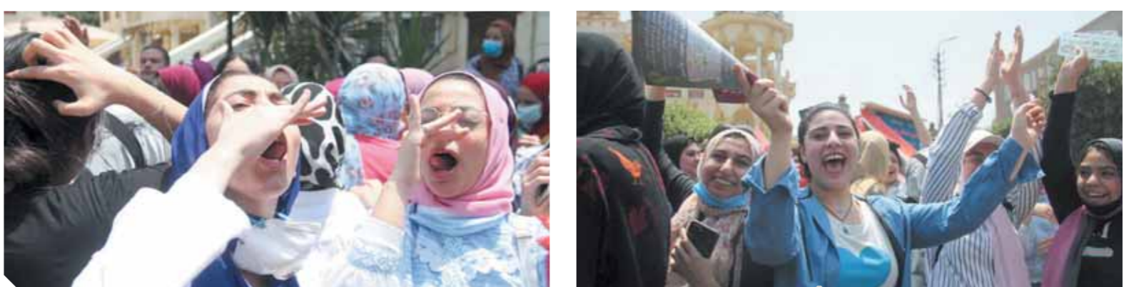
فرحة عارمة بين طالبات الثانوية العامة وزغاريد احتفالاً بإنهاء الامتحانات