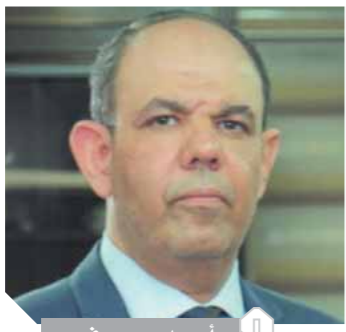
أحمد سمير فرج

صرح الدكتور أحمد سمير فرج، القائم بأعمال رئيس جهاز حماية المستهلك والمدير التنفيذي بأنه تم الاتفاق على ضرورة قيام الشركات المقدمة خدمات المحمول والإنترنت بتفعيل المادة ٣٨ من قانون حماية المستهلك التي تنص على أنه إذا أبدى المستهلك موافقته للتعاقد عن بعد على تقديم خدمة أو شراء سلعة فإنه يجب على مقدم الخدمة أن يؤكد موافقته قبل خصم أية رسوم أو مصاريف. جاء ذلك خلال اجتماعه مع ممثلي شركات المحمول الأربع عبر تقنية «Zoom»، للاجتماعات الإلكترونية عن بعد. وأضاف «فرج» أن الجهاز قد سعى للتسيق مع شركات المحمول لضبط أسواق التجارة الإلكترونية وتفعيل نصوص قانون حماية المستهلك، وفي ضوء ورود شكاوى من المواطنين بشأن خصم مبالغ من الرصيد نتيجة اشتراك في خدمة «كول تون، مسابقات، إلخ» بخلاف الحقيقة، فإن الجهاز اتفق مع الشركات الأربع على ضرورة وجود رسالة أخرى بخلاف الرسالة الترويجية يتم إرسالها للمستهلك بعد اشتراكه بالخدمة للتأكيد على اشتراكه بالعرض وتوضيح المبالغ التي سيتم خصمها من رصيده مقابل