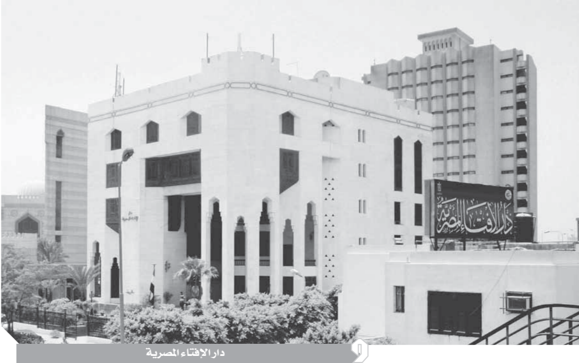
دار الإفتاء المصرية

في جولات مكوكية مكثفة فضيلة المفتي الدكتور شوقي علام و علماء دار الإفتاء إلى الخارج تنفيذاً لبرنامجها الإفتائي للتواصل مع لاجتاهد الفتوى وصناعة الإفتاء، كل ذلك مع العالم مشلت النمسا وموسكو وألمانيا والإمارات والسعودية والمغرب والجزائر وباكستان، حيث التقى فضيلته عددا من الرؤساء والقيادات السياسية والدينية والفكرين وأصحاب القرار وقدم علماء الدار الدعم العلمي والشعري للمسلمين في مختلف بلدان العالم، إضافة إلى اللقاءات مع الشباب بالجامعات في الخارج بهدف تصحيح صورة الإسلام في الغرب، وتبني كلمة... أصبحت دار الإفتاء خلية نحل في فترة وجيزة في عمر المؤسسات حتى أصبحت مصدر إشعاع على المستوى الوطني والإقليمي، وانفتحت على آفاق رحبة تستوعب العالم من أجل حضور الإسلام الصحيح وتبني لاجتاهد الفتوى وصناعة الإفتاء، كل ذلك مع التأثير من خلال الإسلام على العقل الجمعي والفردى، فها هي دار الإفتاء تستقبل الأسئلة من كل حذب وصوب وتبحث عن الثغرات في فقه الأمة وتحاول سدها، وقد ساهم إعداد جيل متمكن من العلماء وتدريبهم تحت إشراف فضيلة الدكتور شوقي علام مفتي الجمهورية على الإدارة وعلى السياسة وعلى تحليل المضمون وعلى فهم العصر ومقتضياته على إنجاز أهدافه وادار وإيصال رسالته إلى العالم.