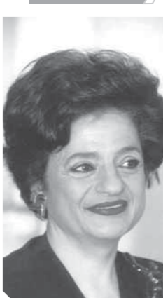
منى مكرم عبيد