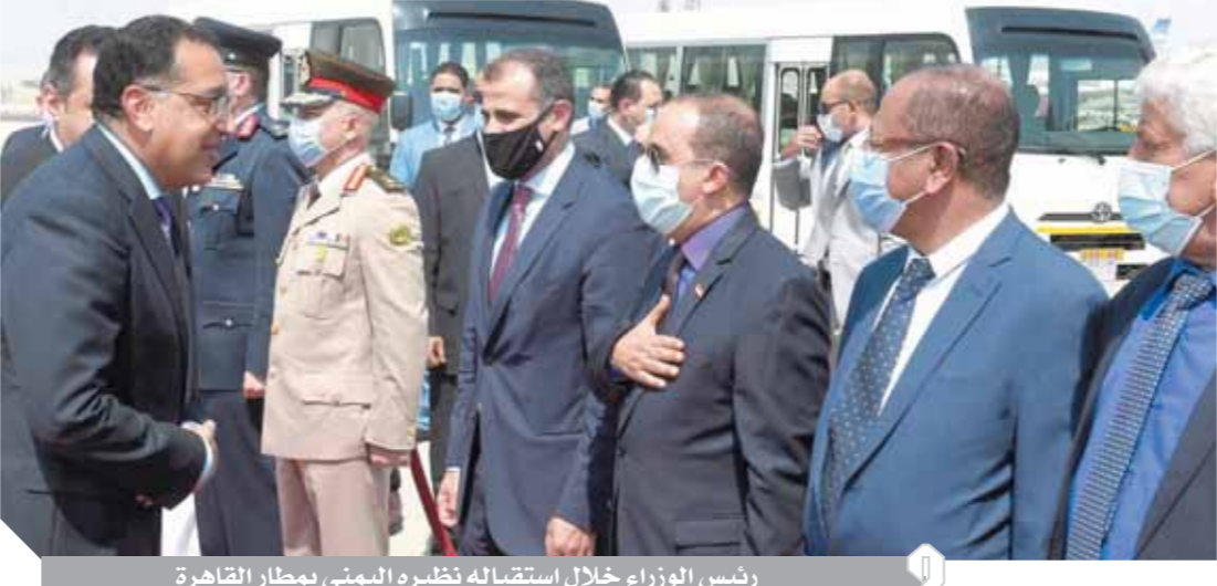
رئيس الوزراء خلال استقباله نظيره اليمني بمطار القاهرة

استقبل الدكتور مصطفى مدبولي، رئيس مجلس الوزراء، نظيره اليمني الدكتور معين عبد الملك، الذي وصل أمس إلى مطار القاهرة، على رأس وفد رفيع المستوى يضم عددا من الوزراء وكبار المسؤولين، في زيارة رسمية لمصر تستغرق ٣ أيام. ورحب الدكتور مصطفى مدبولي بالدكتور معين عبد الملك والوفد المرافق له، مؤكداً أن هذه الزيارة سوف تمثل فرصة مهمة، لبحث سبل تعزيز العلاقات، وترأس الدكتور مصطفى مدبولي، والدكتور معين عبد الملك جلسة مباحثات موسعة مساء أمس لم تنته حتى مثول الجريدة للطبع، وذلك بمشاركة عدد من الوزراء والمسؤولين في البلدين، تتناول مختلف أوجه التعاون المشترك. وعقد مدبولي مباحثات مشتركة مع رئيس الوزراء اليمني وأكد خلال مؤتمر صحفي دعم مصر للحكومة اليمنية ورفض أي تدخلات في شؤنها وقال إن أمن اليمن أمن قومي لمصر والأمة العربية بأكملها.