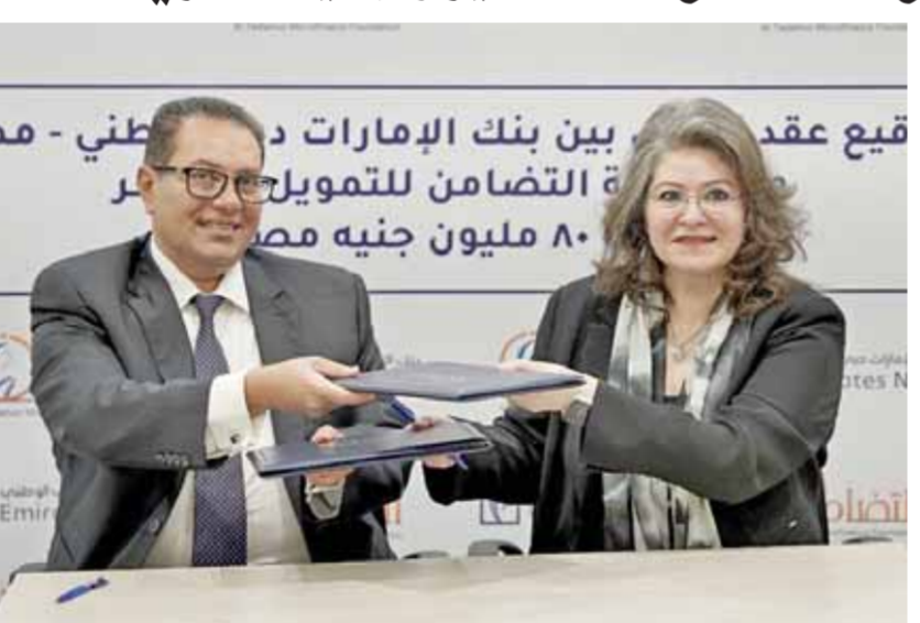
التوقيع على عقد التمويل الموجه للسيدات