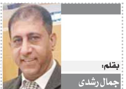
القلم: جمال رشدي