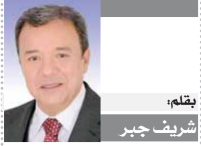
القلم: شريف جبر

حاصل على ليسانس حقوق دفعة ٢٠٢١ (انتظام) شارع خالد عبدالعال المتشعبة الجديدة - كفر الزيات - الغربية ت ٠١٠٩٣١٦٨٩٦ / ٠١٠٩٣١٦٨٩٦