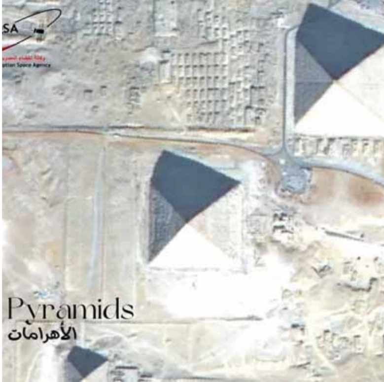
جانب من الصور الملتقطة

هذا المطلق، نعدكم بتزويدكم بأحدث الصور الجوية التي تكشف عن دقة البيانات، مما يدعم مختلف القطاعات الحيوية ويساعد في بناء مستقبل أكثر إشراقًا واستدامة». وكشفت الصور الملتقطة مناطق «حي المال والأعمال بالعاصمة الإدارية - الحي الإداري بالعاصمة الإدارية - المدينة الأولمبية بالعاصمة الإدارية - قناة السويس - الأهرامات».