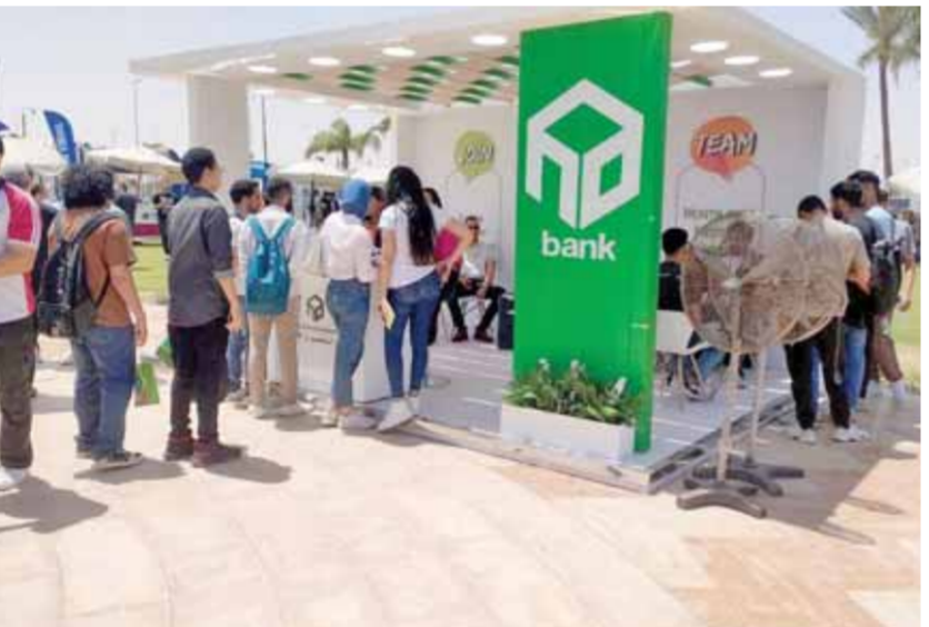
بنك التعمير والإسكان يشارك في رعاية ملتقى التدريب والتوظيف

شارك بنك التعمير والإسكان في رعاية ملتقى التدريب والتوظيف الخامس عشر بجامعة أكتوبر للعلوم الحديثة MSA، الذي تم عقده خلال الفترة من ١١ إلى ١٢ مايو الجاري، وذلك ضمن رعايته سلسلة من الملتقيات التوظيفية لطلاب الجامعات بهدف إمداد وتعريف طلاب الجامعة وحديثي التخرج الباحثين عن فرص وظيفية بالمعلومات المختلفة في كل مجالات سوق العمل، وتمكينهم من فهم متطلبات سوق العمل، كجزء من استراتيجية البنك الداعمة لتمكين الشباب وخلق فرص عمل لهم، للوصول إلى أفضل الكوادر المصرية المتميزة. وتأتي مشاركة بنك التعمير والإسكان في رعاية هذا الملتقى، انطلاقاً من حرص البنك على المشاركة في المبادرات الهادفة إلى تمكين الشباب في كل المجالات، وذلك من خلال دعم طلاب الجامعات وحديثي التخرج الباحثين عن فرص عمل وتقديم فرص تدريبية ووظيفية لهم، بالإضافة إلى إمدادهم بالمعرفة والخبرات اللازمة التي تمكنهم من دخول سوق العمل وتحقيق طموحاتهم المهنية.