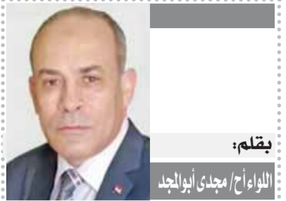
القلم: اللواء/ مجدى أبوالمجد