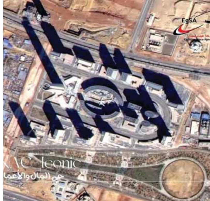
جانب من الصور الملتقطة

هذا المطلق، نعدكم بتزويدكم بأحدث الصور الجوية التي تكشف عن دقة البيانات، مما يدعم مختلف القطاعات الحيوية ويساعد في بناء مستقبل أكثر إشراقًا واستدامة». وكشفت الصور الملتقطة مناطق «حي المال والأعمال بالعاصمة الإدارية - الحي الإداري بالعاصمة الإدارية - المدينة الأولمبية بالعاصمة الإدارية - قناة السويس - الأهرامات».