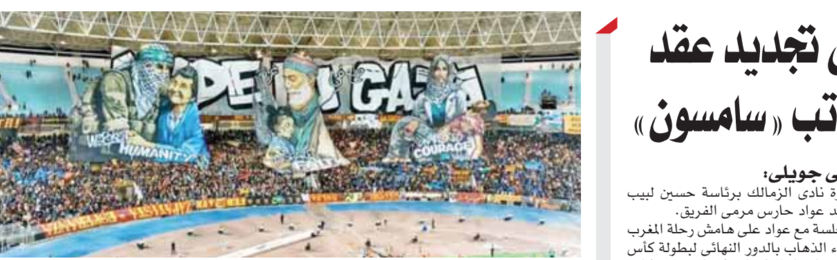
لوحه جمهور الترجي أمام الأهلي