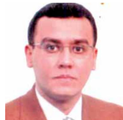
د. هشام عبدالغنى

يعانى كثير من الأطفال من الشعور بالألم في الركبتين أو آلام الساقين أو القدمين أو الطرفين السفليين بشكل عام، وقد تكون شكوى يومية متكررة أو تظهر وتختفي كل فترة، ورغم أن العلاج في المراحل المبكرة لتظهر الأعراض قد يكون بسيطاً جداً، إلا أن الأهمال والتأخر في الذهاب إلى الطبيب يسبب تدور الحالة. ويوضح الدكتور هشام عبدالغنى أستاذ جراحة عظام الأطفال بمستشفى أبو الريش الجامعي كلية الطب جامعة القاهرة، وعضو جمعية جراحة عظام الأطفال الأوروبية، وعضو الأكاديمية الأمريكية للشلل الدماغى، تعتبر آلام العظام عند الأطفال من الأعراض الشائعة المعروضة بالمعيادات والمراكز الطبية، والألم له علاقة بالمعرضة بعد اللعب أو الجرى أو التسلق، ويمكن أن يستيقظ الطفل من النوم على الأحاسيس بالوجع في الساقين بعد هذا الجهد، أو عند مشى الطفل مع والدته ويقول إنه يشعر قارداً على المشى ويطلب من الأم أن تحمله، وكثير من الأمهات يتجاهلن الألم ويسم الآلام بالألام المذكورة أعلاه، التي ليس لها علاقة بالحمى الروماتيزمية. ويكشف الدكتور هشام عبدالغنى، أن أغلب هذه الحالات يعود السبب الرئيسي بها إلى نقص فيتامين «د»، أو الكالسيوم، وهذا شائع جداً بين الأطفال، ويرجع ذلك إلى عدة عوامل من أهمها تغير طبيعة أسلوب نمط الحياة حالياً لكثير من الأطفال على اختلاف أعمارهم، وأصبح لا يوجد هناك الوقت الكافى من التعرض يوميًا لأشعة الشمس، ونقص تناول منتجات الألبان، والذي يؤدى لحدوث مثل هذه الشكوى وتكرارها واستمرارها لفترات طويلة.