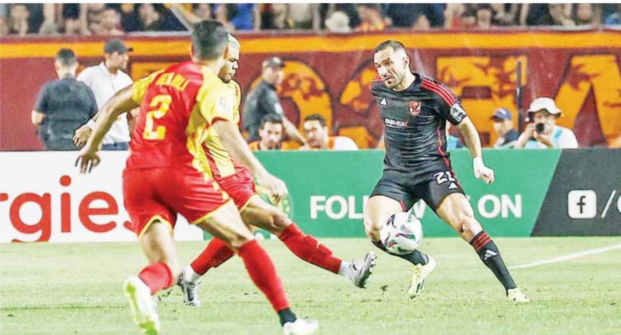
معلول تعرض للإصابة في لقاء الذهاب ضد الترجي

الدخول في مفاوضات مع عدد كبير من اللاعبين مثل بغداد بونجاح ومحمود حسن تيريزيجه ومحمد النور واحمد حجازي للتعاقب مع بعضهم في الموسم الجديد، شددوا على ضرورة التركيز في الاستعداد للمباراة النهائية الاحتفاظ باللقب، وقال كولر خلال المؤتمر الصحفي عقب المباراة، أنه يلعب دائماً على الفوز وليس التعادل، مشيراً إلى أن النتيجة التي حققها أمام الترجي ليس جيدة وليست سيئة، ولكنها تقرر على