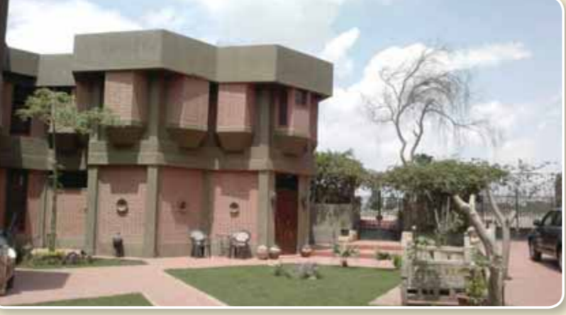
ويشير خبر إزالة متحف الفنان نبيل درويش ردود أفعال غاضبة، وسط تداول واسع لصور المتحف، وسيرة الفنان نبيل درويش، ودعاوى لزيارة المتحف في البردي، وهو مفتوح بالمجان للزائرين وطلاب كليات الفنون الجميلة والتربية الفنية، وإلى جانب منجزه الفني الواسع، فإن الراحل كان له باع بحثي في مجال فن الخزف، فشكل أول رسالة علمية للدكتوراه عن صنع المصيريين القدماء لفوهات سوداء للؤلؤاني الخزفية.