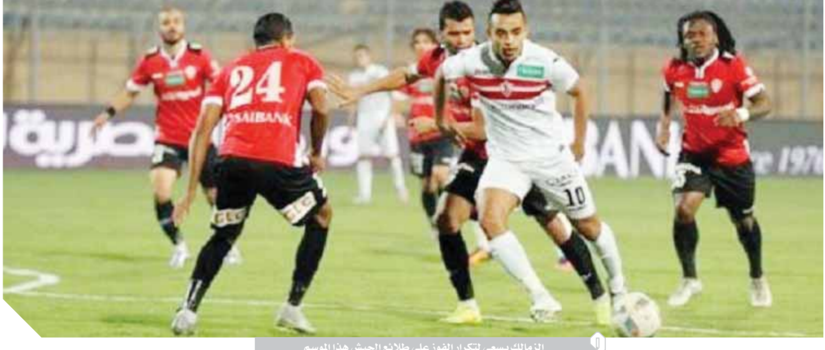
الزمالك يسعى لتكرار الفوز على طلائع الجيش هذا الموسم

جيدة حيث حقق فى اللقاءات الأخيرة الفوز فى ثلاث مباريات وتعادل فى واحدة مع الاتحاد السكندرى ويسعى لمواصلة عروضه الجيدة للائتماد عن منطقة الخطر حيث يحتل المركز الحادى عشر برصيد ٢٧ نقطة.