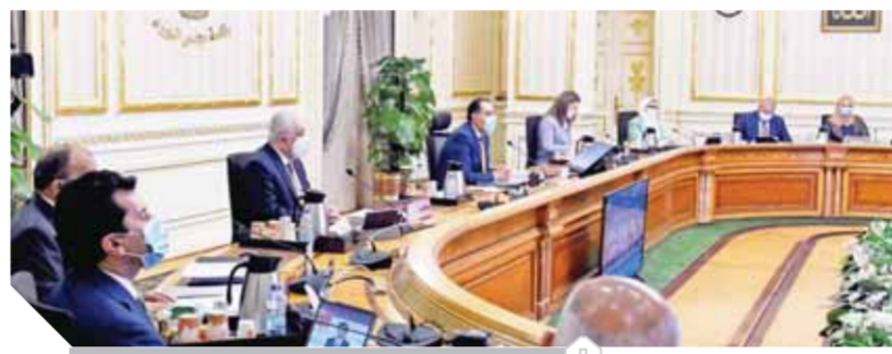
جانب من اجتماع مجلس الوزراء أمس

ونصت المادة الأولى من القرار على أن يكون الحد الأدنى لإجمالي الأجر الشهري الذي يستحق للموظف/العامل، بدءاً من أول يوليو ٢٠٢١، للدرجة الممتازة أو ما يعادلها ٨٤٠٠٠ جنيه، و٦٠٠٠٠ جنيه للدرجة العالية أو ما يعادلها، و٤٨٠٠٠ جنيه لدرجة مدير عام أو ما يعادلها، و٤٢٠٠٠ جنيه للدرجة الأولى أو ما يعادلها، و٣٦٠٠٠ جنيه للدرجة الوظيفية الثانية أو ما يعادلها، و٣١٢٠٠ جنيه للدرجة الثالثة أو ما يعادلها، و٢٨٨٠٠ جنيه للدرجة الرابعة أو ما يعادلها، و٢٦٤٠٠ جنيه للدرجة الخامسة أو ما يعادلها، و٢٤٠٠٠ جنيه للدرجة السادسة أو ما يعادلها. كما وافق المجلس على مشروع قرار رئيس الجمهورية بإنشاء جامعة خاصة باسم «جامعة الابتكار»، ونصت المادة الأولى من القرار على أن تكون للجامعة شخصية اعتبارية خاصة، ويكون مقرها مدينة العاشر من رمضان، ولا يكون غرضها الأساسي تحقيق الربح.