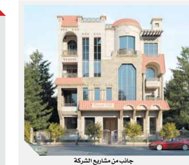
جانب من مشاريع الشركة

وأوضح أن «إتقان» تقدم مجموعة متكاملة من الخدمات والاستشارات، بدءاً من وضع هيكل تنظيمي للشركة واختيار موقع المشروع والقيام بدراسة مميزات الموقع وإجراء أبحاث