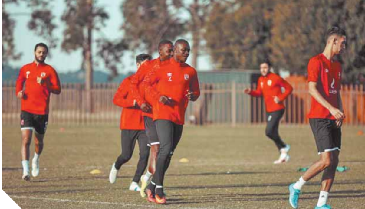
الأهلى جاهز لمواجهة صن داونز