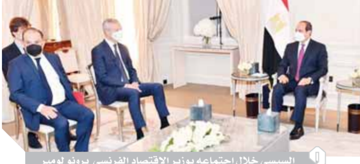
السيسي خلال اجتماعه بوزير الاقتصاد الفرنسي برونو لومير