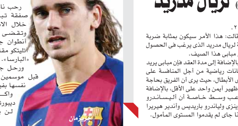
لمزيد من الأخبار والتقارير المصورة ALWAFD.NEWS

كشفت تقرير صحفى فرنسى عن آخر المستجدات المتعلقة بمستقبل كيليان مبابى نجم باريس سان جيرمان الذى ينتهى تعاقد مع ناديه نهاية الموسم المقبل. وذكرت صحيفة «لو باريزيان» الفرنسية إن باريس سان جيرمان عرض على مبابى التجديد حتى عام ٢٠٢٥ مع إمكانية الرحيل فى صيف ٢٠٢٤. وأضافت الصحيفة أن هذا الخيار لا يروق لمبابى الذى سيقبل التجديد حتى عام ٢٠٢٣، ولكن بهدف الرحيل فى صيف