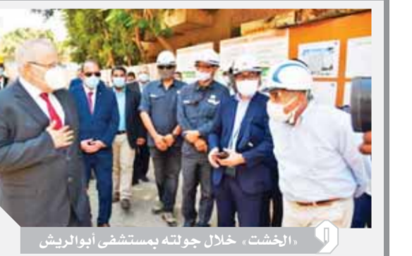
الخشت، خلال جولته بمستشفى أبو الريش