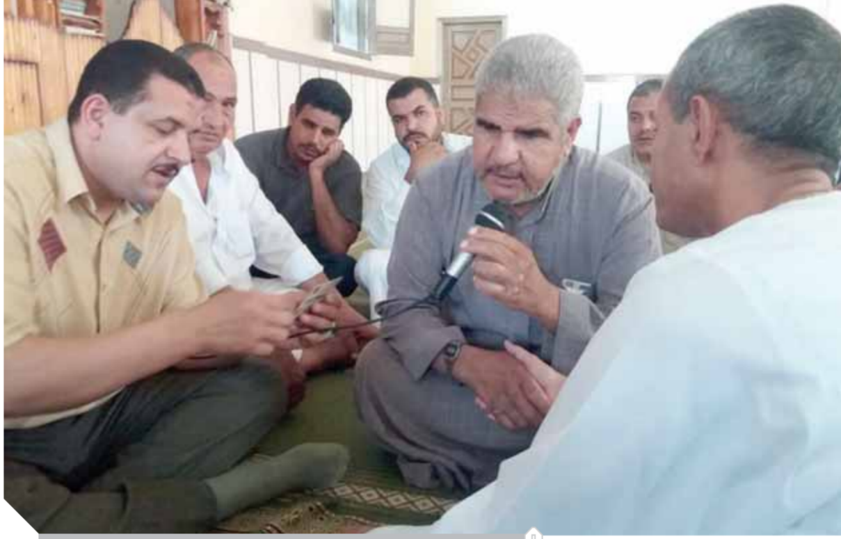
الزواج العرفي يتحول إلى طلاق سري بسبب المعاش

الشيخ محمد عون المتحدث الرسمي باسم مأذوني مصر: ارتفاع نسبة الزواج العرفي بين الأرامل والمطلقات للحفاظ على معاش الأب أو الزوج