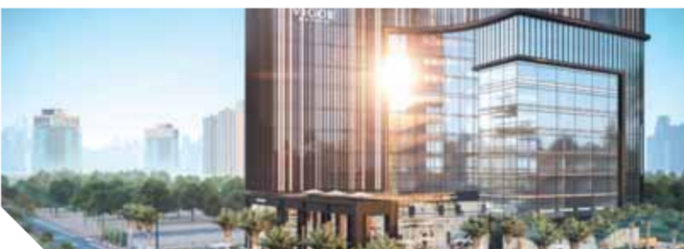
مجسم لمشروع فيجور

ولفت إلى أن العاصمة الإدارية الجديدة مشروع قومي واستثماري وأحد أهم تميزه برؤية طموحة وخطة واضحة لتنفيذ مدينة ذكية تكنولوجية قادرة على المنافسة العالمية، ومع انتقال الموظفين للحى الحكومي بالعاصمة الإدارية والمقرر له العام الجارى فإن العاصمة تشهد مزيداً من الاستثمارات الموجهة إليها من المطورين المحليين والأجانب.