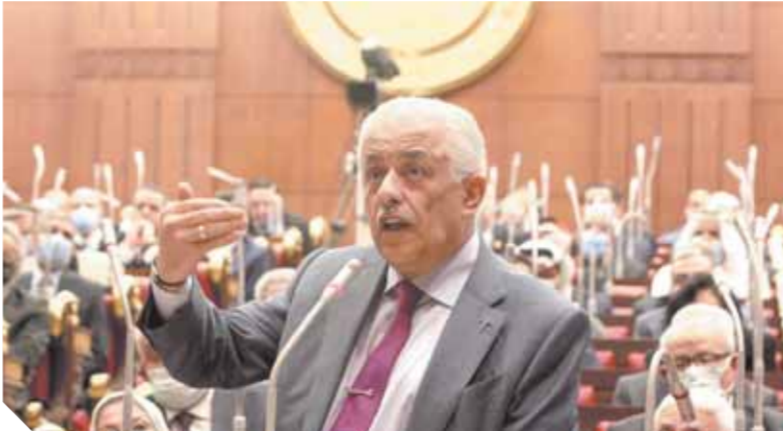
وزير التعليم أثناء عرضه مشروع قانون الثانوية العامة أمام المجلس

مشادات بين النواب ووزير التعليم.. ورئيس المجلس: الرفض لا يعنى عرقلة التطوير