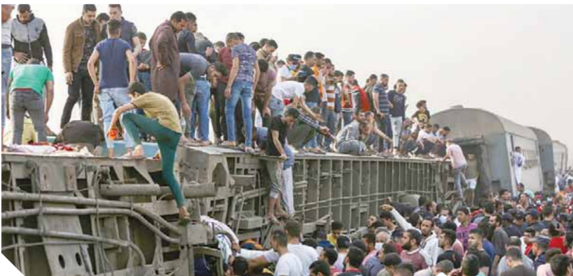
حادثة طوخ صباحاً الإهمال مستمر

يكون سبباً في وقوع حوادث كبرى. وأوضح أنه من المفترض تجنب تشغيل القطارات التي من المفترض أن تدخل في منظومة التطوير، ولكن مع جائحة كورونا، أصبحت الدولة مجبرة على استخدامها مرة أخرى لزيادة عدد الرحلات للحد من التزامم حفاظاً على أرواح المواطنين. وأكد «ربيع» أن إقالة وزير النقل ليست حلاً، بل إن وعي المواطنين جزء من إنهاء مسلسل حوادث المتكررة، وتابع: «هناك محافظات تتمر فيها القطارات في وسط الشوارع، وبين مساكنا، والأمر أصبح عادياً بالنسبة لهم، ولا تشهد أي حوادث».