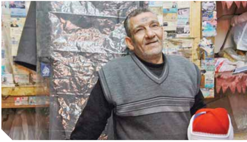
محور الوفاء أثناء حوار مع صانع الوجاهة

في شارع الغورية التابع لمنطقة الحسين الأثرية بالقاهرة، وسط عشرات المحلات التي تبيع الملابس والأقمشة والمفروشات، سيلفت انتباهك مكان تشم منه رائحة الماضي وعبق التاريخ، إنه محل يبيع «الطرابيش»، التي كان ارتداؤها إجبارياً في مصر، وأصبح الآن يقتصر على مشايخ وطلاب الأزهر وبعض أئمة وخطباء المساجد ومقرئي القرآن الكريم.