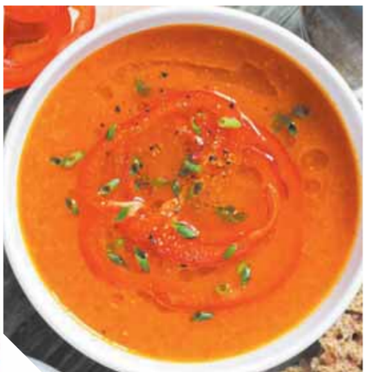
محمد صلاح مغاوري