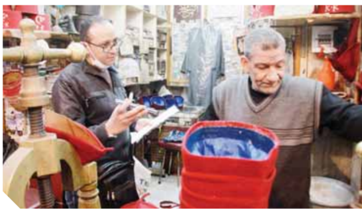
محور الوفاء أثناء حوار مع صانع الوجاهة