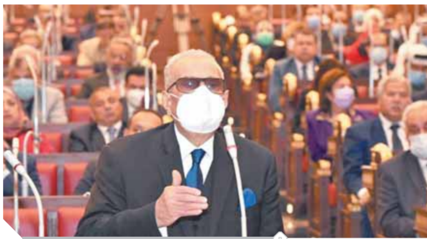
أبو شقة خلال حديثه في مجلس الشيوخ

«أبو شقة»: نحتاج إلى قانون تعليم شامل يحقق أهداف الدولة العصرية