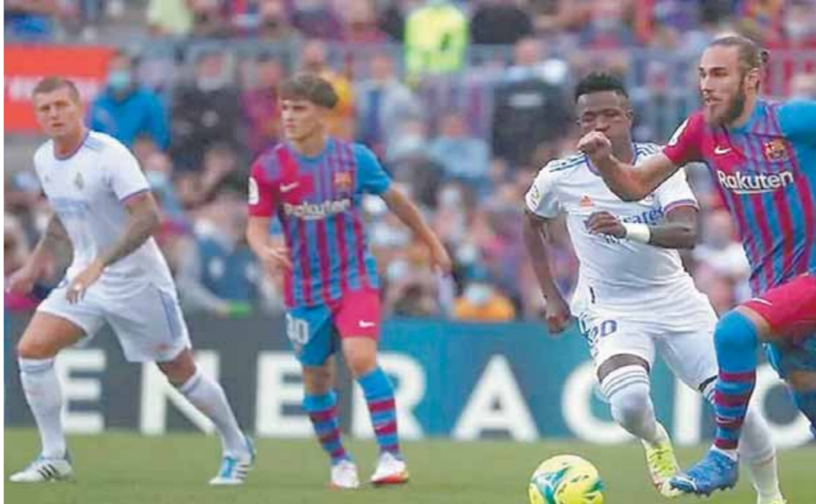
مباراة برشلونة وريال مدريد تحظى بمتابعة واسعة على مستوى العالم