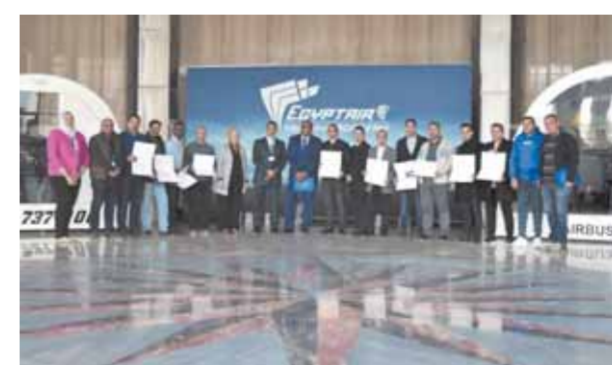
لقطة تذكارية لضباط التحميل بأكاديمية مصر للطيران

مشرف، كما أعرب المستدرون عن سعادتهم بتلقيهم إحدى أهم الدورات التدريبية داخل أحد أكبر صروح التدريب في مجال الطيران في أفريقيا والشرق الأوسط.