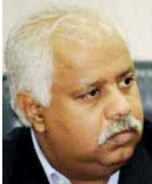
بقلم: حمدي رزق

عضو مجلس الشيوخ عن تنسيقية شباب الأحزاب والسياسيين عن حزب التجمع