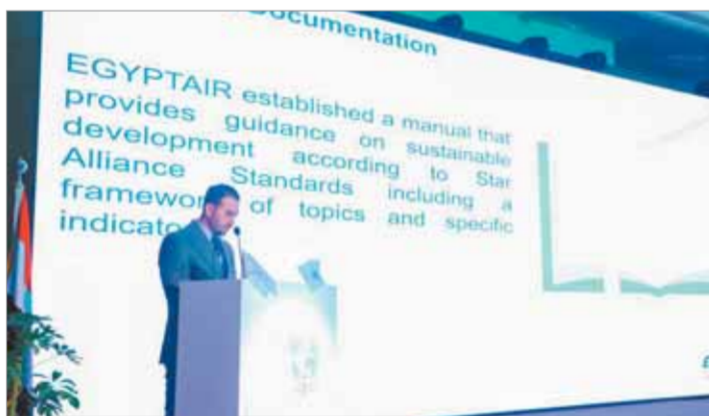
مصر للطيران خلال المشاركة في القمة البيئية الأولى للطيران الانساني

إنشاء محطات لصيانة الطائرات بمنطقة الشرق الأوسط وداخل قارة أفريقيا لاستهداف العملاء من شركات الطيران خارج جمهورية مصر العربية وفي أقرب النقاط إليهم.