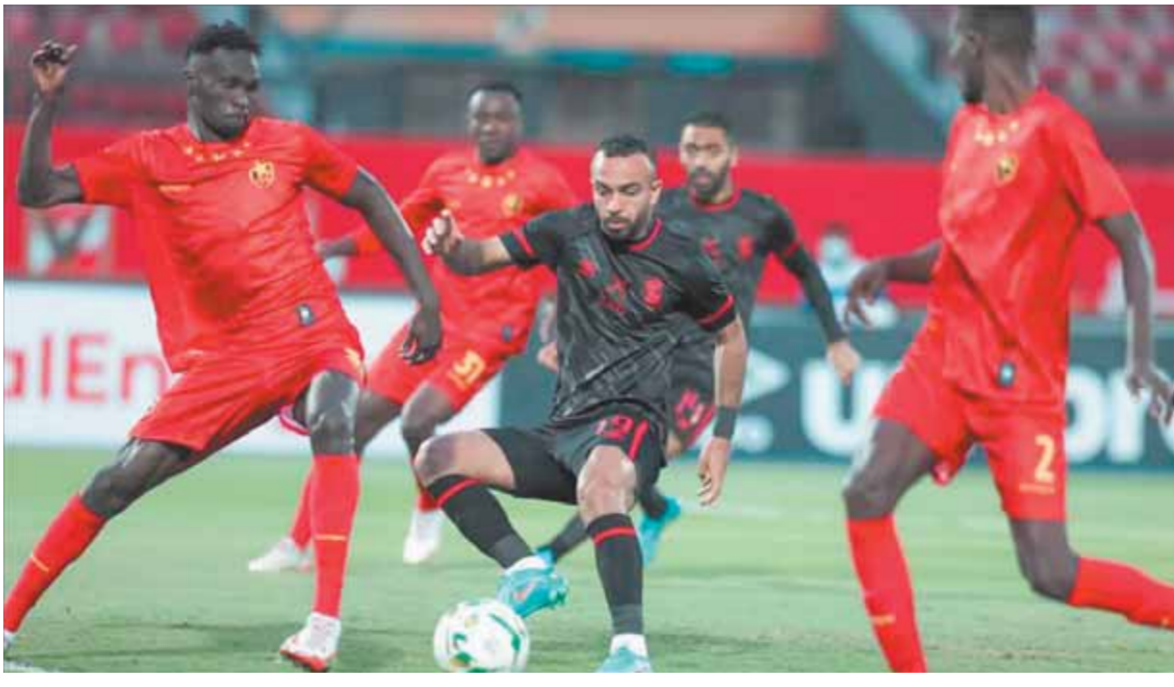
فوز الأهلي على المريخ قربه من دور الثمانية