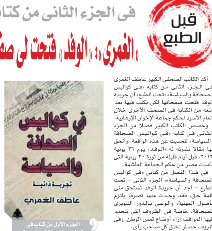
الجزء الأول من كتاب في كواليس الصحافة والسياسة، تجربة ذاتية، عاطف التمرحني