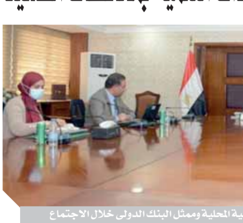
وزير التنمية المحلية وممثل البنك الدولى خلال الاجتماع