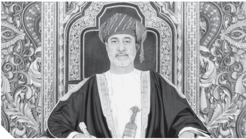
السلطان هيثم بن طارق سلطان عمان مؤسس النهضة العمانية المتجددة.

وبينت أن الاتجاهات طويلة المدى تشير إلى عولمة الابتكار، إذ ستأثر آسيا حالياً بنسبة ٥٢,٧٪ من إجمالى أنشطة الإبداع بموجب معاهدة البراءات، مقارنة بنسبة ٣٥,٧٪/ قبل ١٠ سنوات وتتسجم هذه الزيادة مع رؤية المملكة ٢٠٣٠ التي تم الإعلان عنها فى ٢٠١٦، والتي تعنى الابتكار والاختراع اهتماماً كبيراً فى أكثر من موضع، إذ أشارت إلى أن المملكة «ستواصل الاستثمار فى التعليم والتدريب وتزويد أبنائها بالمعارف والمهارات اللازمة لوظائف المستقبل»، مشددة على أن «يحصل كل طفل سعودى - أينما كان - على فرص التعليم الجيد وفق خيارات متنوعة، وسيكون التركيز أكبر على مراحل التعليم المبكر، وعلى تأهيل المدرسين والقيادات التربوية وتدريبهم وتطوير المناهج الدراسية».