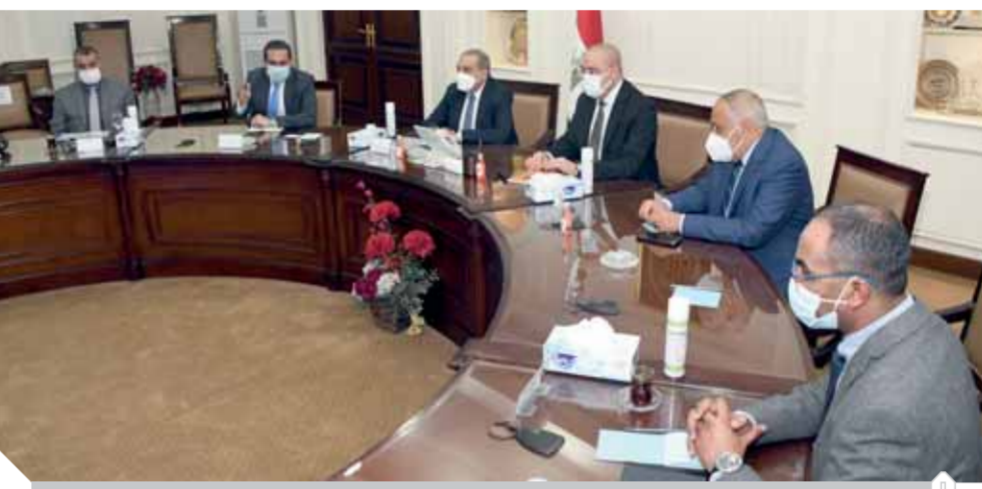
اجتماع وزير الإسكان مع وزير الإنتاج الحربى ورئيس، العربية للتصنيع، لتوفير مستلزمات «حياة كريمة»