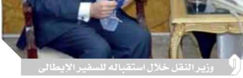
وزير النقل خلال استقباله للسفير الإيطالى

وأشارت جامع إلى أن الصادرات المصرية حققت استقرار نسبي العام الماضى وفى ظل جائحة كورونا وذلك نظراً لمساندة الدولة لقطاع الصناعة، مشيرة إلى أن الوزارة تستهدف تحقيق معدلات نمو للصادرات بنسبة ١٠٪ العام الجارى.