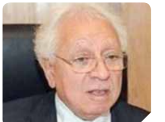
د. شوقى السيد

أعلنت وزارة العدل بده تنفيذ مشروع إصدار شهادات المحاكم عن بعد، في إطار خطة الوزارة نحو التحول الرقمي وتطوير منظومة التقاضي باستخدام تكنولوجيا المعلومات.