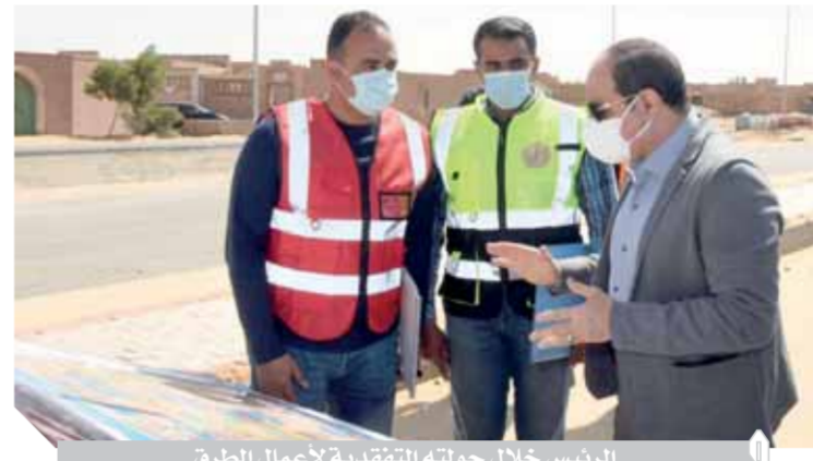
الرئيس خلال جولته التفقدية لأعمال الطرق

المناطق، وقد اطلع على مستجدات الأعمال الجارية لتطوير مدينة الأمل من طرق وخدمات شاملة، كما تفقد الرئيس كذلك أعمال التجديد والتطوير الشامل لتحديقة الطفل بالحى السادس بمدينة نصر، وقد التقى إحدى السيدات من المواطنين التى تصادف وجودها، حيث استمع لها وناقشها فى بعض المطالب التى عرضتها . وقد اطلع الرئيس من المسئولين فى أحد مواقع العمل بمنطقة التجمع الخامس على الموقف التنفيذى لعدد من المحاور والطرق موحها بضمان توفير كافة الخدمات اللازمة للمركبات ومرتاى الطرق الجديدة أخذاً فى الاعتبار الأهمية الكبرى لتلك المحاور فى تعزيز عملية التنمية وتنظيم الحركة المرورية وسرعة التنقل.