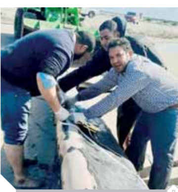
عملية دفن الحوت

بالإسكندرية وكفر الشيخ ليتم إيداعها داخل مزرعة غليون، وتحنيطها ودقنها بالحصى على هيكلها عقب تحللها بمعرفة الأحياء المائية، لوضعه فى معهد البحوث المائية، وتبين من المعاينة المبدئية للحوت الأبيض، وجود جرح نافذ بالبطن بطول متر تقريباً، مما أدى إلى نفوقه، وتم استخدام ثلاثة لوادر كبيرة لسحب من المياه على الشاطئ، كما تبين أنه ينتمى إلى نوع الهامباك، أو الحوت الأحذب، الذى يعتبر من أضخم الكائنات البحرية، ويسمى «بهلولان المحيط»، نظراً لحركته وقضاته فى الماء، وعمره ٦ شهور.