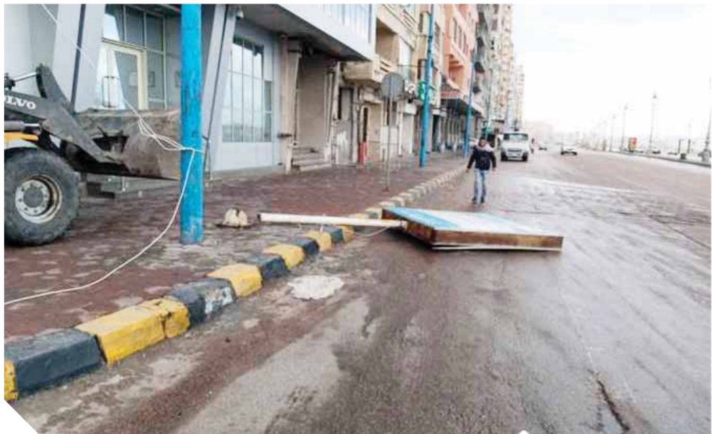
سقوط عمود لافتة اعلانية بتكرونيش الإسكندرية

منذ اليوم الأول للإعلان عن ظهور فيروس كورونا المستجد في الصين أواخر عام ٢٠١٩، تابعت بقلق بالغ تطورات هذا الفيروس اللعين وسرعة انتشاره وأعراضه، وبدأت منذ ذلك الحين في البحث عن سبل الوقاية من هذا الوباء الذي ينهش جسد الإنسان ويحشيه وبلا رحمة، ولم أجد سوى دعم مناعة الجسم واتباع إجراءات احترازية تمنع انتقال الفيروس من شخص مصاب أو من سطح يحمله. ومع الإعلان عن أول حالة إصابة بفيروس كورونا في مصر، بادرت مصر بوضع ضوابط شديدة تضمن سلامة المواطنين، وكنت من أكثر المواطنين التزاماً بتلك الإجراءات سواء في أماكن العمل أو في المنزل أو حتى في الزيارات الميدانية بمواقع العمل المختلفة، مع الاهتمام أيضاً بتناول الفيتامينات التي تعمل على رفع المناعة، والتمسك بهذه الإجراءات شهوراً عديدة مع متابعة الأرقام والإحصائيات التي تعلنها وزارة الصحة كل يوم عن تطورات أعداد الإصابات التي كُنت أظن أنني في مامن منها. وإذ ليلاً، كنت أجلس في منزلي بعد يوم عمل طويل وشاق ورن جرس هاتف لييلتي أحد الأصدقاء الذي التقيته في مكتب خلال اليوم بأنه أجرى مسحة أظهرت إصابته بالفيروس اللعين! ولم تكن تبدو عليه أية علامات للإصابة، وأنا أيضاً لا أشعر بأية أعراض! فرتت على الفور إجراء المسحة، ولم تكن الصدمة في الإصابة بفيروس كورونا فحسب، بل كانت صدمتي الأكبر في البحث عن سبب وصول هذا الوباء اللعين إلّي!