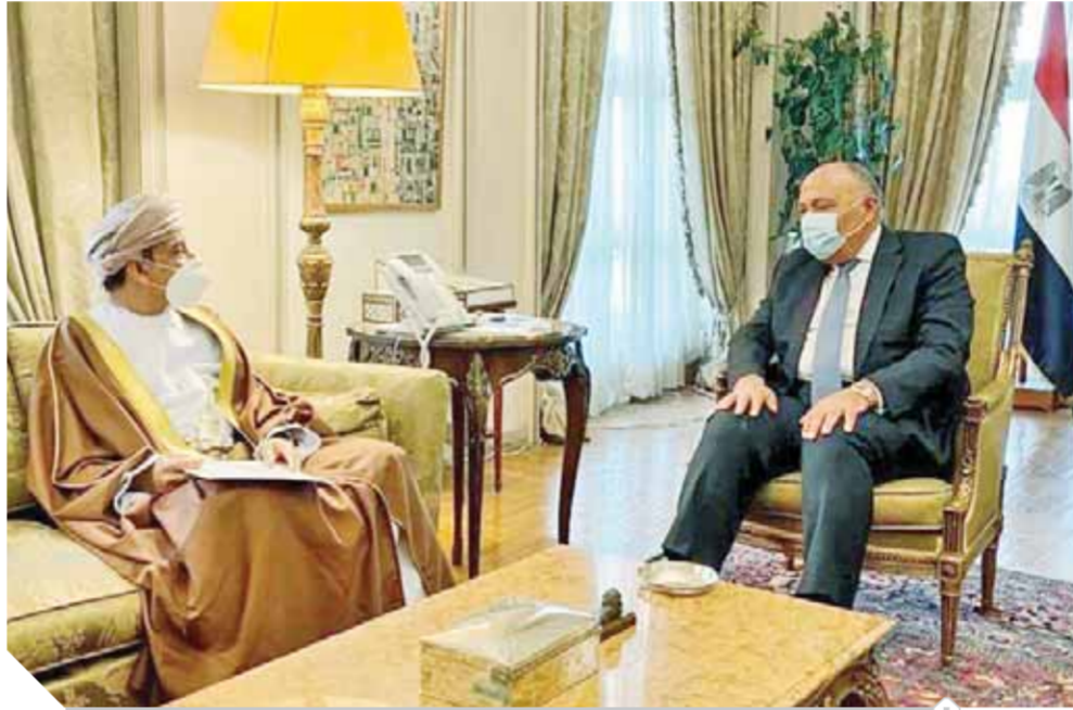
سامح شكري وزير الخارجية خلال استقباله السفير العماني الجديد عبدالله بن ناصر الرجعي

ويعُد «الرجعي» ديبلوماسياً وإعلامياً من الدرجة الأولى، حيث كان سفيراً للسلطنة فوق العادة ومفوضاً لدى دولة الإمارات في شهر مارس الماضي، وشغل وظيفة مندوب عُمان الدائم لدى مكتب الأمم المتحدة في جنيف في يونيو ٢٠١٢م، والمندوب الدائم للسلطنة لدى منظمة التجارة العالمية، كما كان يشغل من قبل منصب المحقق الثقافي بسفارة السلطنة في الأردن، ورئيساً لمجلس إدارة مؤسسة عُمان للصحافة والأخبار والنشر والإعلان في مارس ٢٠٠٥م، ورئيساً تنفيذياً لمؤسسة عُمان للصحافة والنشر والإعلان في يوليو ٢٠٠٦م، ورئيس تحرير صحيفة عُمان اليومية، كما منحه الدكتور تيدروس مدير عام منظمة الصحة العالمية شهادة المنظمة