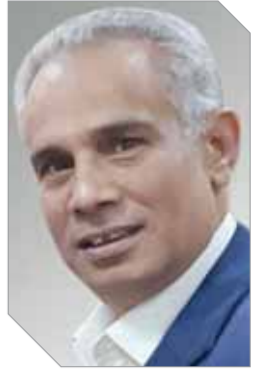
محمد مهاود يكتب:

النصب والاحتيال عبر وسائل التواصل الاجتماعي، وصل عبر القارات السبع، فما إن تفتتح أو تتعامل مع أي من وسائل «السوشيال ميديا» إلا وتجد من يتصل بك، سواء رجل أو سيدة، ولا تعلم من أين أو تفاصيل الشخصية التي تتصل بك، فمنهم من يريد أن يبتزك ومنهم من يريد أن يوهمك بأنك ستكون مليونيراً بين عشية وضحاها..