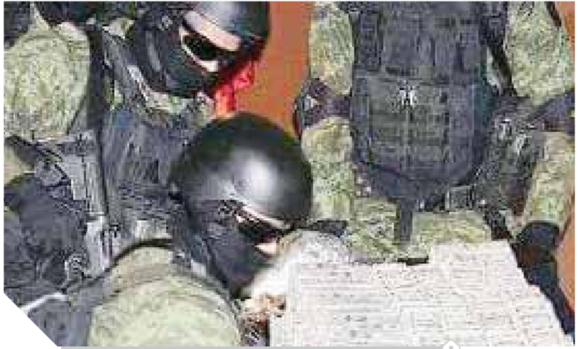
الجنود لحظة عثورهم على ملايين الدولارات

● كتبت لها قائلاً: كيف يكلفك هذا وانتظر المزيد من التوضيح، ● كيم: سيتم الدبلوماسية إلى مصر وسيكون هناك رسوم