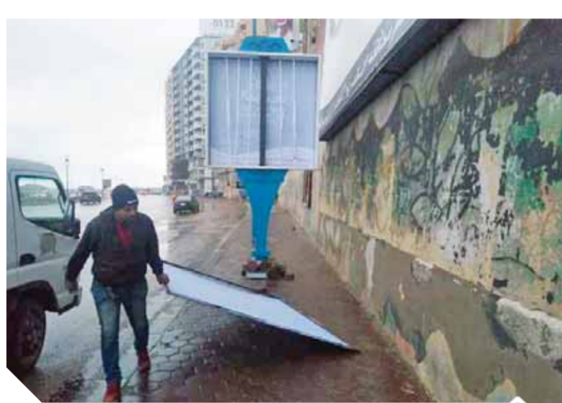
سقوط الإعلانات وأعمدة الإنارة

ووجه اللواء علاء يوسف رئيس الحي بسرعة إرسال إشارة إلى قسم الشرطة المختص لعمل إخلاء موقت للسكان دون المنقولات حفاظاً على الأرواح والممتلكات، وجارى عمل المحضر اللازم بتقسيم باب شرق، بالإضافة إلى عرضه على اللجنة الهندسية المختصة. من جانب آخر قام حي شرق في إزالة آثار موجة الطقس السيئ التي شهدتها الإسكندرية على مدار يومين تزامناً مع بدء نوة «الشمس الصغيرة» ومن جانبه كلف محارب هيلع رئيس حي شرق، كافة الجهات المختصة بمتابعة التفشيات المتتالية بسبب النوة، كما تابع ميدانياً على مدار الساعة أعمال إزاحة مياه الأمطار ومنع تجمعها بالشوارع نطاق الحي خلال يومي النوة، قال، هيلع « إنه تم رفع بورن سقط في شارع المشير، بمنطقة سيدي جابر، ورفع كشاف ليد على عمود ديكوري سقط بشوارع المشير وعزل الاسلاك، وكشافي ليد آيلين للسقوط بطريق الجيش جليم والاقبال. وأشار ، إلى أنه تمت إزالة الأجزاء المائلة وتسبب خطورة على المارة والسيارات في الأماكن الأثرية؛ الاقبال وشعراوى وجليم، ورفع كشاف آيل للسطوح شارع الدبر ورفع سلك سقط بشوارع الاسماعيلية، ورفع سلك سقط أمام فندق ٢٦ يوليو. وأوضح رئيس حي شرق أن وحدة الإعلانات بالحي أزالته كافة الإعلانات التي تآثرت بشدة بالرياح وتمثل خطورة على المارة بطريق الكورنيش و٤٥ مايو وشوارع الاقبال وشوارع فوزي معاذ. وقر اللواء محمد الشريف، محافظ الإسكندرية، رفع درجة الاستعداد القصوى والطوارئ بالأحياء بمعرفة مهندسي المنطقة، وذلك للتعامل مع موجة الطقس السيئ وهطول الأمطار. في سياق متصل قال محمد متولي، مدير عام الآثار الإسلامية والقبطية واليهودية في