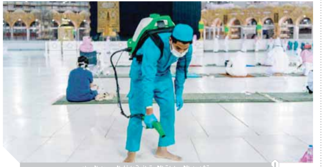
تشديد الإجراءات الاحترازية داخل المسجد الحرام