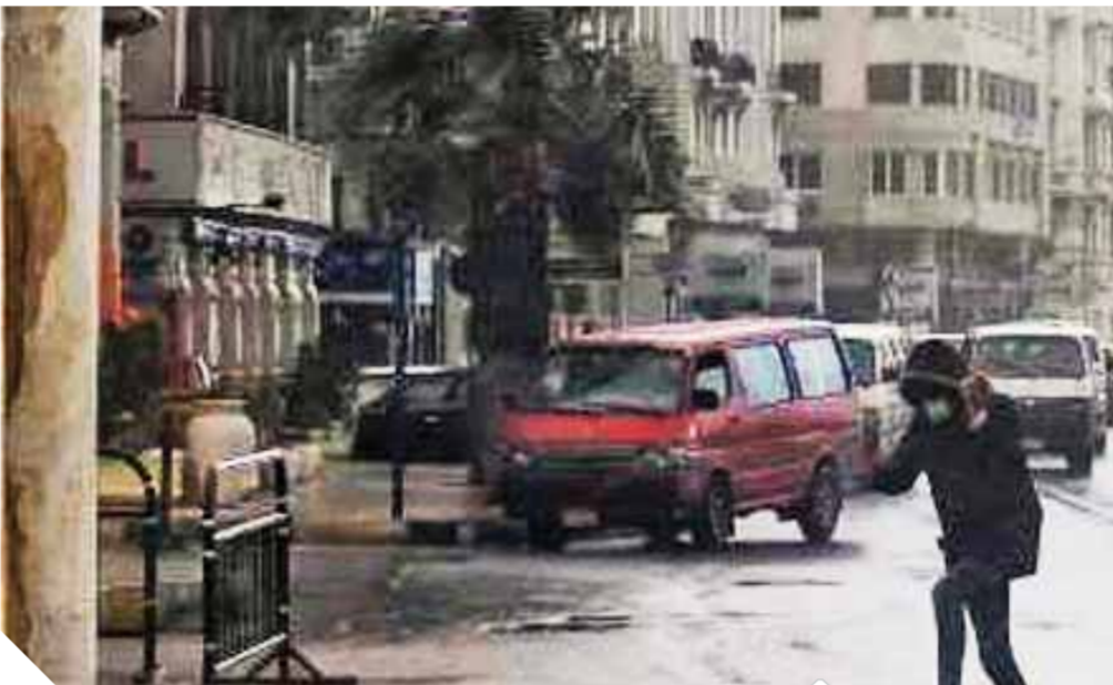
رياح وأمطار غزيرة داخل المدينة