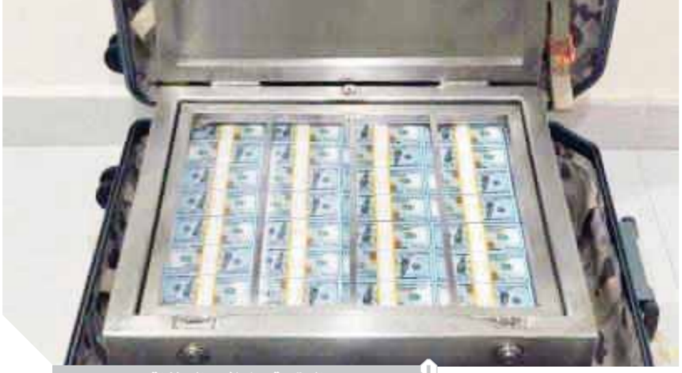
الحقيبة فيها ملايين الدولارات

تم إرسال كيم ٥ صور فيديو مدته ١٠ ثوان توضح مراحل سير الشحنة ووصولها إلى أحد المطارات.