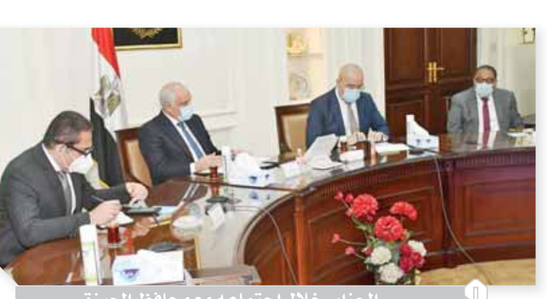
الجزائر، خلال اجتماعه مع محافظ الجيزة

المواطنين المستحقين لتلك الوحدات، حيث إن نسبة الإنجاز بالمشروع تجاوزت ٩٠٪. وخلال الاجتماع، كلف وزير الإسكان، صندوق تطوير المناطق العشوائية، بتنفيذ أعمال تسويق الموقع، وتجميل المنطقة المحيطة بالمشروع، من أجل ظهور المنطقة بمظهر حضارى، وتوفير بيئة عمرانية للمستفيدين من المشروع. كما تم استعراض الموقف التنفيذى لعدد من مشروعات التطوير الجارى تنفيذها بمحافظة الجيزة، وموقف تسكين المستحقين للوحدات بها، وكذا استعراض مقترحات المحافظة لتطوير بعض المناطق غير المخططة من أجل الارتقاء بالمستوى الحضارى لمحافظة الجيزة.