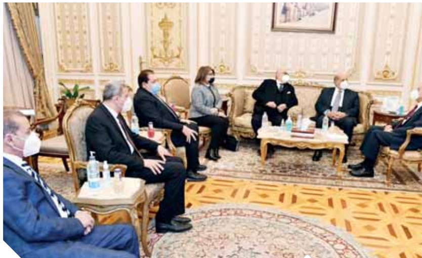
المستشار أبوشقة خلال زيارته رئيس مجلس الشيوخ المستشار رجاني

صحيفة يومية أسسها فؤاد سراج الدين عام ١٩٨٤ برئاسة تحرير مصطفى شردى