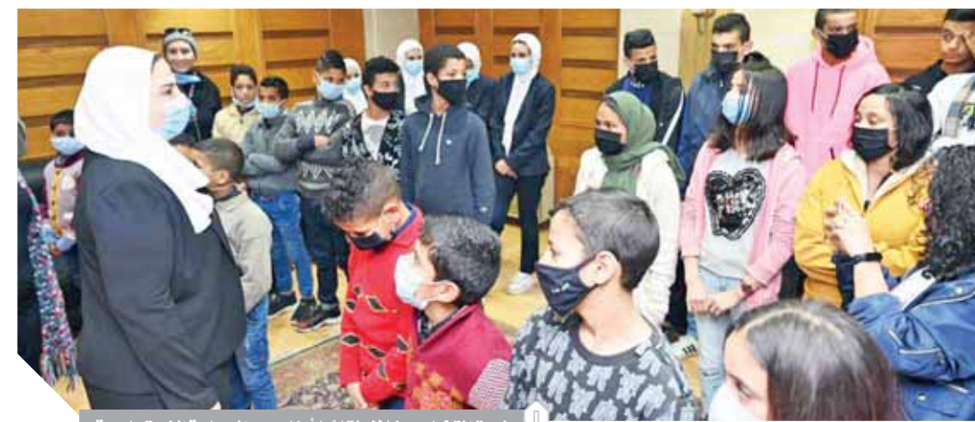
وزيرة التضامن خلال لقائها أبناء دور الرعاية الاجتماعية

كما أفادت «الفيحاء» بأن الرئيس أصدر توجيهاته بمد الدعم التقنى لأبناء وبنات أسر «تكاقل» حتى التخرج فى الجامعة بما يشمل دعم أسرهم ودفع مصروفات الجامعة عنهم. وتضمنت التخصصات الدراسية التى فخره وتمت إتاحتها للمتح فى الدفعة الأولى مجالات عديدة تضم الزراعة، والطاقة، والمياه، وعلوم الحاسب الآلى، والهندسة، والبيئية، والصحافة، وإدارة الأعمال والاقتصاد.