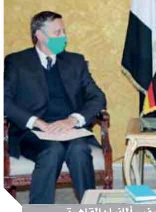
وزير، يستقبل سفير ألمانيا بالقاهرة

عملاقة تحت قيادة الرئيس عبدالفتاح السيسي، مشيراً إلى أن اتجاه مصر نحو تطوير البنية التحتية فى شتى المجالات خاصة قطاع النقل والسكك الحديدية من شأنه أن يخلق فرصاً جديدة لقطاع الطاقة الكهربائى وهو نفس الاتجاه الذى اتخذته الدول المتقدمة.