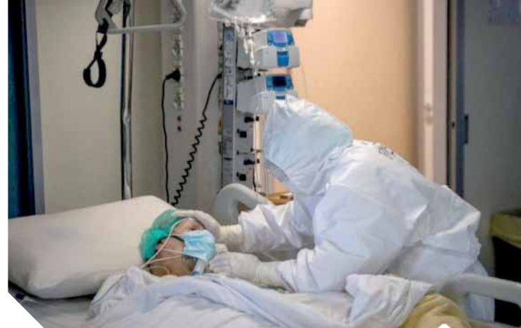
فيروس كورونا يزيد من معدل استهلاك النفايات الطبية