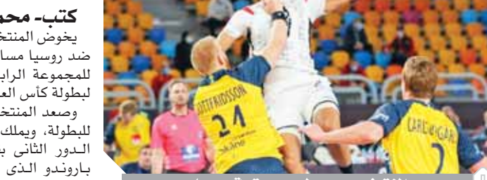
المنتخب يسعى لعبور عقبة روسيا

صاحبة المركز الثانى فى المجموعة. وقدم اتحاد كرة اليد احتجاجاً رسمياً ضد الترويض جبروم لارس حكم لقاء السويد الذى خسره الفراعنة بنتيجة ٢٤-٢٣ فى ختام الدور الأول لعدم توفير الحماية الكافية للاعب المنتخب خلال اللقاء. وأبدى اتحاد اليد استغرابه من تعيين نفس الحكم للمباراة الثانية على التوالى لمنتخب السويد بخلاف أن مدرب السويد نروجى الجنسية وهو ما يحمل شهية الجاملة المنتخب السويدى.