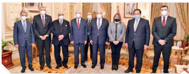
عبدالرازق وأبو شقة يقدمان التهنية إلى المستشار جبالى رئيس مجلس النواب

البرلمان بغرفتيه، وأنه من المنتظر أن تكون أمام ثورة تشريعية في الفترة المقبلة، لتحقيق طموحات المواطن المصرى، وما يصبو إليه لنصل إلى إنجاز المشروع الوطنى للرئيس عبدالفتاح السيسى فى بناء دولة ديمقراطية حديثة، ولتكون أساساً تعددية سياسية وفكرية واقتصادية وحزبية، لبناء دولة ديمقراطية حديثة، يسود فيها الاستقرار السياسى والأمنى والاقتصادى، والتغلب الحقيقى للمادة الخامسة من الدستور التى تنص على أن النظام السياسى يقوم على أساس التعددية السياسية والحزبية والتداول السلمى للسلطة، وهو ما يعنى أننا نسير بخطى راسخة وثابتة