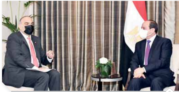
«السيسى» خلال لقائه رئيس وزراء الأردن

شهد اللقاء استعراضاً لمجمل العلاقات الثنائية بين البلدين، حيث تم التأكيد على تعزيز الجوانب الاقتصادية وزيادة التبادل التجارى بما يرقى إلى مستوى العلاقات السياسية والروابط التاريخية التي تجمع الشعبين الشقيقين، فضلاً عن التعاون بين الجهات الصحية والطبية المختصة في البلدين فيما يتعلق بمواجهة تداعيات جائحة كورونا. كما شهد اللقاء استعراض آخر مستجدات الأوضاع في المنطقة خاصة في كل من سوريا وليبيا واليمن، إضافة إلى تبادل الرؤى فيما يخص جهود مكافحة الإرهاب والفكر المتطرف، حيث تم التوافق حول أهمية تكثيف التنسيق وتبادل الخبرات والمعلومات بين الأجهزة المختصة بالجانبين لمواجهة التحديات التي تفرضها هذه الظاهرة على الأمن الإقليمي بأسره.