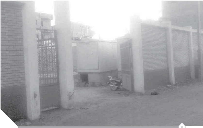
محطة صرف زوير متوقفة