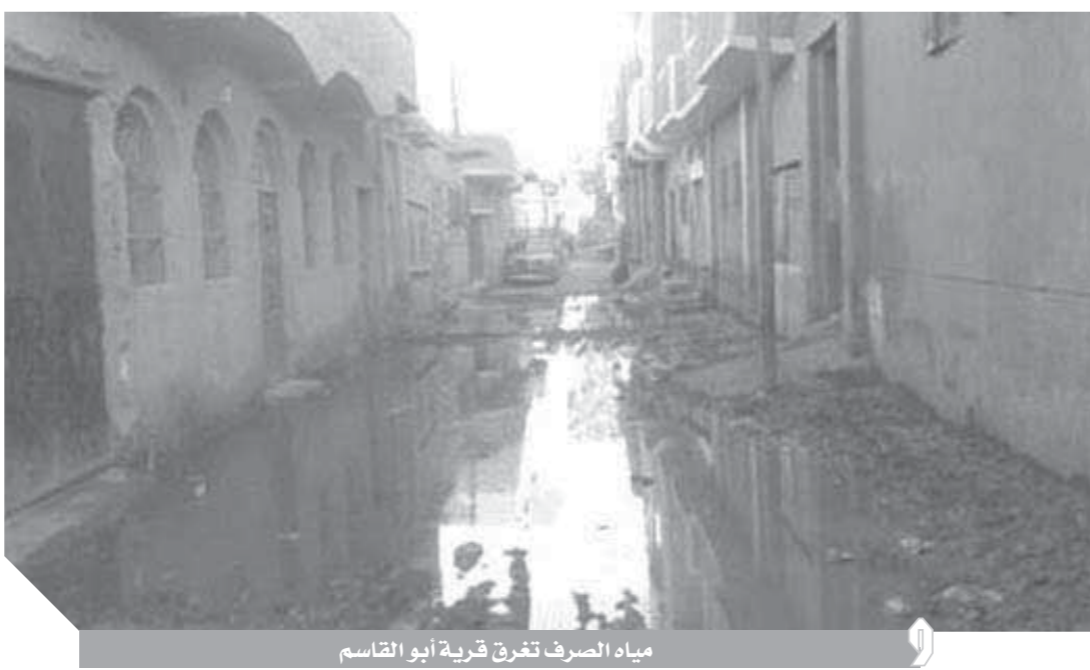
مياه الصرف تغرق قرية أبو القاسم