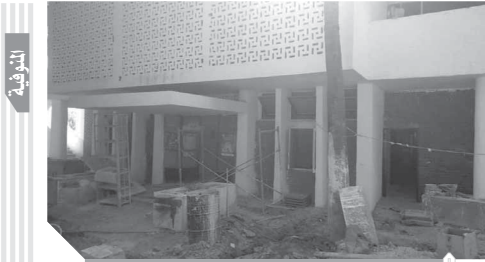
جزيرة الدوم تحتاج إلى نظرة المسؤولين