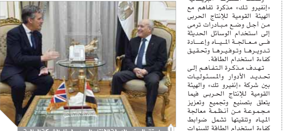
استقبال وزير الدولة للإنتاج الحربي لممثل الشركة العالمية

وقعت الشركة البريطانية «إنفيروتك» مذكرة تفاهم مع الهيئة القومية للإنتاج الحربي من أجل وضع مبادرات ترمي إلى استخدام الوسائل الحديثة في معالجة المياه وإعادة تدويرها وتوفيرها وتحقيق كفاءة استخدام الطاقة. تهدف مذكرة التفاهم إلى تحديد الأدوار والمسئوليات بين شركة «إنفيروتك» والهيئة القومية للإنتاج الحربي فيما يتعلق بتصنيع وتجميع ومعالجة مجموعة من أنظمة معالجة المياه وتفتيتها تشمل ضوابط كفاءة استخدام الطاقة للسنوات القادمة. وذكر جيفري آدماس السفير البريطاني بالقاهرة أن الاتفاقية تعكس التزام المملكة المتحدة بدعم النمو والتنمية في مصر. وقال إن هدفنا يتمثل في تشجيع الاستثمار في مجموعة واسعة من القطاعات في البلاد، مؤكداً أنه يتطلع إلى رؤية تعاون أعمق بين بلدينا والقطاعات الاستراتيجية والعمل والقطاعات المؤهلة لفرض العمل