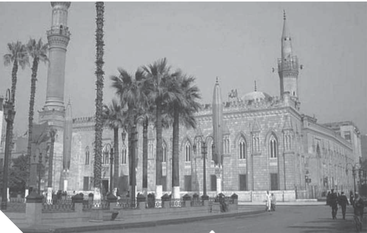
مسجد الحسين ومساحته الخارجية