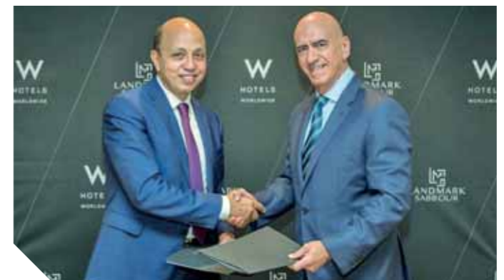
جانبا من اتفاقية توقيع الاتفاقية

أعلنت لاندر مارك صبور، الشركة الرائدة في مجال تطوير العقارات عالية الجودة عن توقيعها اتفاقية مع شركة ماريوت الدولية (المدرجة بالبورصة NASDAQ: MAR) بشأن إنشاء فندق W القاهرة بتصميم ذي طابع فريد وعصري مع توفير مجموعة متكاملة من الخدمات المتميزة والبرامج المتكاملة على مدار الساعة في القاهرة، مما يعكس الطلب المتنامي على الفخامة والرفاهية في مصر. يقع فندق W القاهرة بمشروع (NINETY - 1) متقدم الاستخدامات بالقاهرة الجديدة، والمساح على مساحة ٣٠٠ الف متر مربع، والذي يضم مساحات للعب والتجزة والوحدات التجارية والسكنية والإدارية. يبلغ حجم استثمارات شركة لاندر مارك صبور بمشروع (NINETY - 1) ٢٨ مليار جنيه (١.٠٧٥ مليار دولار أمريكي) ومن المقرر أن يتم افتتاح الفندق في عام ٢٠٢٤.