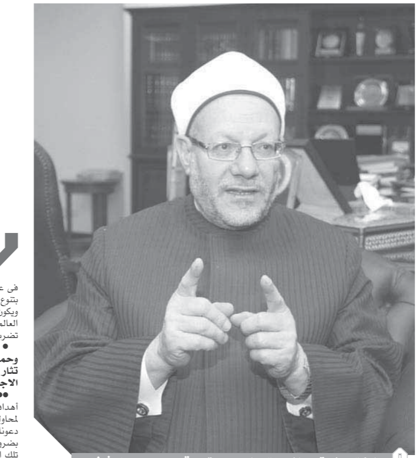
الدكتور شوقي علام مفتي الجمهورية