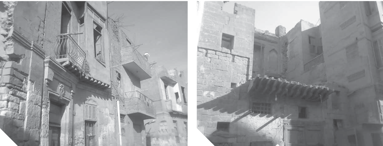
بيوت آيلة للسقوط في درب اللبانة وسكة الحجر

تحيطها المساجد الأثرية العريقة من كل مكان، وتحوى على العديد من المباني إلا أنها غابت من الإجمال، حتى أن عدداً من بيوتها التاريخية التي تتوسط واجتاج إلى تدخل سريع للحفاظ عليه وإعادة تأهيله، لأن سقوط مثل هذه البيوت خسارة كبيرة لفن العمارة الإسلامية. أما سكة الحجر فهاها لا يختلف كثيرا في البنية، فهي الكثير من البيوت القديمة المهتدة بالسقوط، رغم أنها تمتاز بالحمال والطراز المعماري الشامخ على الشريبات والأبواب المزخرفة. وسكة الحجر، أو ما كانت تسمى ميدان الرملة في الماضي، بجانب ميدان تحت أحد آثار دولة المماليك الجراحسة، وتلك البيوت التي كانت مخصصة في القرن الثامن عشر من الأجيال، وكانت رعاية الملك الناصر محمد بن قلاوون، ثم الملك الظاهر حقيق، وظلت تخدم هدفا إلى ما يقرب من تسعين عاما، بالإضافة لعدد آخر من موقع هذه الحارة المرتفع يجعلها متميزة وفريدة من نوعها، فمن خلال نوافذ وأسقف بيوتها تستطيع رؤية مساجد الخاتم على الرسل والسفراء، وفي استمران الجيوش والرفاعي والمحمودية وقائى باب الزواجر، فضلا عن قصر محمد على والناصر، قلاوون بالقلعة. وتعتبر العمارة أهم ما يميز درب اللبانة، لأنها تملك على الأبراج والكثير من هنا جاءت فكرة بيت المعمّر المصري، الذي اتخذ من درب اللبانة مقرا له، وكان المهندس الكبير حسن فتحى، والذي نال شهرة عالمية