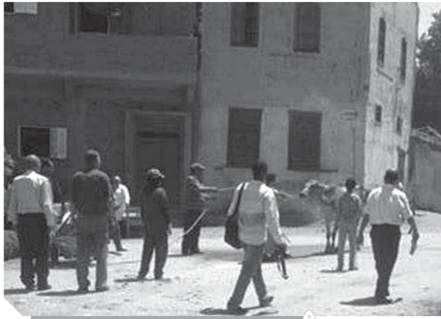
«الأقادمة، بدون خدمات»

تعد قرية «الأقادمة» التابعة لمركز أبو تيج في محافظة أسيوط من القرى التي تعاني من نقص الخدمات، لذا تم تصنيفها ضمن قائمة القرى الأكثر احتياجاً على مستوى الجمهورية التي صدرت خلال تقارير رسمية مؤخرًا، وعندما أعلن الرئيس عبدالفتاح السيسي، رئيس الجمهورية، عن تنفيذ مبادرة «حياة كريمة» أعاد الأمل والحياة إلى قلوب مواطنيها للحصول على الخدمات الرئيسية وإيجاد حلول للمشاكل التي تواجههم إلا أنهم في انتظار تنفيذ تلك الوعود حتى الآن، مطالبين بانتشالهم من هذا المستقع الملىء بالمشكلات خاصة أن القرية يقطن بها ما يقرب من ١٤ ألف نسمة.