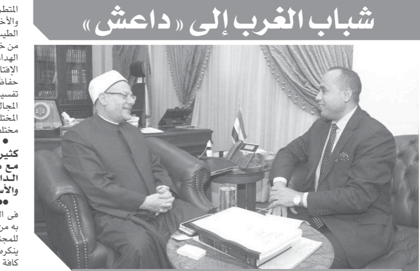
الدكتور شوقي علام مفتي الجمهورية يتحدث لـ «الورد»