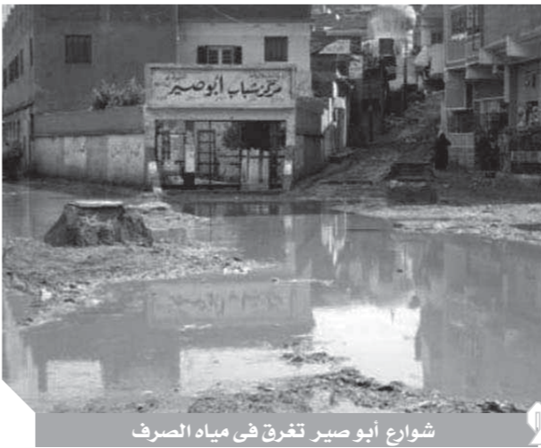
شوارع أبوصير تغرق في مياه الصرف

نظرا لتساقط ترعة الري الرئيسية لمدخل القرية بالقمامة والخلفات والحيوانات الميتة.