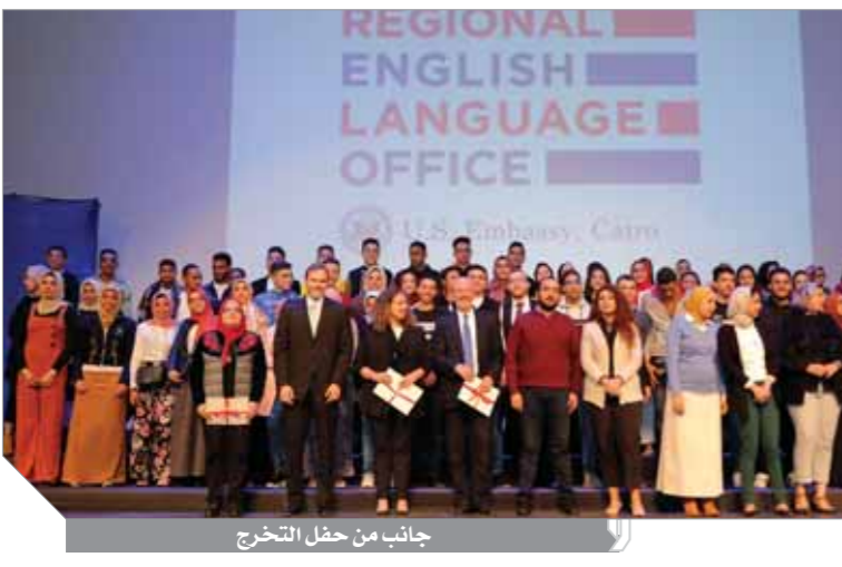
جانب من حفل التخريج

التدريبية (أميدايس) والجمعية المصرية لمصادر التعليم، حيث يتولى الشركاء تنفيذ المنحة في مصر والإشراف على عملية التعلم. ويذكر أن هناك أكثر من ٥٠٠٠ طالب وطالبة من الشباب المصري المؤهل للاستفادة من البرنامج قد تعلموا اللغة الإنجليزية من خلال حصولهم على المنحة منذ عام ٢٠٠٦. كما أنه قد تخرج أكثر من مائة ألف طالب من هذه المنحة على مستوى العالم.