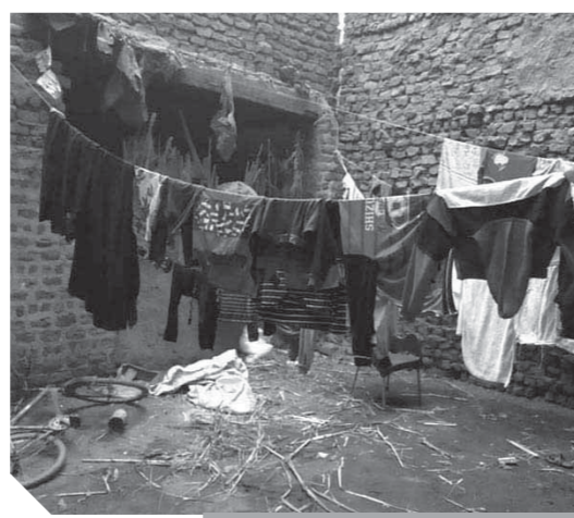
«الحسامدة، تعيش في العصور الوسطى»

مبادرة «حياة كريمة» التي أطلقها الرئيس عبدالفتاح السيسي لتطوير القرى الأكثر فقراً وهبت هذه القرى التي تم اختيارها ضمن المبادرة قلة الحياة وبت روح الأمل في سكانها ومنحتهم طوق النجاة خاصة قرى محافظة سوهاج التي تحتل المحافظة الثانية في ترتيب المحافظات الأكثر فقراً بعد محافظة أسيوط، والتي ينهش الفقر والجهل والمرض أهاليها منذ عقود طويلة رغم الوجود الحكومي المتكررة لمواجهة أزمتها، إلا أن الظروف السيئة بها تزداد خطورة وتفاقماً يوماً بعد يوم. قرية الحسامدة التي يبلغ عدد سكانها حوالي ٤ آلاف نسمة تقريباً لا يوجد بها سوى مدرسة واحدة للتعليم الأساسي «ابتدائي وإعدادي» وتعاني فضولها التكدس والأزدحام والكثافة العالية في عدد التلاميذ وتحتاج إلى مدرستين ابتدائي وإعدادي لتقليل الكثافة داخل الفصول وتحصيل التلاميذ دروسهم واستيعابها، كما تحتاج القرية إلى مدرسة ثانوية ومعهد ديني أزهري لأن الأسر التي ترغب في إلحاق أبنائها بالتعليم الأزهرى تضطر إلى الذهاب بهم إلى معهد سليم الأزهرى بقرية «سليم» المجاورة لها التي تبعد أكثر من ٧ كم كما لا يوجد بها مدرسة للفصل الواحد مثل بعض القرى لتعليم التلاميذ الذين اضطرتهم الظروف لتترك التعليم. وتتقرب القرية إلى مركز شباب والذي أصبح الآن ضرورياً لكي ينشد الشباب من الجلس على المقاهي أو بالطرقات والتوازع مع ارتفاع نسبة البطالة وشغل أوقات فراغهم بممارسة