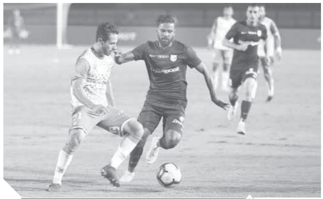
المصري خسر من إنبي