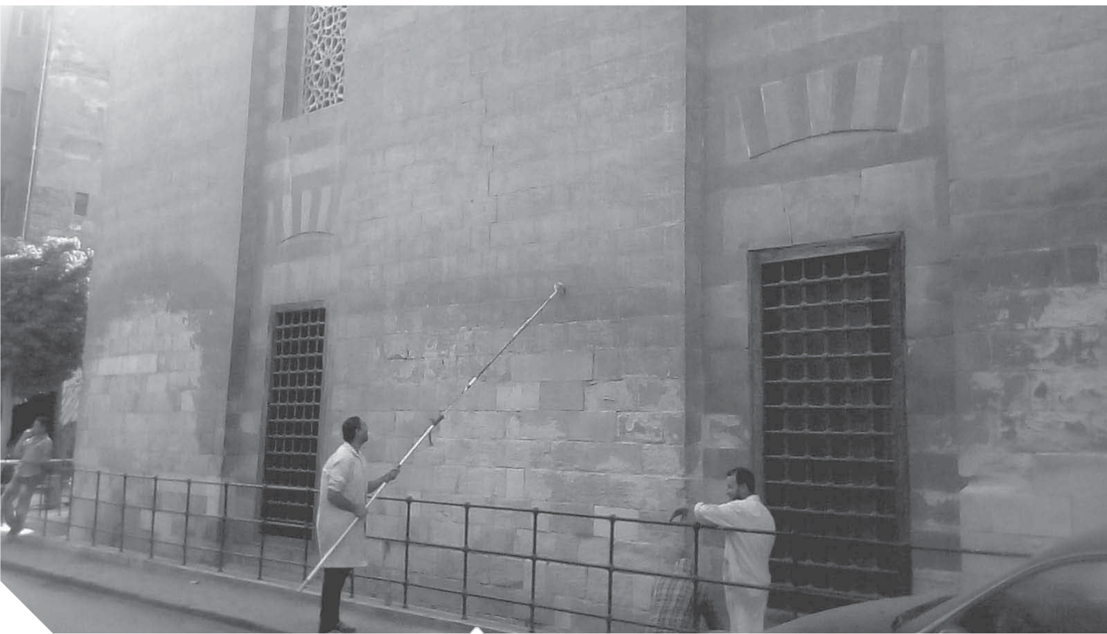
عمليات ترميم بشارع باب الوزير

الأولى للشارع المدخل الرئيسى له، حيث تحوى على بعض الترميمات لسبب ودرج توضع ما كان عليه الشارع قديما كموقع لانتاج السلاح. وعلى بعد خطوات من البوابة نجد جامع الشيخ اليربوسى، الذي أنشاه الأمير سيد محمد كريمة وصاحبه الماخلة الكبيرة، وإلى جانب منطقة السرد الأحمر، وكان يطلق عليه في البداية «سوقية العزيز» نسبة إلى الأمير عز الدين بهادر، أحد أمراء المماليك البحرية الذي كان يسكن فيه، ولكن بعد مرور الوقت بدأ الناس يطلقون عليه اسم «سوق السلاح»، نظرا لوجود العديد من ورش ومصانع الأسلحة على اختلاف أنواعها فيه، من رماح وسيف ودرج، حيث كان الشارع يقدم خدماته التسليحية للقلعة أثناء حكم المماليك بمصر. وفي حديثه عن سوق السلاح، طالب الشيخ مصطفى السيد، رئيس إشراف الأعمال على كنفه، من قبل وزير الأثار، بإصلاح شبكات الصرف الصحي، حتى يتحول إلى مزارع سياحى، كنفه العز. وكما يمثل شارع ونه يحوى على عدد من الأثار الإسلامية التي لا مثل لها في القاهرة.