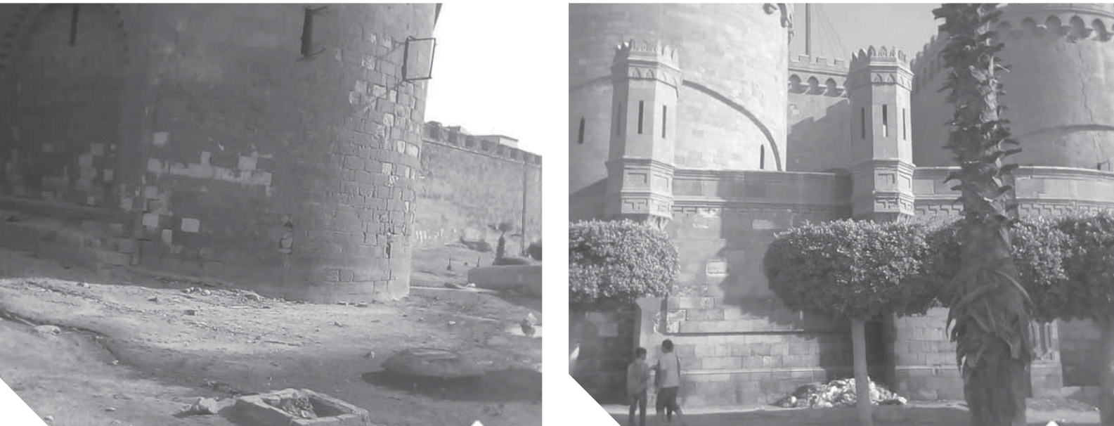
مخطط الصرف الصحي أمام باب الغرب