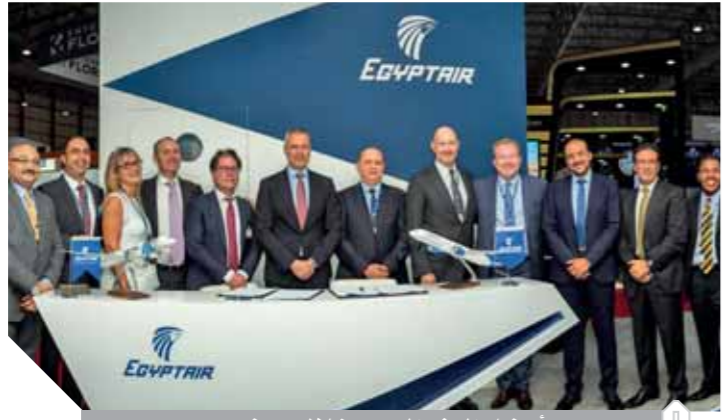
أعضاء الوفد المصري خلال معرض دبي

مصلحة الطبيب وتعليمه وتدريبه تأتي على رأس أولويات الوزارة، مؤكداً أن الوزارة تتخذ بالفعل خطوات جادة لتحقيق ذلك، حيث تم توقيع مذكرة تفاهم مع جامعة هارفارد الأمريكية لتدريب المدربين ببرنامج الزمالة المصرية على طرق التعليم الطبي، على مدار عدد من الدورات تبدأ من شهر ديسمبر المقبل، بالإضافة إلى اعتماد المناهج العلمية لزمالة طب الأسرة من الجمعية الملكية البريطانية، كما سيتم اعتماد المناهج العلمية في عدد من التخصصات تبعاً، بالإضافة إلى اعتماد عدد أكبر من المنشآت الطبية ضمن برنامج الزمالة المصرية. وأضافت «زايد» أن البرنامج الجديد للتدريب يهدف إلى خلق فرص تدريبية للأطباء الذين كانوا يعانون من الحصول على فرص تعليمية وتدريبية تؤهلهم مهنيًا، موضحة أن هدف الوزارة في نظام التدريب الجديد هو توفير الفرص التعليمية التدريبية والتأهيلية لـ ٧٠٪ من الأطباء الملتحقين ببرنامج الزمالة المصرية بهدف خلق جيل جديد قادر على تقديم أفضل خدمة طبية للمرضى، كما أشارت إلى أن الوزارة تبذل جهوداً مستمرة لصالح الطبيب، لافتة إلى أنه تم التعاقد مع بنك المعرفة لإتاحة منصة التعليم الإلكتروني للأطباء، ونظام التعليم التفاعلي.