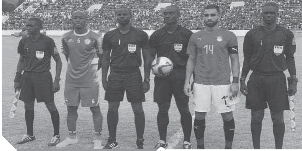
حكام المباراة وضربة البداية

أقلت المنتخب الوطني بأعجوبة من موقعة جزر القمر بتعادل سلبي بالعاصمة موروني في الجولة الثانية لتصفيات المجموعة السابعة المؤهلة لنهائيات إفريقيا ٢٠٢١ بالكاميرون. ارتفع رصيد منتخب مصر إلى نقطتين بينما تصدر جزر القمر المجموعة برصيد ٤ نقاط قبل لقاء كينيا صاحب النقطة الواحدة - مع توجو بدون رصيد في العاصمة الكينية نيروبي في السادسة مساءً بتوقيت القاهرة. جاء اللقاء لصالح صاحب الأرض، وأهدر مهاجمو عدة فرص سهلة على مدار الشوطين باستثناء تسديدة محمود كهربا يسرته تصدت لها العارضة في بداية الشوط الأول، وانفراد تريزيجييه وإهداره فرصة الترجيح. وأهدر الفارادو وإبراهيم مادي وبكاري سعيد ويوسف ماتشنجاما عدة فرص على مدار الشوطين، بعضها من انفراد، وكالعادة استمر المنتخب في أخطائه الدفاعية والهجومية ولولا يقظة وتوق محمد الشناوي نفسه لخرح المنتخب بخسارة وفضيحة.