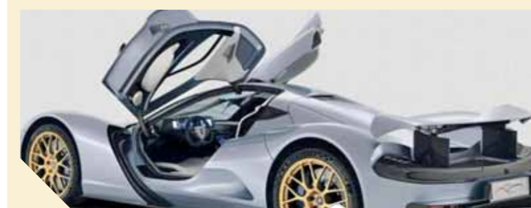
أسرع سيارة في العالم

وجرى الكشف عن البومة للمرة الأولى، كنموذج أولي، عام ٢٠١٧، لكن النسخة الجاهزة للبيع عرضت في معرض السيارات في دبي، الذي اختتم أعماله، السبت. وتبلغ سرعة السيارة اليابانية الجديدة ٢٥٠ ميلاً في الساعة، أي ما يعادل ٤٠٢ كيلو متر في الساعة.