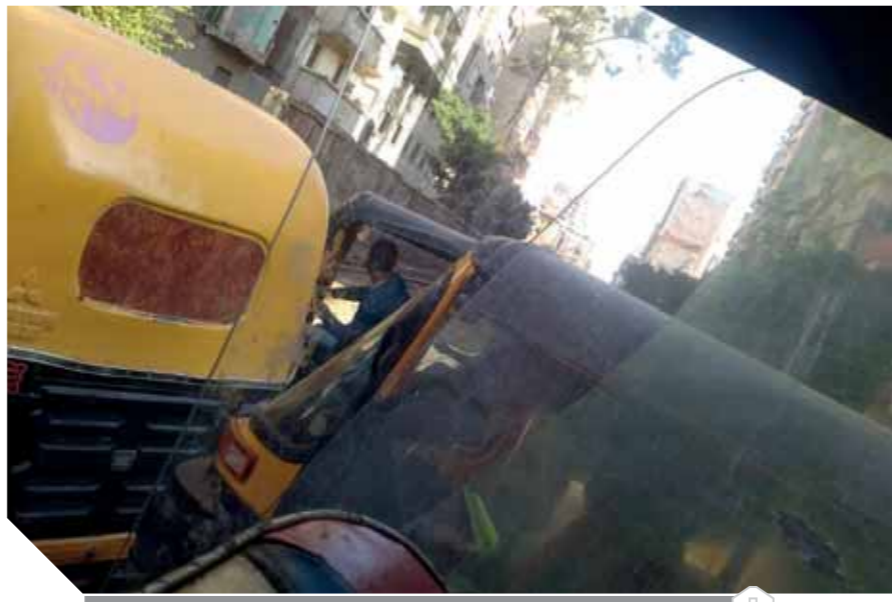
فوضى التكاك من موقع الحادث