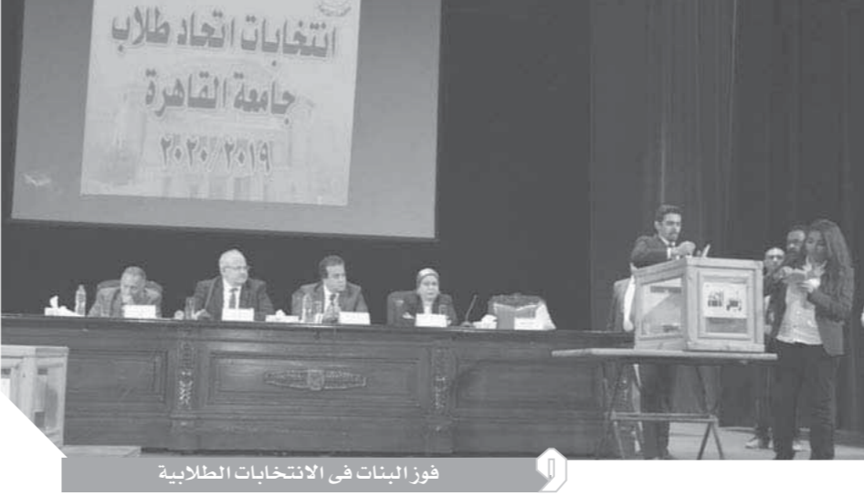
فوز البنات فى الانتخابات الطلابية

وقال الدكتور محمد الخشت، إن الانتخابات الطلابية فى جامعة القاهرة، هذا العام، تتم فى إطار من الحياد والشفافية والنزاهة التامة، وتقدم نموذج مختلف للانتخابات الطلابية من عدة جوانب، ومن أهمها المظهر الحضارية للمنافسة، حيث لم يتم السماح عن أى مشاحنات أو احتجاج لأى مجموعة من الطلاب، مشيراً إلى أن كل أبناء الجامعة هم أبناء التيار الوطنى العلم، ومؤكداً أن الجامعة ضد العرقية والطائفية والتحيز.