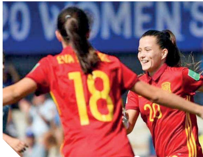
لقطة من الدوري الإسباني لكرة النسائية

أعلنت لاعبات الدوري الإسباني، الدخول في إضراب للمطالبة بتحسين الأجور وحماية العمال، ما تسبب في تأجيل عدد من المباريات.