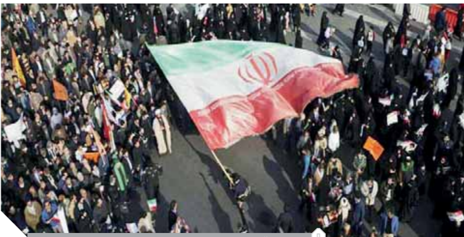
مئات الآلاف من الإيرانيين يتظاهرون لليوم الرابع على التوالي

سقوط عشرات القتلى.. وتقارير تكشف وصول ثروة «خامنى» إلى ٢٠٠ مليار دولار