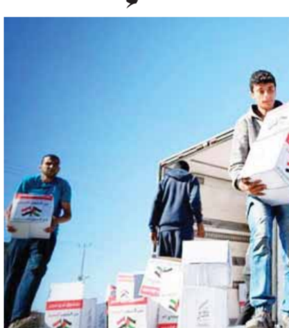
صندوق تخيا مصر

وفى عام ٢٠١٤ خصصت الامارات مبلغ ١٥ مليون دولار لإعادة تأهيل مدينة جنين كما قدمت الجزائر