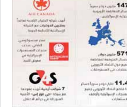
المقاطعة الاقتصادية للاحتلال... خسائر بالمليارات

إغاثية غزة تحت شعار «قلوبنا مع غزة»، حددت فيها