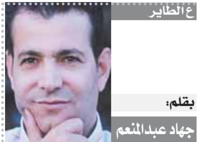
بِقلم: جهاد عبد المنعم

الشباب في قلب الاتصالات الإبداع والتميز والابتكار والجاهزية لمواجهة التحديات الحالية والمستقبلية كلها مفردات لمعنى واحد هو إعداد الشباب وظائف وأعمال جديدة وكثيرة خلفتها تكنولوجيا المعلومات والاتصالات ولا تتميزين بالمعنى القديم بل لكل الوظائف المكتبية والحضورية والانصراف دون إنجاز عمل حقيقي. ولعل أبرز ما يميز قطاع الاتصالات وتكنولوجيا المعلومات عالمياً وليس هنا في مصر فقط أنه قطاع شبابي من أجدهم ويهم بنمو ويخلق ملايين من فرص العمل الحقيقية ذات الدخل المرتفع ولا يقل هذا القطاع الحيوي أنصاف الحلول أو قل أنه لا يرحب إلا بالمتعلمين الذين يتدربون تدريباً جيداً وأصحاب المهارات والقدرة والمبدعين والمبتكرين أوفر حظاً وليس غريباً أن نجد أن أغنى أقطاب العالم حالياً ومستقبلاً طبياً من أصحاب شركات تعمل في تكنولوجيا المعلومات والاتصالات والرقمنة والذكاء الاصطناعي بشكل أو بآخر وكذلك معروف عالمياً أن الوظائف الأكثر دخلاً والأكثر طلباً في سوق العمل هي تلك المتعلقة بقطاع تكنولوجيا المعلومات والاتصالات.