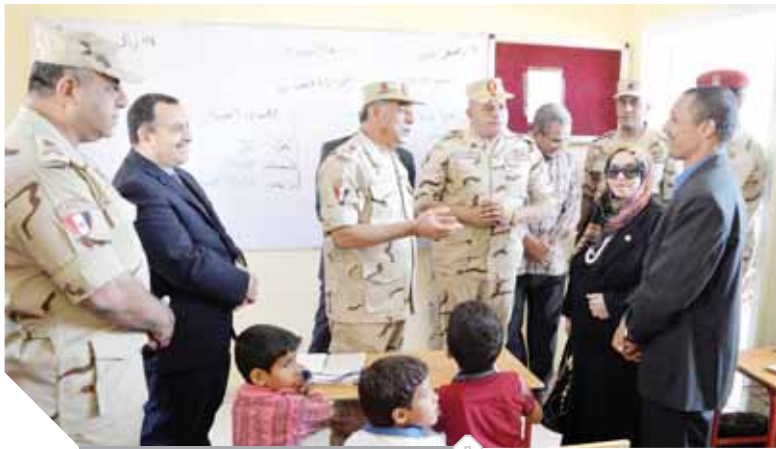
فصول تعليمية مزودة بكافة الأشرطة والخدمات