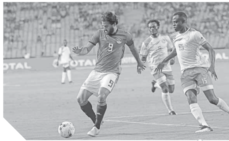
المنتخب يستعد لمواجهة نسور قرطاج في برج العرب

وتعتبر مواجهة نسور قرطاج مباراة تحصيل حاصل، لكنها ستكون مهمة في حسم صدارة المجموعة، خاصة بعد تاهل المنتخب إلى نهائيات أمم إفريقيا للمرة الرابعة والعشرين على التوالي، حيث يحتل المركز الثاني برصيد 9 نقاط خلف المتصدر تونس برصيد ١٢ نقطة، ثم يأتي النيجر وإي سواتيني برصيد نقطة واحدة. وقرر مسئولو اتحاد الكرة اختيار السادسة مساءً من يوم 16 نوفمبر لإقامة المباراة، حيث حدد إقامتها على ملعب برج العرب بعد موافقة الجهات الأمنية، ليعود الفراغ إلى نفس الملعب الذي شهد تأهلهم إلى نهائيات كأس العالم الأخير. وكشف مصدر من اتحاد الكرة، أن عودة المنتخب للعب على ملعب برج العرب جاءت