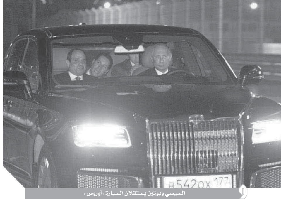
السيسي وبوتين يستقلان السيارة «أوروس»

أطلع الرئيس الروسي فلاديمير بوتين، الرئيس عبد الفتاح السيسي، على سيارات «أوروس» الجديدة، المعروفة ضمن مشروع «كورتيج» الروسي. وبعد الانتهاء من الاجتماع الثنائي بين الرئيسين، اصطحب الرئيس بوتين نظيره المصري في سيارة خاصة لمعرض السيارات، الذي يقام فيه سباق الجائزة الكبرى للفورمولا 1 «الروسى». وقدم وزير الصناعة والتجارة الروسي، دينيس مانوروف للرئيسين فئات أخرى من سيارات أوروس منها سيارة السيدان «سينات»، فضلا عن سيارة «أرسينال» واقترح بوتين أن يقوم السيسي باختيار سيارة السيدان أثناء التنقل وتوجلا فيها.