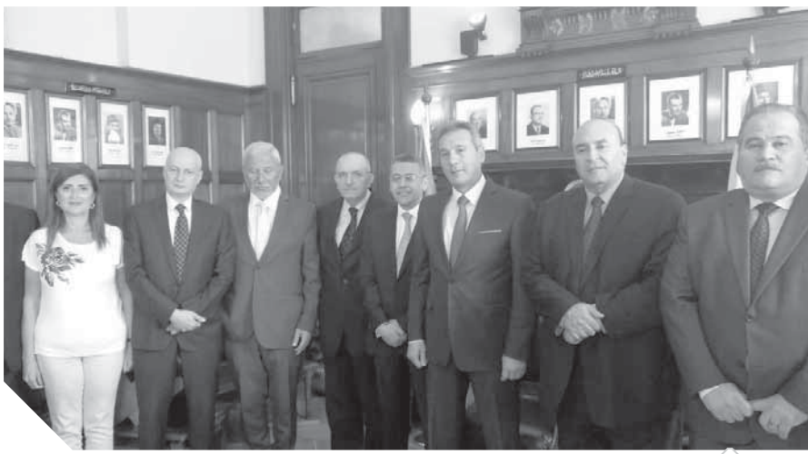
الاترىي خلال استقباله للوفد البنائى

إلى المبادرة التى بدأتها النقابة العامة للبنوك للم الشمل العمالى العربى فى هذا القطاع والناتى لافقت ترحيباً من اتحادات عمال المصارف فى السودان لهذا الاتحاد بالقاهرة قريباً.