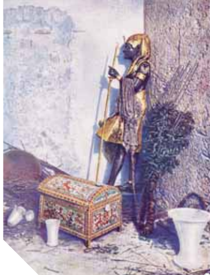
المقبرة تضم العديد من الكثور الفرعونية

تحتفل محافظة الأقصر بذكرى مرور 96 عاماً على اكتشاف مقبرة الملك توت عنخ آمون الفرعون الذهبي التي تحل في الرابع شهر نوفمبر المقبل، بافتتاح مشروعات أثرية جديدة وإقامة معارض فنية وعروض فلكلورية في المدينة وبين معالمها الأثرية والتاريخية.