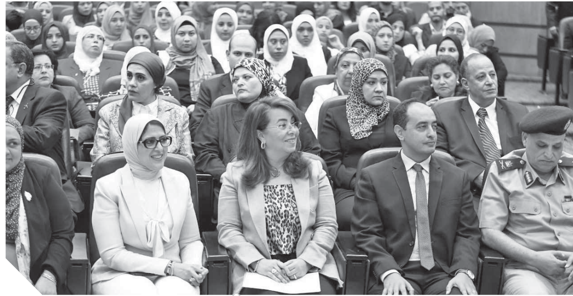
والى اثناء مشاركتها توقيع البروتوكول