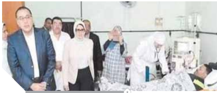
رئيس الوزراء خلال زيارته لمستشفى بورسعيد العام

محافظ القليوبية. وتقدم رئيس الهيئة بالشكر للمحافظ على جهوده لتوفير مبنى لفرع هيئة قضايا الدولة، مؤكدا أن الحكومة ستراعى خلال الأعوام القادمة إنشاء مقرات جديدة مستقلة لفرع الهيئة لتقوم بعملها على أكمل وجه، مقدما عدة نصائح للأعضاء بضرورة العمل بروح الفريق الواحد والعمل بضمير يقظ وترك المظاهر والحرص على تعليم الخبرات للأعضاء الأحدث سنا للوصول إلى العلى الأسمى وهو الحفاظ على المال العام للدولة. وعلى هامش الزيارة تفقد المحافظ مديرية القوى العاملة بالمحافظة والتي تقع في نفس المبنى المخصص لفرع الهيئة والتي يعمل بها بكافة الإدارات وتفقد سير وانتظام العمل بها واستمع في حوار بناء لمطالب العاملين ووجههم إلى بذل المزيد من الجهد من أجل توفير فرص عمل للشباب والتسيق مع الشركات الخاصة لإقامة مؤتمرات للتوظيف تسهم في الحد من البطالة والقضاء عليها.