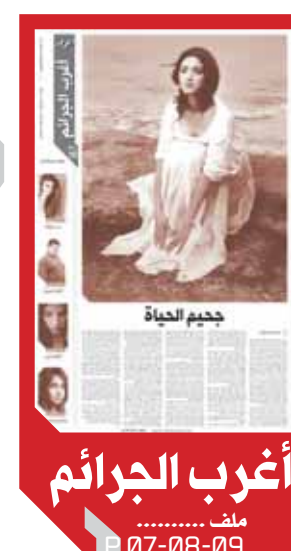
أغرب الجرائم ملف 07-08-09