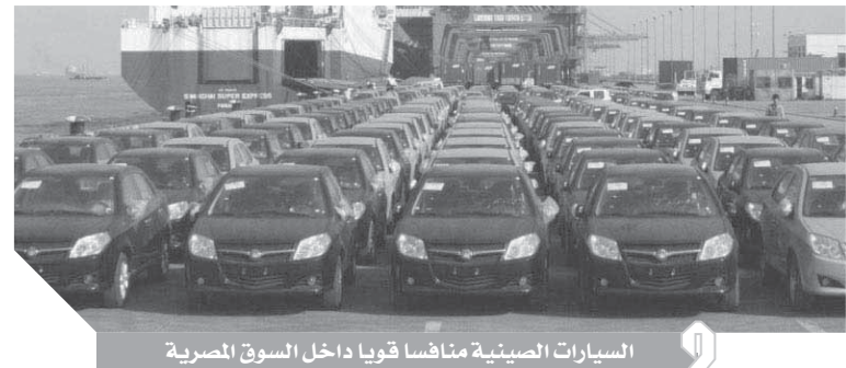
السيارات الصينية منافسا قويا داخل السوق المصرية

بمعدل تراجع بلغ 54.9%. أما المركز السادس فجاء من نصيب دومي، أحدث علامة صينية تبدأ عملياتها بالسوق المصرية. بعد أن تمكنت من الإفراج عن 85 سيارة، وحصدت فائز المركز الثامن بإجمالي 70 سيارة مستوردة، بنمو عن العام الماضي 4.5%. وتمكنت هيمما من اقتصاص المركز السابع في القائمة بإجمالي 34 سيارة فقط، وتراجعت بايك سينوفا إلى المركز السادس في قائمة العلامات الصينية الأعلى استيراداً للسيارات، خلال الشهور السبعة الأولى من العام بإجمالي 147 سيارة، مقابل 326 وحدة،