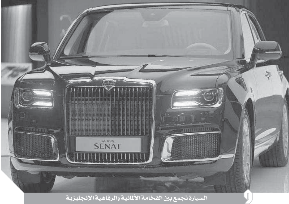
السيارة تجمع بين الفخامة الألمانية والرفاهية الإنجليزية