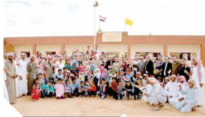
جانب من مراسم الافتتاحات الجديدة للمدارس