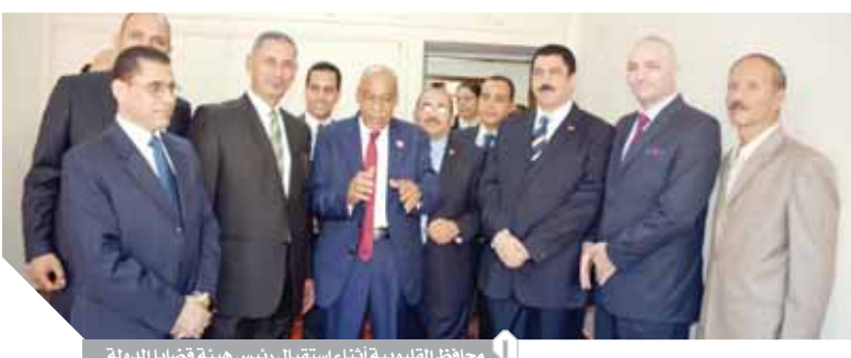
محافظ القليوبية أثناء استقبال رئيس هيئة قضايا الدولة

استقبل الدكتور علاء عبدالحليم، محافظ القليوبية، المستشار حسين عبده خليل رئيس هيئة قضايا الدولة، لافتتاح فرع هيئة قضايا الدولة ثان بالقليوبية بعد تطوره، حضر اللقاء المستشار لاشين إبراهيم رئيس الهيئة الوطنية للانتخابات والمستشار سيد خاطر نائب رئيس الهيئة والمستشار محمد ماضى النائب الأول للهيئة والمستشار أيمن البقلاوى رئيس القطاع. وأشاد المحافظ بالتعاون بين هيئة قضايا الدولة والمحافظ في عدد من الملفات المهمة والموضوعات الحيوية في المجالات التي تكون هامة طرفا مختصا بالثب فيها، فضلا عن السرعة إنجازها والدفع بالجهود التنفيذية والتنموية، مؤكدا على الدور الحيوى الذى يقوم به القضاء بتحقيق العدالة والحفاظ على أموال الدولة وتميزهم بالعمل بروح الفريق الواحد من أجل مصلحة الوطن، وظهر ذلك جليا في العديد