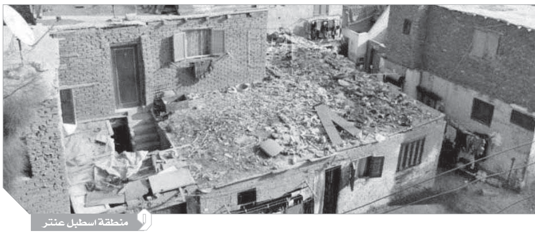
منطقة اسطبل عنتر

الواحد.. الساعة بـ ٢٠٠ جنيهاً وكسر الساعة بـ ٢٠٠ جنيهاً أيضاً فتسمرت جنيهات أو عشرة جنيهات إذا تطلب قدمائى في مكانها وحاولت إثناءهما عن كسر الساعة والالتزام بفرمان ٢٠٠ جنية لأنه لا يجد مفر من هنا فوجدت نظرات نارية إلى شخصى وطالبونى بالالتزام بما قالوه وإذا رفضت أوامرهم فيجب