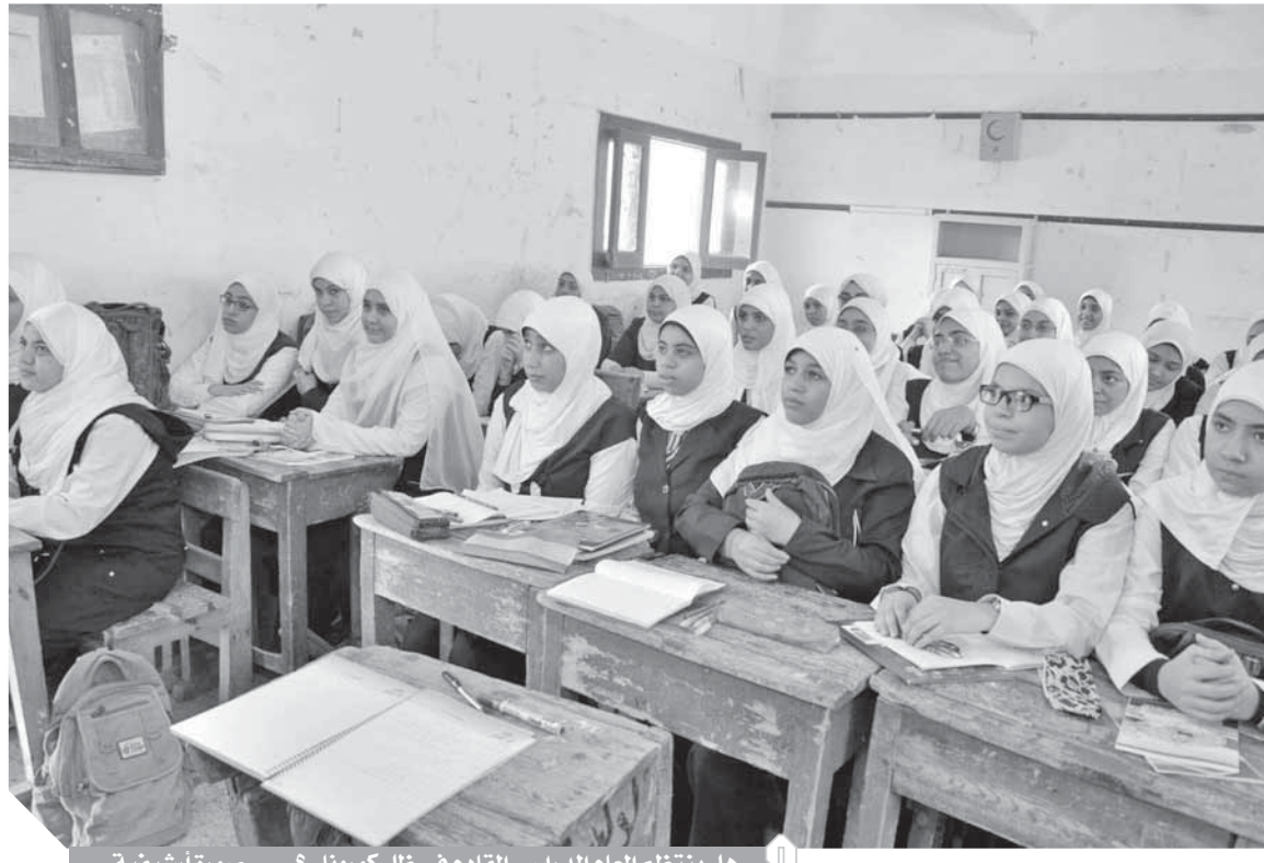
هل يتنظم العام الدراسي القادم في ظل كورونا...؟ صورة أرشيفية.

وأكد المركز الإعلامي لمجلس الوزراء، ووزارة التعليم العالي والبحث العلمي، أنه لا نية لإنشاء الأنشطة الطلابية بالجامعات المصرية خلال العام الجامعي ٢٠٢٠/٢٠٢١، موضحةً أنه سيتم استحداث بعض الأساليب الجديدة في تنفيذ الأنشطة الطلابية من خلال برامج السوشيال ميديا والألعاب والمنافسات الإلكترونية خلال العام الجامعي الجديد ٢٠٢٠/٢٠٢١، وفيما يتعلق بالأنشطة الرياضية وأنشطة الجواله والخدمة العامة التي تتطلب حضوراً فعلياً للطلاب سيتم تفعيلها باتخاذ كافة الإجراءات الاحترازية ومراعاة قواعد التباعد الاجتماعي لمواجهة فيروس كورونا.