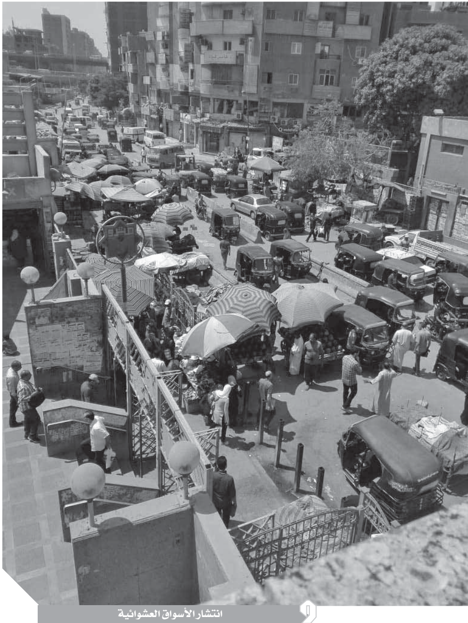
انتشار الأسواق العشوائية