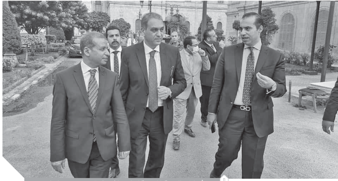
أعضاء اللجنة الإدارية لمجلس الشيوخ يتفقدون مقر المجلس

كما استمعت اللجنة لرؤية القائم بأعمال الأمين العام لمجلس الشيوخ فيما أسفرت عنه مقرراتها، والذي أعرب عن تقديره لجهود اللجنة رئيساً وأعضاءً وثقن أعمالها.