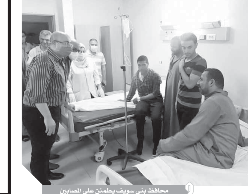
محافظ بنى سويف يطمئن على المصابين