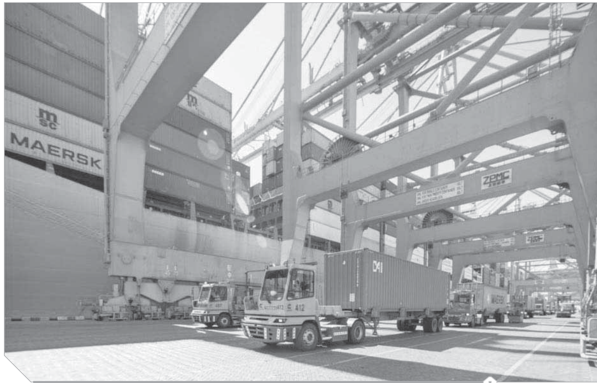
سلطنة عمان تتبنى أفضل الممارسات العالمية لتعزيز النقل البري الدولي

وتناول تقرير وزارة الخارجية الأمريكية- الذي يهتم به المستثمرين في الولايات المتحدة- أن السلطنة تبذل جهوداً حثيثة لجعل البلاد وجهة أكثر جاذبية للاستثمار، وترتكز هذه الجهود على الاستفادة مما تتمتع به عمان من موقع جغرافي متميز يتوسط خطوط الشحن البحري العالمية، حيث تتولى نقل حمصة ملموسة من التجارة