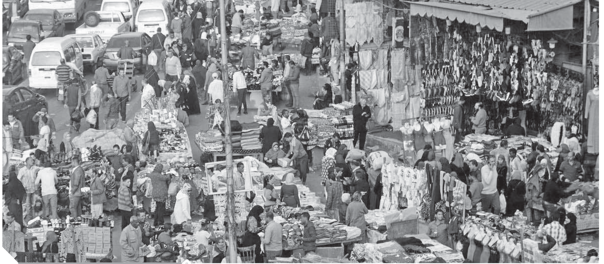
تعديات صارخة على الأرضية