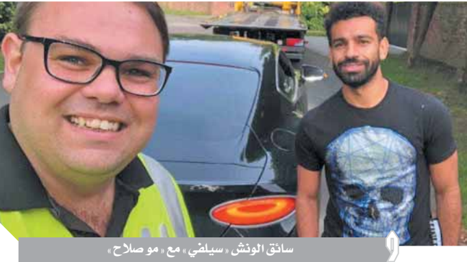
سائق الونش، سيلفي، مع محمد صلاح.