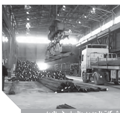
شركات الحديد والصلب في الهوا

القواعد التي تحددها اللائحة التنفيذية وعلى الشركات القائمة توفيق أوضاعها طبقاً لحكم المادة السابقة خلال مدة أقصاها ثلاث سنوات من تاريخ العمل بهذا القانون. وأولى الشركات المتوقعة اتخاذ قرار بشأنها هي الحديد والصلب المصرية. ورغم تعدد المتابعات والتصريحات للمسؤولين في حال القطاع وعن الشركة في الفترة الماضية ونفيهم إصدار قرار بشأن الشركة. إلا أن دخول تعديلات القانون خبز التنفيذ جعلت الأمر اقرب للإقرار منه للبحث والدراسة وهو ما يدعمه الموقف المالي المتردى للشركة في ظل آخر توصية للجهاز المركزي للمحاسبات بالتشكيك في قدرة الشركة على الاستمرار.