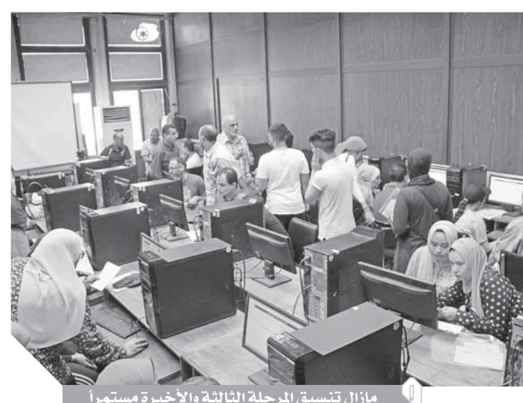
مازال تسيق المرحلة الثالثة والأخيرة مستمرا

العامة دون التقيد بالاعداد المقرر قبولها فى كل كلية. وتتاح أمام طلاب الدور الثانى جميع الأماكن التى كانت متاحة أمام الناجحين فى الدور الأول، بشرط الحصول على الحد الأدنى الذى قبلته كل كلية أو معهد من طلاب المرحلتين الأولى والثانية. ويوجد أمام طلاب المرحلة الثالثة أكثر من ١٧٠ ألف مكان بالجامعات والمعاهد، وتشمل الأماكن الخالية أمام طلاب المرحلة الثالثة كليات الآداب والحقوق «نظام وانتساب»، والزراعة ودار العلوم والتربية الرياضية والتربية الموسيقية والتربية النوعية والسياحة والفنادق والخدمة الاجتماعية والمعاهد الفنية والكليات التى يتطلب الالتحاق بها اجتياز اختبارات القدرات وتشمل التربية الرياضية، والفنية والتربية ومعظم هذه الأماكن خاصة بطلاب العلوم والرياضيات، أما الأماكن المتاحة أمام طلاب الأدبى فيوجد معظمها فى المعاهد الخاصة بمصرفوفات.