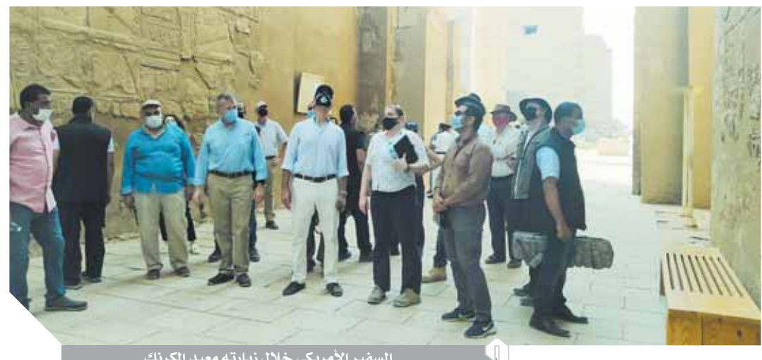
السفير الأمريكى خلال زيارته معبد الكرنك

استثمرنا ١٠٠ مليون دولار للحفاظ على المواقع والكنوز الأثرية