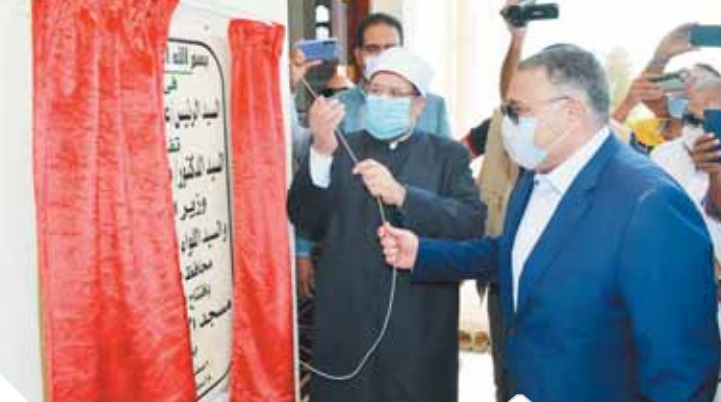
وزير الأوقاف خلال افتتاحه أحد المساجد