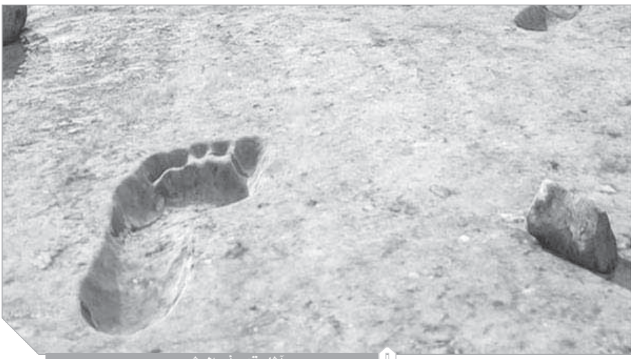
آثار قدم أبوالبشر

أعلن الرئيس التنفيذي لهيئة التراث الدكتور جاسر بن سليمان الحريش عن اكتشاف فريق سعودي دولي مشترك لآثار أقدام لبشر وفضيلة وحيوانات مفترسة حول بحيرة قديمة جافة على أطراف منطقة تبوك يعود تاريخها إلى أكثر من ١٢٠ ألف سنة من الآن.