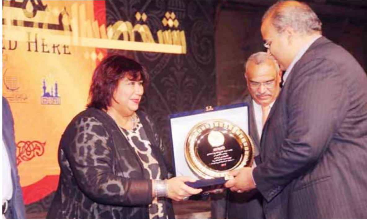
وزير الثقافة خلال تدشين مشروع «عاش هنا»

دشنت الدكتورة إيناس عبدالدايم وزيرة الثقافة مشروع «عاش هنا» ويشرف على تنفيذه الجهاز القومي للتسييق الحضاري برئاسة المهندس محمد أبوسعدة ويقام بالتعاون مع مركز المعلومات ودعم اتخاذ القرار بمجلس الوزراء برئاسة المهندس زياد عبدالنوب ومحافظتي القاهرة والجيزة، وينطلق إلى باقي محافظات مصر، خلال المؤتمر الصحفي الذي عقد بمقر الجهاز القومي للتسييق الحضاري بقلعة صلاح الدين الأيوبي أمس الأول بحضور حشد من الإعلاميين والشخصيات العامة وبناء رموز الوطن وقيادات وزارة الثقافة، وقالت وزيرة الثقافة إن «تراثاً هويتاً.. فلتعنه معاً» مؤكدة أنه المشروع يهدف إلى تخليد ذكرى رموز مصر من الرواد والمبدعين الذين أسهموا في استكمال مسيرة مصر الحضارية عبر تاريخها ويستعيد أمجاد علامات تركت أثراً لا يفيب عن الأذهان ستظل بصماتهم نبراساً للأجيال المقبلة.