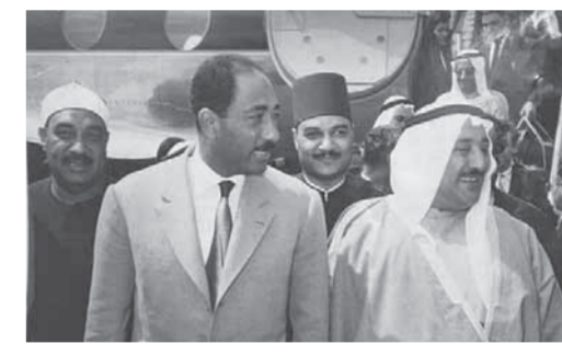
مع السادات فى الكويت