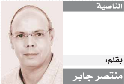
التأنيبة بقلم: منتصر جابر