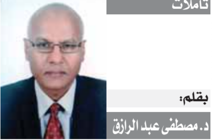
تأملات بقلم: د. مصطفى عبد الرزق

أمس كان يوم الفرح.. يوم المتفوقين.. يوم الأحلام.. يوم النجاح الباهر.. أما اليوم فهو يوم آخر «وجه آخر للثانوية العامة».. تراجع في مجاميع المتفوقين وتراجع في الحد الأدنى للقبول بالكليات.. والأهم هو التراجع في نسبة النجاح.. عادت الثانوية القديمة بعد غياب عشرات السنين، ٩٠% طب.. ٨٠% هندسة.. ٧٩% للاقتصاد والعلوم السياسية والإعلام والألسن.. مفاجات ذهبية عادت مع نظام الابل شيت.