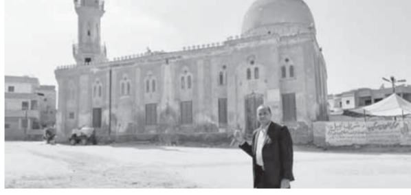
هنا.. مسجد سيدى سالم الببلى أبو غنام