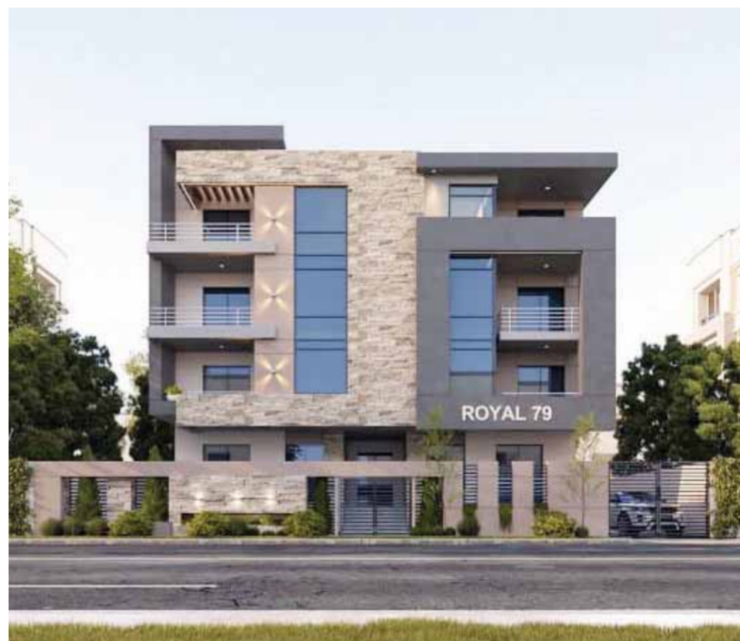
أحد مشروعات روبال للتطوير

وأضاف أن المكتب عمل على ١٤٢ مشروعا بتكلفة ١٩٢ مليار جنيه بالسوق المحلى، بالإضافة لمشروعات خارج مصر متنوعة بين بنية تحتية وصناعية وتجارية وفندقية بإجمالي ١٦ مشروعا، مشيراً إلى أن تعاقدات مكتب ECB بالعاصمة الإدارية الجديدة للتصميمات والاستشارات الهندسية بلغ إجمالي الاستثمارات لها ١٦ مليار جنيه بالعاصمة الإدارية الجديدة، حيث تنوع التعاقدات بين إدارة مشروعات وتصميمات هندسية وإشراف على التنفيذ. وأضاف أن هذه المشروعات تتضمن «اليوسكو»