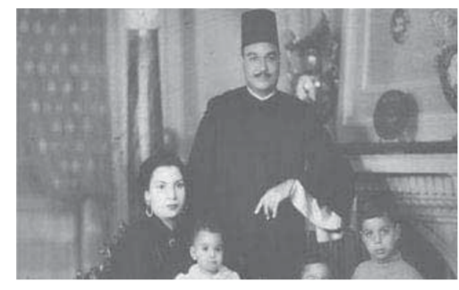
مع زوجته وأولاده