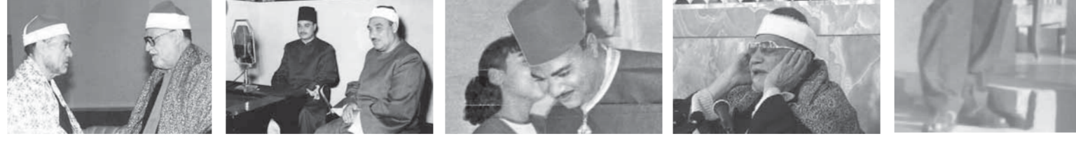
مع الشيخ زاغب غلوش