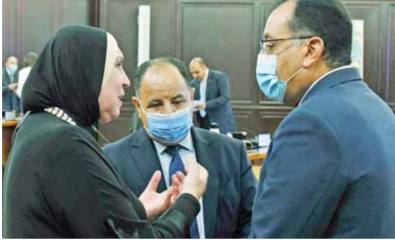
حوار بين مدبولي وميعط وجامع علي هامش الاجتماع الاسبوعي لمجلس الوزراء

التعليم العالى والبحث العلمى، موضحة أن نقاط التعليم التى تم تخصيصها بالمستشفيات الجامعية لتطبيق الأطقم الطبية ستقوم بتغطية تعليم باقي العاملين بكل جامعة، وكذلك آلية تعليم الطلاب، موضحة أن المستشفيات ستقوم بتعليم الطلاب الجدد وقت توقيع الكشف الطبى عليهم من خلال نقاط ثابتة بمستشفيات الطلبة يتم مدتها بالجزيرة والطعم من خلال وزارة الصحة، كما تقوم مستشفيات الطلبة بإعداد جداول لتعليم الفرق الدراسية تباعاً. كما عرضت ضوابط تعليم العاملين بوزارة التربية والتعليم والتعليم الفنى، موضحة أنه تم وضع آلية لتسجيل العاملين بالوزارة، وتوفير القاعات اللازمة لهم بحيث يتم الانتهاء من تعليم جميع المسجلين منهم قبيل بداية العام الدراسى الجديد. من جانب آخر، تناولت وزيرة الصحة والسكان المصروف الحالى لتوريد لقاحات «أسترازينيكا»، و«سينوفاك»، و«سايونافام»، و«سويتيك»، وجونسون آند جونسون، منوهة إلى الكميات المخطط استلامها حتى نهاية العام من المواد الخام للتصنيع بمصانع فاكسيرا، لافتة إلى أنه سيتم البدء فى الإفراج التجريبي عن ١٤ مليون جرعة مصنعة من سيفوفاك بداية من الخامس من شهر سبتمبر المقبل، فضلاً عن استلام عدد من اللقاحات تتضمن «جونسون آند جونسون»، و«سويتيك»، و«فايززر»، و«موديرنا»، و«سايونافام»، كما أشارت وزيرة الصحة إلى موقف التعاقد على أحد أدوية الأجسام المضادة لصالح مرضى كورونا فى مصر، لافتة إلى أنه جار استقبال ١٥ ألف جرعة من