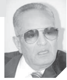
بهاء الدين أبوشقة