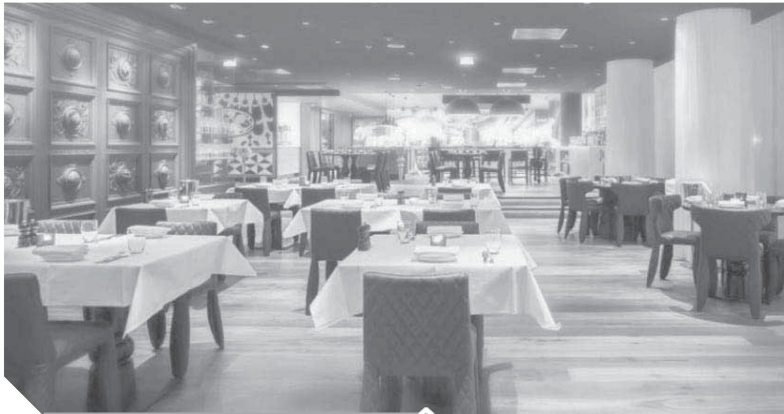
العمل بـ ٢٥% من الطاقة التشغيلية للمطاعم والمقاهي والمحلات والمولات التجارية

لقد أصبحت الجريمة الإلكترونية أشد فتكاً من الجريمة العادية في أحيان كثيرة ومنها انتحال الصفة أو إنشاء صفحة مطابقة لصفحة مؤسسة كبرى أو بنوك أو شخصيات عامة لتلصق حدث من منتهى أنهم اقلد صفحة النيابة العامة ويتصل باسم النائب العام شخصياً وبدأ في اسقاط ضحايا له ويطلب منهم تحويل أموال على رقم حسابه حتى سقط وتم حسمه بعد اعترافه تفصيلاً بالنصب الكارثة الكبرى لأنهم سيجانون في تعويض ما فقدوه من دخول مالية شرعية بمصادر دخل أخرى، سواء كانت غير شرعية أو مجرمة قانونياً ومجتمعياً كاسرقة بالإكراه والنصب.