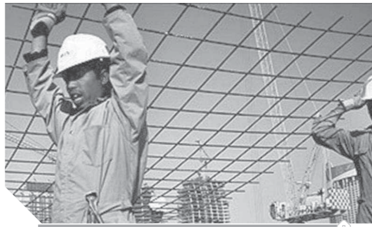
الإبقاء على عجلة الإنتاج، شعار رفقته العمال المخلصون لوطنهم

١٠٠ مليار جنيهه خسائر مصر بسبب «كورونا» .. والقادم «أفضل»