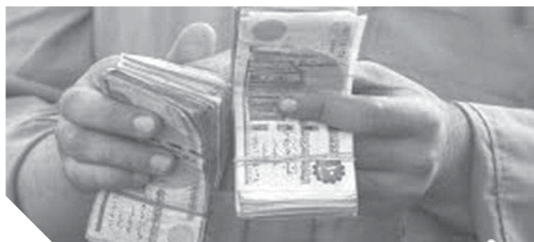
مطالب بإتخاذ العمالة المتضررة من الخسائر والديون المترتبة