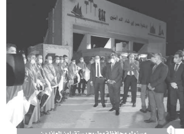
مستولو محافظة مطروح يستقبلون العائدون