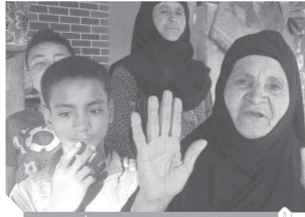
سيدة تشكر الرئيس على اهتمامه بعودة أبنائهم

كتبت: محمد ثروت، ملحمة جديدة سطرتهها القيادة السياسية المصرية، تحت شعار "لا تهاون في حقوق المصريين داخل أو خارج الوطن"، حيث عاد ٢٣ مصرياً إلى أرض الوطن مساء أمس الأول، بعد اختطافهم من قبل ميليشيات إرهابية تابعة لحكومة الوفاق الليبية، بعد متابعة جادة وتوجيهات حاسمة من الرئيس السيسي. وصل المصريون إلى مدينة السلم، على الحدود المصرية الليبية، مساء الأربعاء، وكان في استقبالهم جميع المسؤولين في محافظة مطروح، وحمل العمال علم مصر، ووجهوا الشكر لأجهزة الدولة المصرية، وعلى رأسها الرئيس السيسي، على عودتهم سالمين إلى أرض الوطن. "كل الخيارات متاحة لعودة أبنائنا إلى مصر"، كان هذا هو التكليف الذي أصدره الرئيس عبدالفتاح السيسي، رئيس الجمهورية والقائد الأعلى للقوات المسلحة، لتجميع الأجهزة التنفيذية في الدولة، للعمل على عودة المواطنين المصريين الثلاثة والعشرين، الذين اختطفهم الميليشيات الإرهابية في ليبيا، ونشرت على حساباتها الإلكترونية فيديو تصوير تكشف إساءة معاملتهم، وإجبارهم على الوقوف على قدم واحدة، والتهافت لحكومة الوفاق، بينما حاول آخرون من المنتسبين للإرهابيين وميليشيات حكومة الوفاق تصوير هؤلاء المصريين على أنهم "مرتزقة"، ومقاتلين "في الجيش الوطني الليبي"، رغم أنهم مجرد عمال هاجروا إلى ليبيا للبحث عن فرصة عمل.