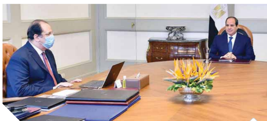
الرئيس السيسي أثناء اجتماعه أمس مع عباس كامل رئيس المخابرات العامة