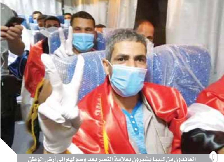
العائدون من ليبيا يشيرون بعلامة النصر بعد وصولهم إلى أرض الوطن

فرحة كبيرة في استقبال المصريين العائدين من ليبيا بعد تحريرهم العمال: «تولدنا من جديد».. ونشكر الرئيس السيسي