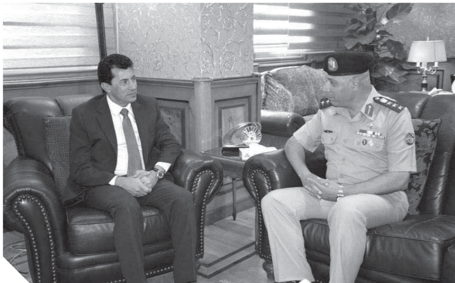
جلسة وزير الرياضة مع رئيس جهاز الرياضة العسكرى

عقد الدكتور أشرف صبحى وزير الشباب والرياضة اجتماعاً مع العميد صبرى مصيلحى رئيس جهاز الرياضة العسكرى لاستعراض التجهيزات الخاصة لاستضافة مصر لبطولة كأس العالم العسكرية الثالثة لكرة القدم ٢٠٢١. ويعد المونديال العسكرى أول بطولة كأس عالم عسكرية فى نسختها الجديدة تقام بالقارة الإفريقية بمشاركة ١٦ منتخبا بواقع ٤ منتخبات من أوروبا، و٤ منتخبات من إفريقيا، و٤ منتخبات من آسيا، و٤ منتخبات من الأمريكتين، ومن المقرر إقامة مباريات البطولة على سادات «القاهرة والكلية الحربية والدفعاى الجوى والسلام وبتروسبورت وجهاز