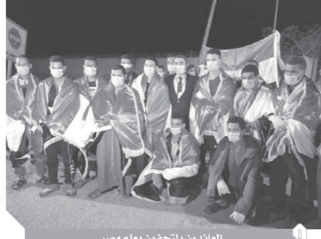
العائدون يلتحفون بعلم مصر