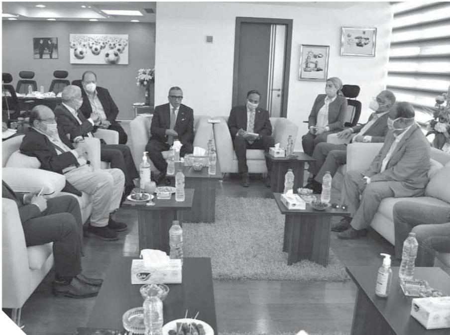
اجتماع مندوبى الأندية مع اللجنة الخماسية باتحاد الكرة

ويصعد الفرق لدورى الأبطال والكونفيدريالية والبطولة العربية بناء على ترتيب الموسم الماضى.