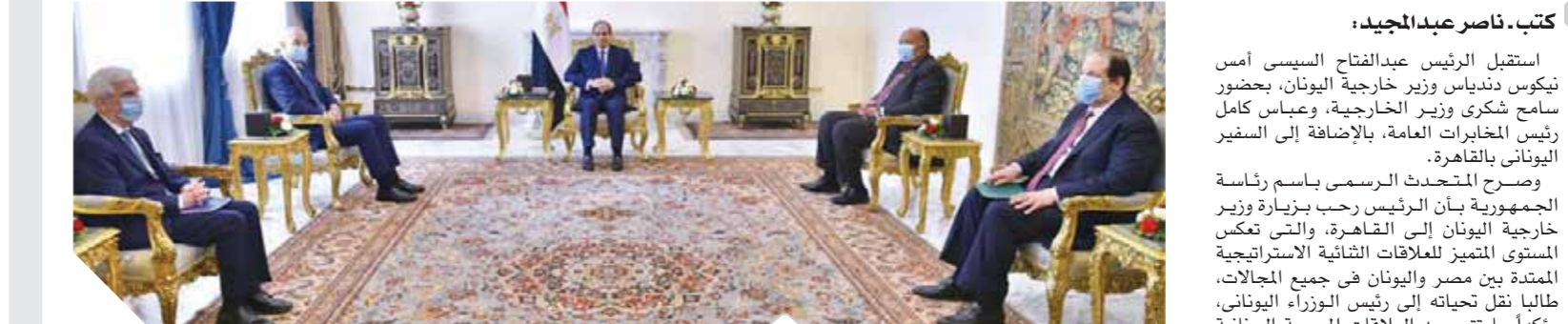
الرئيس السيسي خلال لقائه وزير الخارجية اليوناني

الأدوات في هذا الإطار، والذي من شأنه أن يفتح آفاق التعاون والاستثمار بين دول المنطقة في مجال الطاقة والغاز. كما تم التباحث بشأن تطورات القضية الليبية في ظل الهدوء الوارد بمبادرة «إعلان القاهرة»، حيث جدد المسئول اليوناني دعم بلاده لكافة بنود المبادرة، مشيراً إلى أنها تمثل رسالة سلام واستقرار ليس لليبيا فحسب بل للمنطقة ككل، بينما أكد الرئيس أن الجهود المصرية في الملف الليبي تهدف بالأساس إلى استعادة مؤسسات الدولة وملء فراغ السلطة بشكل مؤسسي، والتي أدى غيابها إلى منح المساحة