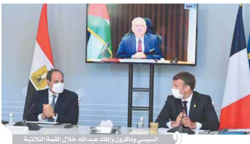
السيسي وماركرون والملك عبد الله خلال القمة الثلاثية

ومع الطرفين الفلسطيني والإسرائيلي، مع دعم مصر كل الجهود الدولية الرامية لإنهاء حالة التوتر الحالية واستعادة الاستقرار والحد من نزيف الدماء والخسائر البشرية والمادية. كما دعا الرئيس إلى تكثيف جهود المجتمع الدولي بكامله لبحث إسرائيل على التوقف عن التصعيد الحالي مع الفصائل الفلسطينية في الضفة الغربية وقطاع غزة، وذلك لإتاحة الفرصة أمام استعادة الهدوء، ولبدء الجهود الدولية في تقديم أوجه الدعم المختلفة والمساعدات للفلسطينيين، وفي هذا الإطار.