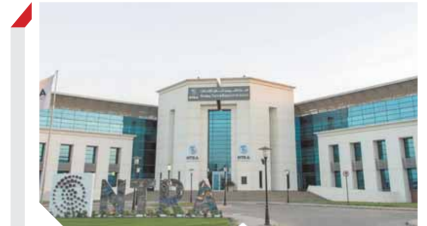
الجهاز القومي لتنظيم الاتصالات

زف الدكتور عبد الوهاب غنيم نائب رئيس الاتحاد العربي للاقتصاد الرقمي، بشري بشأن سرعة الإنترنت خلال الفترة المقبلة، موضحاً أن مصر قطعت شوطاً كبيراً على طريق التكنولوجيا منذ أن أعلن الرئيس عبد الفتاح السيسي عن مبادرة التحول الرقمي للحكومة المصرية. أكد غنيم أن متوسط سرعة الإنترنت في مصر بعد وضع أكثر من ١٠٠ مليار جنيه في البنية التحتية واستبدال الكابلات النحاسية بكابلات الألياف البصرية وإطلاق القمر الصناعي طيبة ١، سيصبح ٤٠ ميجابت في الثانية بنهاية عام ٢٠٢١. أوضح أن متوسط سرعة الإنترنت في جميع المدن الجديدة الذكية وعلى رأسها العاصمة الإدارية الجديدة ستتراوح ما بين ١٠٠ ميجابت و٢٠٠ ميجابت في الثانية، وهي من أعلى السرعات العالمية، لأن خطها من أنشأت من الأسفل بكابلات فائقة السرعة عالية النطاق. قال غنيم إنه مع أزمة وباء كورونا مصر الدولة العربية والأفريقية الوحيدة التي استكملت العام الدراسي على مستوى جميع المدارس في الدولة، موضحاً أنه من الطبيعي تأخر شبكة الإنترنت مع دخول أكثر من ٢٥ مليون طالب لأداء الامتحان في الفترة الصباحية. كما أوضح غنيم تفاصيل انضمام مصر لوفقة استخدام الذكاء الاصطناعي بالتعاون مع منظمة التعاون الاقتصادي والتنمية OECD قائلاً أن مصر من خلال مبادرة التحول الرقمي وضعت استراتيجيات مخصصة للتعاون مع الشركاء، والاعتماد على البنية التحتية وبناء جاهزة لاستخدامات تطبيقات الذكاء الاصطناعي، وأشار إلى أهم تطبيقات الثورة