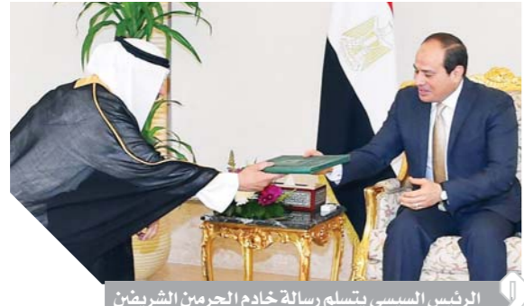
الرئيس السيسي يتسلم رسالة خادم الحرمين الشريفين

وعناصر الدعم من قيادات وهيئات وإدارات القوات المسلحة، في تأمين محيط اللجان داخل محافظات القاهرة والجيزة والمنوفية والقليوبية والفيوم وبني سويف والمنيا. وتقوم المنطقة الغربية العسكرية بالمعاونة في تأمين العملية الانتخابية بمحافظة مطروح، كما اتتمت المنطقتان الشمالية الغربية استعدادهما لتأمين العملية الانتخابية بمحافظة الإسكندرية والبحيرة وكفر الشيخ والغربية. وتشارك المنطقة الجنوبية العسكرية في عملية التأمين بمحافظة أسبوط وسوهاج والأقصر وأسوان والوادي الجديد والبحر الأحمر. كما تعاون عناصر من القوات البحرية وحدات المنطقة الشمالية العسكرية في تأمين عدد من اللجان وتأمين حدود مصر الساحلية، كما تشارك القوات الجوية بعناصر دعم وتنظيم طلعات لتأمين والتصوير الجوي لتأمين العملية الانتخابية بجميع محافظات الجمهورية، كما تشارك قوات الدفاع الجوي في تأمين عملية الاستفتاء على الدستور