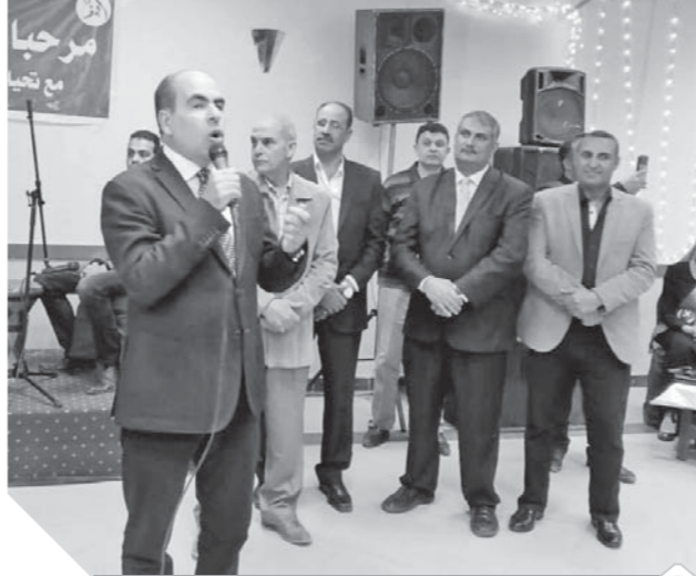
الهضيبي يتحدث في المؤتمر