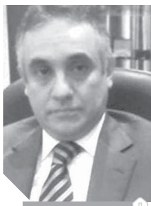
محمود حلمي الشريف

وأضاف: لقد أتيتم في كل موضع أنكم سفراء مصر في كل بلاد اللغات، محصلون لها برفعون رأياتها، وتتحدثون باسمها بكل اللغات، وتعلمون من صوتها، معلنين الولاء للوطن، والحسين إليه، حاملين لسئولياتكم تجاه وطنكم مؤدبين لأماناتكم، مؤكداً أن حب الوطن ما زال يسكن قلوبكم متى كتبت وأينما كونوا.. ولنا ولأبنائنا.. ابعثوا لشعوب العالم رسالة من شعب مصر، بأن ممارسة الديمقراطية.. نادوا بأعلى صوت أن تحيا مصر بنا بيئنا ولأبنائنا.. ابعثوا لشعوب العالم رسالة من شعب مصر.. أنتم شتمت محبة لوطنه مخلص في حبه لا يدخر جهداً من أجله.. في الاستفتاء على تعديل دستور بلادكم. وقال المستشار محمود الشريف المتحدث الرسمي باسم الهيئة الوطنية للانتخابات، إن الهيئة مستعدة لجانبها للتغلب على التحديات الوقتية في الاستفتاء على التعديلات الدستورية في الداخل والخارج، ومستعدة أيضاً لأي استحقاق تشرّف عليه الهيئة بموجب الدستور، حيث الأزمنة الدستور بذلك. وأضاف الشريف أن الهيئة قبلت ٧٠ منظمة ضمن منظمات المجتمع المدني للإشراف على الاستفتاء على التعديلات الدستورية، مؤكداً أن الهيئة لم ترفض إلا من تطليق عليه الشروط.