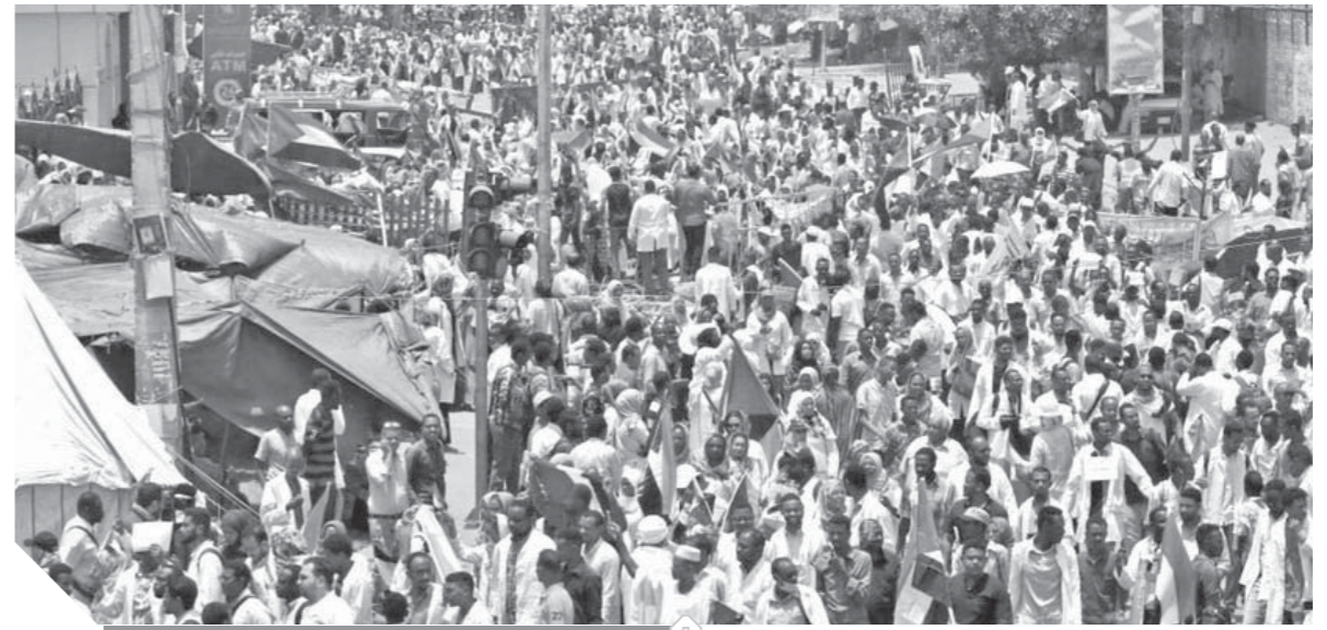
ما زالت المظاهرات مستمرة