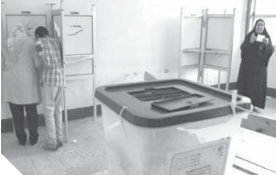
اهتمام بالغ يتذوي الاحتياجات الخاصة داخل لجان التصويت صورة أرشيفية