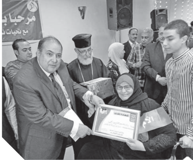
الزاهد يسلم شهادات التقدير للأمهات المثاليات