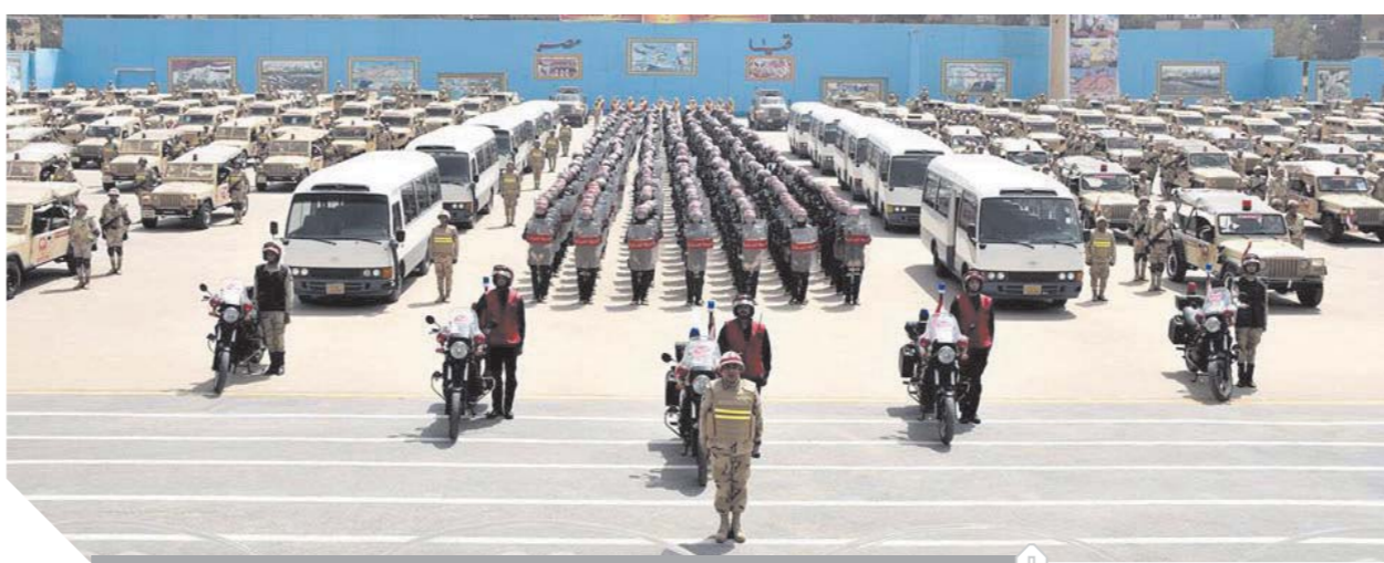
القوات المسلحة اتخذت كافة الترتيبات لتأمين الاستفتاء على الدستور بالتعاون مع الداخلية.

تفديداً لتوجيهات الفريق أول محمد زكي القائد العام للقوات المسلحة وزير الدفاع والإنتاج الحربي، اتخذت القيادة العامة للقوات المسلحة كافة الترتيبات والإجراءات المترتبة بالتعاون مع وزارة الداخلية في تنظيم أعمال التأمين للاستفتاء على التعديلات الدستورية على مستوى الجمهورية، وتوفير المناخ الآمن للمواطنين للإدلاء بأصواتهم. حيث تشترك القوات المسلحة في تأمين الاستفتاء بعناصرها في نطاق الجيوش الميدانية والمناطق العسكرية وقيادات وهيئات وإدارات القوات المسلحة، وذلك بالتنسيق مع أجهزة وزارة الداخلية والهيئة الوطنية للانتخابات وكافة الأجهزة المعنية بالدولة.