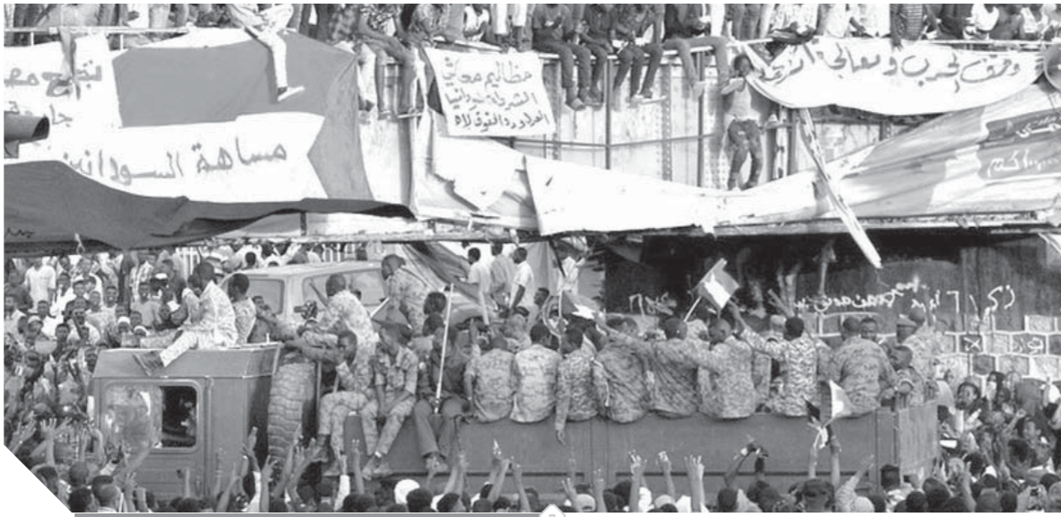
القوات السودانية وسط المظاهرات