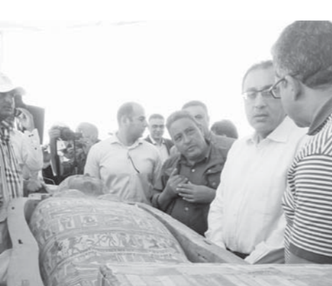
رئيس الوزراء يشهد الإعلان عن اكتشافات أثرية جديدة بالأقصر

النهوض بقطاع السياحة، كما أن حضور السفراء وزوجاتهم هو رسالة للعالم، يؤكد أن مصر آمنة ولديها اكتشافات جديدة كل يوم. شارك فى فعاليات الاحتفال سفراء عدد من الدول منهم سفراء البحرين، والتشيك، وأذربيجان، وكازاخستان، وكولومبيا، وتشيلي، والكونغو، والدومينيكان، وبعض سفراء الدول الإفريقية من الكاميرون، ومالى، وناميبيا، وزيمبابوي، ومالوى، ومديرة المكتب الثقافى لليونسكو فى مصر وليبيا والسودان، وعدد من الشخصيات العامة ونواب البرلمان والبعثات الأثرية الأجنبية العاملة بالأقصر. يذكر أن العالم يحتفل بيوم التراث العالمى فى ١٨ أبريل من كل عام، بعدما اقترح هذا اليوم المجلس الدولى للتراث (ICOMOS) بتاريخ ١٨ أبريل ١٩٨٢، ووافقت عليه الجمعية العامة لليونسكو فى عام ١٩٨٢م، وذلك بهدف تعزيز الوعى بأهمية التراث الثقافى للبشرية، ومضاعفة جهودها اللازمة لحماية التراث والحفاظ عليه.