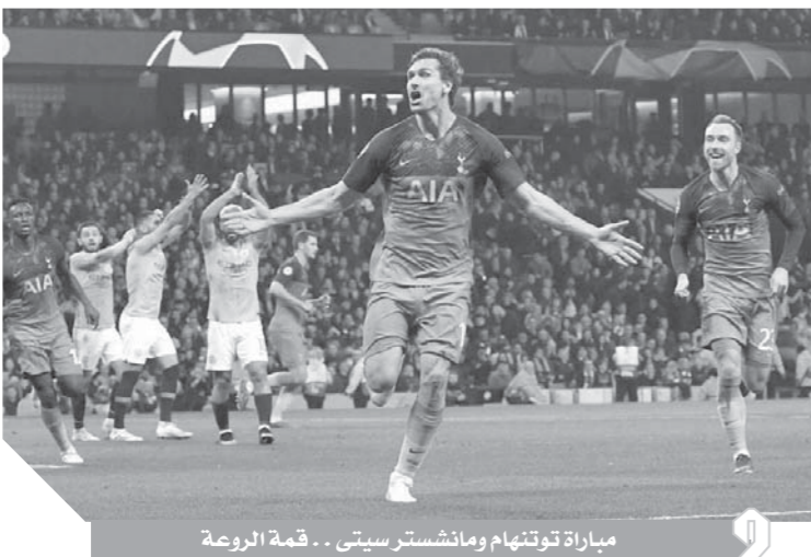
مباراة توتنهام ومانشستر سيتي.. قمة الروعة