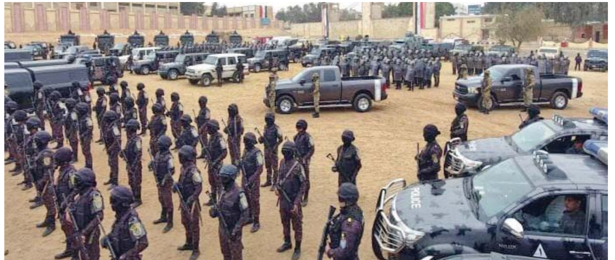
الداخلية جاهزة لتأمين اللجان

٦١ مليون مصري لهم حق المشاركة في الاستفتاء على التعديلات