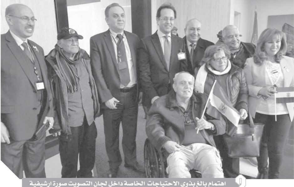
اهتمام بالغ يتذوي الاحتياجات الخاصة داخل لجان التصويت صورة أرشيفية