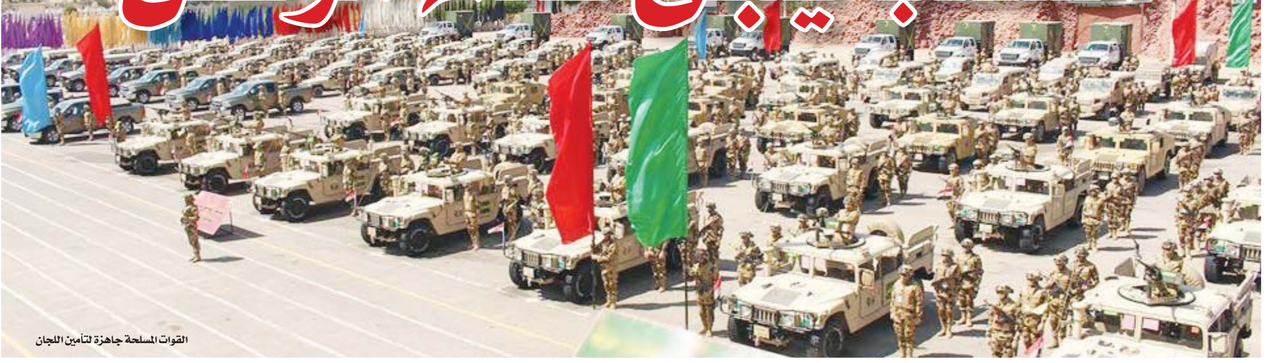
القوات المسلحة جاهزة لتأمين اللجان