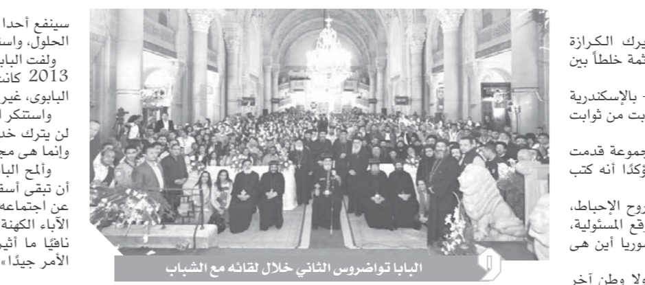
البابا تواضروس الثاني خلال لقائه مع الشباب

سينفج أحدا، مجدداً تحذيره من أفكار الإحباط، والركون إلى عدم طرح الحلول، واستطرد: «شارك، عبر عن رأيك، وسيري الله ما أنت صانعه..» ولفت البابا تواضروس إلى أن الهجومات على الكنائس في 14 أغسطس 2013 كانت من أصعب اللحظات التي مر بها منذ صعوده للكرسي البابوي، غير أن الأصبغ هو عناد البعض ممن يهاجمون الكنيسة، وأبأها، واستنكر البطيريك إطلاق الشائعات، واختراع الأكاذيب، مشيراً إلى أنه لن يترك مجتمعهم للرد على الأكاذيب، كما أن الكنيسة ليست فرداً واحداً، وإنما هي مجمع مقدس يكمل بعضه بعضاً. ولمح البابا إلى إمكانية تأسيس أسقفية للطفولة في المستقبل، على أن يتجمعه على الشباب له الأنايا موسي، ويتيحها أسقفية للأسرة، معلناً عن اجتماعه مع الأنايا مكاربيوس أسقف امثيا خلال الفترة الماضية، ومعهم الأنايا الكهننة، وأمانة الخدمة، ولم يستقر بعد على تقسيم إبيارشيية امثيا، قائلاً ما أثير من شائعات بشأنها، واستطرد قائلاً: «نتحاج إلى دراسة الأمر جيداً».