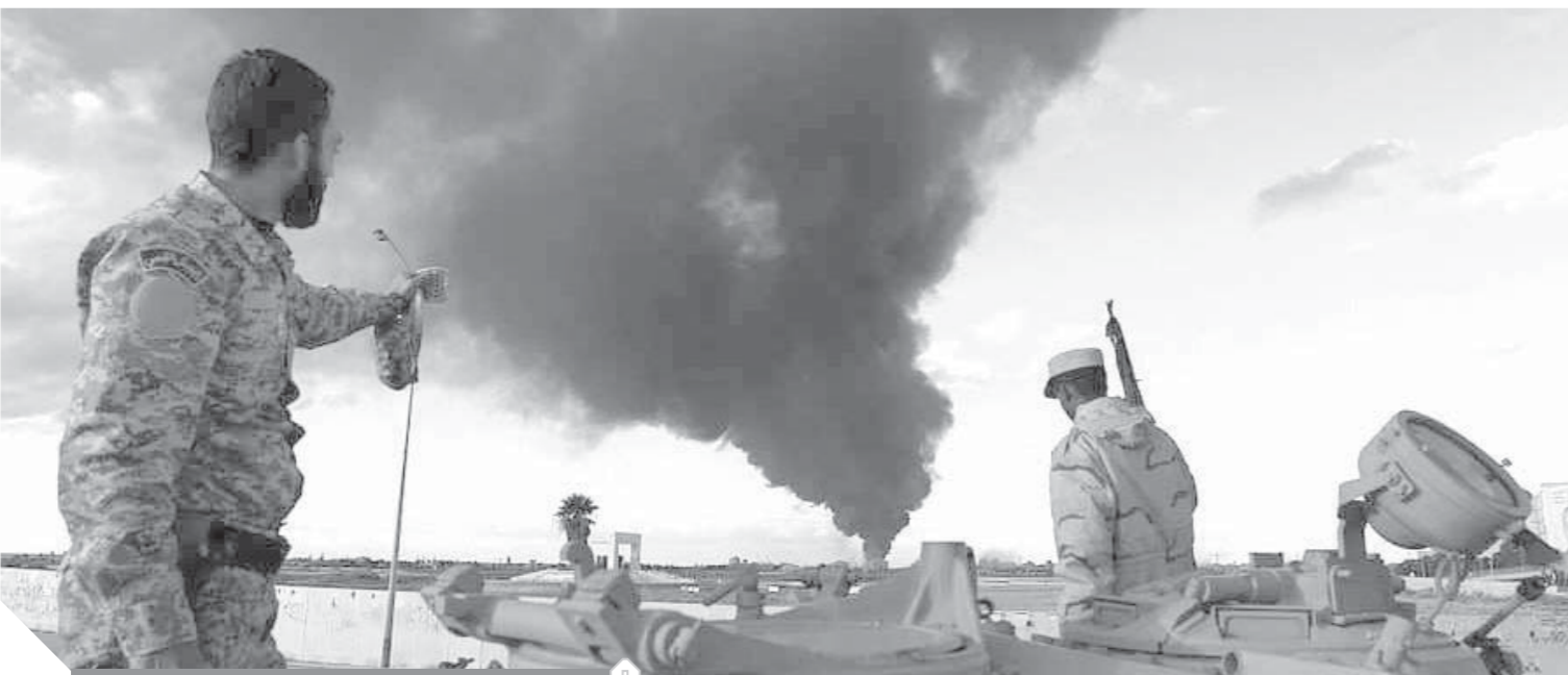
الجيش الليبى يواجه مجموعة من الإرهابيين بطرابلس