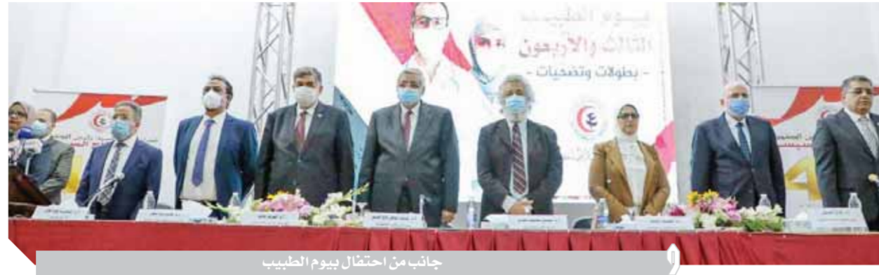
جانب من احتفال بيوم الطبيب

كتب: هشام الهلوتى ومختار محروس: قال الدكتور محمد عوض تاج الدين، مستشار رئيس الجمهورية للشئون الصحية والوقائية خلال فعاليات احتفالية «يوم الطبيب الثالث والأربعون» فى كلمة نيابة عن الرئيس عبدالفتاح السيسى، إن الترضيات كبيرة من الأطباء والكوادر الطبية سواء الذين عانوا من الإصابة بفيروس كورونا وتدابيراته، أو الذين انتقلوا إلى رحمة الله تعالى واستشهدوا وهم يذودون واجههم المهنى والوطنى بكل شجاعة وثقة وإصرار ويأداء شهد له الجميع بكفاءة عالية واحترافية شديدة.