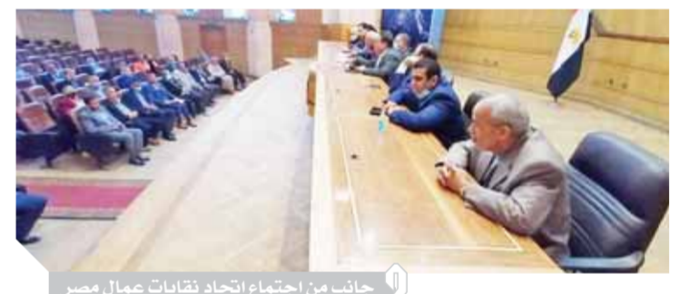
جانب من اجتماع اتحاد نقابات عمال مصر

الوصول إلى مستوى عال من التطور، يليق بـ ٢٠٢١. كما رأى عصام شخية، رئيس المنظمة المصرية لحقوق الإنسان، أن المبادرات التي يطلقها الرئيس تشير إلى رغبة كبيرة في بناء دولة ديمقراطية حديثة تستهدف تخفيف الأعباء عن كامل المواطن وفي سبيل ذلك يتم إنشاء إدارات «الشباك الواحد» لتسهيل مهمة التعامل مع المؤسسات، بما يضمن القضاء على الرشوة وتحقيق العدالة وسرعة إنجاز المصالح، متوفاً بأن هذه الخطوة جيدة، وتشير إلى الانتقال إلى المواطنين والحد من النزوح إلى العاصمة. وأضاف رئيس المنظمة المصرية أن هذا يخفف الأعباء