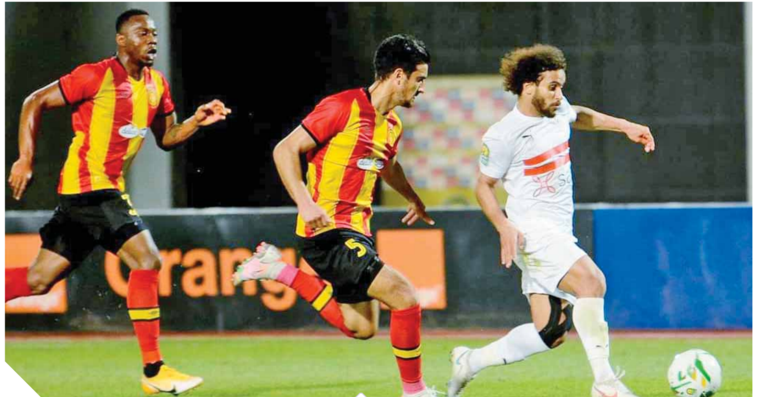
الترجي كشف حالة عدم الانضباط بين لاعبي الزمالك