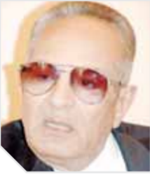
بهاء الدين أبو شققة