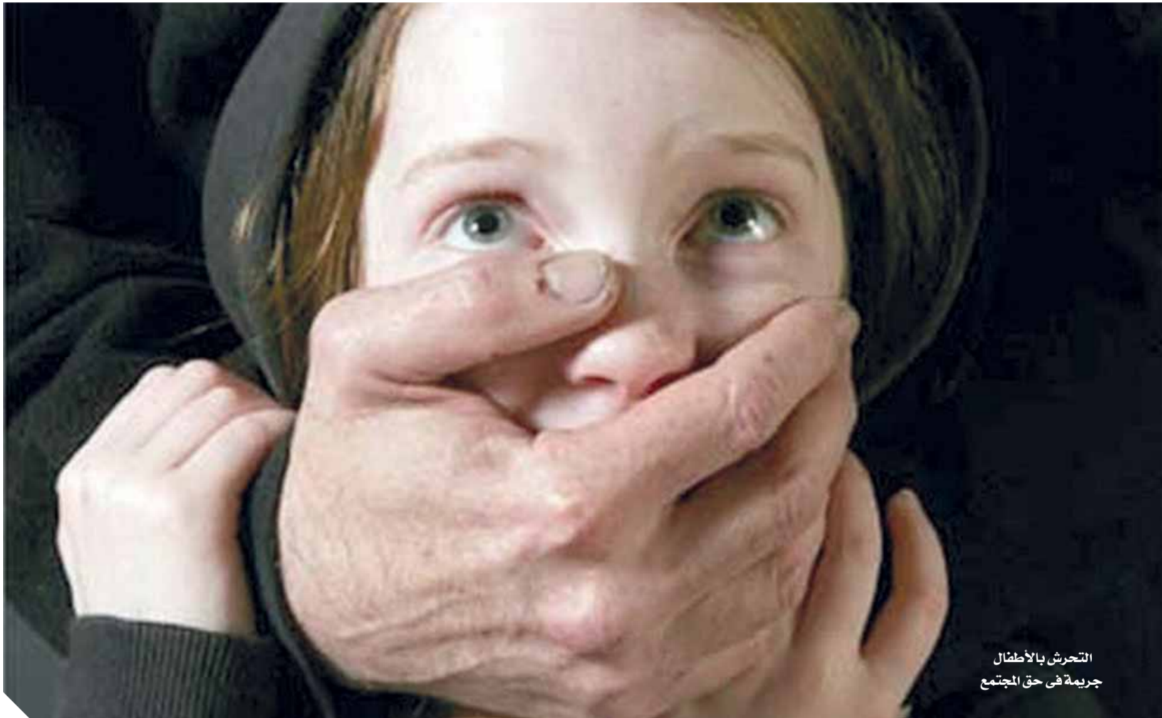
التحرش بالأطفال جريمة في حق المجتمع

لم تكن واقعة الطفلة التي تعرضت للتحرش في مدخل إحدى العمارات في منطقة المعادي، هي الأولى من نوعها، ولن تكون الأخيرة، طالما كان هناك وحوش يتجسّدون في صورة آدمية، وطالما كانت لدينا قوانين غير رادعة، فضضية التحرش بالأطفال ليست وليدة اليوم، ولكنها ظاهرة انتشرت في مجتمعنا مؤخراً، وأحياناً يروح الأطفال ضحايا لها، ورغم هذه الصدمات التي يرضع لها الجميع من فترة لآخرى، إلا أن الظاهرة تكررت وانتشرت وتوغلت في مجتمعنا، حتى أصبحت تندر بالخطر، فهي دليل على حالة الانهيار الأخلاقي التي يعيشها بعض أفرادنا، وتهديد مباشر لبراءة أطفالنا، لذلك لا بد وأن تكون المواجهة حاسمة.