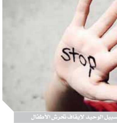
العقاب الرادع السبيل الوحيد لإيقاف تحرش الأطفال

خبير قانوني: هناك فرق بين التحرش وهتك العرض والعقوبة تصل إلى ١٥ سنة أحد الأشخاص لمس أجسادهم، مع ضرورة أن يعلم الطفل أن والديه هما حصن الأمان دائماً بالنسبة له، وسيقتان بجانبه باستمرار. تقويم سلوك المتحرش ومن الناحية الدينية يقول الدكتور محمد عرفه، باحث في علوم الأزهر الشريف، أن الإسلام جاء ليحرر الناس من الظلم والعبودية والتعدي على الأعراس، فحرم الزنا وشرع الزواج والنكاح على رسول الله (صلى الله عليه وسلم) «إذا علمنا من ترضون دينه وخلقه فزوجوه إلا تغلوا» تكمن فتنة في الأرض وفساد كبير، وديننا الحنيف علمنا المبادئ والأخلاق والقيم والمجبة، وأشار إلى أن الإسلام علمنا، أن نبتعد عن كل إساءة لفظاً أو فعلاً، وجرائم التحرش الجنسي واللفظي على أحد الأثام التي يجب نبتعد عنها، فهي تصور الممتع وكأنه صار وحشياً، ورغم قلة من يرتكبون هذه الجرائم، فإن السؤال الأهم هو ما ذنب الضحايا الذين يتعرضون لمثل هذه