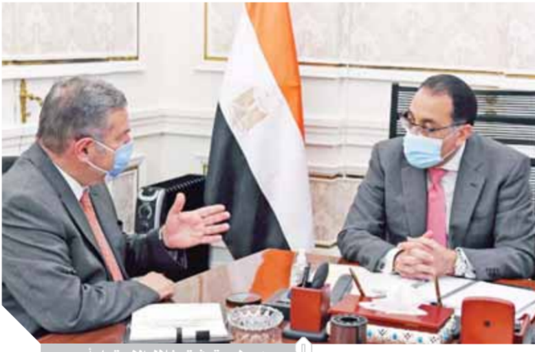
مدبولي وتوفيق خلال الاجتماع أمس