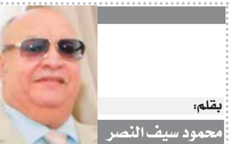
بقلم: محمود سيف النصر

عادت مصر إلى مكانتها التي تستحقها زعيمة أفريقيا، ولها كلمة مسموعة أمام العالم الصديق، وكبيرة العرب، التي تعتبر أمن العرب جزءاً من أمنها التومى عادت مصر تبنى وتشيد وترفع البناء، وتقيم الجسور، والمشروعات العملاقة، بعد أن قضت على الإرهاب، وفرت الحياة الكريمة لجميع المواطنين فى مقدمة ذلك الأمن والأمان الذى يشعر به كل مواطن على أرض بلده، لا يستطيع أحد أن يرهيه، أو يفرض عليه شيئاً خارج القانون والدستور الذى يطبق على الجميع. وفى الوقت الذى قضت فيه مصر على الإرهاب، تصدت أيضاً للفساد وقطعت رأسه فلا أحد كبير على المساملة، ولا مكان للشبهيين والملوثين وسيتى السمعة. المرأة والأبنة والأخت الصغيرات حصلن على كافة الحقوق، ويشعرن بالآمان التام فى الشارع المصرى، ترفع المرأة المصرية رأسها فى زهو وفخار، لأنها فى أمان فى دولة أمنة اختارت قيادتها الأنمية عليها، ونبتت الفوغاه ومهرجى الموالد، وأصحاب الكاذب، والشائعات، إذا كان الإخوان نسوا ما فعلوه وما كانوا سيفعلونه لو استمروا يوماً زائداً على ٢٩ يوماً تذكرهم به لأنهم عصابة سرقت وطننا فى غفلة من الزمن، وأصحابها، أصحبا الوطن، استردوه بإرادة من حديد، وفقره حتى قدره وعادت مصر للمصريين إلى الأبد. اعتقد أن الرسالة وصلت، وتفخر بسلطتات التنفيذية، التشريعية القضائية، وتفخر باستقلال كل منها عن الأخرى، وتفخر بتعاون السلطات الثلاث من أجل مصر حرة، مصر المواطنة، مصر الرعامة والتاريخ والجغرافيا، مصر دولة القانون والقضاء المستقل.