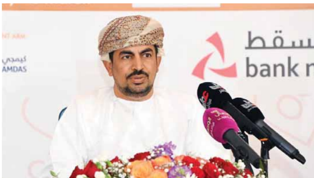
الدكتور عبدالله بن ناصر الحرصي وزير الإعلام العُماني خلال المؤتمر الصحفي

أهداف تتقاطع جميعها مع مستهدفات الإعلان عن يوم التأسيس الذي أضحي مناسبة وطنية عزيزة توضع مدى رسوخ وثبات مؤسسة الحكم ونظام الدولة في السعودية لمدة زادت على ثلاثة قرون، واستمرار دورها في خدمة القليلين وضيف الرحمن، والذي كان أولوية قصوى للأمة وملوك الدولة السعودية وصولاً إلى خادم الحرمين الشريفين الملك سلمان بن عبدالعزيز آل سعود.. حيث العهد الذي يستحضر فيه السعوديون عظمة الماضي، ويفخرون بما يتحقق في الحاضر، ويرون القفزة الهائلة التي تتحقق نحو المستقبل، بإعادة بناء دعائم وركائز الدولة السعودية وتقوية أركانها التي امتدت رايحها لكل المجالات.