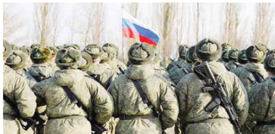
القوات الروسية تبدأ في إجراء مناورات نووية

كما أكد الأمين العام لحلف شمال الأطلسي (الناتو) ينس ستولتنبرغ، أنه لا يوجد ما يشير إلى أن القوات الروسية تراجعت عن مواقفها بالقرب من حدود أوكرانيا، بل مازالت لديها قوة ضخمة جاهزة