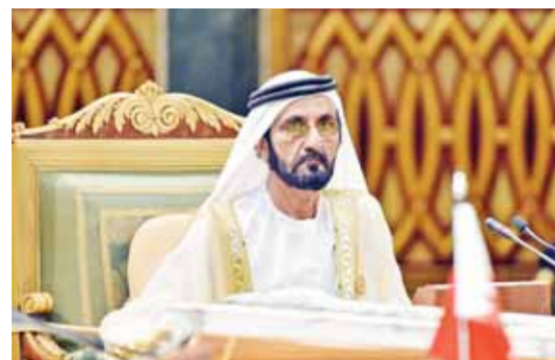
الدكتور عبدالله بن ناصر الحرصي وزير الإعلام العُماني خلال المؤتمر الصحفي

ومن جانبه، قال سعيد بن سلطان اليبوسيدي وكيل وزارة الثقافة والرياضة والشباب للثقافة نائب رئيس اللجنة الرئيسية للمعرض، خلال المؤتمر الصحفي، إنه سيتم تنفيذ ١١٤ فعالية ثقافية خلال أيام المعرض، منها ٢٩ فعالية ثقافية لمحافظة جنوب الشرقية، كما يبلغ عدد فعاليات ومناسط الطفل ٨٥