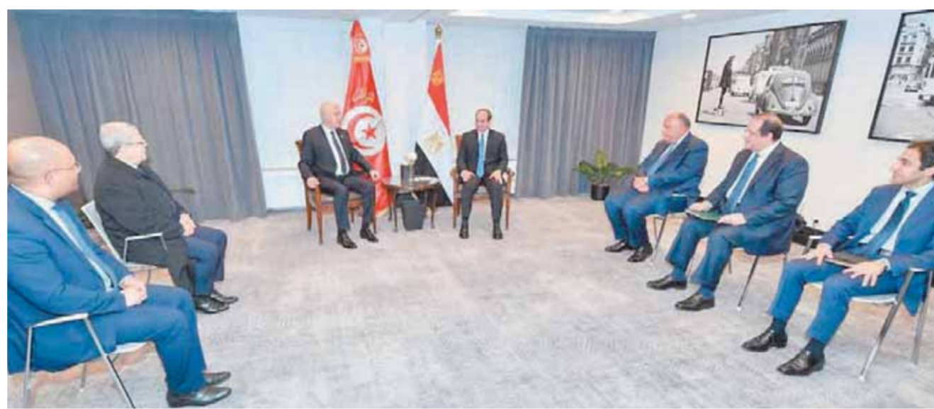
القمة المصرية التونسية في بروكسل

كما أكد الرئيس أن هذه الخطوة تأتي تكريساً لما تقوم به مصر على صعيد الاستعداد لإنتاج اللقاحات، سواء للاستخدام المحلي أو لتوفيرها للدول الإفريقية، استناداً إلى البنية التحتية الطبية والتصنيعية التي استثمرت فيها مصر على مدار السنوات الماضية، والقدرة على استيعاب هذه التكنولوجيا وتوظيفها بالشكل الملائم لضمان استمرار توافر اللقاحات داخل مصر، وأيضاً لدعم الدول الإفريقية الشقيقة في جهودها لتوفير اللقاحات لمواطنيها.