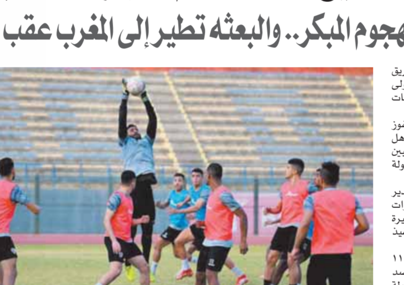
الزمالك يبحث عن الفوز خارج الديار

«كارتيرون» يتسلح بالهجوم المبكر.. والبعثة تطير إلى المغرب عقب المباراة