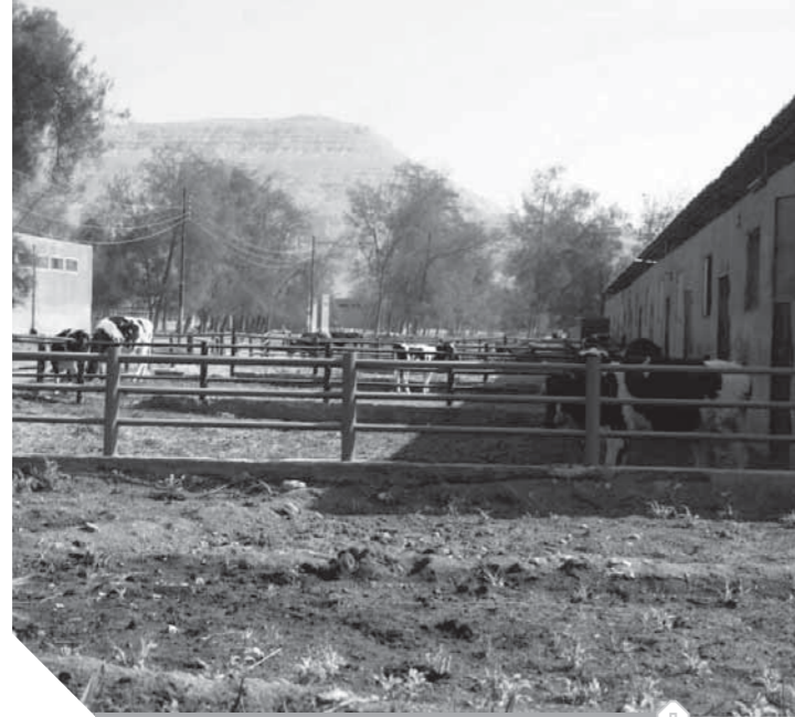
تطوير مزارع المواشى أصبح ضرورة

سوهاج يصل الإنتاج بالمحطة ١٦٠ ألف طبق بمبلغ ٤٨٠ ألف جنيه شهرياً وسيتم إنتاج قطيع استبدال خلال شهرين ٢٢ ألفاً وينتخب منها ١٨ ألف أم، حيث تخصص لغناب العمارتين الجديدتين بعدد ٦ عنابر قش ٢٥ ألف فرخة منتجة مع الاستمرار في الإنتاج ليكون الإيراد المتوقع ٢.٥ مليون جنيه شهرياً. ومشروع تزيخ وتسمين الدواجن بقرية الأحايوة شرق مركز أخميم المشروع تم شراء ٧٥ ألف بيضة مخصصة للتفريخ بالشروع و ٦٠ ألف كتكوت تسمين بمبلغ ٢٢٠ ألف جنيه جرى بيعها بإيراد ٢ مليون جنيه بالإضافة إلى إنتاج ٦ أطنان فراح ألفاً و ٩٠٩ قطان تسمين بقيمة ١٥٠ ألف جنيه.