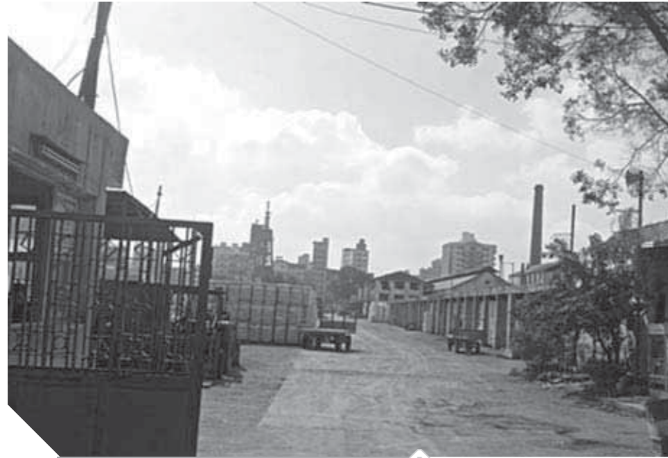
مطلوب إعادة المحالجات إلى عملها الطبيعي

وتمسوق بعض الأمثلة لتدل على ما نقول، فالمطاحن والمخابز والمستودعات سواء كانت دقيقاً أو غلظاً، تقوم بتعيين هذا المدير يرابط محترم وتتفق معه أنه شيال قضائياً، والمخير في الأمر أن الأجهزة الرقابية عندما تهاجم هذه الأماكن، تعلم تمام العلم أن هذا الرجل أهم لا يقتر ولا يكتب، وأنه بريرة من هذه الحضائر التي أهم المحررة ضده، وعلى بعد خطوات من جلوس المدير الوهمي، يجلس صاحب الشركة أو المستودع يشاهد التفتاح ويعيث في هاتفه، وعلى علم بكل ما يحدث من خلال الكاميرات المحيطة بالمكان، والتي تجعله على علم بكل صغيرة وكبيرة دون أن يخرج من مكتبه، وبعد انقضاء دور الضبطية القضائية أو الرقابية، يأتي دور المحامين الذين يشكلون في جميع الإجراءات وأذن النيابة والتحريات، ليعود المحامي المدير المزعوم أقصد المدير المسئول إلى عمله صباح سليم، والدولة ومواطنيها البسطاء المستحقون للدعم هم الخاسر الوحيد في هذه اللعبة المشرقة، التي تدار بالقانون وبمواده الملمية بالثغرات، والتي يضعها المشرع دون إغلاق لها حتى اتسعت خروفيها وتحوطت إلى مارد يبلع الخصلين من رجال الأجهزة الرقابية واهتمامهم بالرشاوى واستغلال النفوذ، بعد أن كنا ننظر إليها في بادئ الأمر على أنها مجرد تفرات. وتكمل الأسبوع القادم بإذن الله إن كان في العمر بقية