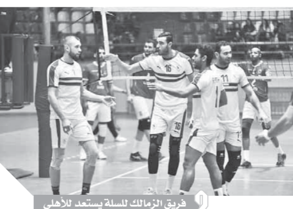
فريق الزمالك للسلة يستعد للاهلى

٤ باستاد القاهرة الدولى. ويقع الأهلى ضمن المجموعة الأولى التى تضم كلا من أساريا الليبى، السيب العمانى، خييل اليمنى. وتقام اليوم أيضاً مباراة الهلال