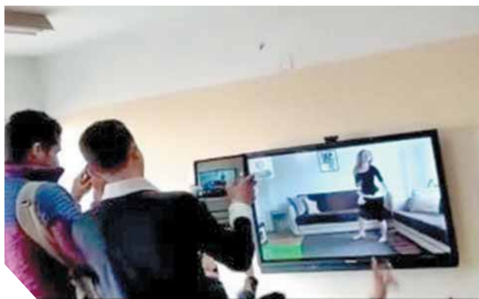
الفيديو المتداول على مواقع التواصل الاجتماعى

طلاب أحد الفصول الدراسية بمدرسة الفاروق عمر الثانوية بنين بمدينة السادات بالرقص على ما يسمى بأغاني المهرجانات وتداول الفيديو على مواقع التواصل الاجتماعى. أكد محافظ المنوفية أنه ستم إحالة المتسببين فى الواقعة للتحقيق واتخاذ كافة الإجراءات القانونية الرادعة حيال الواقعة ومجازاة كل من يثبت تقصيره وإهماله. وكان رواد مواقع التواصل الاجتماعى تداولوا صوراً وفيديوهات لطلاب المدرسة وهم يشاهدون فيديوهات على السبورة الذكية لراقصة وأغاني مهرجانات، الأمر الذى أثار غضب رواد التواصل الاجتماعى وتسبب فى فضيحة بمديرية التعليم بالمنوفية.