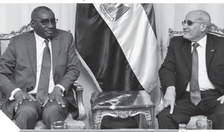
«العصار» خلال لقائه وزير القوات المسلحة السنغالى

الإنتاج الحربى، كما تمت مناقشة التعاون فى مجال توريد معدات وأجهزة من المنتجات المدنية لصناعة الإنتاج الحربى وتوريد الأجهزة الطبية والمشاركة فى تنفيذ مشروعات توريد الطرق وتصنيع مكونات أنظمة الطاقة الشمسية، وكذا المشاركة فى تنفيذ منظومات وبرامج فى مجال نظم المعلومات وتم توجيه الدعوة للوزير للمشاركة فى تطوير القوات المسلحة والشركات السنغالية فى معرض السلاح الدولى «إيديكس ٢٠٢٠»، وأعرب سيديكى كايا، وزير القوات المسلحة بجمهورية السنغال عن تطلعه لتعزيز التعاون مع وزارة الإنتاج الحربى، مشيداً بالإنجازات التصنيعية والفنية التى تمتلكها وزارة الإنتاج الحربى ودورها فى توفير متطلبات القوات المسلحة المصرية، وأهمية الدور الذى تقوم به مصر لمواجهة الإرهاب فى المنطقة، كما ثمن كايا ما تم بذله من جهود لتوطيد العلاقات فى القارة الإفريقية، معرباً عن رغبته فى فتح آفاق التعاون مع شركات الإنتاج الحربى فى مجالات التصنيع المختلفة. وفى نهاية اللقاء، تم الاتفاق على قيام فريق من الإمكانات التصنيعية والفنية من القوات المسلحة السنغالية فى مجال توريد المعدات العسكرية والأسلحة والذخائر وتدريب الفنيين والأمن السيبرانى، وكذا نقل الخبرة المكتسبة على مدار السنوات الماضية لإنتاج الحربى للمشاركة فى إقامة مصانع لإنتاج الأسلحة والذخائر والمعدات بدولة السنغال، وذلك فى ظل اهتمام القيادة السياسية بتوطيد العلاقات مع مختلف الدول الإفريقية وفتح آفاقها وتبادل الخبرات وتكنولوجيا التصنيع والمعلومات الفنية فى مجالات التصنيع المختلفة. واستعرض اللقاء الإمكانات التكنولوجية والفنية والبشرية المتاحة بالشركات والوحدات التابعة لوزارة