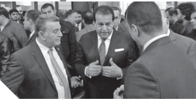
وزير التعليم العالى خلال افتتاح معرض «إديو إيجيت»

تهدف إلى استغلال تكنولوجيا الذكاء الصناعى وإعداد جيل مدرب قادر على المنافسة فى سوق العمل. وأضاف الوزير أنه يتم حالياً إعداد منظومة رقمية للامتحانات بالكليات العلمية، مشيراً إلى إنشاء أول جامعة عربية وإقليمية