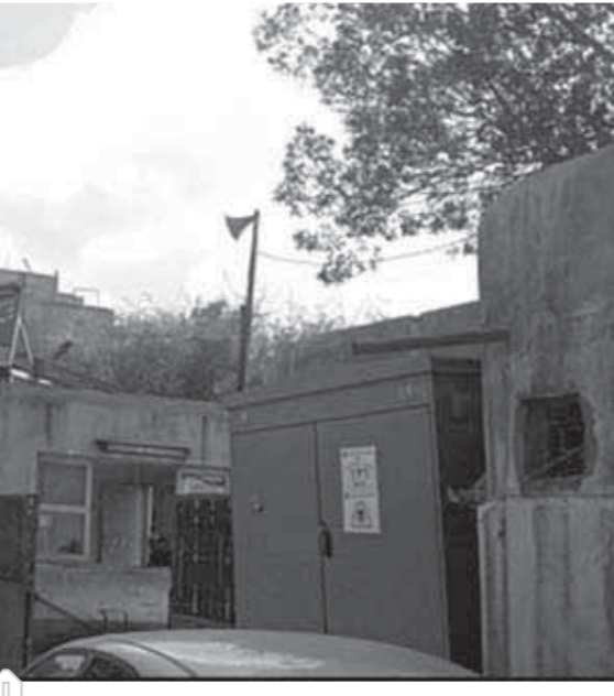
كتب. محمد طاهر:

تبدأ من عام ١٨٧٩ وهناك ماكينات منذ ذلك التاريخ لا تزال تعمل في المحالج ومنها ماكينات من أعوام ١٨٨٠ حتى ١٨٨٢ وهي ماكينات تعمل الديزل أو بالكهرباء، وهذا الأمر يحتاج إلى التطوير بما يتناسب مع هذا العصر الحديث. ويضيف المهندس طلعت أبو السعود رئيس لجنة الوفد بالكردية قائلاً عودة الرئيس «السيسي» للاهتمام بزراعة القطن، نظرة مستقبلية مشرقة للفلاح وللصناعة والتي غاب اقتصادها مع غياب القطن فمحالجات القطن انتهت مع إهمال زراعة القطن طويل التيلة والذي استبدل بقطن قصير التيلة والذي ساهم في ابتور الفلاحين من زراعته. مشيراً إلى أن أغلب تلك المحالجات الحالية، لا تزال تعمل بالماكينات القديمة وهي صناعة