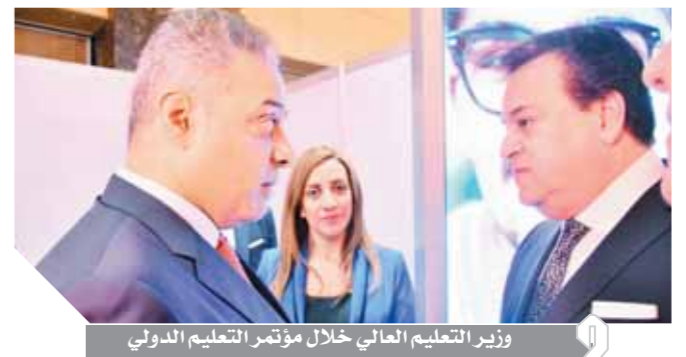
وزير التعليم العالى خلال مؤتمر التعليم الدولى