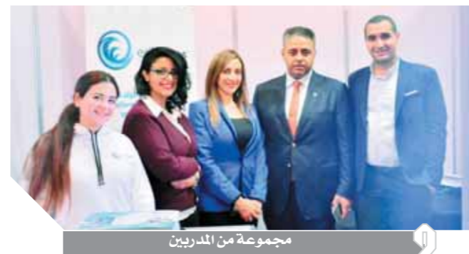
مجموعة من المديرين