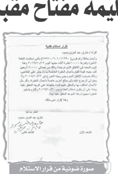
صورة ضوئية من قرار الاستلام

لذلك أناشد اللواء محمود توفيق وزير الداخلية التحقيق مع هذا التربى الذى نقض الاتفاق بينى وبينه ولم يجد من يعاسه حتى الآن، كما أناشد محافظ القاهرة اتخاذ اللازم نحو هذا التربى الذى أساء لمحافظة القاهرة بأعمالها.