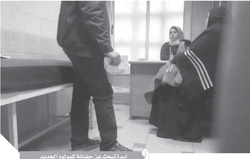
أسرة تبحث عن حضانة للمولود الجديد

وأكد عضو مجلس النواب، أن أعداد الولادات القيصرية تحدث بنسبة ٨٠ إلى ٨٥٪ ويجب أن تكون ولادة طبيعية والسبب الأطباء الذين يترجمون أكثر من الولادة القيصرية، مطالبا وزارة الصحة والسكان بتعديل تشريعى يلزم جميع أطباء النساء والتوليد قبل إجراء العمليات القيصرية بتحرير تقرير طبي يوضح الأسباب التي تجبر الطبيب على الولادة القيصرية، مؤكدا أن هذا الاقتراح محل دراسة الآن بمجلس النواب.