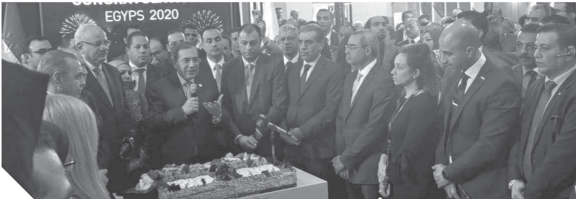
وزير البترول في ختام مؤتمر ومعرض إيجبس، ٢٠٢٠

وجه المهندس طارق الملا، وزير البترول والثروة المعدنية رسالة للعاملين في قطاع البترول في ختام مؤتمر ومعرض مصر الدولي الرابع للبترول إيجبس ٢٠٢٠، هنأهم فيها على نجاح المؤتمر مشيدا بجهودهم خلال السنوات الأربعة الماضية والتي مثلت القوة الدافعة لتحقيق النجاحات على مدار هذه الفترة.