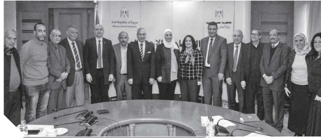
وزيرة التضامن خلال توقيع بروتوكولات التعاون مع الجمعيات الأهلية

باحت الدكتور محمد سعيد العصار، وزير الدولة للإنتاج الحربى، مع سينيكي كايا، وزير القوات المسلحة بجمهورية السنغال، والوفد المرافق له، عدة معايير لاختيار الجمعيات المشاركة منها أن تكون لديها خبرة فى مجالات التنمية المجتمعية والاقتصادية والاجتماعية والشعبية ولديها خبرة فى مجال برامج المواطنة واحترام التنوع الدينى والثقافى وتعمل على نطاق جغرافى واسع ولديها سابقة أعمال مع وزارة التضامن فى مشروعات ومبادرات ولديها نظام مؤسسى ومالى يعكس قدرة الجمعية على تنفيذ مشروعات تنموية متوسطة وكبيرة ولها مردود مؤثر على المجتمع.