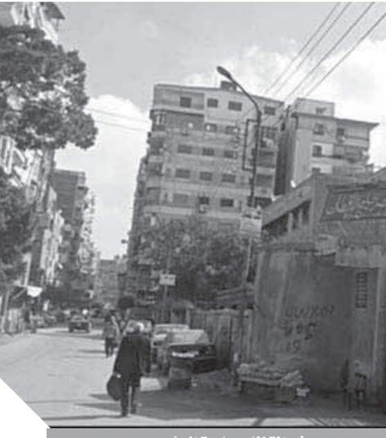
في انتظار مبادرة الرئيس

أما عن التصريف في بعض الأراضي، فهذا وارد لأن المرحلة القادمة للتطوير تحتاج إلى معدات متطورة وبالتالي ستكون بديلاً للمعدات التي تهالكت، والتي كانت تستغل بمساحات وأعداد أكبر، الأمر الذي يعد على سبيل المثال كنا تتعامل في الحلج من خلال مساحة لعدد ٧٥ دولاباً، ومع التطوير سيكون ١٢ دولاباً لعددات حديثة لرفع الكفاءة، ونسب أعلى، علاوة على التعامل البيئي وصحة العمال، فلا يوجد عوادم مؤثرة على صحة العامل ناتج ما يسمى «الزغبارة» وهو تراب القطن، ومعظم تلك المعدات تدار بالكمبيوتر لتكون منظومة التطوير مشفرة ليخرج إلينا منتج قطن عالي الجودة خالياً من الشوائب. وعبر فلاحو الدقهلية عن رضائهم الكامل لتلك الخطوة والتي تعيد القطن طويل التيلة «جيزة ٤٥» للحياة من جديد، حيث باركت خطوات الرئيس «السيسي»، حيث طالبوا بالاهتمام في استعادة المنظومة القائمة على المعوقات، سواء في الزراعة أو الصناعة، حيث أكدوا أنها بشرة خير تعود بالعصر الذهبي للفلاح، وهي في ذات الوقت تسهم في أزمة مياه الري نظراً لأنه محصول «ناشف» لا يحتاج مياه ري كبيرة، مثل زراعات أخرى.