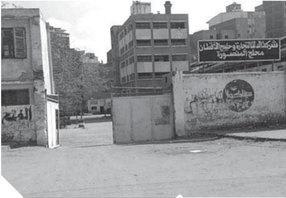
محالج المنصورة هيكل خرساني على الأرض