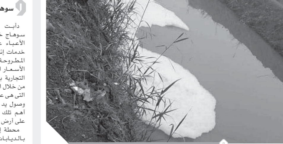
مواد كيميائية بالمصارف