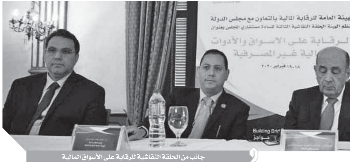
جانب من الحلقة النقاشية للرقابة على الأسواق المالية