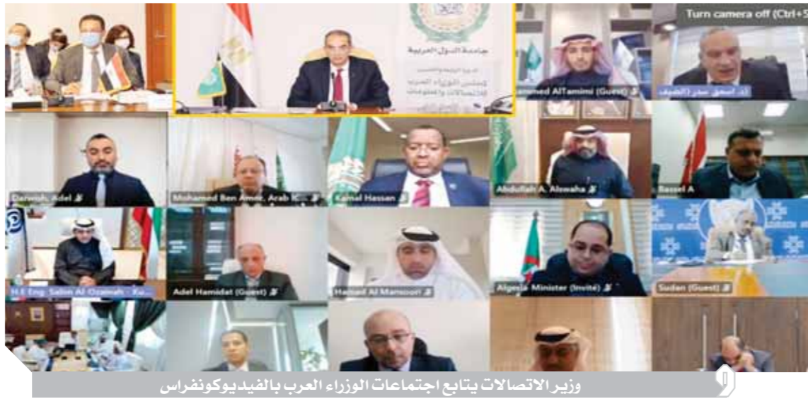
وزير الاتصالات يتابع اجتماعات الوزراء العرب بالفيديو كونفرانس

العرب للاتصالات والمعلومات في دورته السابعة كإحدى الدول العربية التي تستضيف عددا كبيرا من الكيانات الدولية، حيث وصلت تطوير بنية تحتية دولية متميزة من خلال إضافة المزيد من المحطات على خمسة عشر كابل دولي تمر بمصر؛ داعيا إلى إنشاء شبكة دولية تربط الدول العربية بعضها البعض؛ موضعا أنه في سبيل تنفيذ هذه المبادرة فإن جمهورية مصر العربية على استعداد لتقديم ١٠ جيغا/ثانية على جميع الكيانات البحرية التي تمتلكها الشركة المصرية للاتصالات لربط جمهورية مصر العربية بالدول العربية المشتركة في تلك الكيانات، لتكون نواة لشبكة اتصالات عربية فريدة ومميزة، وأعرب المهندس عبدالله بن عامر السواحه وزير الاتصالات وتكنولوجيا المعلومات بالمملكة العربية السعودية التي كانت ترأس مجلس الوزراء