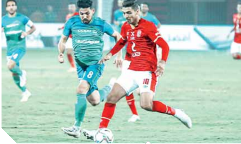
الأهلي يسعى لمواصلة انتصاراته بالدوري