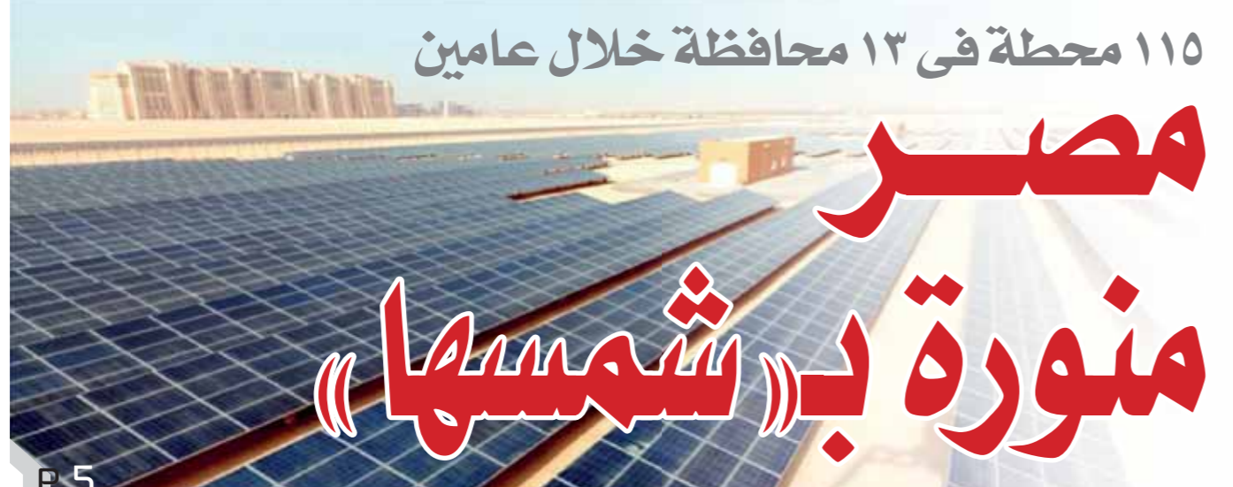
محطة فى ١٣ محافظة خلال عامين