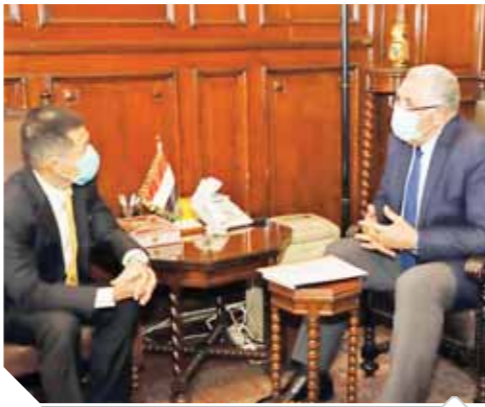
وزير الزراعة خلال لقائه سفير تاييلاند

مجلس النواب سوف يكرهها للمرة الثانية خلال جلسة الإجراءات التي سبقها بعد تلقيه دعوة رئيس الجمهورية بالانعقاد وانتخب الرئيس الوكيلين وسيكون المجلس أمام خيارين وهما منح الفرصة الثانية للدكتور على عبدالعال رئيسا للمجلس، أو اختيار آخر، وفي تقديري أن الدكتور عبدالعال تحمل ما لا تتحمله الجيل في تشيين أول برلمان بعد ثورة ٣٠ يونيو وعبر به إلى بر الأمان، وأصبح الفصل التشريعي الثاني في حاجة إلى خبراته التي اكتسبها على مدار السنوات الخمس الماضية في إدارة البرلمان بطريقة حكيمة حرص فيها على التوازن بين متطلبات الوطن واحتياجات المواطن، وبالتالي فإن منحه الفرصة الأخيرة ستكون في صالح تقوية الأداء البرلماني خاصة وأن نسبة كبيرة من النواب وصلوا إلى المقاعد البرلمانية لأول مرة ويحتاجون إلى خبرة تدير البرلمان.