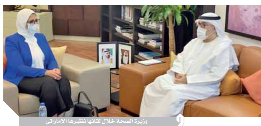
وزيرة الصحة خلال لقائها نظيرها الإماراتى

كتب - هشام الهلوتى: التقت الدكتورة هالة زايد، وزيرة الصحة والسكان، أمس الخميس، وزير الصحة ووقاية المجتمع الإماراتى، عبدالرحمن بن محمد العويس، على هامش زيارتها إلى دولة الإمارات لبحث خطة توريد دفعات لقاح فيروس كورونا المستجد إلى مصر، بحضور كل من السفير المصرى لدى الإمارات، والقنصل الإماراتى لدى مصر، والدكتور محمد حساني، مساعد وزيرة الصحة والسكان لشئون مبادرات الصحة العامة. وأوضح الدكتور خالد مجاهد، مستشار وزيرة الصحة والسكان لشئون الإعلام والتحدث الرسمى للوزارة، أن الوزيرة نقلت رسالة شكر من الرئيس عبدالفتاح السيسى ورئيس الوزراء الدكتور مصطفى مدبولى والشعب المصرى، إلى دولة الإمارات العربية المتحدة الشقيقة حكومة وشعباً، على توريد الدفعة الأولى من لقاح فيروس كورونا من إنتاج شركة (سينوفارم) الصينية بدعم من شركة G42 الإماراتية للرعاية الصحية، فى إطار عمق وترابط العلاقات بين الشيعتين الشقيقتين. وأضاف أن الجانبين تناولا خلال اللقاء الجهود المبذولة لمواجهة فيروس كورونا المستجد (كوفيد-١٩) منذ بداية الجائحة، حيث استعرضت الوزيرة التجربة المصرية فى إدارة أزمة فيروس كورونا المستجد