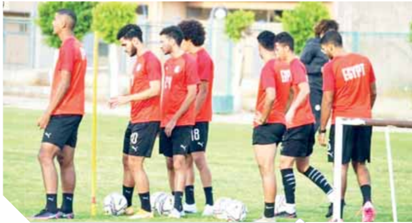
منتخب الشباب ينتظر تحديد مصيره أمام تونس