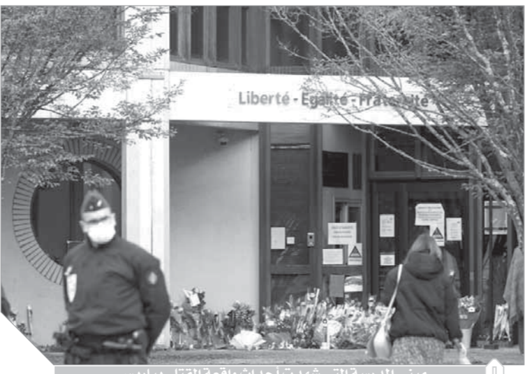
مبنى المدرسة التى شهدت أحداث واقعة القتل ببيارس

للسؤال والسيد المسيح لأن ذلك معاقب عليه جانبياً فى كل قوانين العقوبات وأمام ازدواجية المعايير التى تتخذها دول أوروبا بمنع الأساءة إلى المسيح والسماح بالأساءة إلى الرسول. وقامت مظاهرات فى كل الجاليات الإسلامية فى كل دول أوروبا وخاصة فى إسبانيا ولندن وألمانيا وفرنسا احتجاجاً على الصور المسيية. وترتب على ذلك أنه فى فبراير 2006 قام المظاهرات فى ليبيا بحرق القنصلية الإيطالية فى بنى غازى وترتب على ذلك مقتل أحد عشر شخصاً. 180 درجة بحيث يكون حرية التعبير مع احترام المقننات الدينية للمسلمين، وأن نشر الرسوم المسيية فيه أيداً لمشاعر الأهلين فى مختلف دول العالم وبذلك تراجع الاتحاد الأوروبى، فبعد أن كان ينص على حرية التعبير قيد هذه الحرية بعدم المساس بالمشاعر الدينية من نسيه للرسل.