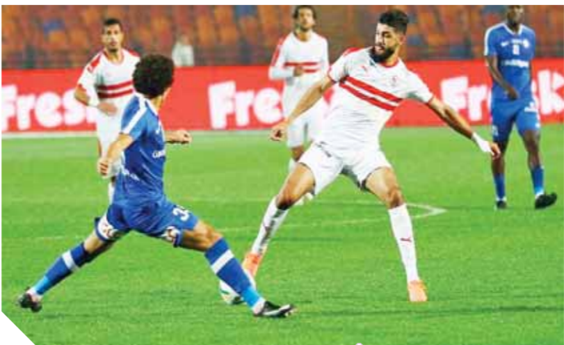
ساسى في طريقه للتجديد مع الزمالك

إجراءات استضافه فريق جازيلى الشادى الذى يواجه الزمالك فى دور ال٣٢ لدورى أبطال إفريقيا بالقاهرة يومى الأربعاء المقبل فى جولة الذهاب و٦ يناير المقبل فى العودة.