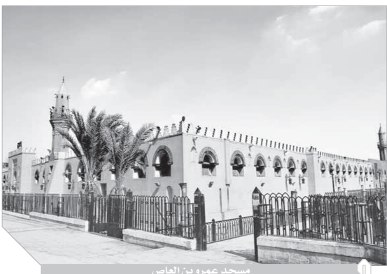
مسجد عمرو بن العاص