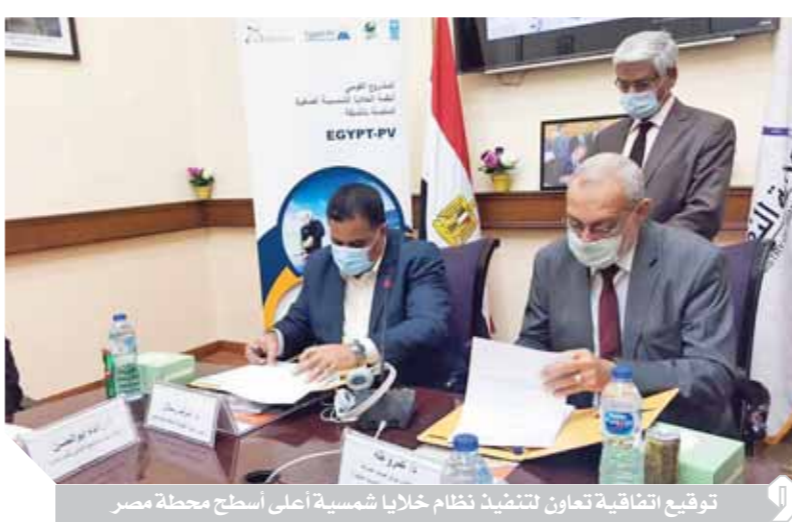
توقيع اتفاقية تعاون لتنفيذ نظام خلايا شمسية أعلى أسطح محطة مصر

ويبدو أن مصر ستدخل ضمن أكبر المنافسين عالمياً في إنتاج الطاقة الشمسية، حيث وصفت مجلة فوربس الألمانية مستقبل الطاقة الشمسية في مصر بـ «المبهر»، فهي إحدى دول منطقة الحزام الشمسي الأكثر مناسبة لاستخدام الطاقة الشمسية، وأشارت إلى أن الشمس تشرق في مصر من ٩ إلى ١١ ساعة يومياً، وبالتالي ستكون صاحبة أكبر محطة طاقة شمسية عالمياً .. فمستوسط ضوء الشمس المباشر والرأس يعادل الفين إلى ٢ الألف و ٢٠٠ كيلو وات / ساعة لكل متر مربع سنوياً.