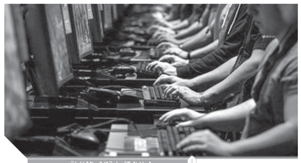
لجان اليكترونية تنشر الشائعات