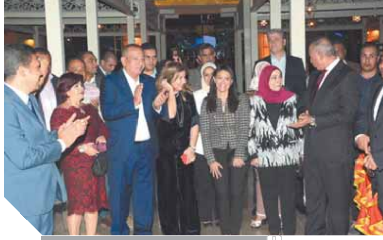
صورة تذكارية للوزيرة مع حضور الافتتاح