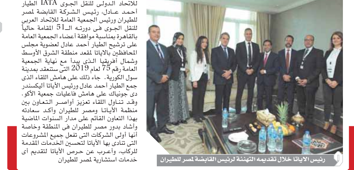
رئيس الأياتا خلال تقديمه التهنئة لرئيس القابضة لمصر للطيران

هنا الكسندر دي جونيك، الرئيس التنفيذي للاتحاد الدولي للنقل الجوي IATA الطيار أحمد عادل، رئيس الشركة القابضة لمصر للطيران ورئيس الجمعية العامة للاتحاد العربي للنقل الجوي في دورته الـ51 المقامة حالياً بالقاهرة بمناسبة موافقة أعضاء الجمعية العامة على ترشيح الطيار أحمد عادل لعضوية مجلس المحافظين بالإياتا لمعد منطقة الشرق الأوسط وشمال أفريقيا الذي يبدأ مع نهاية الجمعية العامة رقم 75 لعام 2019 التي ستعقد بمدينة سول الكورية. جاء ذلك على هامش اللقاء الذي جمع الطيار أحمد عادل ورئيس الأياتا الكسندر دي جونيك على هامش فعاليات الجمعية العامة وقد تناول اللقاء تعزيز أو أصرر التعاون بين منظمة الأياتا ومصر للطيران وأكد سعادته بهذا التعاون القائم على مدار السنوات الماضية وأشاد بدور مصر للطيران في المنطقة وخاصة أنها أولى الشركات التي تتعامل جميع المشروعات التي تبادي بها الأياتا لتحسين الخدمات المقدمة للركاب، وأعرب عن حرص الأياتا لتقديم أي خدمات استشارية لمصر للطيران