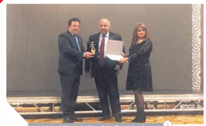
رئيس جمعية مسافرون يتسلم جائزة المهرجان

وتم الاتفاق على أن حركة الفنادق العائمة ستعمل بكامل طاقتها في فترة السدة الشتوية، مع التأكيد على ضرورة التنسيق بين وزارتي النقل والسياحة وغرفة المنشآت الفندقية المعنية بخصوص توقيتات رحلات هذه الوحدات