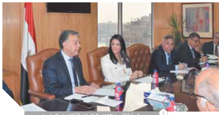
لجنة تأمين الفنادق العائمة أثناء اجتماعها

وفي ختام الاجتماع تم التأكيد على أهمية اللجنة المشتركة بين الوزارات الثلاث وكافة الجهات المعنية لتأمين تنفيذ كافة الإجراءات والتدابير التي تم الاتفاق عليها وإزالة أي عموقات أو مشاكل طارئة، وسيتم التنسيق لتشكيل فريق عمل بين هذه الوزارات وغرفة المنشآت الفندقية لإدارة أي أزمة قد تطرأ.