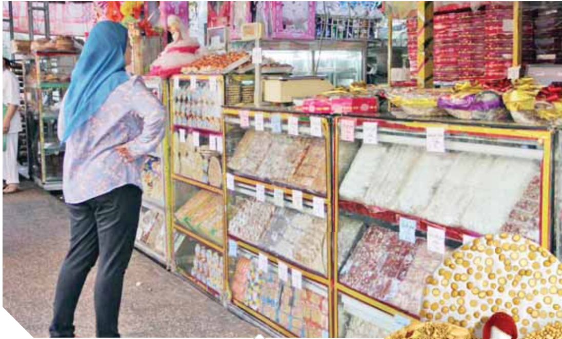
إقبال ضعيف على حلاوة المولد