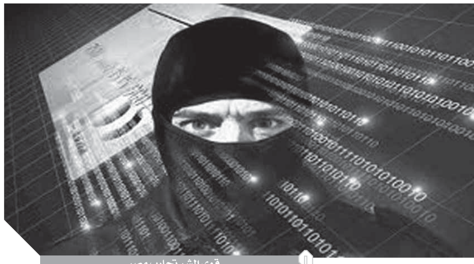
قوى الشر تحارب مصر