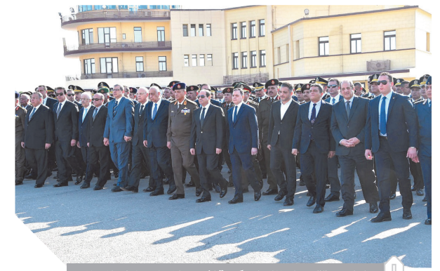
الرئيس يتقدم الجنازة العسكرية لشهيد الإرهاب ساطع النعماني