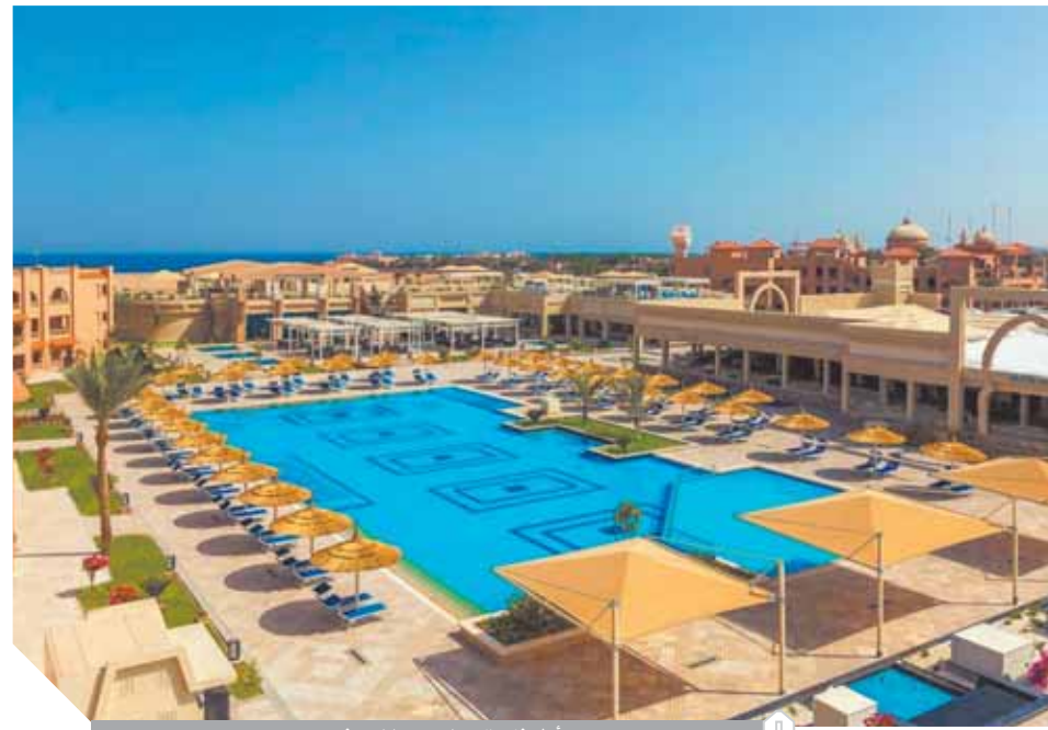
أول فندق سياحي رياضي في مصر