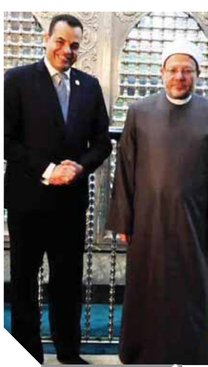
شوقي علام مع أمين عدلى

يحل فضيلة الدكتور شوقي علام مفتى الجمهورية في حوار خاص لـ «أخبار مصر» الثلاثاء من داخل مقام سيدنا الحسين للحديث عن حب الرسول وكيف كان صلى الله عليه وسلم رحمة للعالمين. ويتحدث أيضاً عن ما هو الطريق للسبيل على نهج وفي مولده العطر كيف ينهدى بهديه؟ ويتحدث الدكتور علام مع الإعلامي أمين عدلي عن مكانة مصر عند الرسول وهل حب الأوطان من الإيمان ويكتشف ضوابط الفتوى وكيف يواجه فتاوى التلطفة.