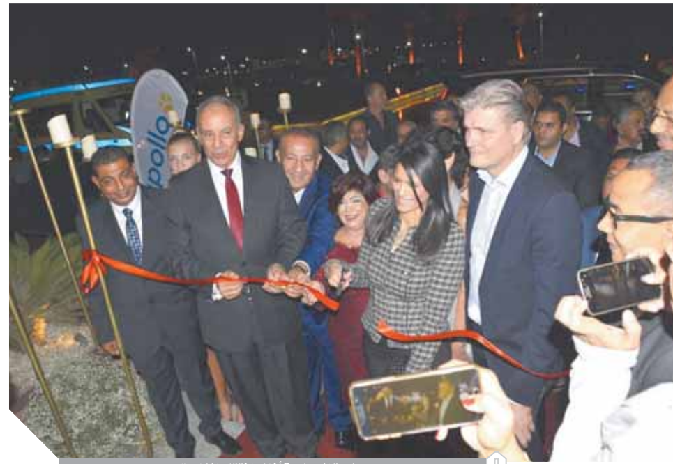
وزيرة السياحة أثناء افتتاح الفندق