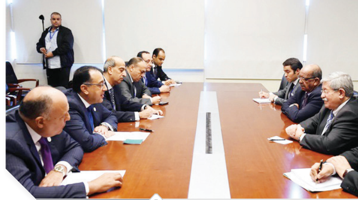
جانب من الاجتماع

أكد الدكتور مصطفى مدبولي، رئيس مجلس الوزراء، موافقة مصر على الهيكل الجديد المقترح لمفوضية الاتحاد الأفريقي برئيس ونائب وستة مفوضين باختصاصات محددة. جاء ذلك خلال كلمته التي ألقاها نيابة عن الرئيس عبدالفتاح السيسي في أعمال الدورة الاستثنائية العادية عشرة لمؤتمر قمة رؤساء الدول والحكومات للاتحاد الأفريقي، والتي تختتم أعمالها، اليوم، في العاصمة الإثيوبية أديس أبابا. ووصف «مدبولي»، الهيكل المقترح للمفوضية بأنه يحقق التوازن المأمول بين الجنسين والأقاليم الجغرافية الخمسة. وأشار إلى أن مصر تأمل في إعداد هيكل فعال ومرن للإدارة يتسم بالكفاءة. وأكد تقدير مصر لحرص الدول الأعضاء على عدم المساس بالقانون التأسيسي للاتحاد الأفريقي لما يوفره من عنصر الاستقرار المؤسسي اللازم للاتحاد الأفريقي. وعن الإصلاح المالي والإداري للمفوضية، أكد أن المستهدف من تلك العملية ليس تقليص