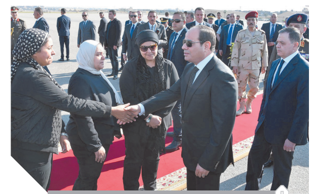
الرئيس يتقدم واجب العزاء لأسرة الشهيد ساطع النعماني