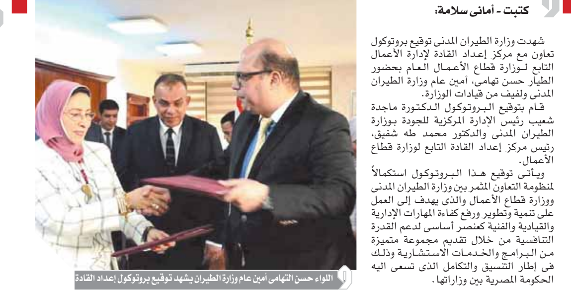
اللواء حسن التهامي أمين عام وزارة الطيران يشهد توقيع بروتوكول إعداد القادة