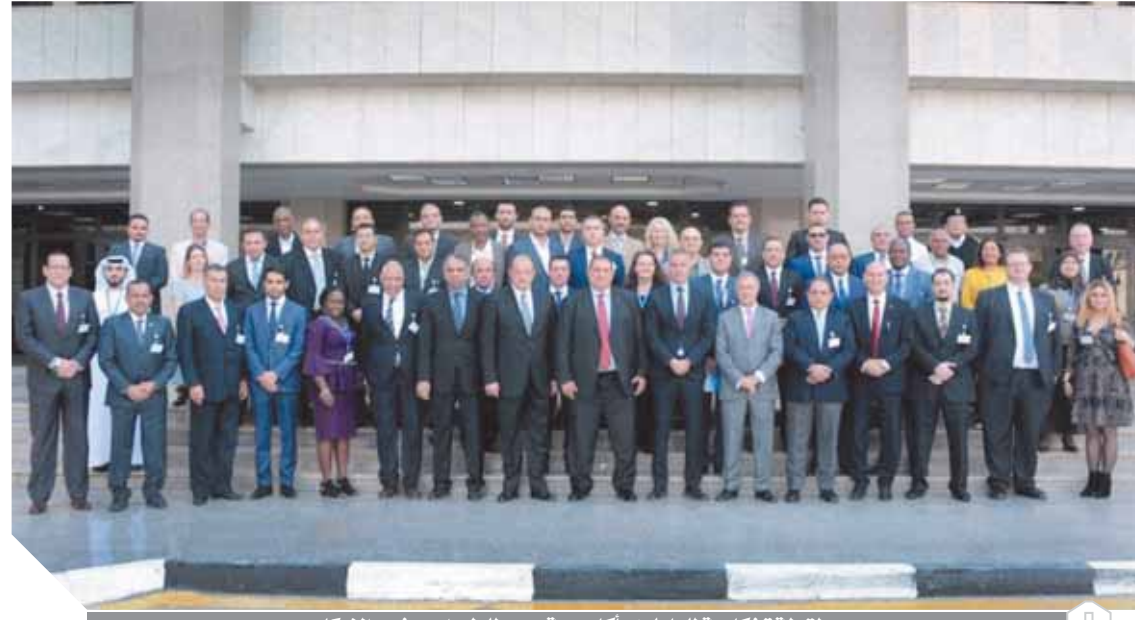
لقطة تذكارية للعاملين بأكاديمية مصر للطيران ووفد «الإيكاو»

وأشار إلى أن قطاع الطيران يتعرض إلى العديد من المخاطر والتحديات الأمنية والقرصنة الإلكترونية والتي تتطلب تعاوناً إقليمياً ودولياً للتصدي لهذه التحديات وأن علينا زيادة قدرتنا لضمان السفر الجوي الآمن للركاب.