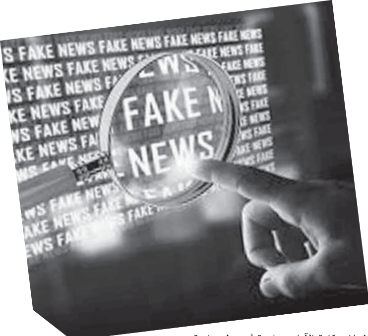
الاعلام بكليّة الآداب جامعة أسيوط دراسة

للتعرف على دور مواقع التواصل الاجتماعي في نشر الشائعات، حيث أجريت الدراسة على عينة بلغ حجمها (300) مبحوث. وأوضحت نتائج الدراسة أن من أهم العوامل المؤثرة على نمو وانتشار الشائعات بالمجتمع هي غياب المعلومات الواضحة والدقيقة بنسبة (71,3%)، لذلك نصحت الدراسة الأجهزة الرسمية بضرورة إصدار البيانات الصحفية فور ظهور الشائعات؛ وهو ما يتعين معه زيادة التواصل بين أجهزة الدولة والاعلام لمواجهة الشائعات، وتوفير آلية لإدارة الرسائل ومحتواها، وكذلك تكوين وتجهيز ردود فورية للأحداث الطارئة، ومد وسائل الإعلام بكل المعلومات للحد من انتشار المعلومات المغلوطة، والتي يستغلها بعض الأفراد أو الجهات لزعزعة استقرار الدولة.