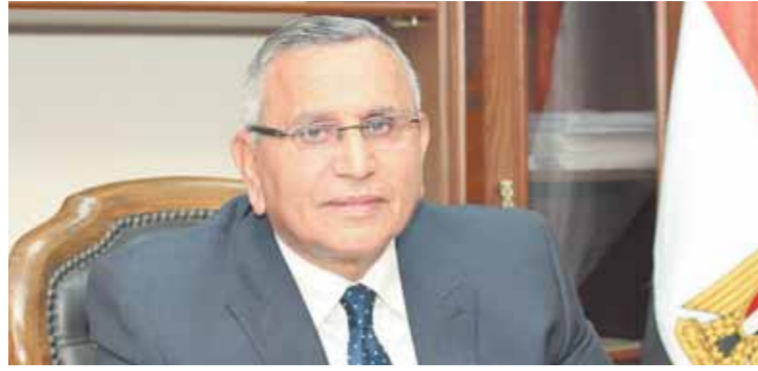
د. عبدالسند يمامة

أكد الدكتور عبدالسند يمامة، رئيس حزب الوفد والمرشح على الترشح في الانتخابات الرئاسية، أن الحملة الانتخابية للحزب جاهزة للانطلاق يوم ٩ نوفمبر المقبل. وكان الدكتور عبدالسند يمامة قد شكل فريق الحملة الانتخابية برئاسة ومساعدة عدد من رجال الوفد من أعضاء الهيئة العليا لحزب ونواب البرلمان في مجلس الشيوخ والنواب، كما تم تجهيز مقر الحملة الرئيسي في مقر الحزب في شارع بولس حنا وربطه بمقاررات الحزب على مستوى الجمهورية. وأعلن الدكتور عبدالسند يمامة أن البرنامج الانتخابي يتضمن حلولاً كثيرة لعدد من المشاكل التي تتركز على المواطن، واعتمد البرنامج على رؤية اقتصادية شاملة في هذا الشأن، وأكد الدكتور عبدالسند يمامة أن قضية التعليم تشغل باله