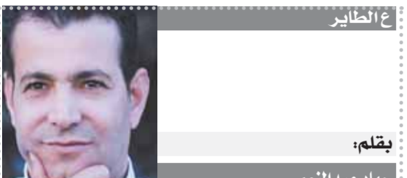
ع الطائر بقلم: جهاد عبد المنعم

والتوسع في إدارة الهيئة القومية للبريد. فأروق رئيس مجلس إدارة الهيئة القومية للبريد أكد طلعت أن مكتب بريد Drive Thru مدينة نصر يعد هو الأول من نوعه في مصر، موضحاً أن مكتب «الخدمة من داخل السيارة»، بما يعرف باسم Drive Thru يتيح للمواطن دخول مكتب البريد بسيارته والحصول على كل الخدمات البريدية وهو في السيارة، مشيراً إلى أن المكتب يقدم الخدمات البريدية، والمالية،