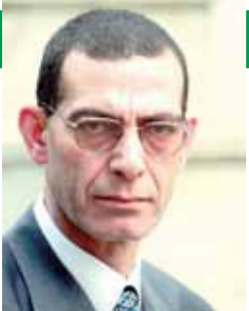
بقلم: د. وجدى زين الدين

المشاركة في الانتخابات الرئاسية واجب وطني مهم لا يجب التفریط به على الإطلاق، ومن يفكر في غير ذلك يرتكب في حق نفسه جريمة، ولا اعتقد أبداً أن المصريين من الممكن أن يفرضوا في هذا الحق الوطني الذي كفله لهم الدستور، فلا يجوز لأي مواطن مصري أن يتأخر عن أداء هذا الواجب الوطني في ظل شذوثة مناوئة تريد أن تعطل مسيرة التفعيل السياسي الأهم الذي تشهده البلاد حالياً والمتمثل في الانتخابات الرئاسية.