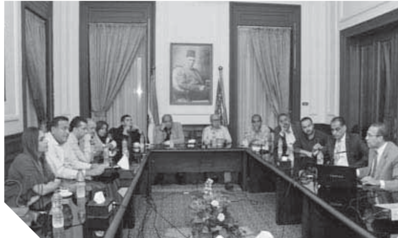
خارجية الوفد خلال اجتماع سد النهضة

حصة مصر من المياه، لأن تصريف المياه بصورة منتظمة سيوقف ملء السد العالي. وأضاف «أبو زيد» أن السد العالي في أسوان مصمم على أن تستخدم مصر ٥٥.٥ مليار متر مكعب من المياه كمتوسط استخدام، مؤكداً أن تأثر هذه النسبة سلبيًا على توليد الطاقة الكهرومائية والكهربائية لمصر، وبالتالي تأثر مصادر الطاقة تأثيراً سلبيًا وأوضح المدير الإقليمي للموارد المائية بسيداري، أن مصر لجأت لإعادة استخدام المياه وتحلية مياه البحر في البحر الأحمر وسيناء، وحتى المناطق الساحلية التي تستعتمد اعتماداً كلياً على هذا النظام بسبب الاحتياجات المختلفة بسبب عدم وجود موارد مائية أخرى، خاصة أن تلك المناطق مناطق سياحية تستهلك كميات كبيرة من المياه في الأغراض المختلفة. وأكد «أبو زيد»، أن المصدر الرئيسي والوحيد للمياه العذبة في مصر هي مياه الجوفية ومياه نهر النيل، الذي يسير في ظروف مناخية مختلفة وطبيعة خاصة، وهو ما ينعكس على الزراعات، بينما تعتمد دول إفريقيا في مصادرها على ١٤ مصباً من الأنهار في دول أعالي النيل.