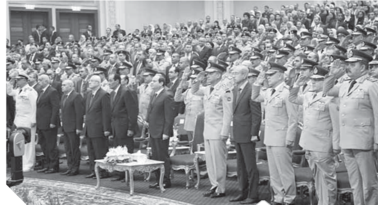
الرئيس وكبار قيادات الدولة في بداية الحفل

التوأمة مع الجامعات المصنفة عالمياً فقد تم تنفيذ التوأمة بين كلية الطب بالقوات المسلحة وكلية الطب بجامعة ولاية ميتشجن بالولايات المتحدة الأمريكية والتي آلت إلى إعطاء شهادة من هذه الكلية لكل خريج من كلية الطب بالقوات المسلحة تقيد بأنه قد اجتاز بنجاح اختبارات منهج بكالوريوس الطب والجراحة بعد مراجعته وتعزيزه واعتماده. وقد أشادت إدارة جامعات ولاية ميتشجن بالمبادرة البناءة للكلية فى إطلاق برنامج «أقرأ لنقود» فى يونيو ٢٠١٩ حيث يتيح هذا البرنامج لطلبة الكلية أن ينهلوا العلم من مكتبة عالمية توفرها جامعة ولاية ميتشجن إيماناً بدعم الفكرة وأهمية زيادة المدارك والسمو فى بناء الشخصية والتوسع فى المعرفة.