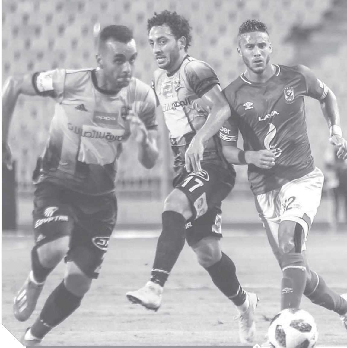
المقاولون يهدف للتواجد في المربع الذهبي في نهاية الدوري