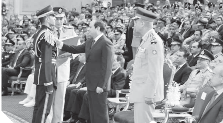
الرئيس يقبل خريجي كلية الطب قاطرة الطب الحديث فى مصر