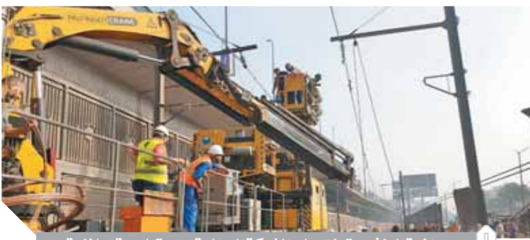
رافعة النش سقطت على الشبكة الهوائية ودمرت لوحة إعلانية