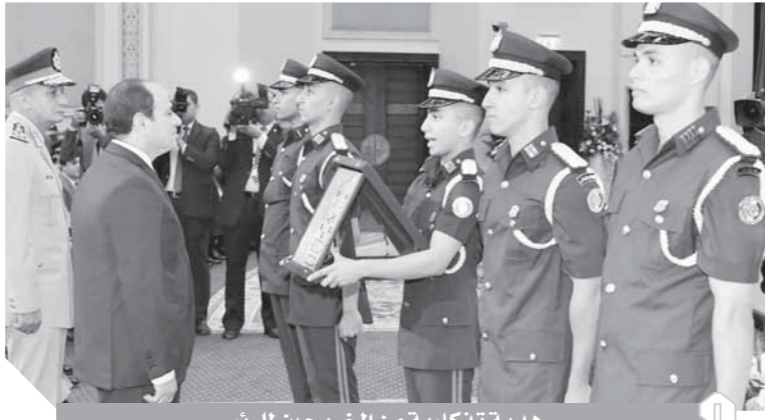
هدية تذكارية من الخريجين للرئيس