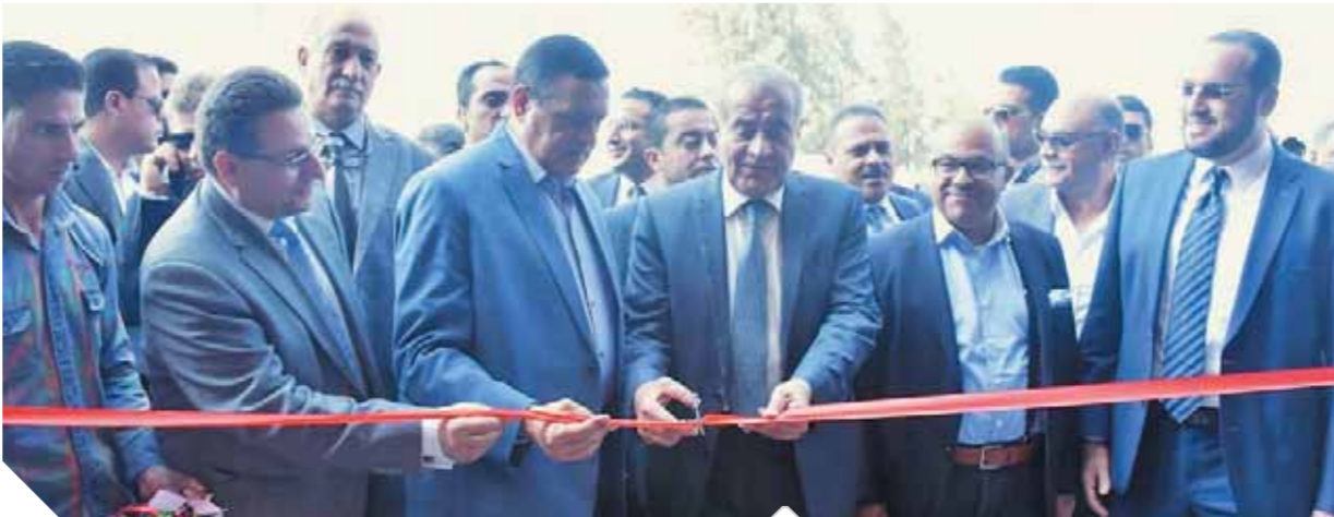
وزير التنمية يفتتح المنطقة اللوجيستية بدمهور

وفرنا ٣٠٠ ألف فرصة عمل في عامين.. وأنقذنا الخضراوات الطازجة من التلف