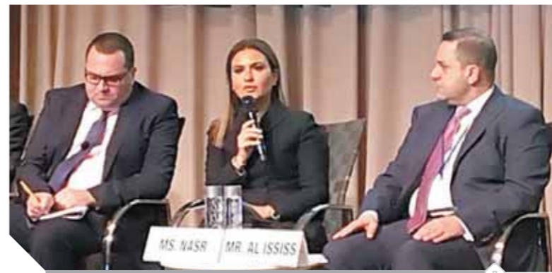
وزيرة التعاون الدولى خلال مشاركتها فى الاجتماعات السنوية للبنك الدولى