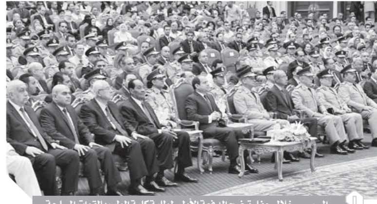
السيسى خلال حفل تخرج الدفعة الأولى لطلبة كلية الطب بالقوات المسلحة