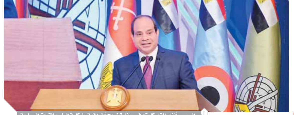
السياسي أثناء إلقاء كلمته في حفل تخريج أول دفعة من كلية الطب بالقوات المسلحة