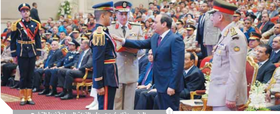
الرئيس يقبل خريجي طب القوات المسلحة نوط التخرج

لن أجمال أبداً.. ولم أستغل وجودي في الجيش لصالح أحد