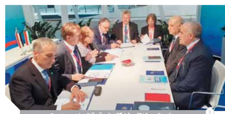
وزير الري خلال مشاركته فى قمة المياه ببودابست