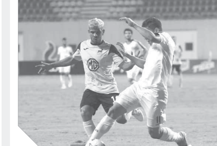
وادي دجلة يسعى للعودة لعرضه القوي