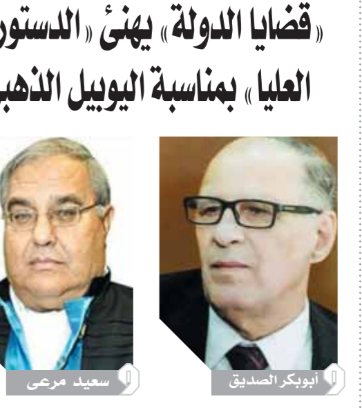
سعيد مرعي، أئوبىكر الصديق

كتب صلاح صياح يبدو أن النجم المصرى ذهب إلى أبعد مدى لضمان استمتاع ابنته «مكة» في عيد ميلادها الخامس، وهو ما أظهره من خلال الصور التي نشرها على مواقع التواصل الاجتماعي. وهذه المرة، زاد مهاجم ليفربول الإنجليزي من جرعة الجراة، حيث ارتدى ثوب «ماوا»، كالذي يرتديه سكان جزيرة ماوي، وبالتحديد مثلما بدا عليه بطل فيلم الرسوم المتحركة من «موانا». وشارك صلاح عبر صفحته الشخصية بتعليقات منها «أنا، ساوي، أحضر لك يا موانا! عيد ميلاد سعيد يا أميرتي».