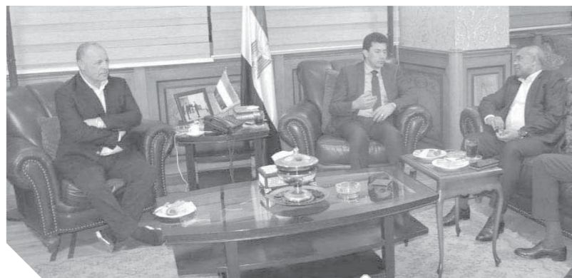
صبيحى مع أحمد أحمد وأبو ريدة

لمناقشات بطولة كأس الأمم الأفريقية تحت ٢٣ سنة والتي ستقام خلال الفترة من ٨ إلى ٢٢ نوفمبر القادم، والمؤهلة إلى دورة الألعاب الأولمبية طوكيو ٢٠٢٠.