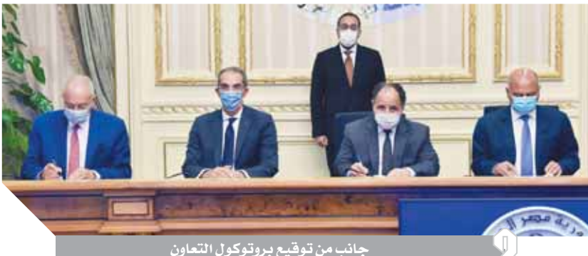
جانب من توقيع بروتوكول التعاون

ويأتي بروتوكول التعاون في إطار سعى الدولة الدائم لتقليل زمن الإفراج عن كل البضائع والسلع وفق المعايير العالمية، من خلال التزويد بأحدث تقنيات تكنولوجيا المعلومات، والميكنة الشاملة للجهات والشركات والتوكيلات الملاحية العاملة داخل الموانئ، بما يسهم في تحسين ترتيب مصر العالمي في سرعة إنجاز الإجراءات الجمركية وفق معايير منظمة الجمارك العالمية، ويدفع نحو تحسين مناخ العمل وتحفيز الاستثمار، ويساعد على النهوض بالاقتصاد القومي. وتضمن البروتوكول تطوير مركز البيانات المركزي لمينى مصلحة الجمارك بالإسكندرية، من خلال تطوير أجهزة شبكات المعلومات وأجهزة التأمين والخوادم، ووحدات التخزين وخص