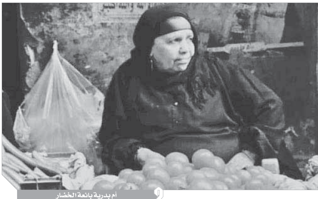
أم بدرية بائعة الخضار