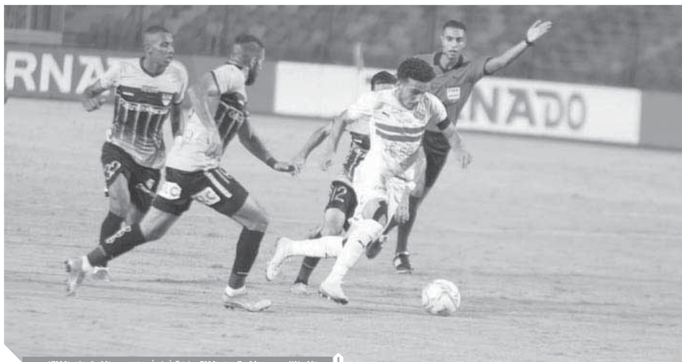
الزمالك يسعى لاستمرار الانتصارات أمام أسوان بعد الفوز على الاتحاد