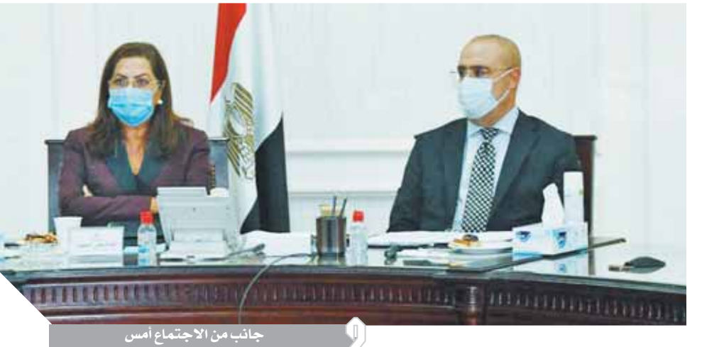
جانب من الاجتماع أمس

وافق مجلس إدارة صندوق الإسكان الاجتماعى ودعم التمويل العقارى، خلال اجتماعه، برئاسة الدكتور عاصم الجزار، وزير الإسكان والمرافق والمجمعات العمرانية، على طرح ١٢٥ ألف وحدة سكنية (١٠٠ ألف وحدة إسكان اجتماعى - ٢٥ ألف وحدة إسكان متوسط)، كمرحلة أولى ضمن مبادرة الرئيس عبدالفتاح السيسى لتوفير وحدة سكنية لكل مواطن. وقالت مى عبدالحاميد، الرئيس التنفيذي لصندوق الإسكان الاجتماعى ودعم التمويل العقارى: إن وحدات الإسكان الاجتماعى المقرر طرحها موزعة على عدد من المدن فى القاهرة الكبرى ومعظم المحافظات.