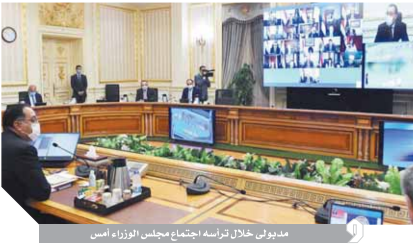
مدبولي خلال ترأسه اجتماع مجلس الوزراء أمس

واستعرضت الدكتورة هالة زايد وزيرة الصحة والسكان استعدادات الوزارة للموجة الثانية من جائحة «كورونا»، وأشارت إلى تدريب الأطمظ الطبية على بروتوكولات العلاج ومعايير مكافحة العدوى. ووافق مجلس الوزراء في اجتماع الحكومة الأسبوعي برئاسة الدكتور مصطفى مدبولي، على مشروع قانون بإنشاء البوابة المصرية للعمرة الذي يهدف إلى مواكبة التطور التكنولوجي والتقني في ميكنة الخدمات كأحد محاور برنامج الإصلاح