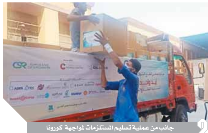
جانب من عملية تسليم المستلزمات لمواجهة كورونا