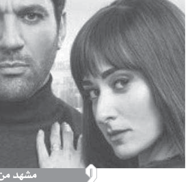
مشهد من فيلم «توأم روحي»

● المؤلف والمخرج يكملان بعضهما، المخرج لا يعمل إلا إذا كان مؤمناً بالورق حتى يستطيع التعبير عنه بعدسته وزواياه، وهذه الكيمياء موجودة مع المخرج عثمان أبو لبن.