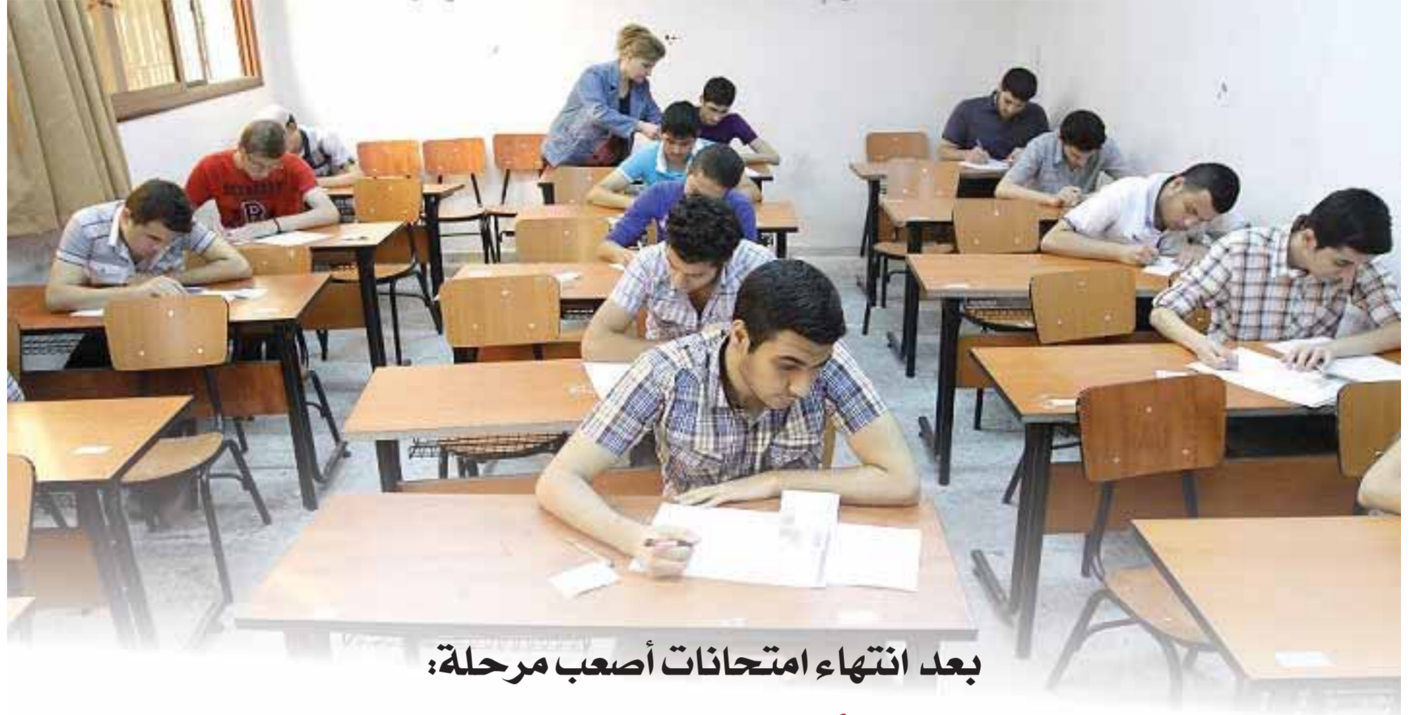
بعد انتهاء امتحانات أصعب مرحلة: