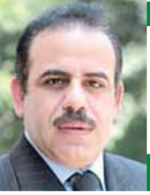
بقلم: عبد العزيز الححاس

باعتباره انتقاماً شخصياً، والمؤسف أيضاً أن هذا الإرهابى قد ورط الولايات المتحدة الأمريكية فى هذه الحرب بعد أن شاركت فى دعم إسرائيل بالأسلحة والذخائر وأيضاً تخصيص عشرات الميارات من الدولارات لإنقاذ الاقتصاد الإسرائيلى، إضافة إلى استخدام نفوذها السياسى والاقتصادى فى التأثير على المنظمات الدولية وتحديداً مجلس الأمن الذى من خلال استخدام حق النقض - الفيتو - ضد قرارات وقف هذه الحرب وفرض عقوبات على إسرائيل، ويبدو أن نيتيها هو، بصدد لعبة جديدة مع الولايات المتحدة وهى ربط وقف هذه الحرب، بالحصول على تعهدات بسلامة نيتيها هو من الملاحقة الدولية والمحاسبة الداخلية فى إسرائيل.