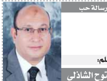
رسالة حب بقلم: فتوح الشاذلي

وطبقاً للنشرة السنوية لحوادث السيارات عام ٢٠٢٣، والصادرة عن الجهاز المركزي للتعبئة العامة والإحصاء فإن إصابات حوادث الطرق بلغت ٧١٠١٦ إصابة عام ٢٠٢٣ مقابل ٥٥٩٩١ عام ٢٠٢٢ بنسبة ارتفاع ٢٧٪، وكان أعلى عدد إصابات في محافظة الدقهلية والتي شهدت ١٤١٩٢ إصابة وأقل عدد إصابات في محافظة الإسماعيلية وشهدت ١٧٠ إصابة عام ٢٠٢٣.