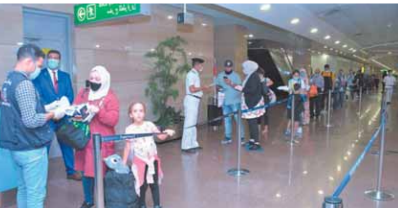
مصر للطيران تنظم رحلات العيد لمناطق الجذب السياحي