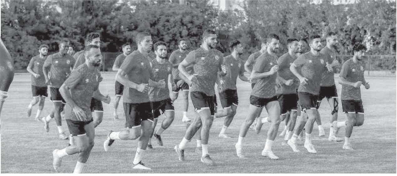
الأهلى يعود من المغرب وعينه على مواجهة البنك الأهلى

إيقاع النوم للتعلم على هذه المشكلة كما طالبهم بالحديث مباشرة مع الجهاز الطبى للمنتخب الأولى حال التعرض لآثار جانبية بسبب الساعة البيولوجية. وأصبح فى حكم المؤكد أن يشارك الحارس على لطفى أساسياً فى مباريات