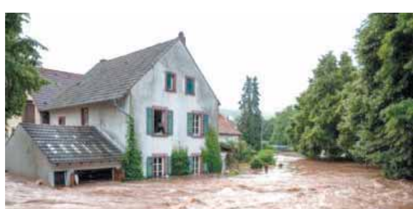
الفيضانات تضرب أوروبا

إنه من المتوقع أن تمتد موجة الأمطار الغزيرة والفيضانات من تيرول إلى ولايتي شتاير مارك والنمسا السفلى ومنها إلى العاصمة فيينا خلال الساعات المقبلة. وفى سياق متصل.. أرسلت النمسا مساعدات عاجلة إلى ألمانيا وبلجيكا بسبب الفيضانات التي تسببت في مقتل العشرات وانهار المبنى