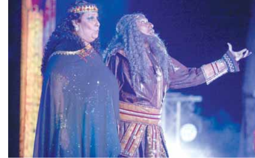
أوبرا عابدة خلال عرضها بإيطاليا

توج بهذه الهدية الرائعة للجمهور الإيطالي في ختام الموسم الثقافي لها الذي أقيم تحت عنوان «مصر إيطاليا حضارة وثقافة.. صداقة بلا حدود»، وأشارت إلى أن أوبرا عابدة تعكس هذا المعنى باعتبارها مستوحاة من الحضارة المصرية القديمة.