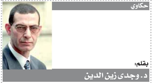
بقلم: د. وجدى زين الدين

كتبت - محمود عبد المنعم: حرصت محافظة القاهرة على الاستعداد لاستقبال العيد من خلال وضع العديد من الضوابط التي تضمن الحفاظ على البيئة وصحة المواطنين والتصدى للسليبات التي يقوم بعض المواطنين ببيع الأضاحي بالشارع ويتبركون الخلفات والدماء. شدد اللواء خالد عبدالعال محافظ القاهرة على ضرورة استمرار حملات التفتيش المكثفة بالتعاون مع مديريتي الشئون الصحية والتموين على اللحوم بمحلات الجزارة وأماكن عرض اللحوم المجمدة والتلاجات حفاظاً على الصحة العامة. جاء ذلك خلال تقديم مجرز البساتين الأولى لتابعة استعداد الجازر لاستقبال أضاحي المواطنين طوال أيام عيد الأضحى. وأطمأن المحافظ خلال جولته على اتخاذ الإجراءات الصحية أثناء الذبح والكشف على الذبائح وكيفية التعرف على اللحوم غير الصالحة، كما تحدث مع عدد من الجزارين عن أسعار اللحوم الحية وبعد الذبح مطالباً بتشديد الرقابة على الذبائح والكشف الجيد عليها