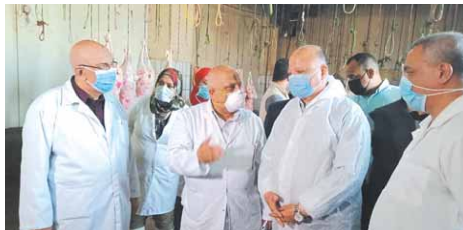
جانب من جولة محافظ القاهرة

وأكد المحافظ نجوى عانوس على أن جرجس شكرى والداخلية والشعري، لأن خطابه المعرفي تجلى من وعيه بالجسد المعرفي. كتاب الدكتور نجوى عانوس هو اكتشاف جديد ورائع للشاعر جرجس شكرى، ولكننا نعلم أن «جرجس» هو ناقد مسرحي بالدرجة الأولى، إلا أن نجوى عانوس اكتشفت بمزيد من التتبع أن جرجس شاعر بالدرجة الأولى قبل أن يكون ناقدًا... والحقيقة أن هناك الكثيرين من النقاد ميدعون، وقد تعامل الكثيرون مع جرجس على أنه ناقد في حين أن الرجل مبدع وشاعر، وترجمت أشعاره كما قلت من قبل إلى العديد من اللغات الأجنبية. لقد أشارت نجوى عانوس ثلاث قضايا مهمة في شعر جرجس شكرى، وهي المسرح والوعي والوجود، وهي كلها قضايا تشغل بال جرجس شكرى في أعماله الشعرية. لكن نجوى عانوس نجحت وبمهارة فائقة من خلال كتابها الذي تضمن ٦ فصول أن تعيد اكتشاف جرجس شكرى الشاعر المبدع قبل أي شيء.