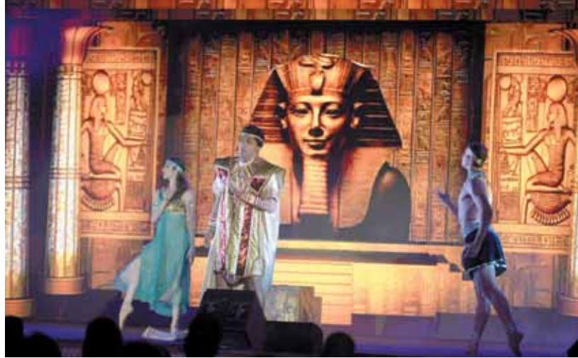
أوبرا عابدة خلال عرضها بإيطاليا

جذب الأنظار بأدائهم المتميز وملابسهم الفرعونية بما تحمله من دلالة على الحضارة المصرية وتمكنوا بقدراتهم الصوتية والحركية من سرد القصة بتمكن واقتدار وفي خلفياتهم صور مجسمة تعبر عن العمق التاريخي ومنها المعابد الفرعونية والأهرامات والتل مع توظيف إمكانات التكنولوجيا والمؤثرات الصوتية والصوتية والتي خدمت العرض بشكل مباشر ومؤثر وقد تم دمج ذلك في إطار رؤية فنية