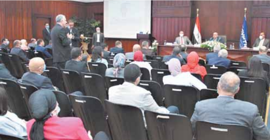
وزير الطيران خلال لقاءه ومديري المكاتب الخارجية الجدد

«منار»: الاختيار جاء وفقاً لمعايير وضوابط واجتياز اختبارات وتقييمات على مدى شهر