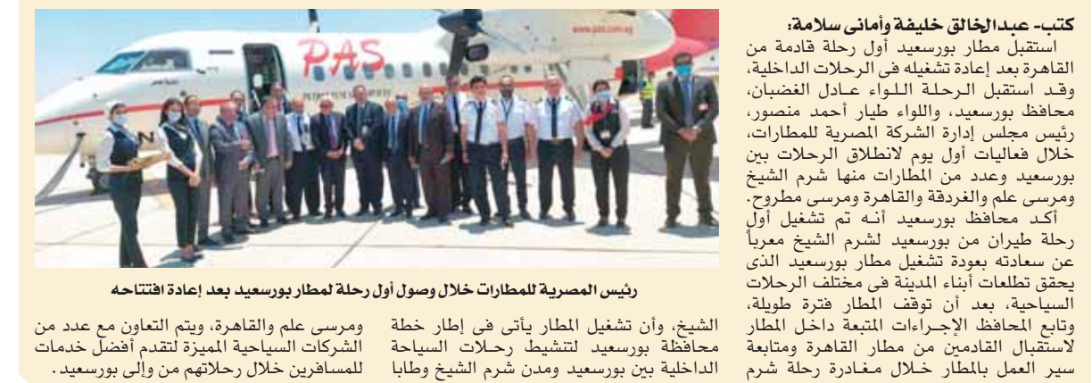
رئيس المصرية للمطارات خلال وصول أول رحلة لمطار بورسعيد بعد إعادة افتتاحه