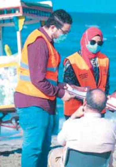
المتطوعون أثناء لقاءاتهم بالمصطافين

وقال عمرو عثمان مساعد وزير التضامن الاجتماعي مدير صندوق مكافحة وعلاج الإدمان والتعاطي إن المبادرة تستهدف أيضاً إلقاء الضوء على الخدمات التي يقدمها الخط الساخن لصندوق مكافحة وعلاج الإدمان ١٦٠٢٣، وكذلك دور الأسر في الاكتشاف المبكر للتعاطي، من خلال عدة عوامل، سواء كانت عوامل ظاهرية، مثل احمرار العين المستمر، وعدم الاتزان، وطفة الاستيعاب، وعدم اللامبالاة، وتغيير الأصدقاء، واختفاء مبلغ مالي من المنزل، أو الانفعال الشديد والغضب، أو الهدوء والانتواء، أو في حالة مشاهدة الأسرة بعض أدوات التعاطي في حجرة أبنائها، وكيفية تواصل الأسرة مع الخط الساخن ١٦٠٢٣ لعلاج الإدمان مجاناً وفي سرية تامة.