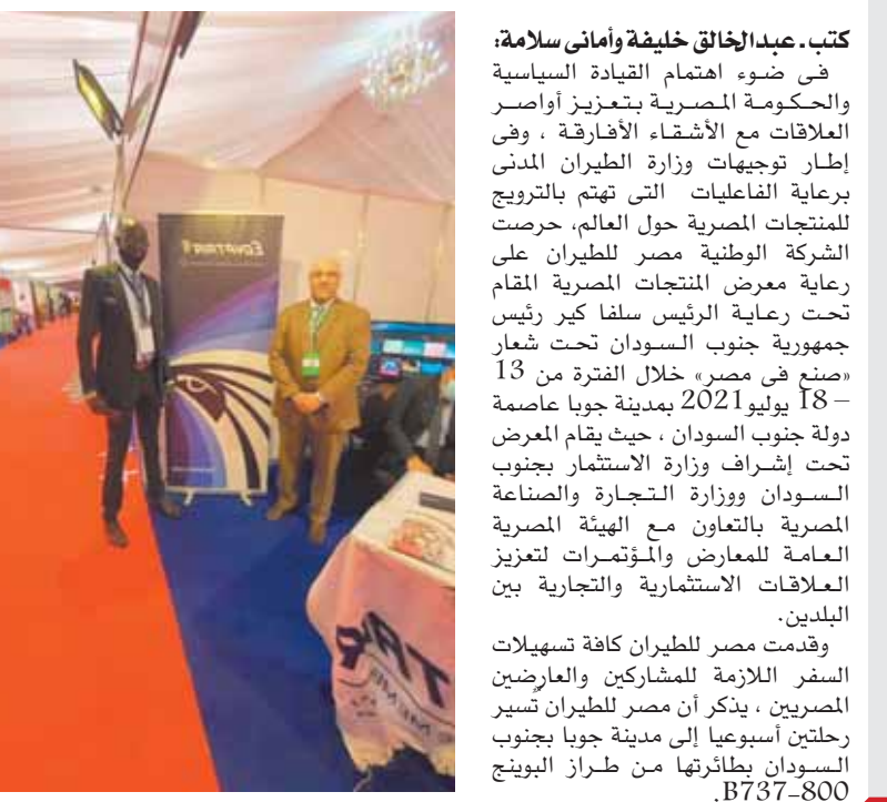
مصر للطيران خلال مشاركتها في معرض «صنع في مصر» بجوبا