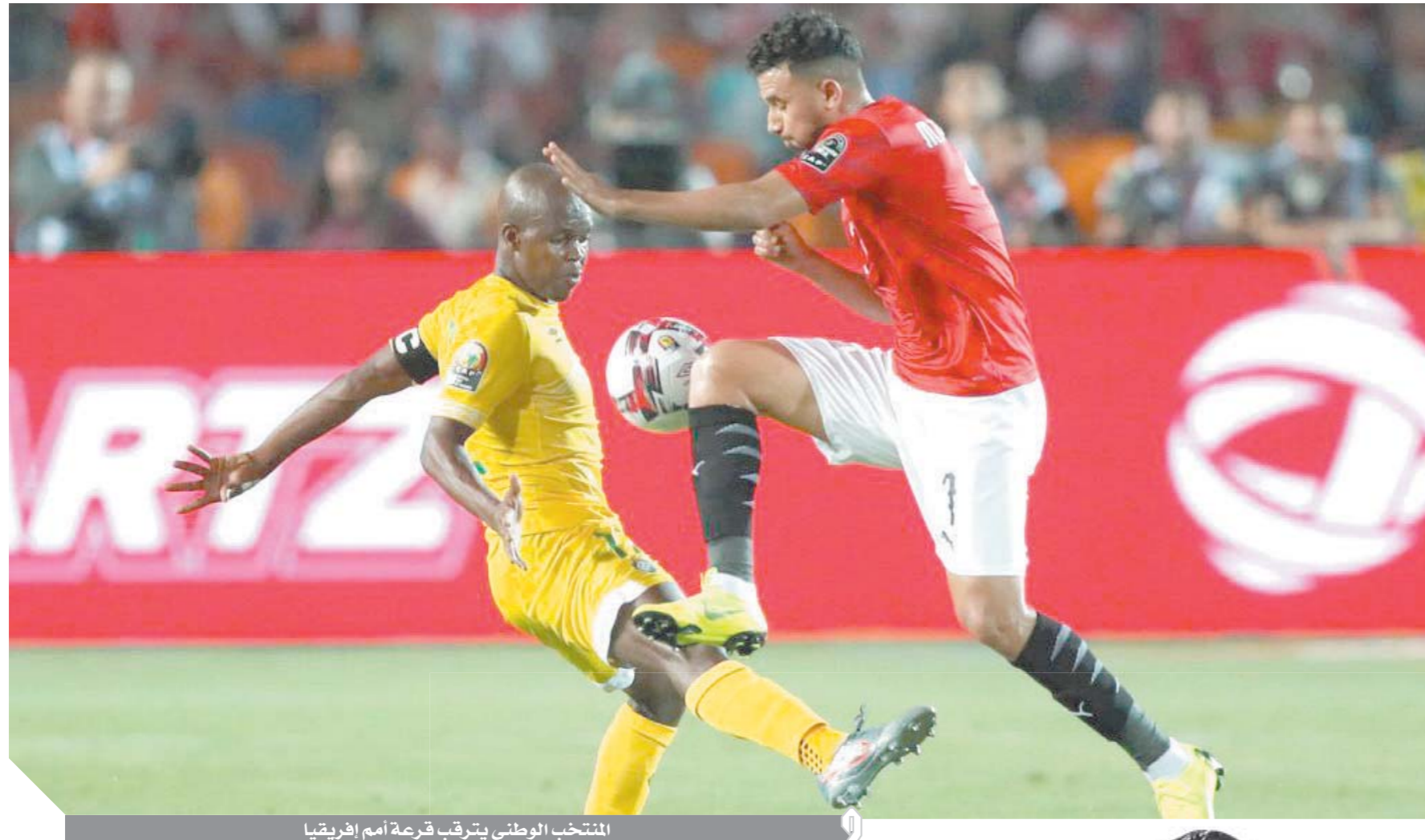
المنتخب الوطنى يتربق قرعة أمم إفريقيا