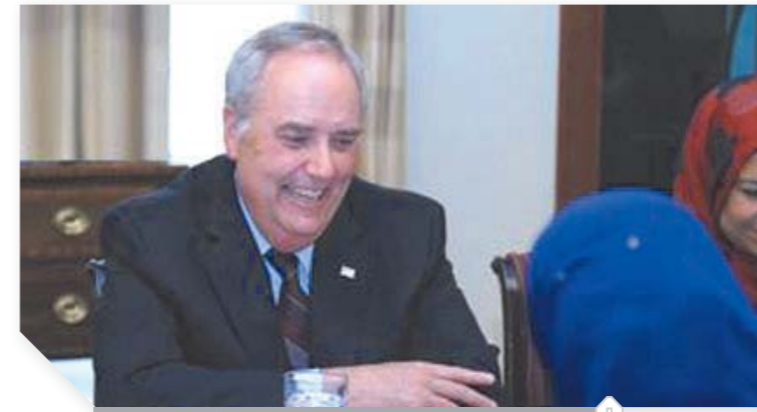
توماس جولدبرجر القائم بالأعمال الأمريكي

الولايات المتحدة تدرس وضع «الإخوان» على قائمة المنظمات الإرهابية مصر واعدة بالاستثمارات.. ونجاح الإصلاح الاقتصادي جذب الشركات الكبرى