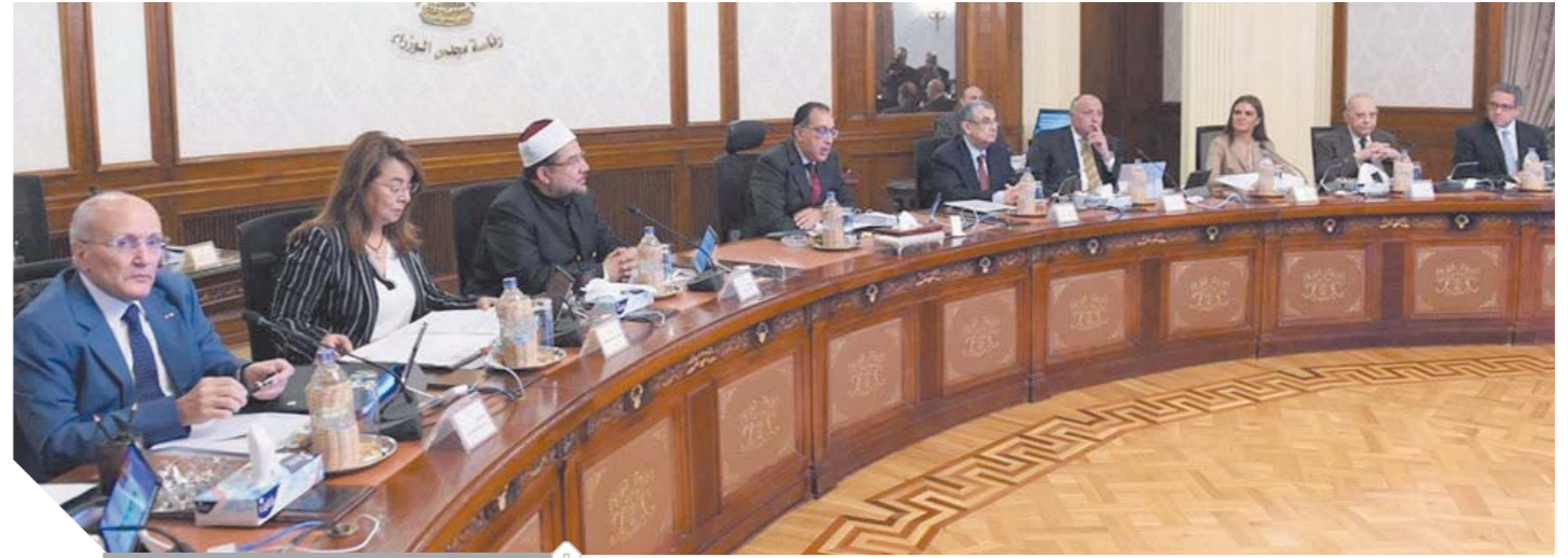
جانب من اجتماع مجلس الوزراء

ت: 01220124443 - 01203553559 Shoukrymikhealgroup.com