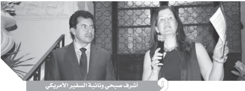
أشرف صبحى ونائبة السفير الأمريكى

بتمكين المرأة من الناحية السياسية والاقتصادية والاجتماعية وتعزيز الأدوار القيادية لها. وأكدت نائبة السفير الأمريكى أن هذا البرنامج يهدف إلى إعداد الفتاة وصقل مهاراتها لتكون قيادية فى المستقبل، ومساعدتها لمعرفة حقوقها، واكتشاف مهاراتها، وتدريبها على كيفية الدفاع