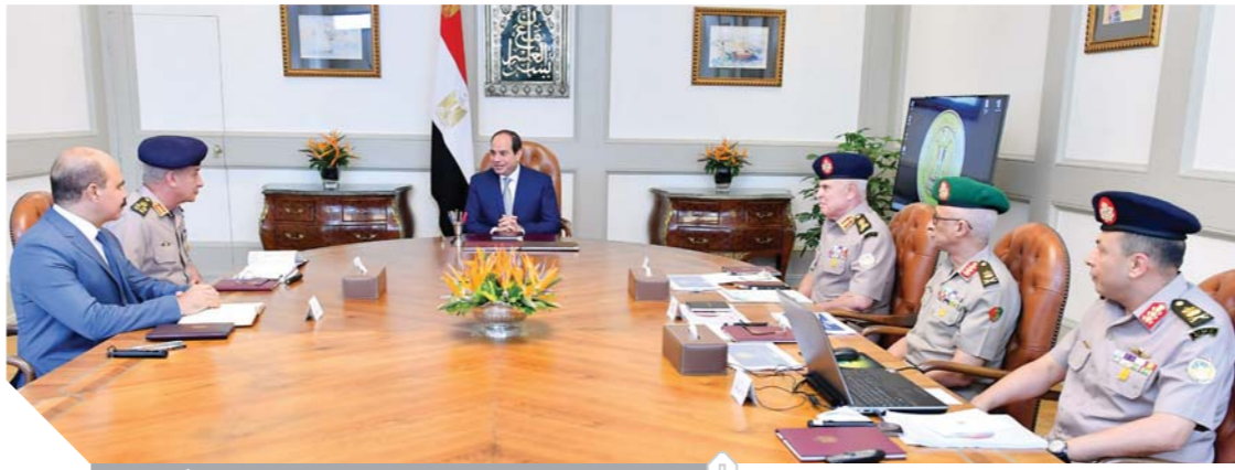
السيسي، خلال اجتماعه مع وزير الدفاع ورئيس الأركان

القواتية لمختلف جيوش الدول، والتدريب في مختلف مسارح العمليات، ودعم علاقات التعاون العسكري وجهود الأمن والاستقرار بالمنطقة. وقد أشار «السيسي» إلى ضرورة مواكبة أحدث النظم العالمية في التسليح والتدريب لتتماشى مع التطورات المتلاحقة التي تتميز بها جيوش الدول المتقدمة، معرباً عن متابعته المستمرة واهتمامه ببرامج الإعداد لطلبة الكليات والمعاهد العسكرية التي تساهم في دعم القوات المسلحة بخبرة من شباب الوطن ليتواصل مع طاقم رجال القوات المسلحة جيلاً بعد جيل، ومؤكداً أن مصر تسابق الزمن من أجل بناء دولة عصرية حديثة تلبس طموحات الشعب المصري العظيم الذي تحمل الكثير من أجل بناء الوطن. وجه الرئيس في نهاية الاجتماع التحية لشهداء الوطن الأبرار الذين ضحوا بأرواحهم وماتهم دفاعاً عن أمن مصر واستقرارها، مؤكداً أن الدولة المصرية تولي اهتماماً كبيراً برعاية أسر الشهداء وتوفير كافة سبل الاهتمام.