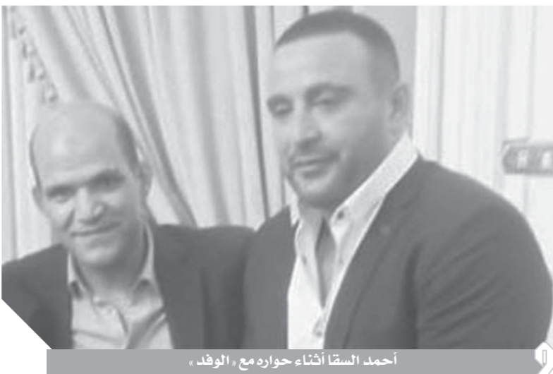
أحمد السقا أثناء حوار مع «الوفد»

بصمة في كل المجالات الاجتماعية ومنها دعمه للفن الراقى وسعدت للغاية بتكريمي من حزب الوفد ورئيسه المستشار بهاء أبو شقة وهذا تقدير للنجاح الذي استثمرت ولمسه الجمهور ولمسته قيادات حزب الوفد، وكان وسيلته له طعم خاص أن وقفت على منصة التكريم في بيت الأمة مع زملائي من أصحاب المسلسلات الناجحة في دراما رمضان.