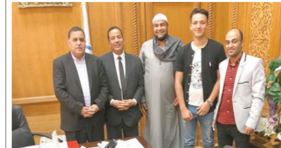
وفد البريجات مع المهندس أشرف رسلان رئيس الهيئة القومية لسكك حديد مصر

في استجابة إيجابية لمطالب قرية البريجات بمحافظة البحيرة ومبادرة حلوة يا بلدي وتنفيذا لتوجيهات اللواء كامل الوزير وزير النقل وفق المهندس أشرف رسلان رئيس الهيئة القومية لسكك حديد مصر على مطالب أهالي القرية والتي تضمنت تطوير محطة السكك الحديدية بالقرية والتي تم إنشاؤها عام ١٩٥١ ولم تحظ بالتطوير والتطوير اللازم على مدى الأعوام الطويلة منذ إنشائها. وكذلك وافق المهندس أشرف رسلان على توفيق قطار اكسبريس السريع حال مروره بالقرية حيث كان من المقرر توقفه في محطة كفر الدوار فقط مما كان يستوجب على الركاب استخدام أكثر من وسيلة مواصلات ومن الجدير بالذكر أن المهندس أشرف رسلان منذ توليه رئاسة السكك الحديدية يعطى اهتماماً كبيراً للعمل على راحة المواطنين والنهوض بالمرفق من خلال العمل