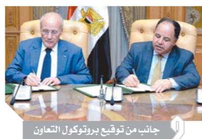
كتب: محمد صلاح وأبو زيد كمال وسامية فاروق؛

أكد الدكتور محمد معيط، وزير المالية، أن وزارة المالية سوف تستفيد من خبرات وزارة الإنتاج الحربي في ميكنة الضرائب العقارية، وقال إن المشروع يستهدف ميكنة البيانات والسجلات والقرارات بعاموديات ومناطق الضرائب العقارية بالمحافظات، ويستهدف تحسين بيئة العمل وتسريع وتيرة الأداء وتيسير الحصول على الخدمة وربط المأموريات آلياً بشبكة داخلية. جاء ذلك على هامش توقيع الدكتور محمد سعيد العصار، وزير الدولة للإنتاج الحربي، والدكتور محمد معيط، وزير المالية، بروتوكول تعاون بين الوزارتين لتنفيذ مشروع ميكنة الضرائب العقارية. ويهدف البروتوكول إلى قيام وزارة الإنتاج الحربي بإنشاء قاعدة بيانات إلكترونية دقيقة بما يضمن تطوير منظومة العمل وجودة الأداء، والارتقاء بمستوى الخدمة، في مختلف المأموريات والمناطق بالمحافظات، وتيسير سداد قيمة الضريبة المقررة وفقاً للقانون. وتقوم وزارة الإنتاج الحربي، بموجب البروتوكول، بإعداد وتوفير البرامج اللازمة لميكنة بيانات المقررات، لما تمتلكه من قاعدة بيانات مؤمنة بمرکز نظم المعلومات والحوسب التابع للوزارة، وتوفير