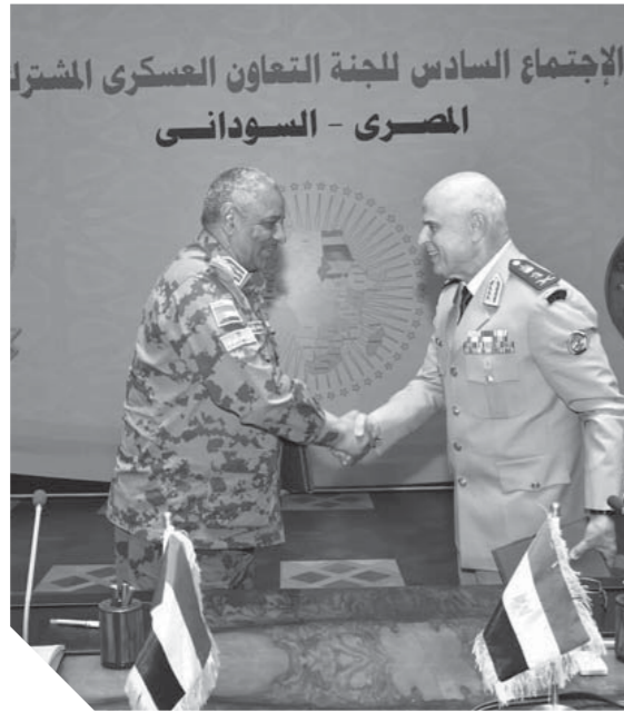
الاجتماع السادس للجنة التعاون العسكرى المشترك المصرى - السودانى