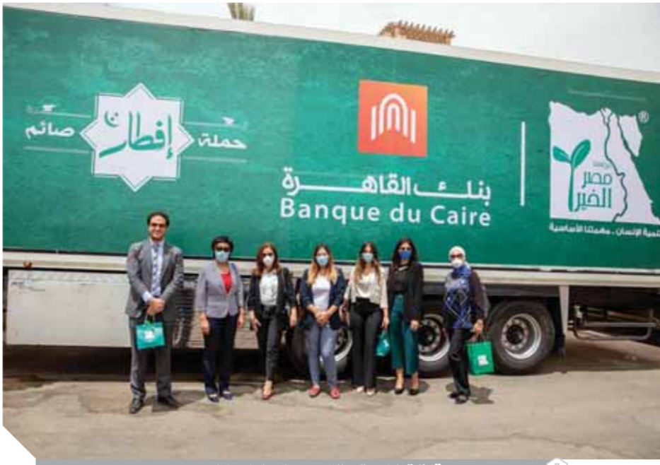
قافلة الخير تنطلق من بنك القاهرة لصعيد مصر