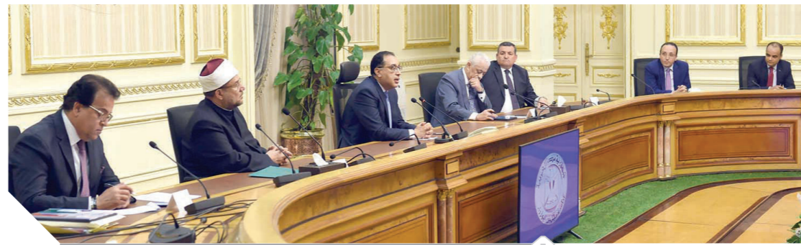
جانب من المؤتمر الصحفى لرئيس الوزراء وعدد من الوزراء المعنيين بأزمة كورونا