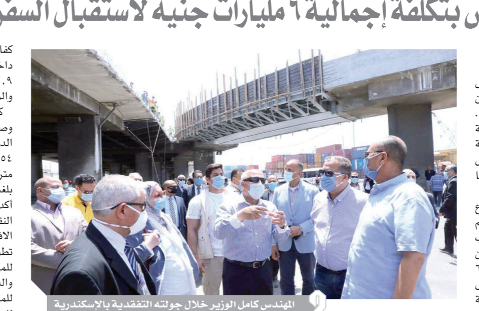
المهندس كامل الوزير خلال جولته التفقدية بالإسكندرية

كفاءة كوبرى الطريق الشريان في منطقة ٢٧ داخل الميناء، حيث يتم رفع كفاءته بتكلفة قدرها ١٤,٩ مليون جنيه، وبلغت نسبة تنفيذه ٥٠٪ والمخطط الانتهاء منه في ٦/٢٠٢٠. كما تقعد المهندس كامل الوزير مشروع إنشاء وصلة حرة تربط ميناء الإسكندرية بالطريق الدولي الساحلي السريع بمنطقة باب ٥٤ (كوبرى ٥٤)، والذي يبلغ طوله ٢,٣٠ كم وعرضه ١٧,٦ متر وتكلفته الإجمالية ٩٠٥ مليون جنيه، حيث بلغت نسبة تنفيذه ٧٩٪، وعلى هامش جولته أكد وزير النقل الاهتمام الكبير الذي توليه وزارة النقل تعظيم الاستفادة من النقل البحري لدعم الاقتصاد القومي، لافتاً إلى أن الوزارة تعمل على تطوير كل الموانئ البحرية وفقاً للمخطط الشامل للموانئ المصرية البحرية الذي يتم إعداده حالياً، والذي يركز على الاستفادة من الموقع الجغرافي للموانئ المصرية، وتعظيم الميزة التنافسية للموانئ المصرية لخدمة التجارة الدولية، وزيادة حصتها من تجارة الترانزيت والاستفادة القصوى من التسهيلات المتاحة بالموانئ، كما أوضح الوزير أن كل الموانئ البحرية المصرية تعمل على مدار ٢٤ ساعة، وأنه تابع اليوم انضمام أعمال الشحن والتفريغ وحركة السفن والبضائع بميناء الإسكندرية، وأنه يتلقى تقارير دورية على مدار الساعة بحركة التداول في كل الموانئ، مشيراً إلى استمرار تزايد الطلب على الصادرات المصرية.