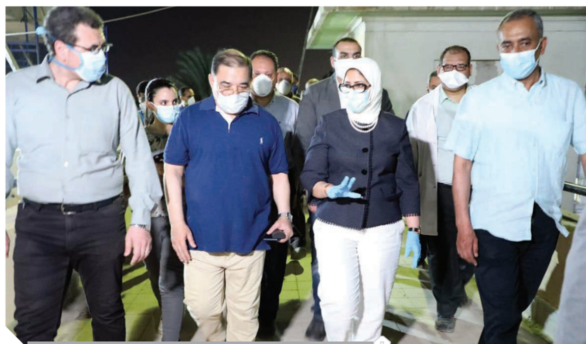
هالة زايد وزيرة الصحة أثناء تفقدها أعمال تطوير مستشفى حميات العباسية

٤,٩ إلى ٥,٠٪، في حين أن توقعات المؤسسات المالية العالمية تراجع الاقتصاد العالمي بنحو ٧٪ بسبب كورونا، مشيرة إلى أهمية تكاتف كل فئات المجتمع من حكومة ومؤسسات مجتمع مدني في ظل الظروف الاستثنائية غير المسبوقة التي يمر بها العالم أجمع. جاء ذلك في الاجتماع الأول للهيئة الاستشارية لمؤسسة كيميت بطرس غالي للسلام والمعرفة بعد تشكيلها، وفيما يتعلق بموقف الاقتصاد المصري من الأزمة أوضحت السيدة أن مصر لديها شيطان إيجابيان في هذه الفترة، أولهما نجاح برنامج الإصلاح الاقتصادي الذي بدأت مصر في تنفيذه عام ٢٠١٦، وما تم تنفيذه من إصلاحات هيكلية، وهو ما أعطى مصر قدرة على المناورة بما انعكس على المؤشرات الاقتصادية على مستوى كل القطاعات قبل ظهور أزمة فيروس كورونا، حيث بلغ معدل النمو الاقتصادي ٥,٦٪ وانخفض معدل البطالة إلى أقل من ٨٪، وانخفض متوسط معدل التضخم إلى حوالي ٥٪، وهذا ما ساعدنا في التصدي