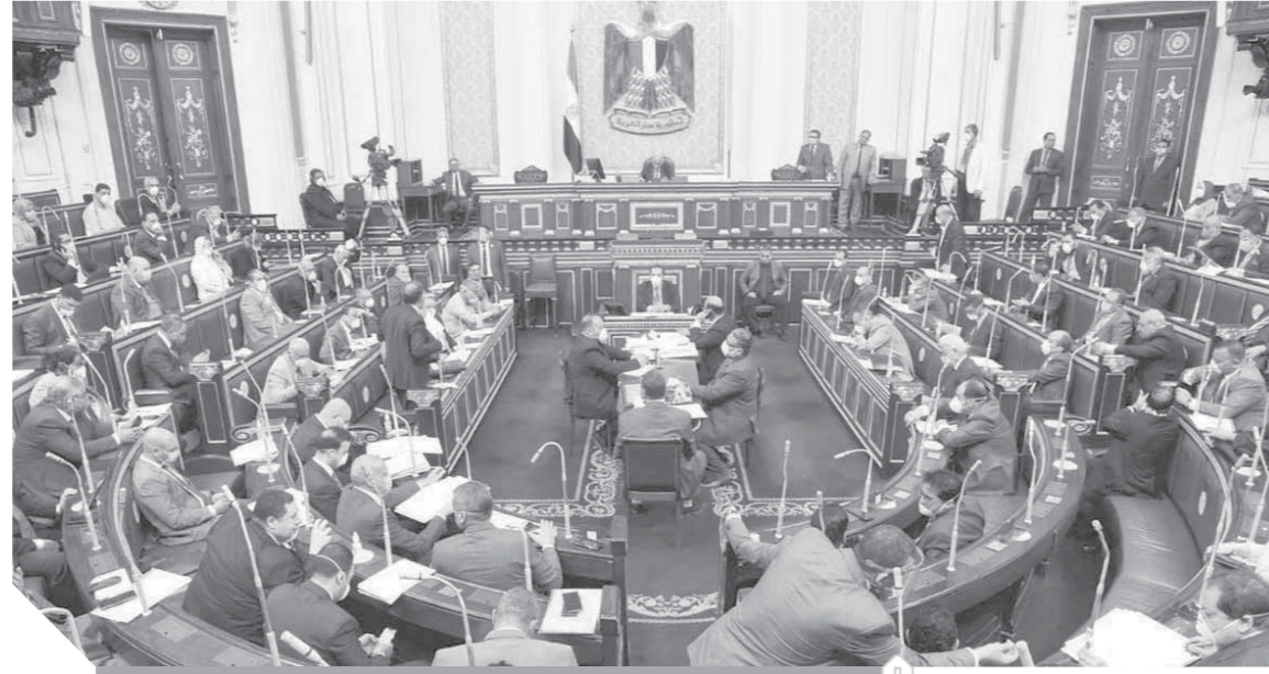
مجلس النواب يجتمع وسط إجراءات احترازية في مواجهة كورونا