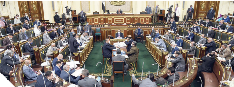
جانب من اجتماع مجلس النواب أمس

إحالة ٦٢ تقريراً عن مشاكل المواطنين مع شبكات الاتصالات إلى الحكومة