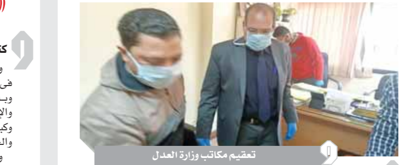
تحقيق مكاتب وزارة العدل

كتبت- ايمان إبراهيم، أصدر وزير العدل، المستشار عمر مروان، قراراً بإنهاء نذب المستشار رئيس محكمة شبين الكوم الابتدائية لمخالفته تعليمات الوزارة الخاصة بمكافحة فيروس كورونا، وأصدرت الوزارة بياناً جاء فيه أنه في إطار المتابعة المستمرة من الوزارة بشأن تنفيذ تعليمات المستشار وزير العدل باتباع الإجراءات الوقائية للحد من انتشار فيروس كورونا بجميع المحاكم والمصالح التابعة للوزارة، تبين من المتابعة عدم تنفيذ هذه الإجراءات داخل نطاق محكمة شبين الكوم الابتدائية، فصدر قرار الوزير السابق وشدد على الالتزام الصارم بهذه الإجراءات داخل المحكمة والمأموريات التابعة لها، وفي نفس السياق تم أمس تعميم ميثي ديوان وزارة العدل بالكامل والانتباه منه، كما تم التوجيه باتخاذ الإجراءات الوقائية داخل المصالح التابعة للوزارة، ووجه وزير العدل بتوفير التكاليف المالية اللازمة لذلك، وتثوية وزارة العدل بأن الالتزام باتخاذ الإجراءات الصحية والوقائية المتعارف عليها في هذا الشأن هو أمر حيوي وعلى الجميع الالتزام بتنفيذ التعليمات حرفياً.