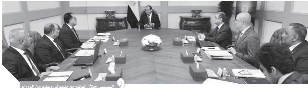
السيسي خلال لقائه مع مديولى وعدد من الوزراء