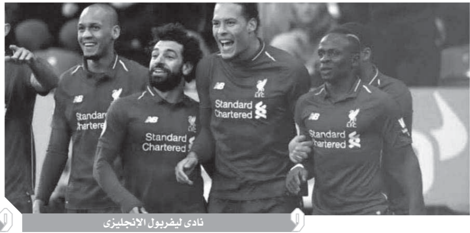
نادي ليفربول الإنجليزي