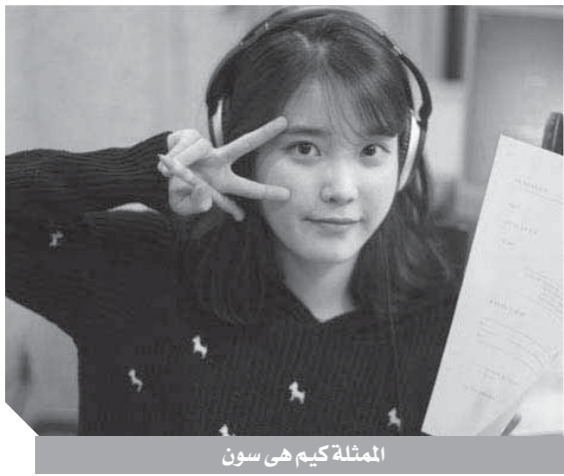
الممثلة كيم هي سون