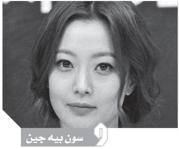
سون يينه جين