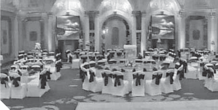
مرة أخرى، مضمياً أنه تم تطهير القاعة ضد فيروس كورونا بعد إخطار الإدارة بقرار مجلس الوزراء بمنع الأفراح في