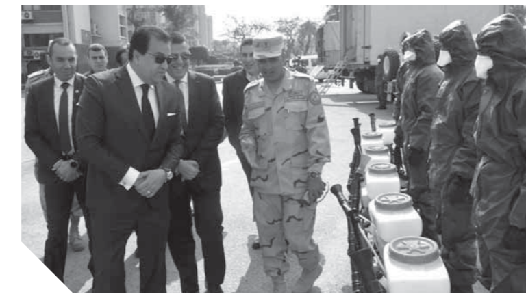
القوات المسلحة تساند الدولة في تنفيذ كافة الإجراءات الوقائية لمواجهة كورونا.

تعمال كل هيئات الوزارة مع تداعيات الأزمة الأخيرة، موضحاً أن خسائر الوزارة بلغت نحو ١٠٦ مليون جنيه معظمها في الطرق والمحاور القديمة، إلى جانب بعض التلفيات والخسائر في قطاعات السكك الحديدية والجوانب والنقل البحري. كما استعرض وزير التنمية المحلية الأضرار التي لحقت بعدد من القرى في مختلف محافظات الجمهورية، موضحاً الجهود التي اضطلع بها قطاع الحكم المحلي في هذا الصدد والدفع بالآلاف الممدات والعمالين على مدار الساعة على كل أنحاء المحافظات للمساعدة على اجتهاد الحكم المحلي والقوات المسلحة لإغاثة المواطنين، خاصة في الأماكن الأكثر تضرراً.