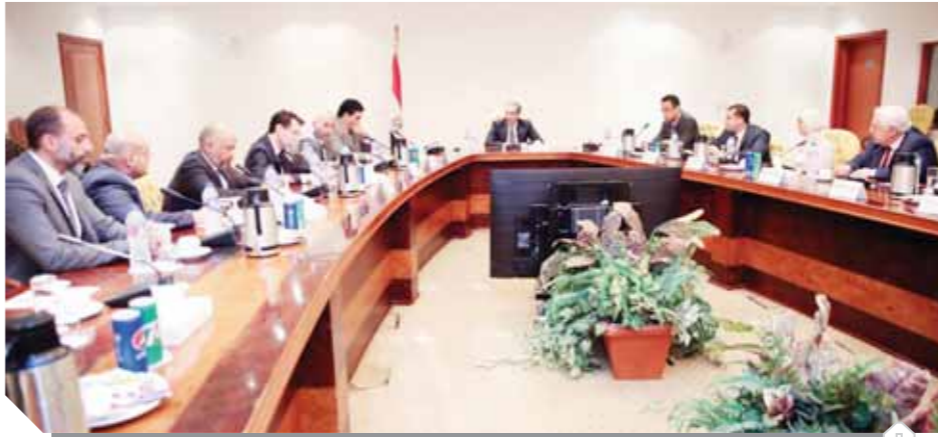
الوزير أثناء لقائه رؤساء شركات الاتصالات الأربع

فودافون مصر، والمهندس حازم متولى، الرئيس التنفيذي لشركة اتصالات مصر. وخلال اللقاء أكد الدكتور عمرو طلعت أنه يتم التنسيق مع وزارتي التربية والتعليم الفني، والتعليم العالي من أجل دعم «سبل التعليم» عن بعد، حرصاً على مصلحة الطلاب في مختلف المراحل التعليمية، مشدداً على أهمية تضافر الجهود بين الجهاز القومي لتنظيم الاتصالات وشركات الاتصالات والتواصل الدائم من أجل تقديم الدعم اللازم لاستمرار العملية التعليمية للطلاب في كل أنحاء الجمهورية.